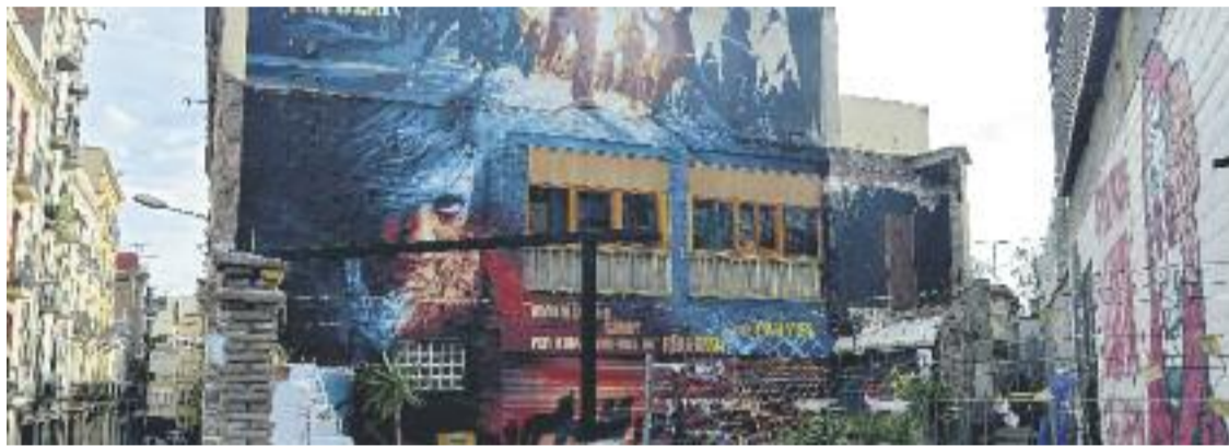
Cada vegada sembla més clar que Can Vies no s'enderrocarà.

» El consistori defensa que "hi ha una nova realitat" i vol fer una escala i una rampa per darrere l'edifici per connectar el calaix de Sants