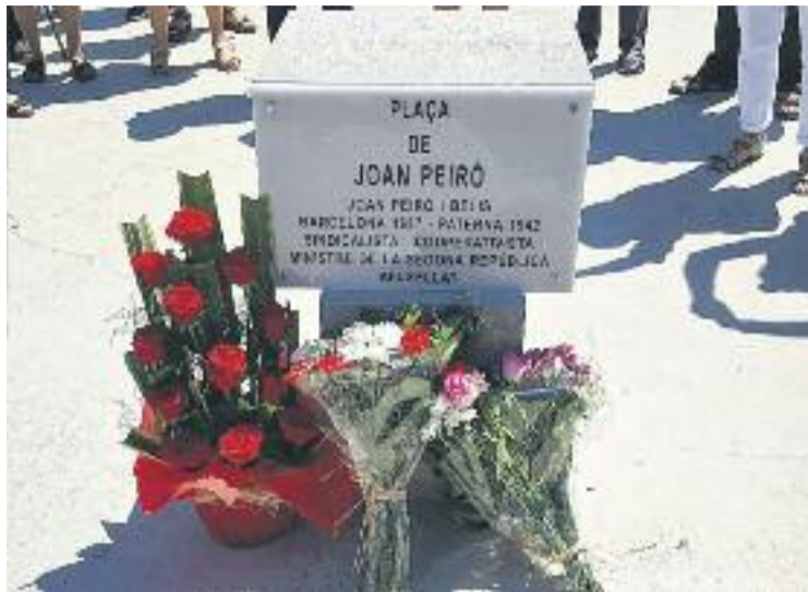
Una imatge de la placa d'homenatge.