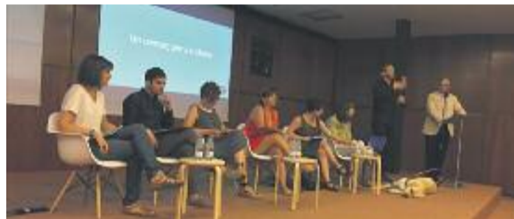
Una imatge de la presentació de la guia.

PROJECTE ▶ A Barcelona, vuit de cada 10 botigues no presenten impediments físics d'accés des del carrer. A més, nou de cada 10 tenen una porta d'entrada amb una amplada superior a 70 centímetres. Són dades esperançadores pel que fa a l'eliminació de les barreres arquitectòniques dels comerços barcelonins per tal de millorar l'accés a les persones amb discapacitat. Tanmateix, encara queda feina a fer.