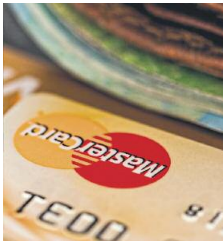
Les principals associacions de comerciants auguren un augment de vendes del 2-3%.