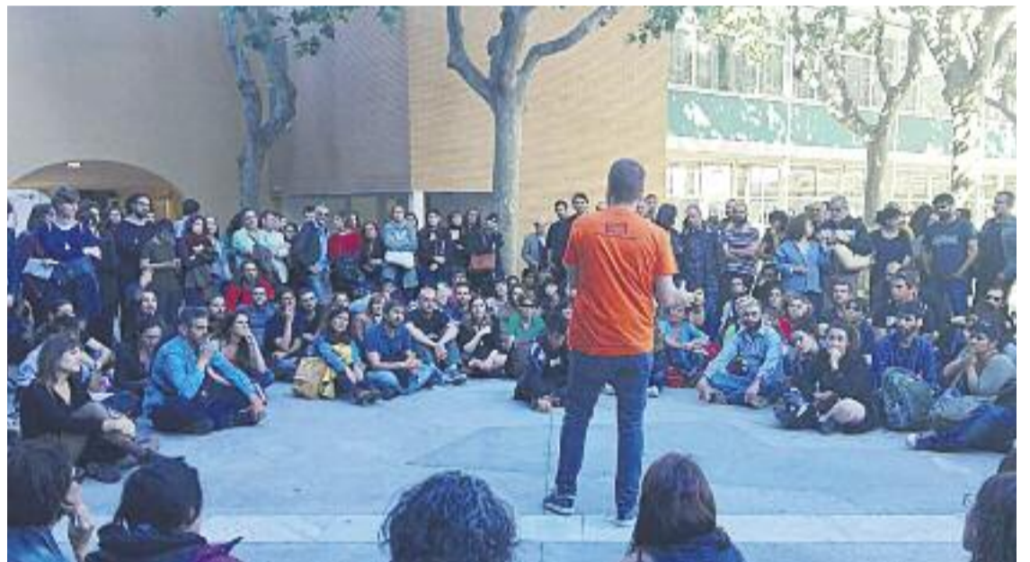
El Casinet d'Hostafrancs es va omplir per la presentació del sindicat i un centenar de persones van haver de seguir l'acte des del carrer.