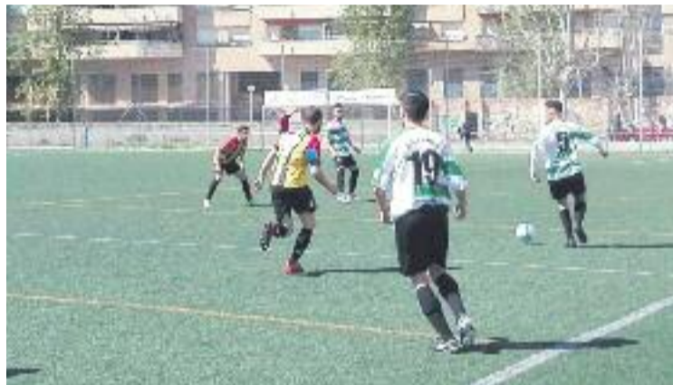
L'equip se la jugarà a casa aquest diumenge.

Les combinacions per al Sants són d'allò més senzilles: si el Sants guanya o empata té assegurada la segona posició, mentre que qualsevol victòria combinada amb una derrota o un empat de l'Horta faria que la primera posició canviés de propietari i que els de Tito Lossio acabessin aixecant la lliga i guanyant-se l'ascens a Tercera.