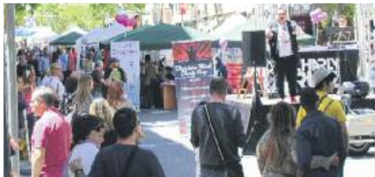
La mostra va aplegar milers de visitants.

FIRA ▶ L'Associació de Comerciants Creu Coberta va celebrar el passat dissabte 6 de maig la seva dotzena Mostra del Comerç, la qual va tenir com a fil conductor la dansa.