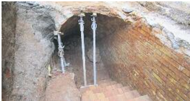
Una imatge de l'entrada del refugi antiaeri.

El passat 15 de maig tècnics del Servei d'Arqueologia i la Uni-