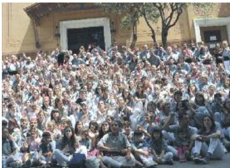
Els Borinots, en una imatge de família durant la celebració.

L'endemà la celebració va continuar ben d'hora. Sants es va despertar amb el so de les gralles i els timbals, mentre els Xiquets de Tarragona i els Capgrossos de Mataró arribaven a la plaça. Els Borinots, molt motivats a causa