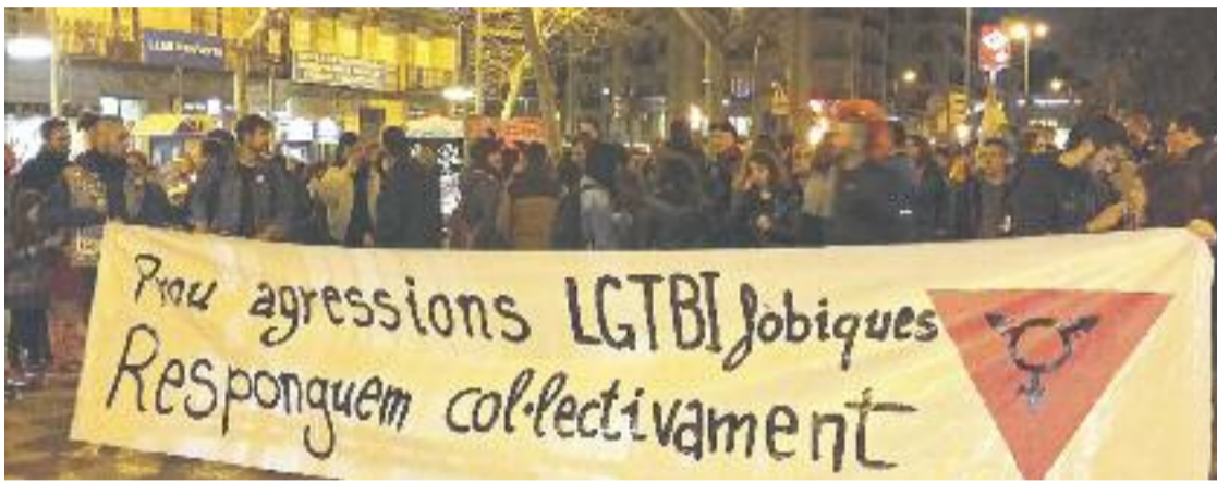
Una imatge de la manifestació de divendres passat.

» 300 persones denuncien que aquests atacs "són una constant" » Un jove va ser agredit a Montjuïc al crit de "maricons de merda"