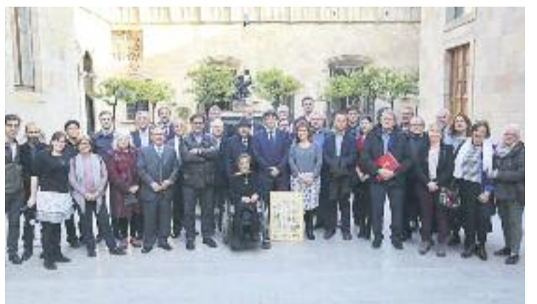
Foto de família de la delegació del Secretariat amb Puigdemont.

RECONeixEMENT ▶ El president de la Generalitat, Carles Puigdemont, va rebre el passat 14 de març una delegació formada per una trentena de persones de les més de 300 entitats que formen part del Secretariat d'Entitats de Sants, Hostafrancs i la Bordeta amb motiu del 40è aniversari d'aquesta federació d'entitats.