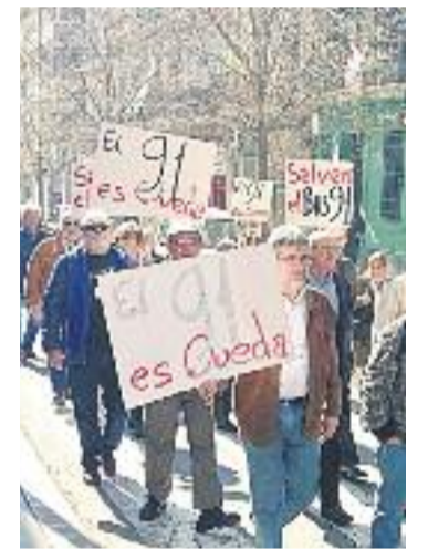
Una imatge de la marxa.

De fet, no és la primera vegada que els veïns de la Bordeta es mobilitzen per salvar aquesta línia d'autobús, coneguda popularment com 'la Monyos'. L'any 1993 l'Ajuntament ja va voler suprimir la línia però els veïns ho van evitar. De fet, aquella mobilització va ser la que va provocar el naixement de la Comissió de Veïns del Barri.