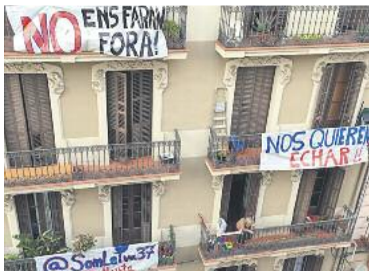
A la façana del bloc s'hi veuen diferents pancartes.

Des de fa un mes l'empresa propietària de l'edifici ha col·locat vigilància privada a l'entrada del