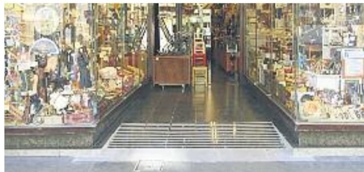
Algunes botigues han instal·lat rampes d'accés.

MOBILITAT ▶ El projecte Sants Sense Barreres, que preveu fer més accessibles els comerços de Creu Coberta, ha superat la fase de diagnosi i està actualment centrat a atorgar subvencions a les botigues perquè facin reformes que permetin l'accés a persones amb discapacitat.