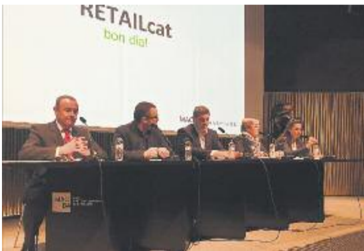
Presentació de la nova entitat de comerciants.