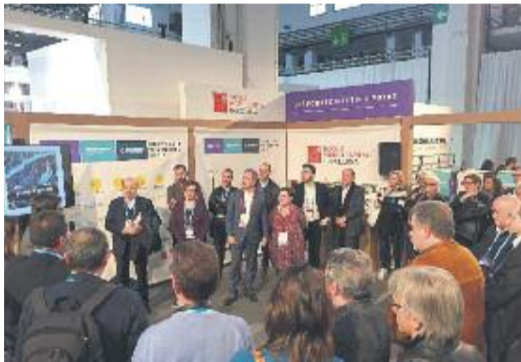
Els botiguers durant la visita.

Entre algunes de les aplicacions que es van presentar, destaca les que ajuden a seleccionar aliments i entregar-los a domicili o una altra que permet con-