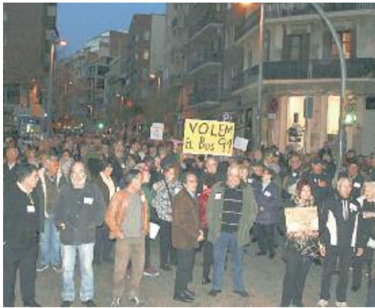
Una imatge de la protesta de dilluns.

De fet, no és la primera vegada que els veïns de la Bordeta es mobilitzen per salvar aquesta línia d'autobús, coneguda popularment com 'la Monyos'. L'any 1993 l'Ajuntament ja va voler suprimir la línia però els veïns de la Bordeta ho van evitar. De fet, aquella mobilització va ser la que va provocar el naixement de la Comissió de Veïns del Barri. El nom de 'la Monyos' prové de l'històric personatge de la Rambla de principis del segle xx, una dona que, amb el seu característic