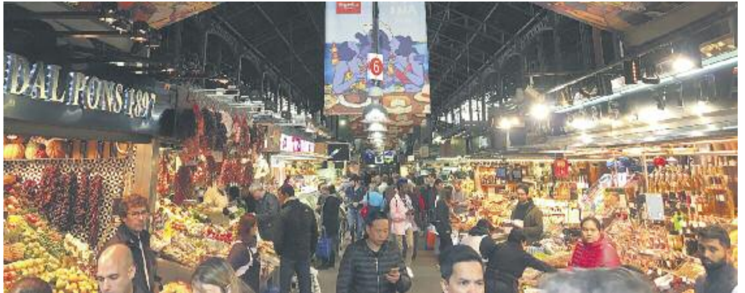
La Boqueria és un dels punts de la ciutat més visitats pels turistes.