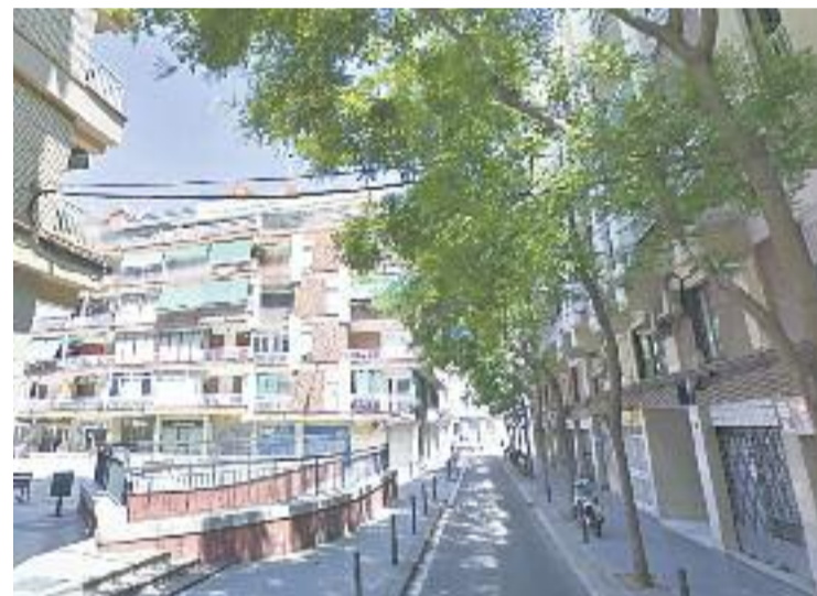
El local és al carrer de Súrria.

Fins que s'acabin les obres tots els integrants del Centre Cultural Islàmic continuaran resant a la nau de Can Batlló que l'Ajuntament els va cedir el passat mes de juny amb motiu del ramadà.