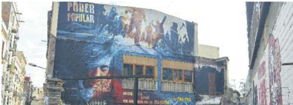
Can Vies, en una imatge recent.

» L'entitat, que defensa salvar Can Vies, diu que la seva proposta és "un pas endavant", però una part del barri vol que s'enderroqui l'edifici