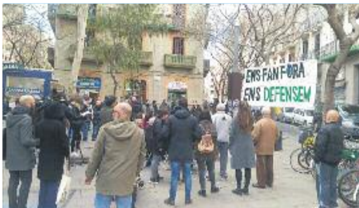
Una imatge de la concentració de dissabte.

PROTESTA ▶ Gairebé un centenar de veïns del Poble-sec, agrupats al voltant de diferents entitats com ara el Sindicat de Barri, Som Paral·lel o Laboratori Reversible, van sortir al carrer dissabte passat per denunciar l'augment dels preus de lloguer, que consideren que els "expulsa" del barri.