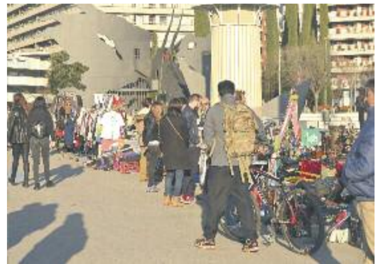
El mercat es va celebrar al costat de l'Espanya Industrial.

Cada últim diumenge de mes el Mercat Viu de Sants tornarà a celebrar-se al mateix indret, si no hi ha cap canvi.