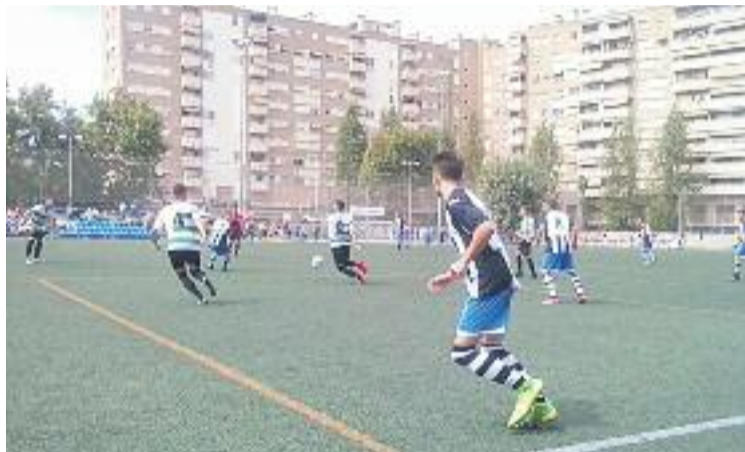
L'equip es manté amb opcions de lluitar per pujar a Tercera.