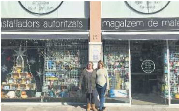
L'aparador de Nadal guanyador.

CERTAMEN ▶ El magatzem de materials de construcció i subministraments industrials Bayot Collado, ubicat al carrer Mare de Déu del Port, ha rebut un premi pel seu aparador de Nadal, en el marc del concurs que va posar en marxa l'Ajuntament per segon any consecutiu i en el qual hi han participat fins a 60 botigues d'arreu de la ciutat.