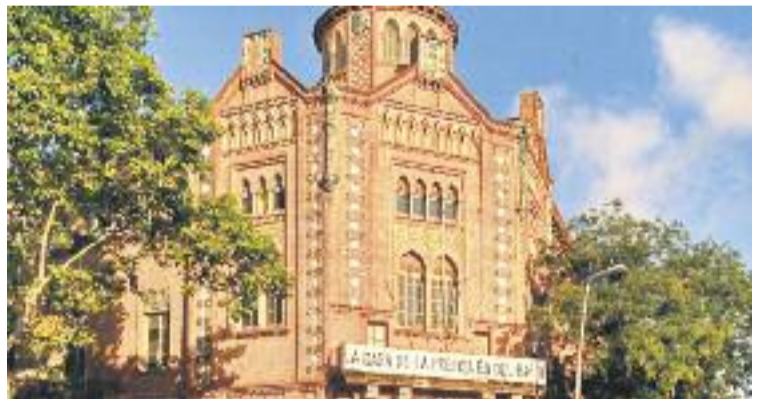
Una imatge del Palau de la Premsa.

EL POBLE-SEC ▶ El Districte i la Comissió per a la Recuperació del Palau de la Premsa han firmat recentment un conveni de cessió d'ús per tal que l'entitat pugui utilitzar 200 metres quadrats de la planta baixa d'aquest edifici històric.