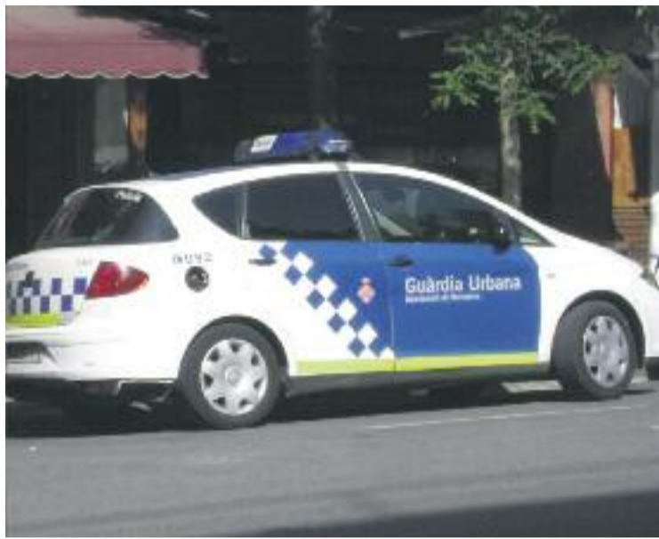
La Guàrdia Urbana va detenir els sospitosos de matinada.

Segons el relat que posteriorment va fer l'home, quan els llogaters van deixar de pagar van acordar que ells s'encarregarien de comprar el menjar i del manteniment de les habitacions. Tot i el pacte, els llogaters l'haurien tancat a la seva habitació, d'on no l'haurien deixat sortir. La parella també s'hauria apoderat de la documentació de l'home, de les seves llibretes bancàries i de les claus del pis. El propietari també va