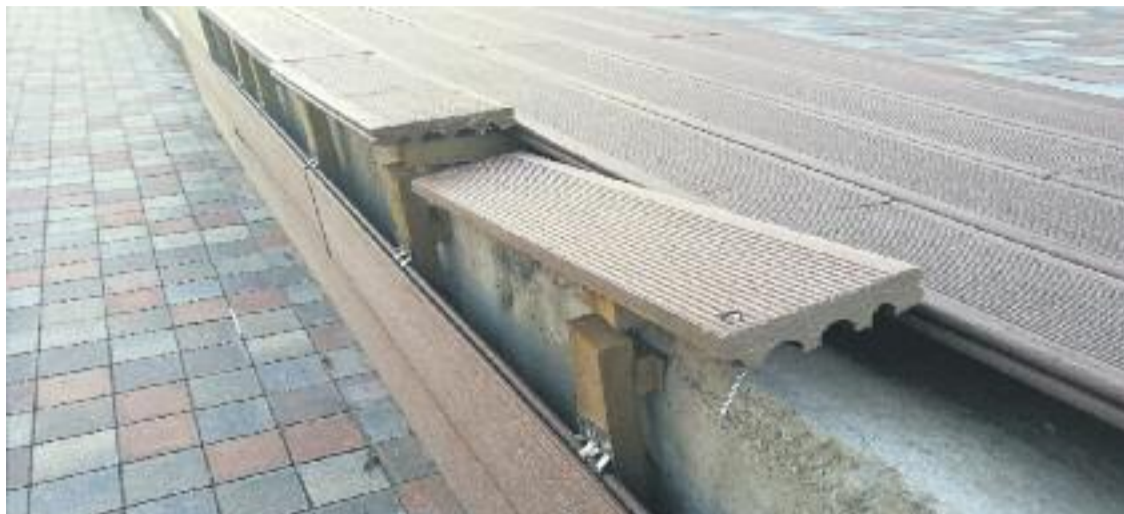
Imatge d'un banc malmès als Jardins de la rambla de Sants.

POLÈMICA ▶ Un grup de veïns de les finques dels números 100 al 122 de la rambla del Badal van presentar fa uns dies, tal com va explicar El3.cat, un escrit de queixa al Districte per denunciar l'incivisme que hi ha a la zona dels Jardins de la rambla de Sants.