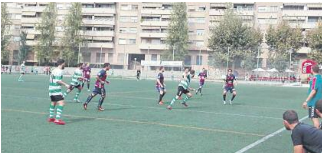
Els blanc-i-verds buscaran retrobar-se amb la victòria a l'Energia.

» Horta, Llagostera i Andorra aprofiten les punxades dels santsencs » Els de Tito Lossio volen retrobar-se amb la victòria contra el Lloret