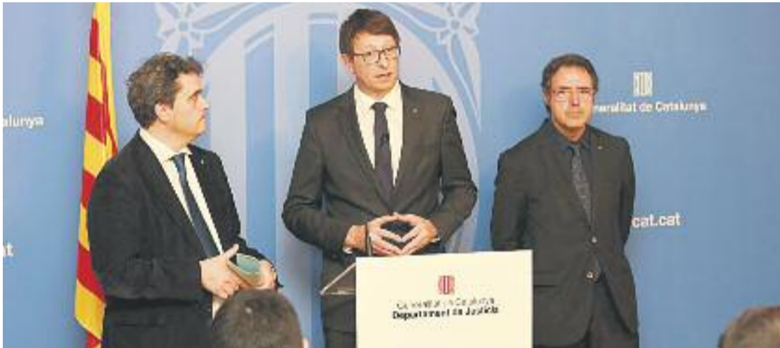
El conseller Mundó, al mig, durant la presentació del projecte per fer els nous centres penitenciaris.

» Quatre anys abans, el 2021, estarà enllestit el nou centre obert » Els veïns rebutgen que la Model es traslladi al seu barri