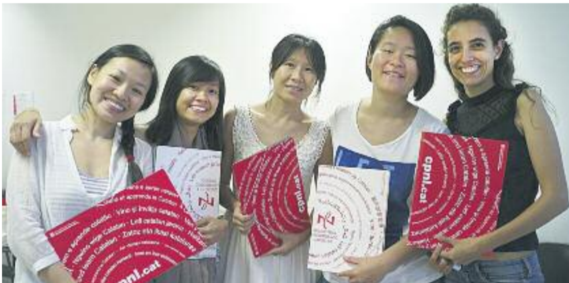
El CNL donarà informació als botiguers xinesos sobre cursos de català.

» Crea una campanya per "millorar la comunicació" amb el col·lectiu » Ho fa de la mà del Centre de Normalització Lingüística (CNL)