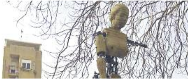
Una imatge del muntatge de la ballarina de fa dos anys.

Justament la dansa tindrà un paper molt especial durant les