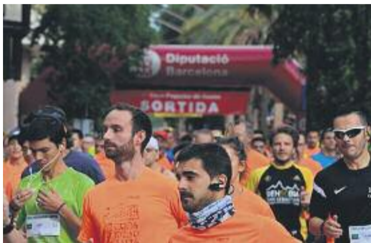
El barri no ha fallat en una nova edició del cros.

Per la seva banda Martín, del Fisiologic.com, va travessar la meta en 39 minuts i 9 segons. La segona i la tercera posició van ser,