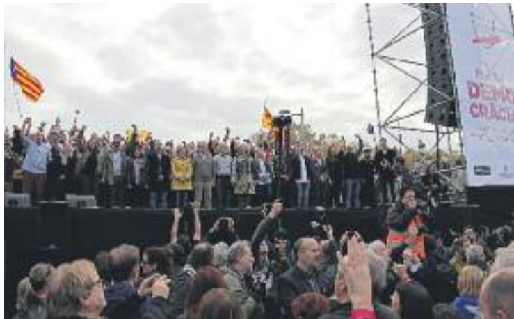
L'acte va reunir bona part de la classe política independentista.