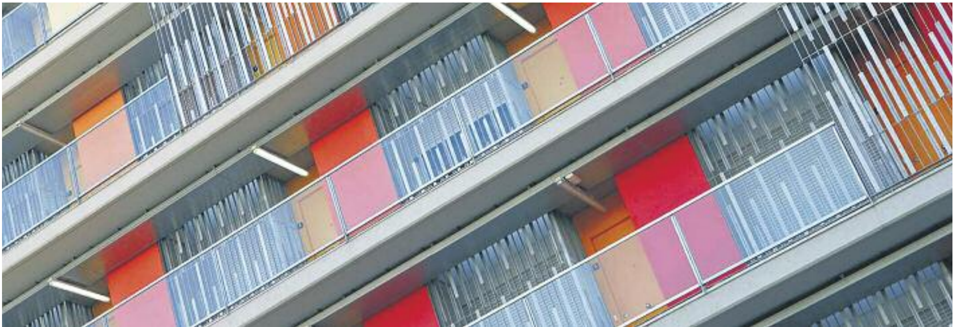
El preu de lloguer dels pisos a la ciutat ha experimentat un fort creixement des del 2014.