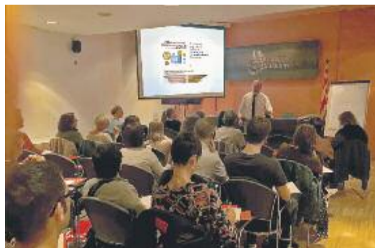
Presentació de les accions que porta a terme el Govern per fomentar la digitalització del comerç (esquerra) i alguns dels tallers que ja ha impulsat (dreta).