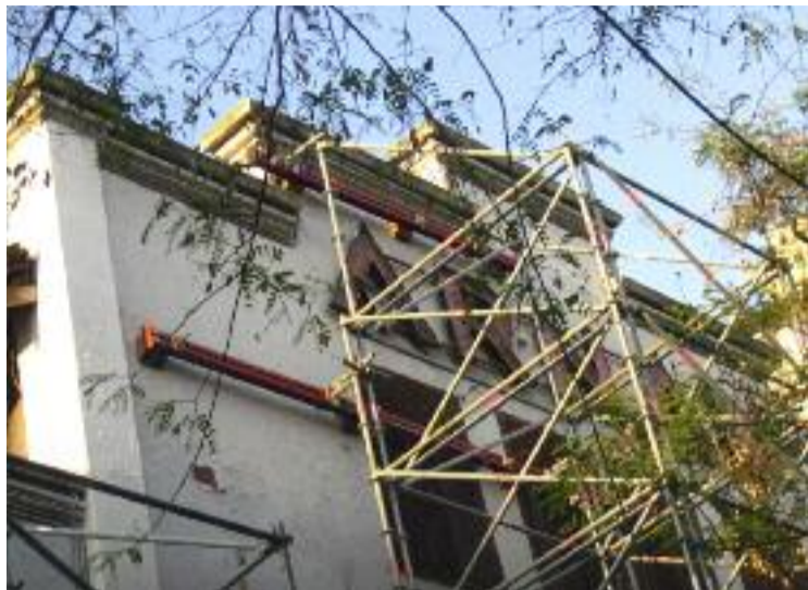
L'Arnau, motiu de controvèrsia entre govern i oposició.

Per la seva banda, segons la mateixa informació de La Vanguardia, l'oposició va demanar al govern que no enderroqui del tot l'Arnau i en conservi tot el que sigui possible. Uns dies abans, CiU ja havia registrat un prec a l'executiu on li recordava que el teatre "està catalogat amb el nivell C, que impedeix el seu