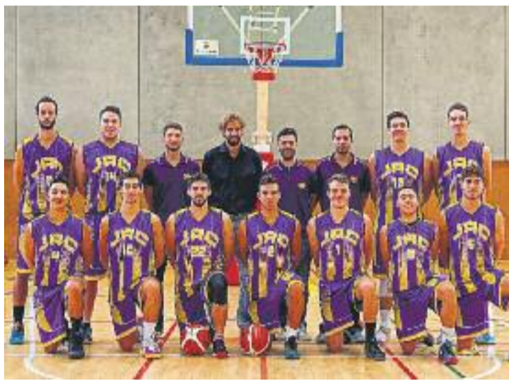
La plantilla 2016-17 de l'equip.

En un matí que va servir per presentar tots els equips del club a l'Espanya Industrial, el sènior va posar la cirereta al pastís derrotant el conjunt maresmenc en un partit que van dominar des del salt inicial. Contràriament al que havia passat en altres xocs, l'equip no va permetre que els homes de Charly Giralt anotessin gaire. La bona actuació dels liles (Aitor Gómez, Albert Real i Àlex Olivé, amb 21 punts de valoració cadascun van ser els homes més destacats del partit) va donar una renda d'11 punts al final de la primera part (38-27).