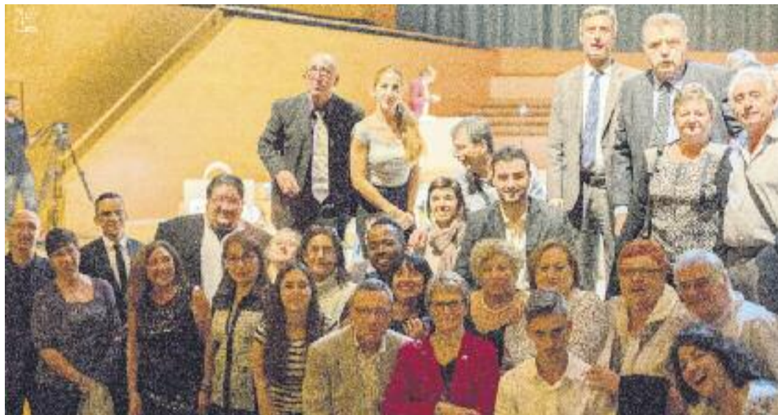
Foto de família dels paradistes del Mercat de Sants presents a la gala d'entrega del guardó.

Aquest, però, no va ser l'únic premi que va tenir relació amb el Mercat de Sants. El guardó Albert González, que reconeix la tasca de contribució i coneixement del co-