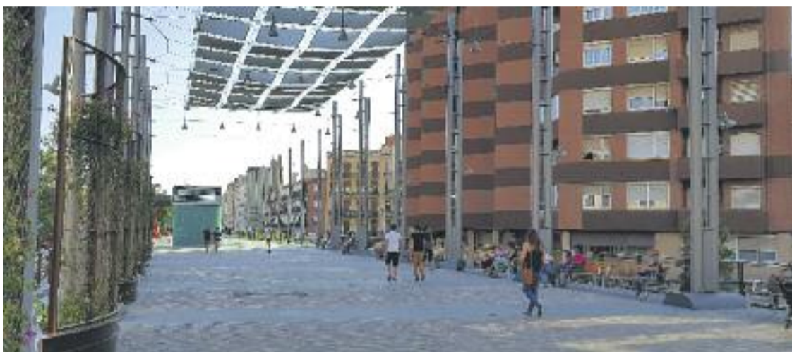
La rambla verda de Sants es va obrir al públic el passat mes d'agost.

» Es queixa d'haver perdut intimitat i de sorolls i molèsties a les nits » El Districte diu que aviat hi haurà una solució per als veïns afectats