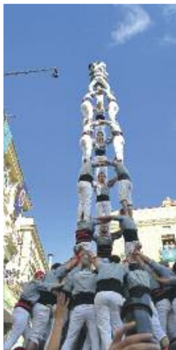
3 de 9 amb folre.

Els santsencs, que van tancar la seva actuació amb un pilar de 6, són la sisena colla de la història que aconsegueix descarregar el 5 de 9 amb folre i la segona que ho aconsegueix en el primer intent.