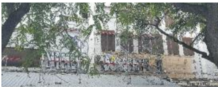
Una imatge recent de la façana del Teatre Arnau.

URBANISME ▶ "Ens retirem del procés participatiu, però això no vol dir que tirem la tovallola". Així s'expressen des de la plataforma Salvem el Teatre Arnau després que a finals d'octubre la regidora de Ciutat Vella, Gala Pin, afirmés que "per tornar a convertir l'Arnau en un espai practicable, com segueix sent el nostre compromís, primer l'haurem d'enderrocar".