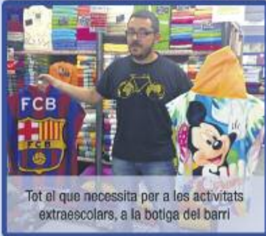
Tot el que necessita per a les activitats extraescolars, a la botiga del barri