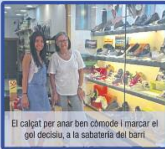
El calçat per anar ben còmode i marcar el gol decisiu, a la sabateria del barri