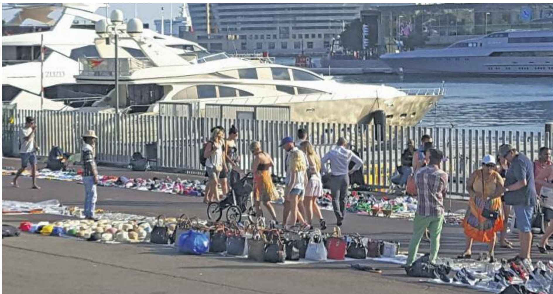
La venda il·legal al carrer ocupa l'espai públic i dificulta la mobilitat dels ciutadans.