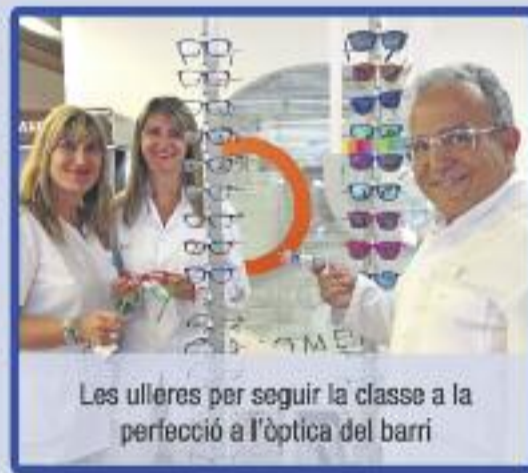
Les ulleres per seguir la classe a la perfecció a l'òptica del barri