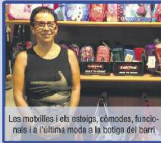
Les motxilles i els estoigs, còmodes, funcionals i a l'última moda a la botiga del barri