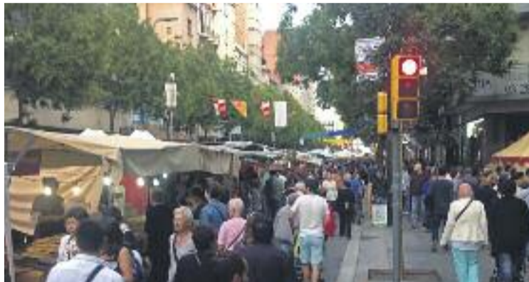
La Fira Medieval és un acte consolidat.

La fira arrencarà dissabte dia 1 d'octubre amb una recreació medieval de mercenaris, a càrrec de la Compagnia di Sant Giuda, al migdia. Mitja hora més tard la mostra quedarà in-