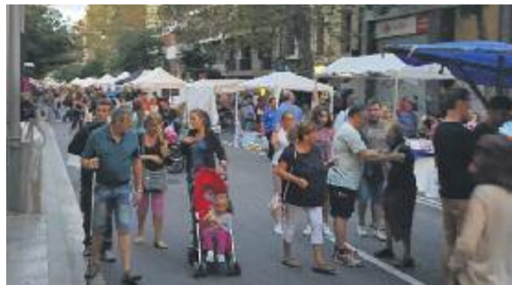
Unes 5.000 persones van visitar la mostra, segons l'eix.

FIRA ▶ El Fora Stock'sants va aplegar un bon nombre de veïns i visitants dissabte passat al carrer de Sants.