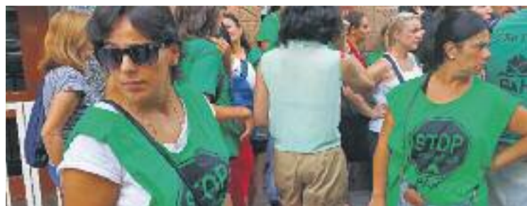
Membres de la PAH abans del desnonament.

Després de les piulades de Colau, els Mossos d'Esquadra, en un gest que no se sol produir, van respondre l'alcaldesa des del seu compte de la mateixa xarxa social per precisar que ells només