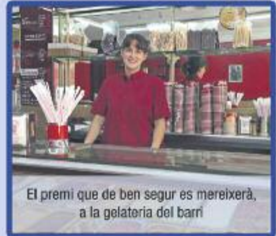
El premi que de ben segur es mereixerà, a la gelateria del barri