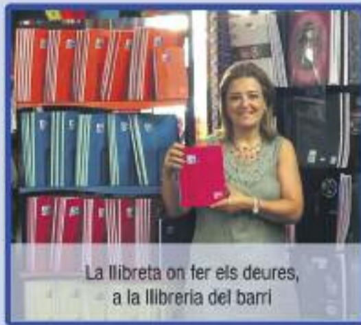
La llibreta on fer els deures, a la llibreria del barri