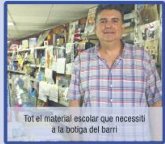
Tot el material escolar que necessiti a la botiga del barri