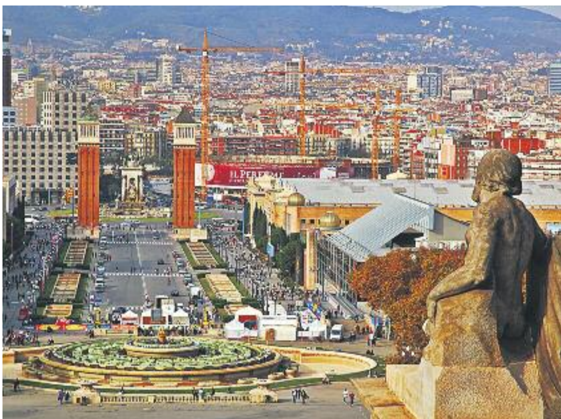
El nombre de turistes que visiten la ciutat segueix creixent.