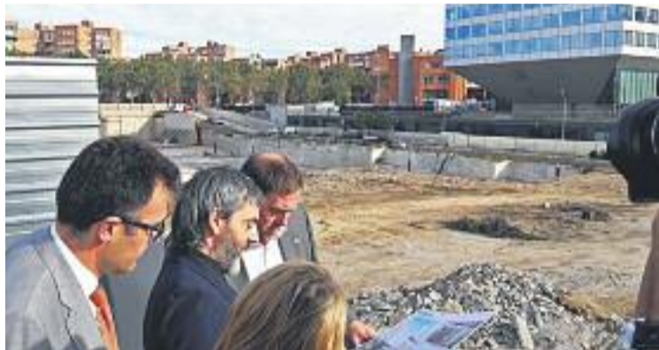
El vicepresident Junqueras durant la visita a les obres.

En un comunicat, el Govern va explicar que un cop s'acabi de construir el complex, uns 2.800 treballadors de la Generalitat es traslladaran a aquestes instal·lacions. Es tracta, segons explica la Generalitat, de fer "un pas transformador cap a un nou concepte d'administració més innovadora,