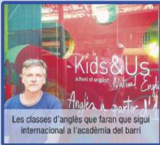
Les classes d'anglès que faran que sigui internacional a l'acadèmia del barri