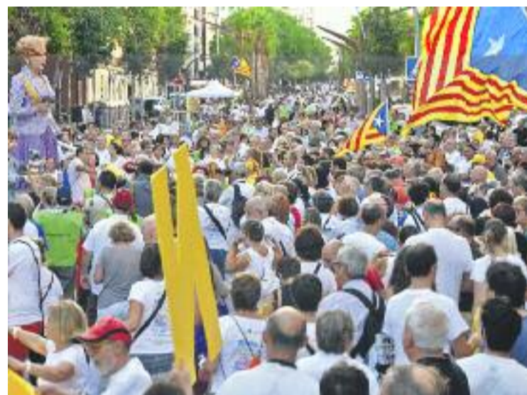
Un moment de la jornada de l'any passat.

Abans de marxar cap a casa, els assistents podran brindar amb cava i compartir un petit pisolabis.