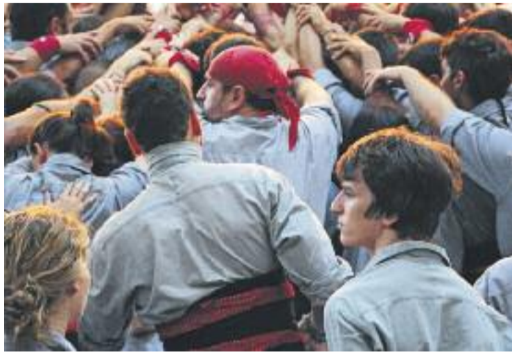
Els Borinots tornaran a alçar el pilar caminant.

Durant el primer dia, a banda de participar en la cercavila i d'alçar pilars a l'Espanya Industrial, la colla ha preparat una classe magistral i una exhibició