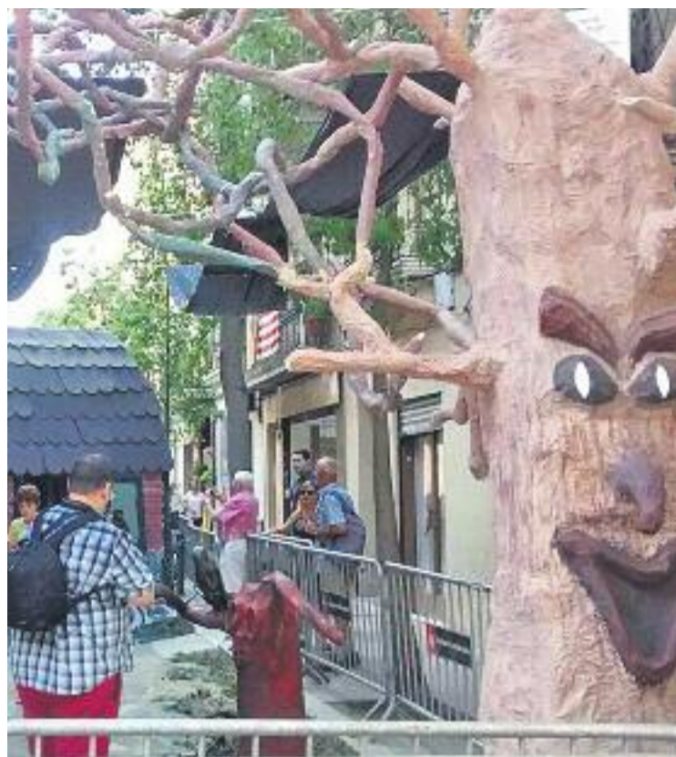
Els carrers i les places es tornaran a vestir de gala per celebrar la Festa Major.