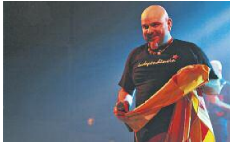
Brams serà un dels plats forts de la Festa.

Per altra banda, els amants de l'esport tindran diverses cites ineludibles. Els dies 21 i 28, la UE Sants jugarà dos dels seus partits de pretemporada a l'Energia, contra el CF Can Vidalet i contra l'FC Santboià, respectivament. A més, el Club Beisbol Barcelona muntarà un inflable al parc de l'Espanya Industrial i convidarà els nens i nenes d'entre 5 i 15 anys a conèixer aquest esport el pròxim dia 22. Altres propostes seran les curses, a peu i en bicicleta, per les quals caldrà esperar fins al dia 4 de setembre.