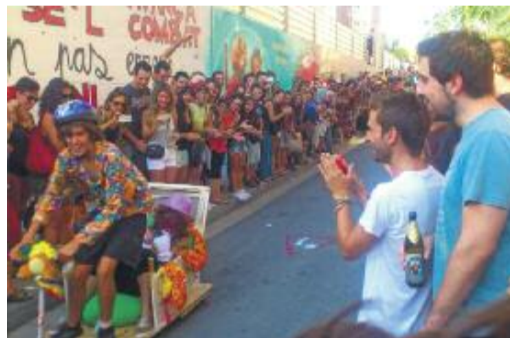
Els carretons passen pel revolt de Can Vies.

Tots aquells que no vulguin córrer també podran gaudir de la competició com a espectadors.