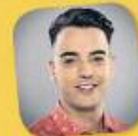
La tribu de Catalunya Ràdio Amb Xavi Rosifol De dilluns a divendres, de 16 a 19 h