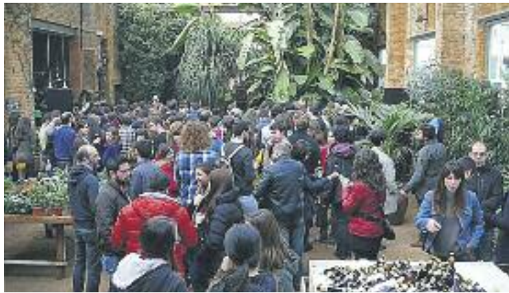
La botiga va saber reaprofitar una nau abandonada.

Aquest centre de jardineria va aprofitar unes naus industrials abandonades per crear