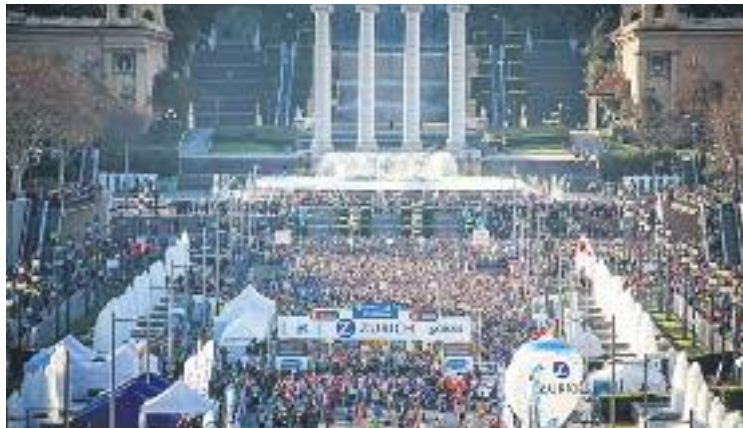
Una imatge de la Marató de l'any passat.

La campanya viral que va impulsar l'organització (amb l'etiqueta #ZMBobjectiu20mil) ha funcionat i, gràcies també a la promoció internacional de la prova, la marató de la ciutat s'ha conso-