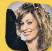
Les mil i una nits de Maria de la Pau Janer Amb Maria de la Pau Janer De dilluns a divendres, de 22 a 23 h