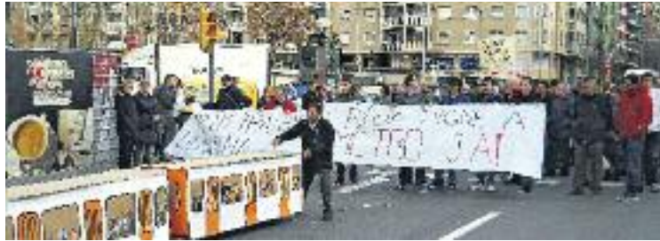
Els veïns fa anys que reivindiquen l'arribada del metro.

En conversa amb Línia Sants , García celebra que l'alcalde "hagi parlat de finals del 2017 com la data de l'arribada del me-