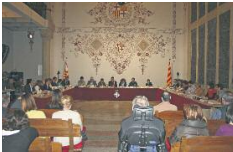
El consell plenari es va allargar quatre hores i mitja.

Més endavant, un cop a la part decisòria del consell plena-