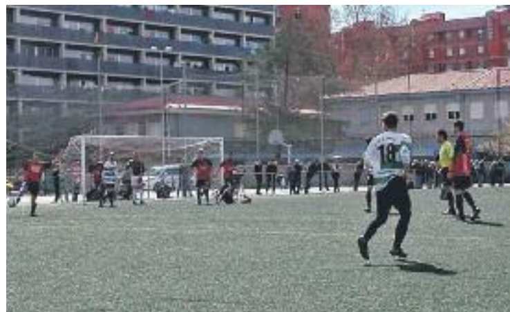
El santsencs són ara a un punt del líder.

FUTBOL ▶ El Sants es va retrobar diumenge passat amb la victòria i amb l'èpica. Els santsencs van derrotar l'Escala (2-1) amb dos gols en un minut i són cinquens a només un punt del líder de la classificació, el Vilassar de Mar.