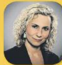
El matí de Catalunya Ràdio Amb Mònica Terribas De dilluns a divendres, de 6 a 12 h