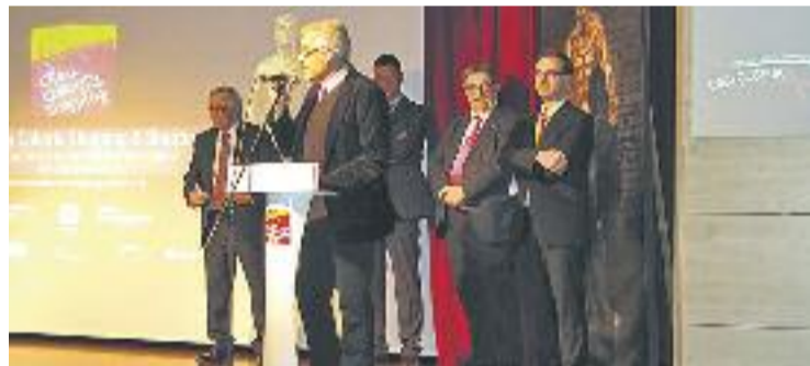
Gala de lliurament dels premis de l'edició anterior.

CONCURS ▶ D'aquí a poc més d'una setmana, els curtsmetratges del concurs Shooting & Shopping de Creu Coberta veuran la llum. La Nit de Nadal serà l'inici de la publicació de les peces lliurades pels diferents equips participants en aquest certamen que barreja comerç i cinema. Enguany, a més, el concurs s'ha fet extensiu a tots els eixos de la ciutat i, per tant, els equips estan podent rodar a qualsevol botiga de Barcelona.