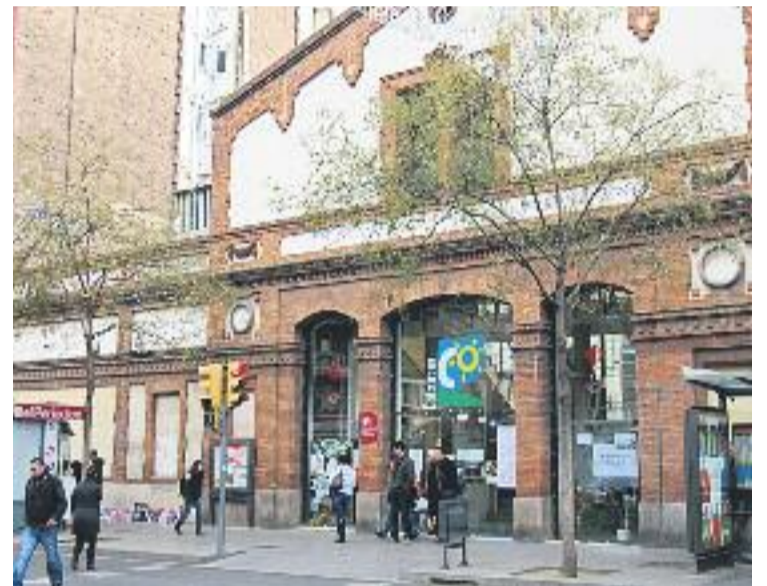
La presentació del llibre es va fer a les Cotxeres.

L'obra se situa en el context educatiu posterior a la Guerra Civil als barris de Sants, en una època on el sistema educatiu era molt autoritari. Posteriorment l'obra narra com, a mesura que la societat va anar canviant, van aparèixer noves propostes educatives que destacaven pel seu caràcter renovador i pel fet de tenir al darrere una gran mobilització col·lectiva que generava molta il·lusió.