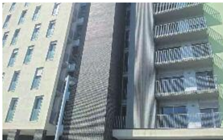
El barri de la Marina tindrà més pisos de protecció social.

Està previst que entre la Marina i Sant Andreu el Consorci construeixi 1.807 habitatges.