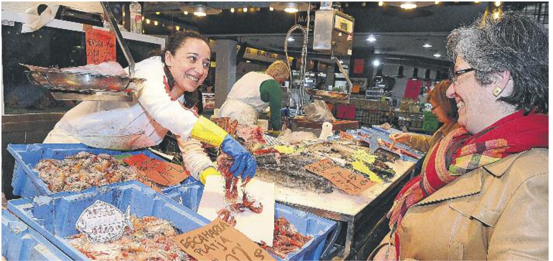
Els botiguers tenen a tocar el canvi de tendència amb el gran inici de campanya que han viscut.