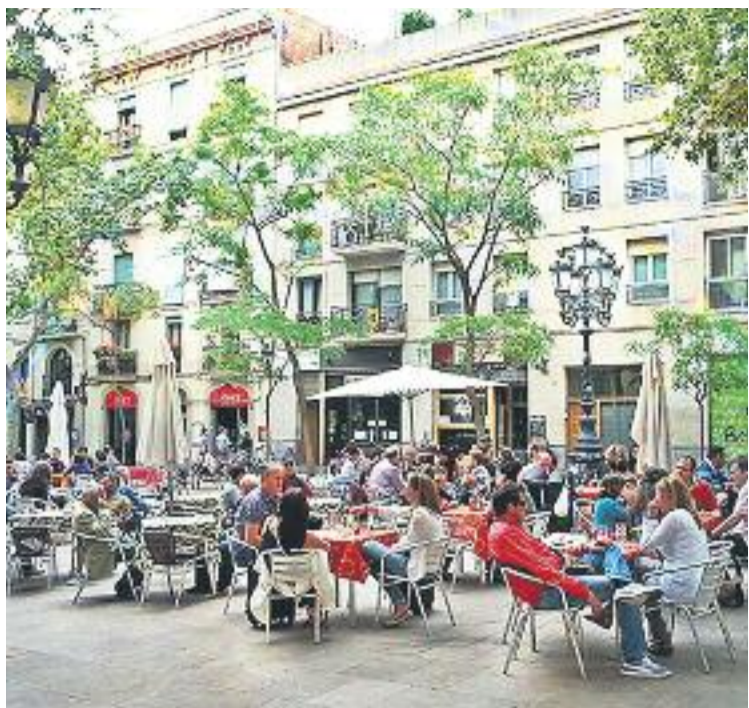
Els veïns es queixen de les molèsties que causen les terrasses.