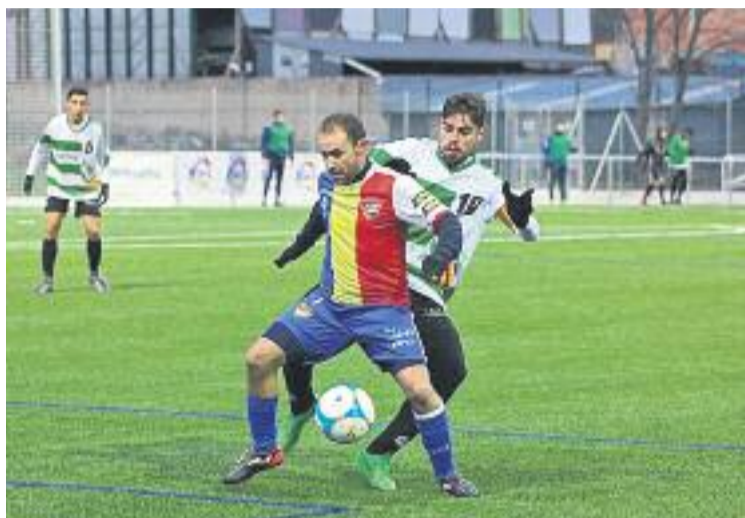
Els santsencs van perdre l'últim partit al Principat d'Andorra.