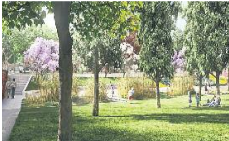
Una reproducció virtual del futur parc de la Marina.

L'espai serà una gran illa verda de 20.000 metres quadrats ubicada entre els carrers de Pontils, d'Uldecona, Cal Cisó i del Ferro i el carrer d'Arnes i tindrà diferents àrees de joc, bancs i arbrat nou. El projecte, obra de Cáceres Arquitectura S.CP., també recull els suggeriments de l'Associació de Veïns d'Eduard Aunós i altres veïns i joves del barri. És per aquest motiu que incorporarà dues pistes esportives cobertes que substituiran una pista que ara hi ha a la mateixa zona.