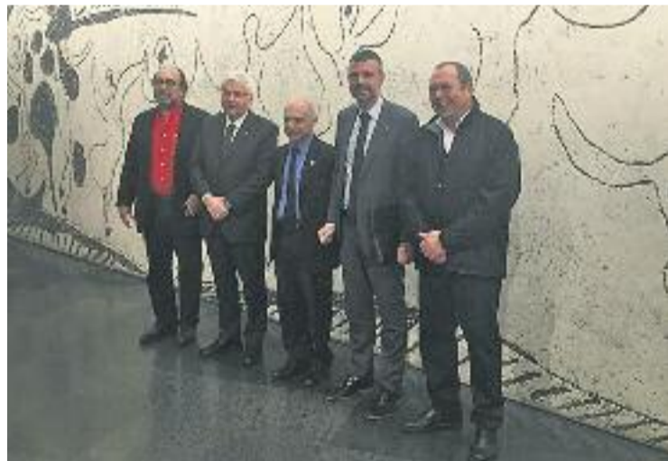
Imatge d'un moment de la presentació del projecte del Mauc.