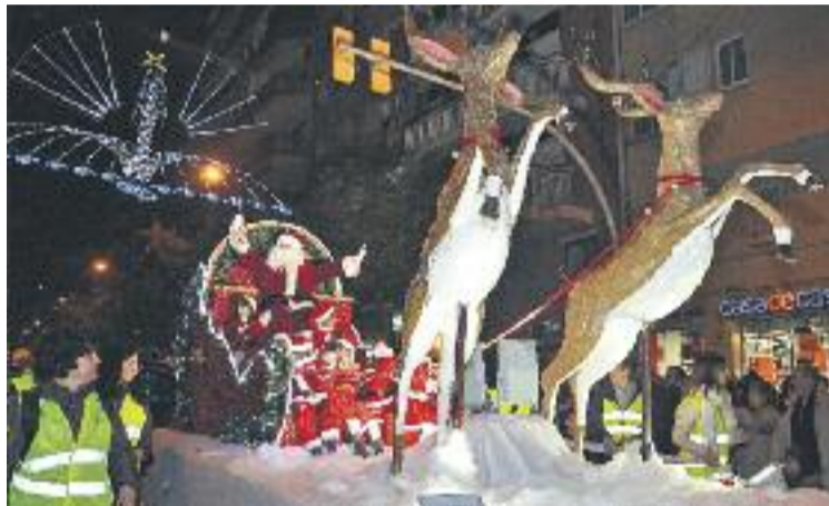
El Pare Noel va visitar Sants diumenge.