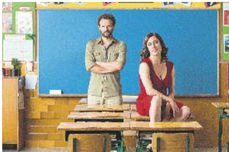
'Conillet' mostra la complicada vida d'una dona treballadora.

L'espectacle parteix d'un text de Marta Galan Sala -'El conillet del tambor de Duracell', està adaptat i dirigit per Marc Martínez i serà al Teatre Lliure fins al pròxim sis de desembre.