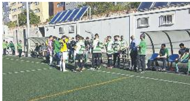
El Sants no va poder contrarestar l'efectivitat de la Jonquera.

FUTBOL ▶ El Sants va perdre diumenge passat a casa contra la Jonquera per 0 gols a 3, un resultat que suposa el sisè partit seguit sense guanyar per als de Tito Lossio.