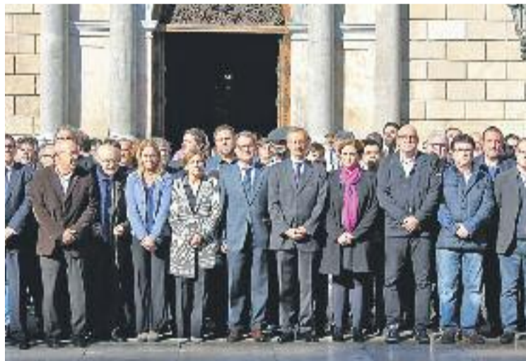
Imatge d'un moment de la concentració.