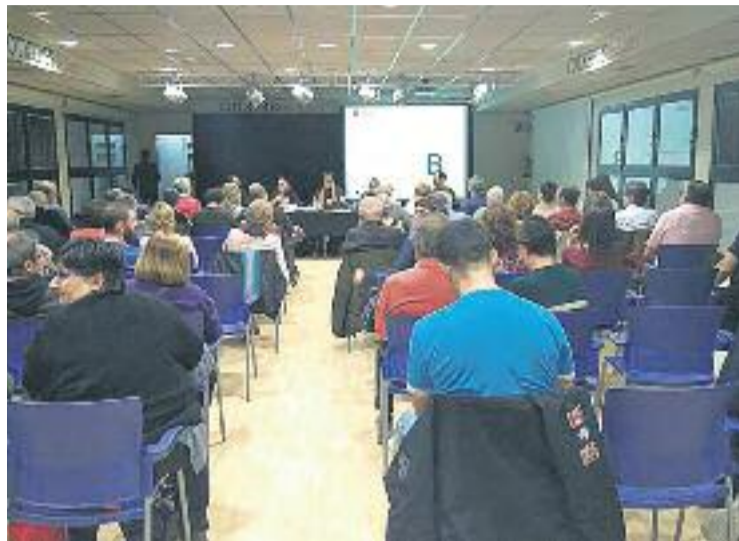
Uns vuitanta veïns van assistir al Consell de Barri.

D'altra banda, però, també hi va haver veïns que van defensar la continuïtat de Can Vies al ba-