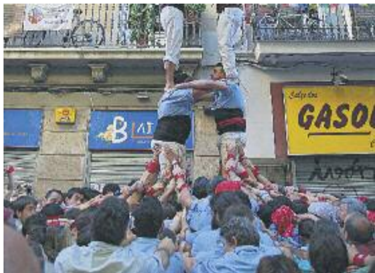
Els Bandarres van demostrar diumenge la seva progressió.

En segona ronda els poblesequins van atacar la joia de la corona, un tres de vuit que feia temps que entrenaven. Tot i que en algun moment el castell va pujar amb alguna imprecisió, en cap moment es va respirar una sensació d'inseguretat. A l'hora de descarregar-lo va passar una mica el mateix. Algun moment de tensió, que quasi sempre hi és, no va tòrcer la seguretat dels blau cel, que van aconseguir completar-lo magistralment. L'a-