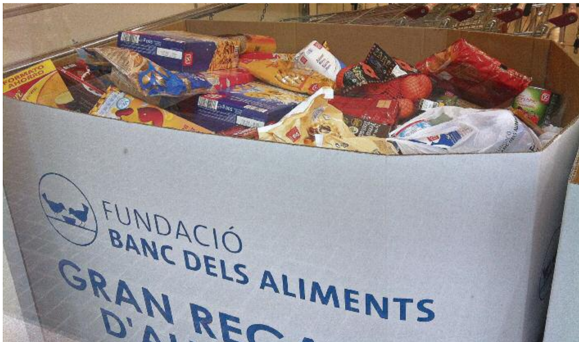
El repte serà, com a mínim, igualar les 4.600 tones d'aliments que es van recollir l'any passat.

» Els dies 27 i 28 d'aquest mes se celebrarà la setena edició del Gran Recapte, l'acció que organitza el Banc dels Aliments per garantir una cobertura alimentària bàsica