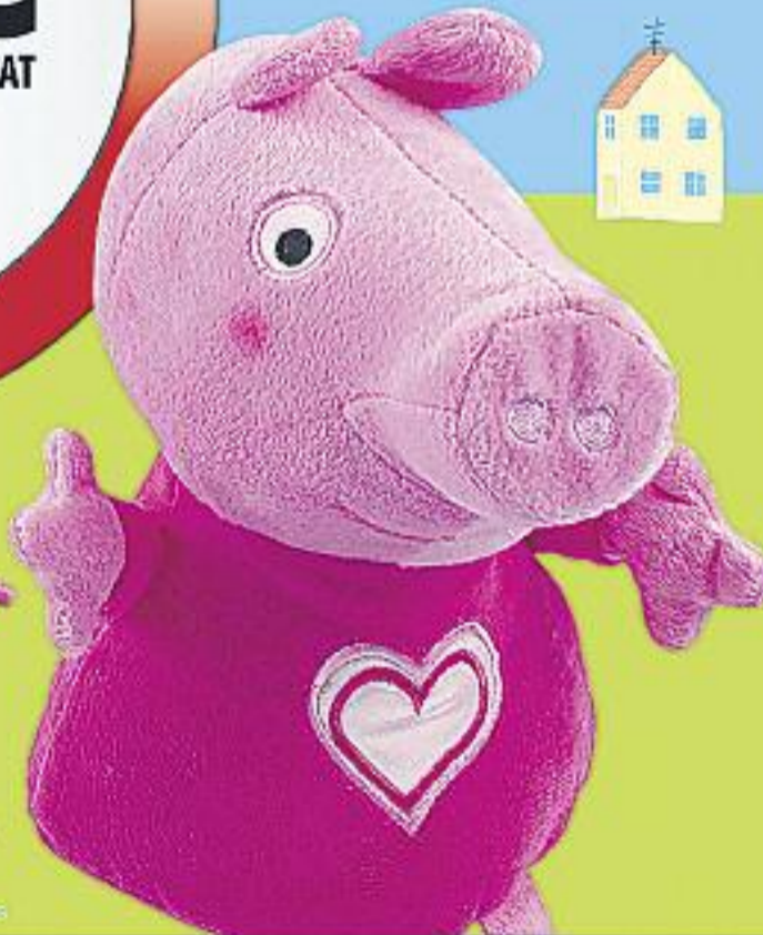
Peluixos assaïllits. Ref. 257000011 3,350 unitats