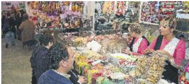
Les vendes nadalenques suposen un terç de la facturació anual.

Així mateix, la CCC preveu un creixement en la contractació del 3% respecte de l'any passat,