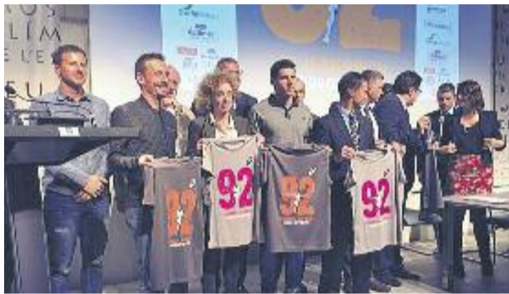
Imatge de l'acte de presentació de la cursa.

Els participants en la prova s'estimen en més de 14.000, els quals prendran la sortida de les diferents categories de la cursa a