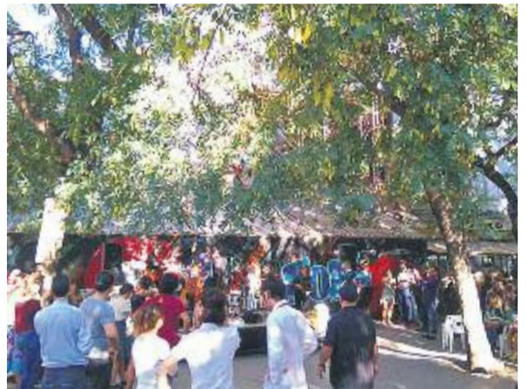
Imatge de la concentració de diumenge.

Els seus impulsors busquen en primer lloc aconseguir que es repari urgentment la teulada. Es tractaria del primer pas per convertir l'Arnau en un teatre museu obert a companyies professionals i amateurs per tal que es pogués recuperar aquesta tradició tan arrelada al Paral·lel. El projecte també inclouria la instal·lació d'un centre d'interpretació històrica dedicat a les arts escèniques i al moviment obrer del Paral·lel i caldria definir el seu model de gestió, que és probable que combini la gestió professional i la participació veïnal.