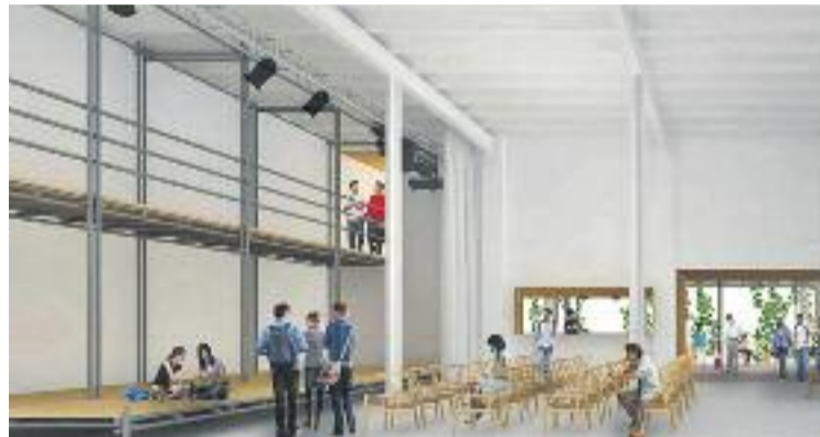
Imatge virtual de la Lleialtat un cop acabin les obres.

La sala principal serà un gran espai de trobada obert i diàfan amb la mateixa estructura que tenia originàriament. Al mateix espai també hi haurà un espai poli-