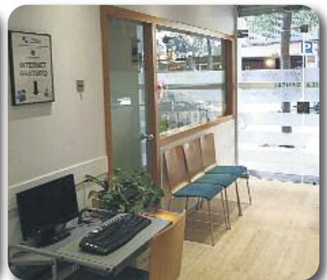
Fotografies de les instal·lacions de la Clínica Dental Esmail