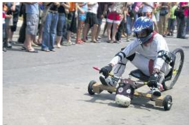
Imatge d'un dels participants d'una edició anterior.

Tots aquells que no vulguin córrer també poden gaudir de la cursa com a espectadors.