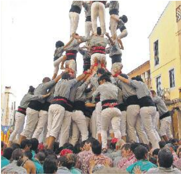
Una de les darreres actuacions dels Castellers de Sants.