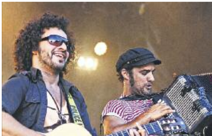
La Troba Kung-Fú actuarà a l'Alternativa.

Tot i que durant el dia hi ha activitats i xerrades preparades, com la Cursa per Can Vies, el concurs de paelles o la presentació de la cervesa La Bordeta, una de les creacions de les cooperatives de l'espai autogestionat de Can Batlló, cada cop la Festa Alternativa