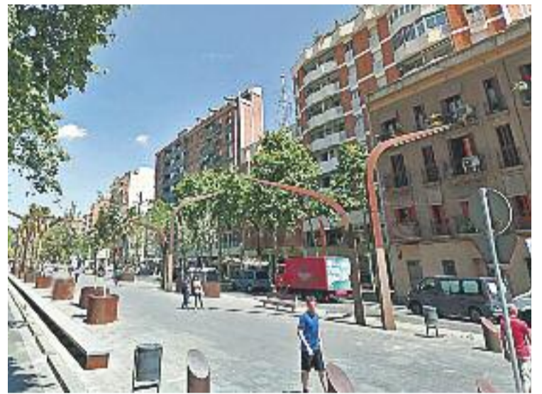
La Rambla de Badal viurà un assaig de l'11S.

"No hem triat el dia a l'atzar" explica Enric Blanes, de l'Assemblea Nacional de Catalunya (ANC). "Volem que amb aquest assaig es comenci a mobilitzar la gent, que es comenci a generar entusiasme, i també pot servir per detectar problemes i resoldre'ls de cara al dia Onze de setembre", assegura Blanes. L'ANC confia en repetir l'èxit que van assolir l'any passat.