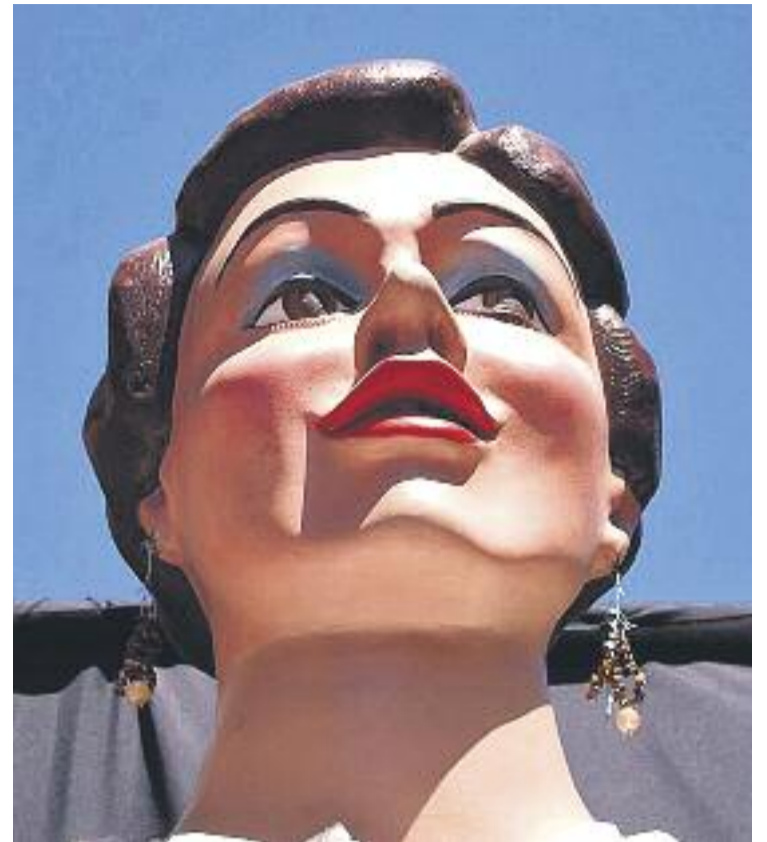
Els carrers s'engalanan per la setmana més màgica de l'any.