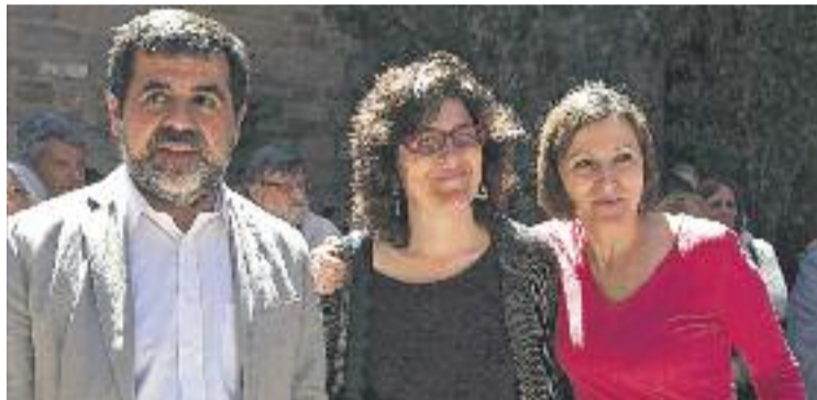
El president de l'ANC Jordi Sánchez (esquerra) serà a les Cotxeres.