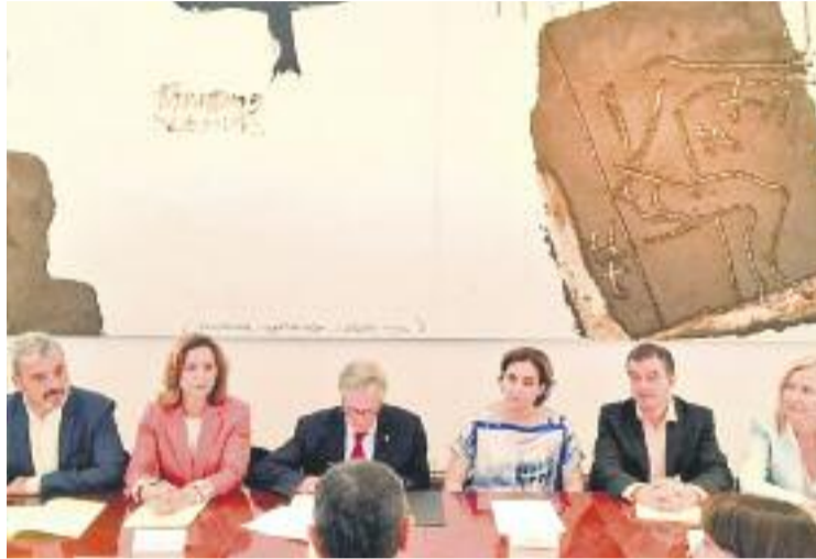
Els representants dels partits durant la signatura de l'acord.

Després d'aquest tràmit, la direcció del Groupe Speciale Mobile Association (GSMA), l'empresa organitzadora del congrés, reunirà el seu consell general a Singapur durant el pròxim mes de juliol. Després d'aquesta trobada, la companyia podria anunciar la pròrroga del contracte amb la ciutat, que ara