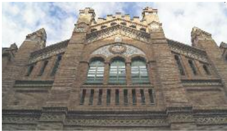
La superfície del mercat supera els 4.000 metres quadrats.

Per tal de recordar aquesta doble efemèride, el mercat ha organitzat en les darreres setmanes tot un seguit d'activitats adreçades a diferents públics. El dijous dia 14, per exemple, el Forn Baltà va col·laborar amb una degustació d'una coca d'aniversari entre els clients del mercat. L'endemà, la celebració va agafar un aire vintage amb l'exposició de models de Seat 600 i una activitat familiar que va consistir a construir la façana del mer-