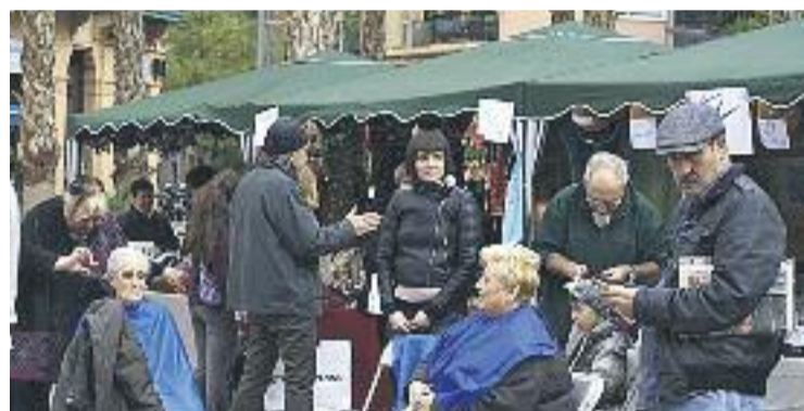
La mostra tindrà lloc al Paral·lel, entre Radà i Salvà.

ACTIVITATS ▶ Per vuitè any consecutiu, l'Associació de Comerciants del Poble-sec Paral·lel organitzarà la seva Mostra de Comerç, Benestar i Salut, una cita ja arrelada al districte i que ofereix des de menjar ecològic fins a productes cosmètics. Aquest pròxim dissabte dia 6, els més sibarites podran gaudir d'activitats, degustacions i venda d'articles d'aquesta temàtica.