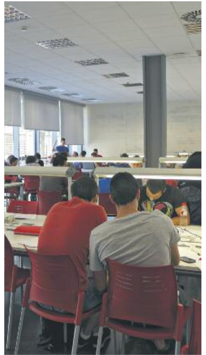
El mapa de les sales habilitades a la ciutat i una imatge de diversos nois estudiant.