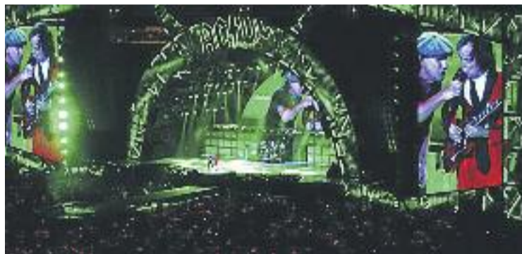
L'Estadi Olímpic es va omplir a vessar.

CONCERT ▶ L'Estadi Olímpic Lluís Companys va ser divendres passat l'escenari escollit pel mític grup australià de rock AC/DC per oferir un dels seus concerts de la gira de celebració del seu 40è aniversari.