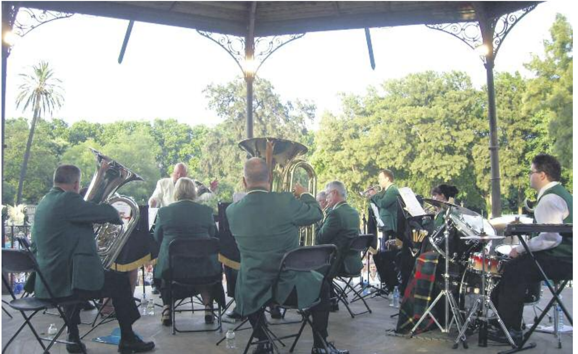
Una imatge de l'actuació de la Fairlop Brass Band durant la passada edició.

Amb un programa propi que enriqueix l'oferta musical del cicle Música als parcs , la Banda Municipal de Barcelona actuarà al Parc de les Aigües d'Horta-Guinardó (17 de juny), al Parc de la Guineueta de Nou Barris (18 de juny), al Parc de la Barceloneta de Ciutat Vella (19 de juny) i a Sants-Montjuïc, en un espai encara per decidir (23 de juny).