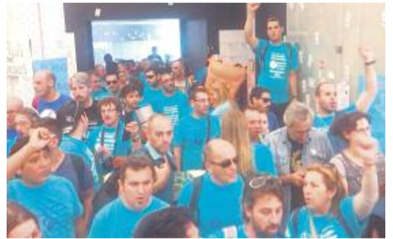
Els treballadors desallotgen la botiga.

Durant els dies que va durar el tancament, els vaguistes havien rebut la visita de polítics com el diputat de la CUP David Fernández o de la guanyadora de les eleccions municipals a la ciutat, Ada Colau.