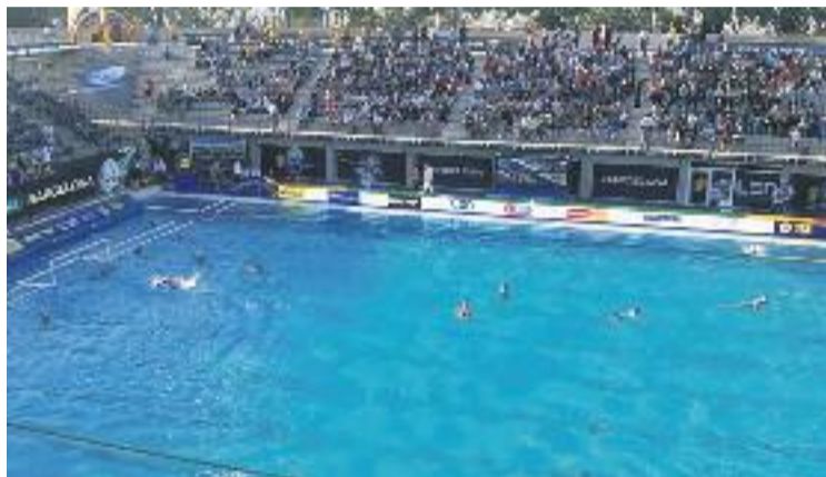
Les Picornell, escenari de la Final Six.

D'aquesta manera, els mariners no van poder revalidar el títol de campions d'Europa que ostentaven. Tot i així, un dels seus jugadors, l'argentí Felipe Perrone, va rebre el guardó al millor jugador de la Final Six.