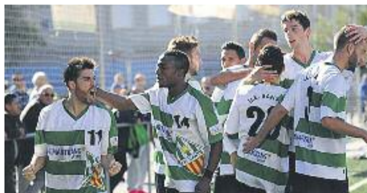
El Sants ha aconseguit l'objectiu de la temporada, la permanència.

FUTBOL ▶ La UE Sants ha tancat la temporada amb una derrota a domicili contra el Manresa per tres gols a zero. D'aquesta manera, els homes de Tito Lossio posen el punt final a la temporada en sisena posició amb 53 punts, a 10 tant del descens com de l'ascens, fruit de 15 victòries, vuit empats i 11 derrotes.