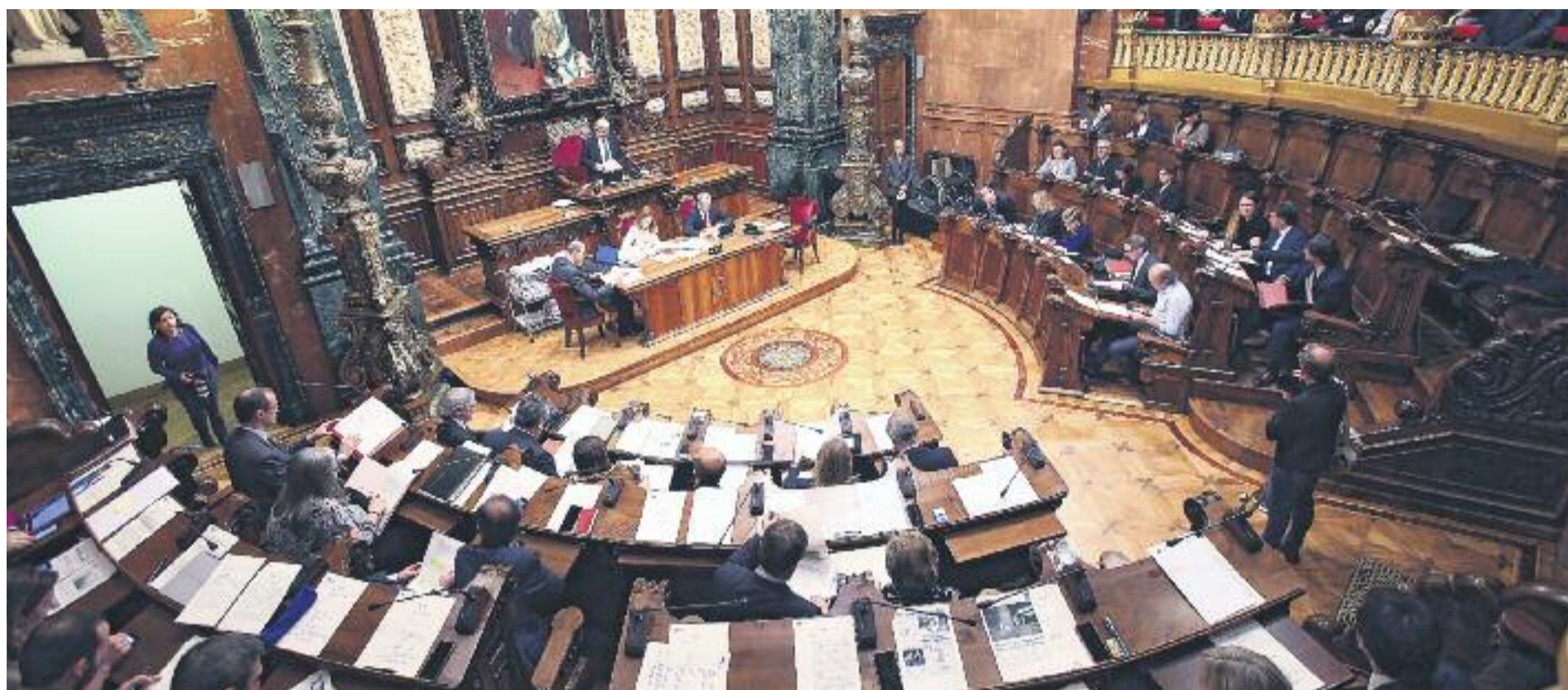
Aquest diumenge els barcelonins escolliran qui seran els encarregats de representar-los.