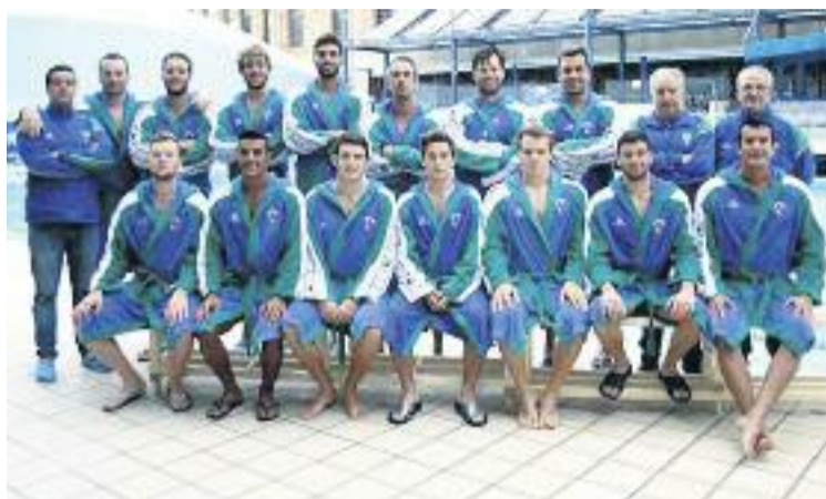
La plantilla i el cos tècnic del sènior masculí del Mediterrani.