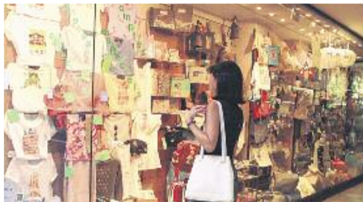
L'estudi correspon al primer trimestre d'enguany.