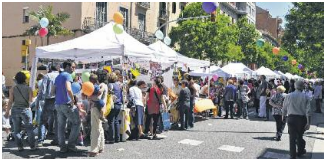
Una imatge de l'exitosa trobada.