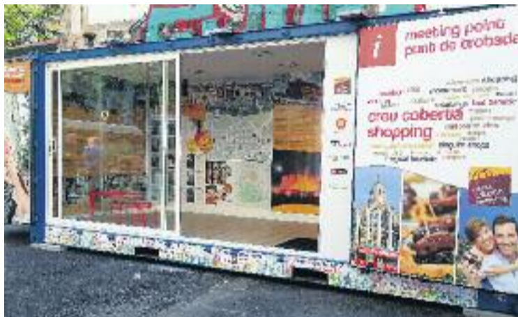
El punt de trobada es va inaugurar el passat diumenge.

A més, en aquest punt no només es facilitarà informació per als turistes, sinó que també es donaran referències sobre els locals buits a la zona, per tal que s'obrin negocis nous que ajudin a dinamitzar més l'eix. "Ha de ser