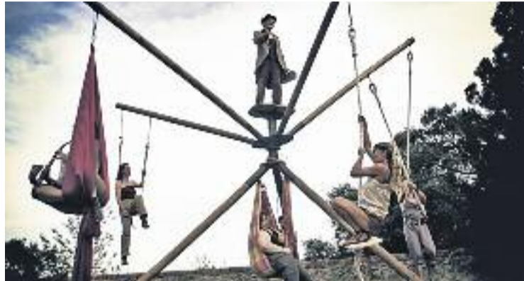
El Grec se celebrarà durant tot el mes de juliol.

El festival presentarà enguany una de les seves edicions amb un perfil més internacional, amb 17 produccions de teatre, dansa, circ i nous formats híbrids. Entre els nous artistes presentats destaca el director Ivo van Hove, que torna per tercer any al Grec, en aquesta ocasió amb un espectacle minimalista, La voix humaine , que protagonitza en solitari l'actriu Halina Reijn. Altres grans noms de l'escena teatral són Wajdi Mouawad, l'autor d' Incendís , que ha bastit un nou monòleg femení a Soeurs, i Alain Platel, que codirigeix amb Frank van Laeke el muntatge En avant, marche! ,