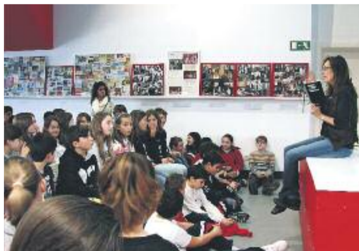
A la fundació s'hi fan moltes activitats.