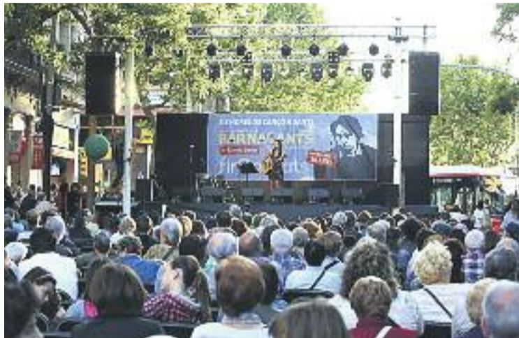
Una imatge del concert.