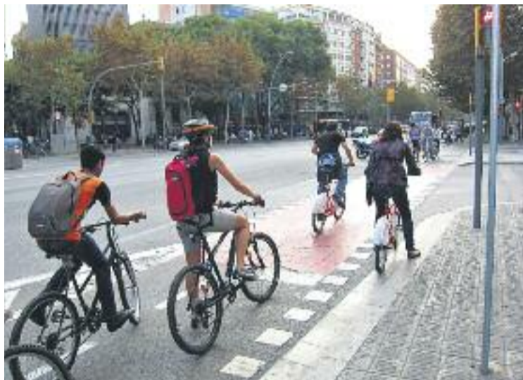
L'ús de la bicicleta a la ciutat ha crescut en els últims anys.

L'estudi del RACC, en canvi, també mostra com la xifra de víctimes greus i morts s'ha reduït en els darrers anys, ja que el 2014 va ser de set, mentre que el 2013 va ser de 17 i el 2012 de 12. Entre el període analitzat, només el 2009 la xifra va ser menor, ja que es va quedar en sis. Un altre aspecte que cal destacar i que s'apunta a l'estudi és el del nivell de risc de circular amb bicicleta. Si bé és molt