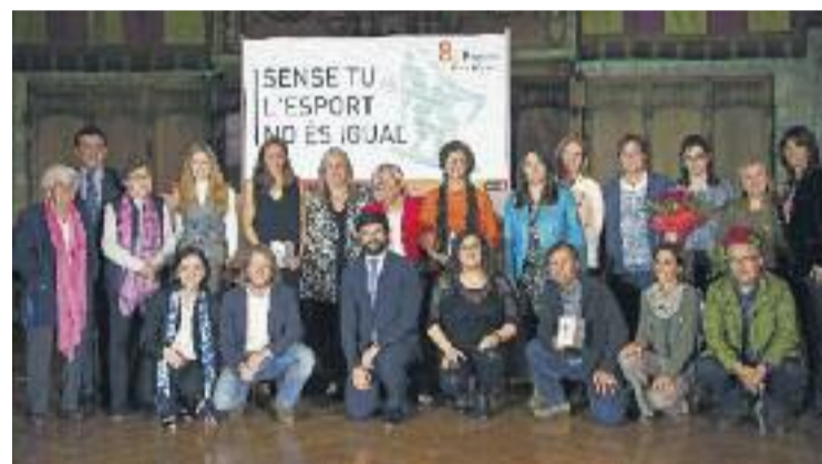
Foto de família amb totes les premiades.