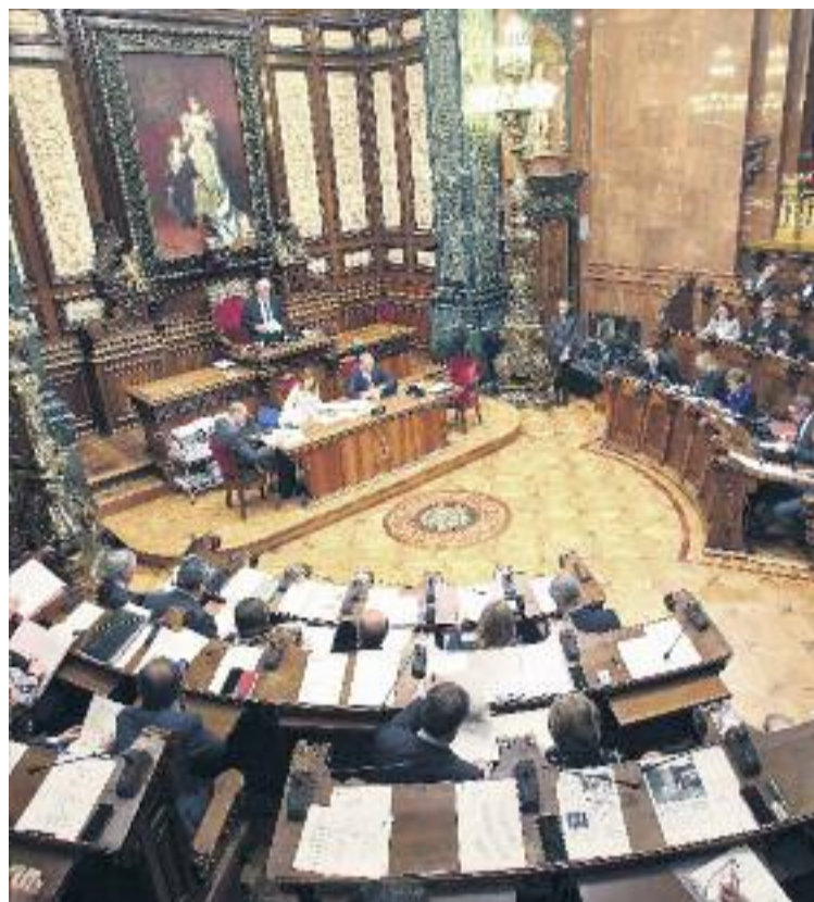
El pròxim Ple de l'Ajuntament pot estar marcat per la fragmentació i la dificultat dels partits per articular majories.