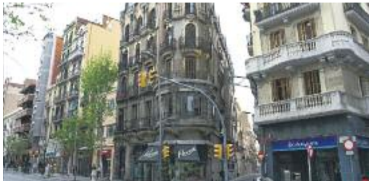
L'associació ja ha localitzat algunes botigues singulars al districte.

Botigues Singulares té l'objectiu de fer un catàleg amb tots els comerços de la ciutat que comptin amb un producte que només puguin oferir ells o que sigui molt diferent de la resta. La iniciativa, que es presenta de