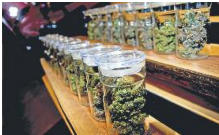
Imatge de l'interior d'uns dels clubs de cànnabis de la ciutat.

Per la seva banda, les dues federacions d'associacions canàbiques de Catalunya (Fedcac i CatFAC) han lamentat a través d'un comunicat que "tancar les portes a les associacions és el mateix que empènyer a usuaris i usuàries al mercat negre i il·legal" i han titllat la mesura d'"electoralista".