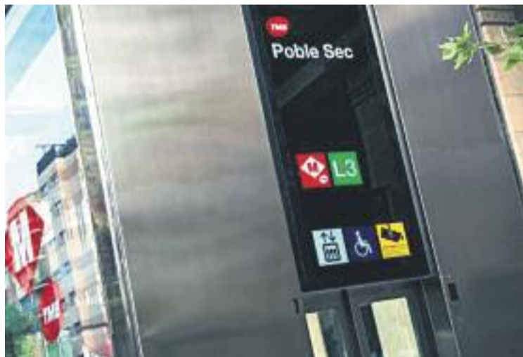
Un dels nous ascensors de l'estació de la L3 del Poble-sec.