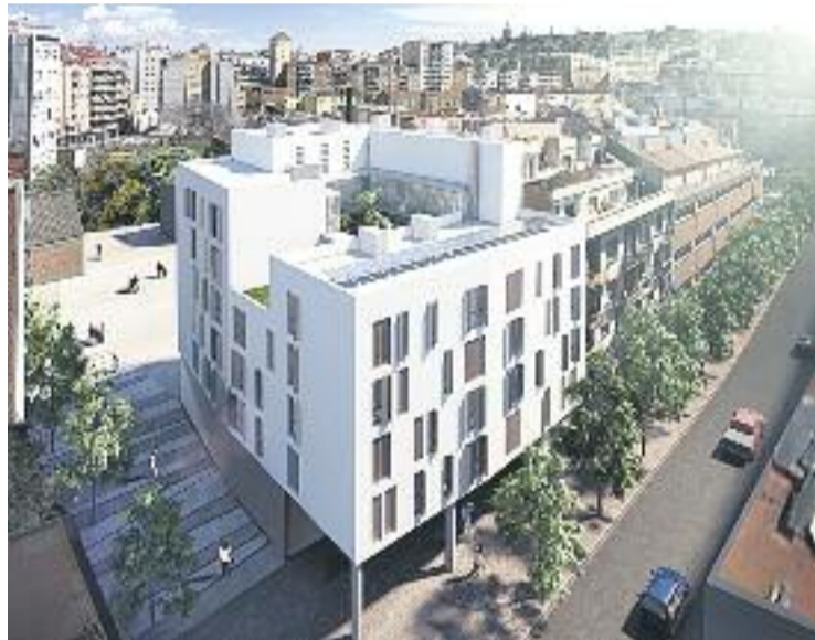
L'aspecte virtual d'un dels blocs de la zona de Can Batlló.

A més, l'Ajuntament ha anunciat que ja està treballant en la urbanització del carrer Parcerisa, per allargar-lo i remodelar-lo.