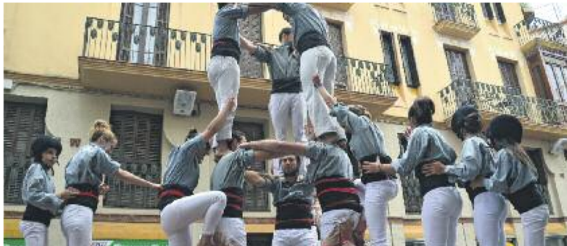
Imatge de l'actuació dels Borinots a la jornada de Sant Jordi a Sitges.