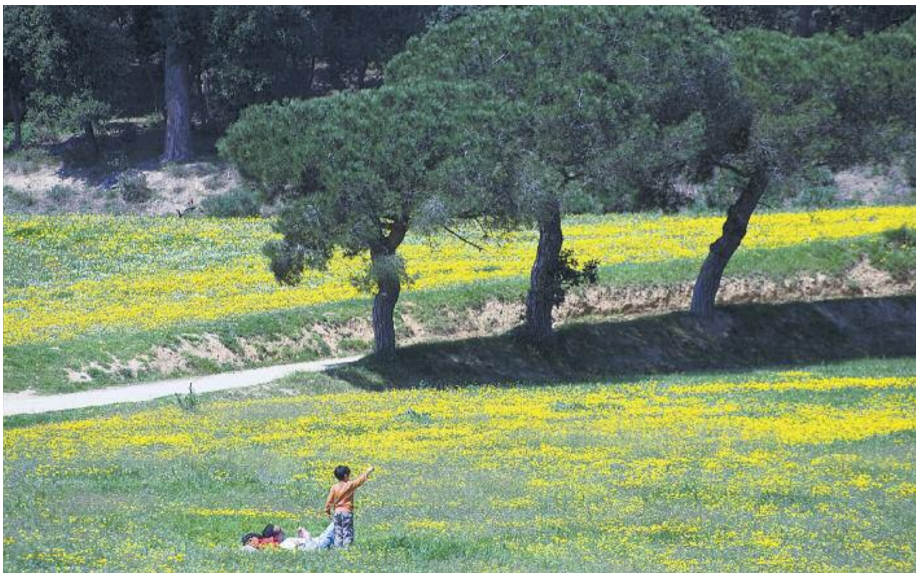
La natura es converteix en l'escenari idíl·lic per fugir de la rutina.

» Al voltant de Barcelona es pot gaudir de la natura en família en més de 150 cases de pagès i allotjaments rurals d'arquitectura tradicional ubicats en petits municipis o en plena natura