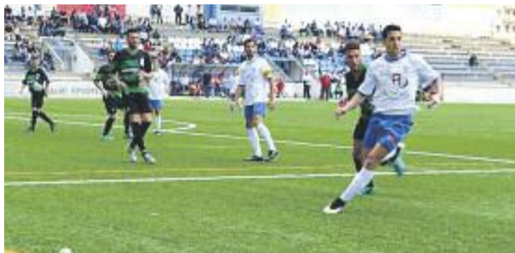
El Sants va empatar fa tres jornades al camp del Granollers.

Amb els números a la mà, el Sants encara pot optar a l'ascens, ja que encara hi ha 12 punts per jugar-se. Els rivals són el Mollet –aquest diumenge a l'Ener-