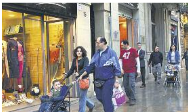
El març també va créixer l'ocupació a Catalunya.

TENDÈNCIA ▶ Fa set mesos que no baixa. Segons les dades de l'Institut Nacional d'Estadística (INE) publicades fa uns dies, les vendes del petit comerç a Catalunya van créixer un 4,6% al mes de març, el que suposa el setè mes consecutiu de pujada de vendes en aquest sector. L'última dada negativa es remunta al mes d'agost, quan la facturació va caure un 0,5%.