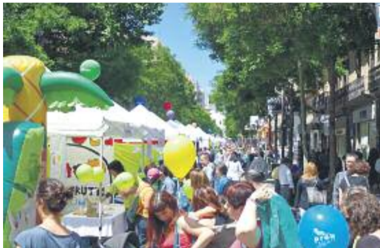
El Firentitats omplirà diferents carrers i espais de Sants.

Al llarg del dia els carrers de Sants i Creu Coberta s'ompliran d'activitats de tota mena i també tindrà el seu protagonisme la cultura popular i tradicional gràcies a la festa 'Fes-te al carrer'. Entre les múltiples activitats que es programaran al llarg del dia, destaquen, entre d'altres, la plantada i cercavila de gegants, la fira d'artesans, la diada castellera o les actuacions dels Diables i Tabalers de Sants. D'altra banda, el mateix dia també se celebrarà la 5a Festa In-