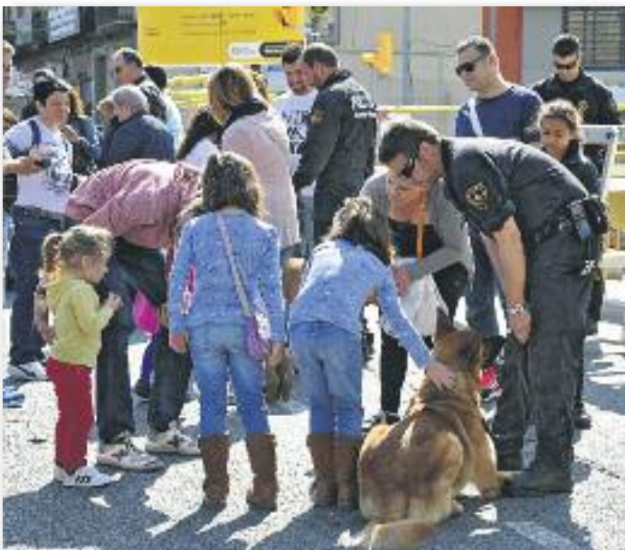
Gossos GUÀRDIA URBANA