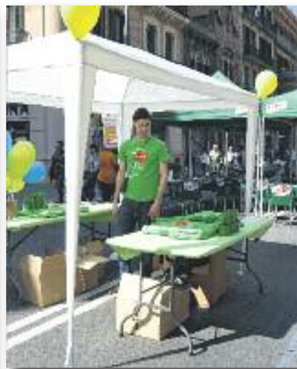
Mercat de Sants