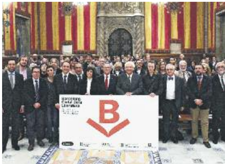
Foto de família dels assistents a l'acte de presentació.

L'Assemblea Nacional Catalana (ANC) ha anunciat recentment que la mobilització independentista de la pròxima Diada tindrà com a objectiu omplir la Meridiana. Aquesta avinguda creua els districtes de Nou Barris, Sant Andreu i Sant Martí. Segons explica la presidenta de l'ANC, Carme Forcadell, la Meridiana simbolitza algunes de les zones on l'entitat no ha aconseguit fer créixer el seu missatge.