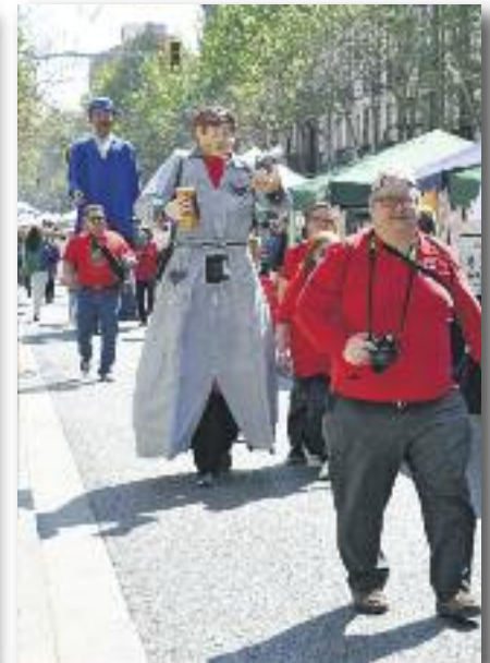
Gegants de Sants