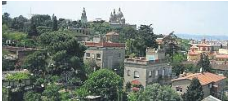
La Satalia conservarà la seva identitat.

El document, que haurà de ser executat pel pròxim govern municipal, concreta el nivell de protecció patrimonial de dife-