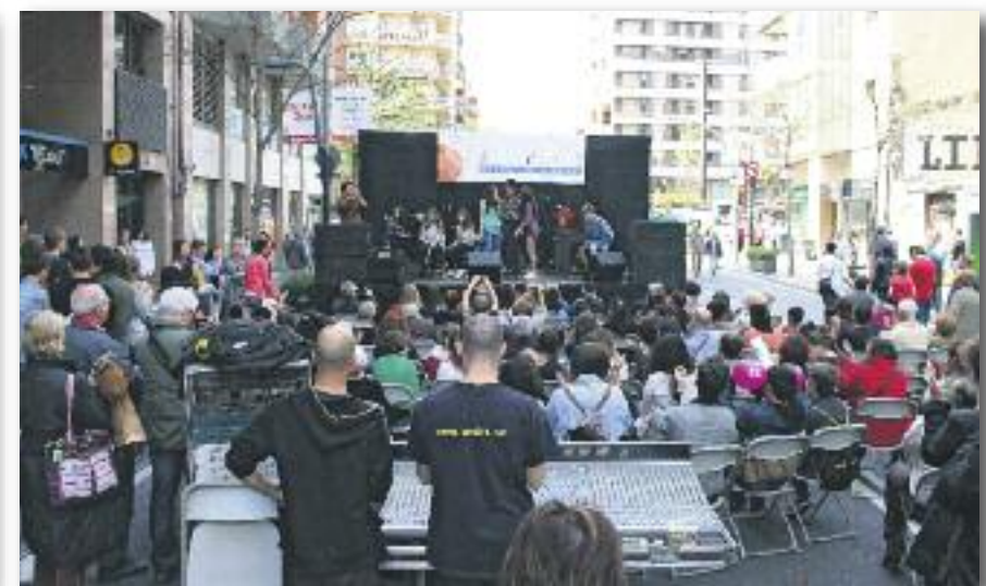
Escola de música Diesi

Si a totes les botigues del carrer de Sants hi aixequéssim un sol edifici, aquest seria tan gran que no hi cabria a la plaça de Catalunya