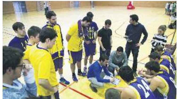
El JAC ha de buscar capgirar la seva mala dinàmica.

BÀSQUET ▶ La jornada 23 de la Lliga EBA es va saldar amb la tercera derrota consecutiva del JAC Sants, en aquest cas a la pista del CB Cornellà (72-63).