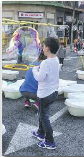
Bombolles de sabó