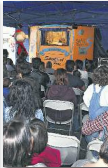
Teatre de titelles