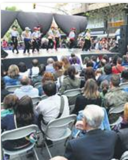
La Urban Dance Factory