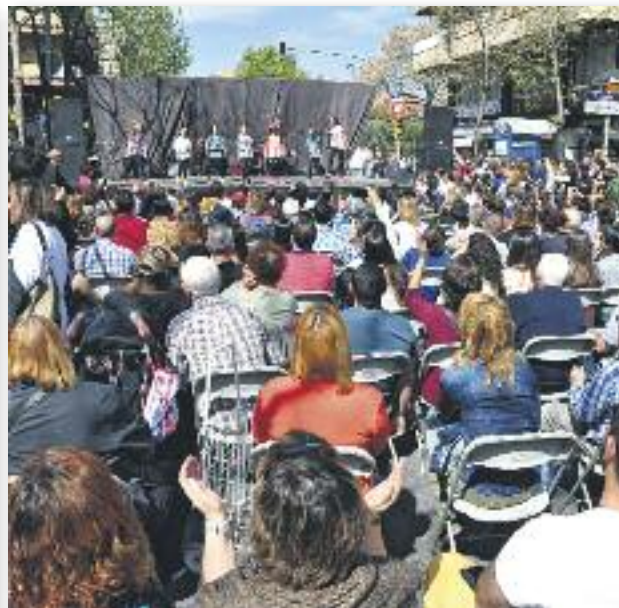
Fàbrica de Somnis