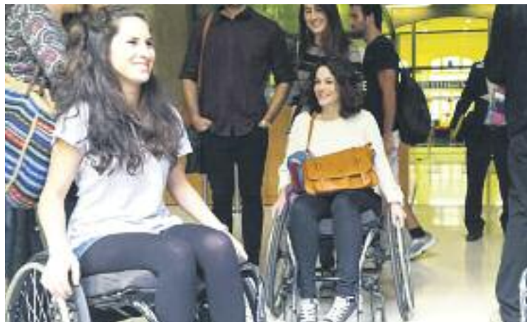
Alguns dels alumnes durant l'anàlisi dels comerços.

Per la seva banda, l'Ajuntament ha presentat les ajudes que es posaran a disposició dels comerciants de l'eix comercial, si així ho volen, per poder corregir les deficiències d'accés a les seves botigues. Aquestes ajudes estaran