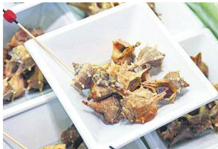
La ruta finalitzarà el pròxim 9 de maig.

Per altra banda, l'entitat també organitzarà demà dia de Sant Jordi una festa a la plaça de la Marina, conjuntament amb la Marina Viva, amb tallers, contacontes, un intercanvi de llibres i una recollida solidària de material escolar.