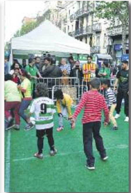
Unió Esportiva de Sants