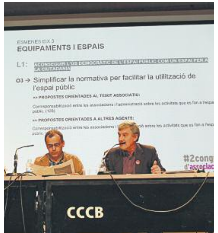
A l'esquerra, integrants d'una associació durant un procés de votació. A la dreta, un congrés del CAB.