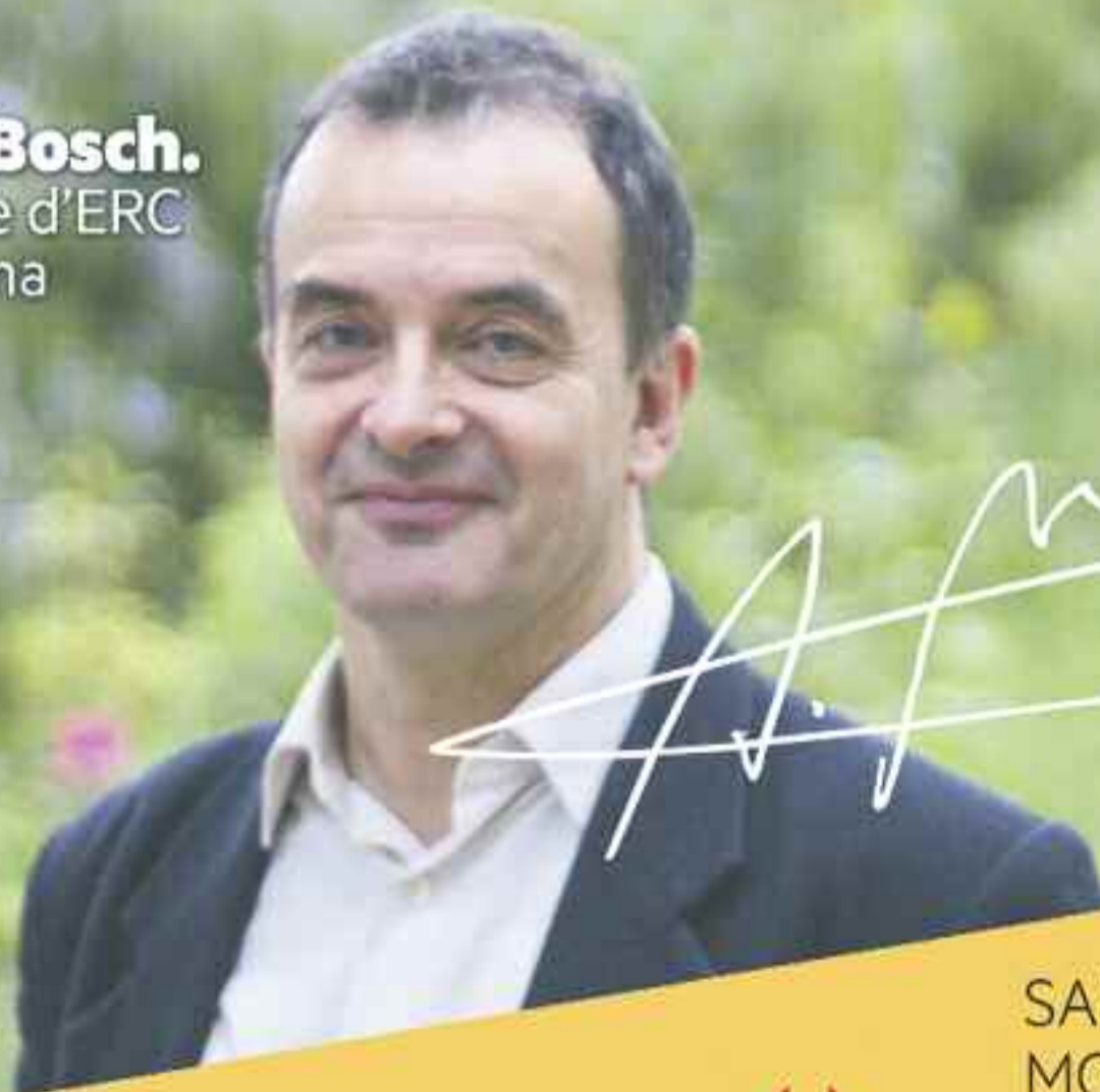
Alfred Bosch. Alcaldable d'ERC a Barcelona