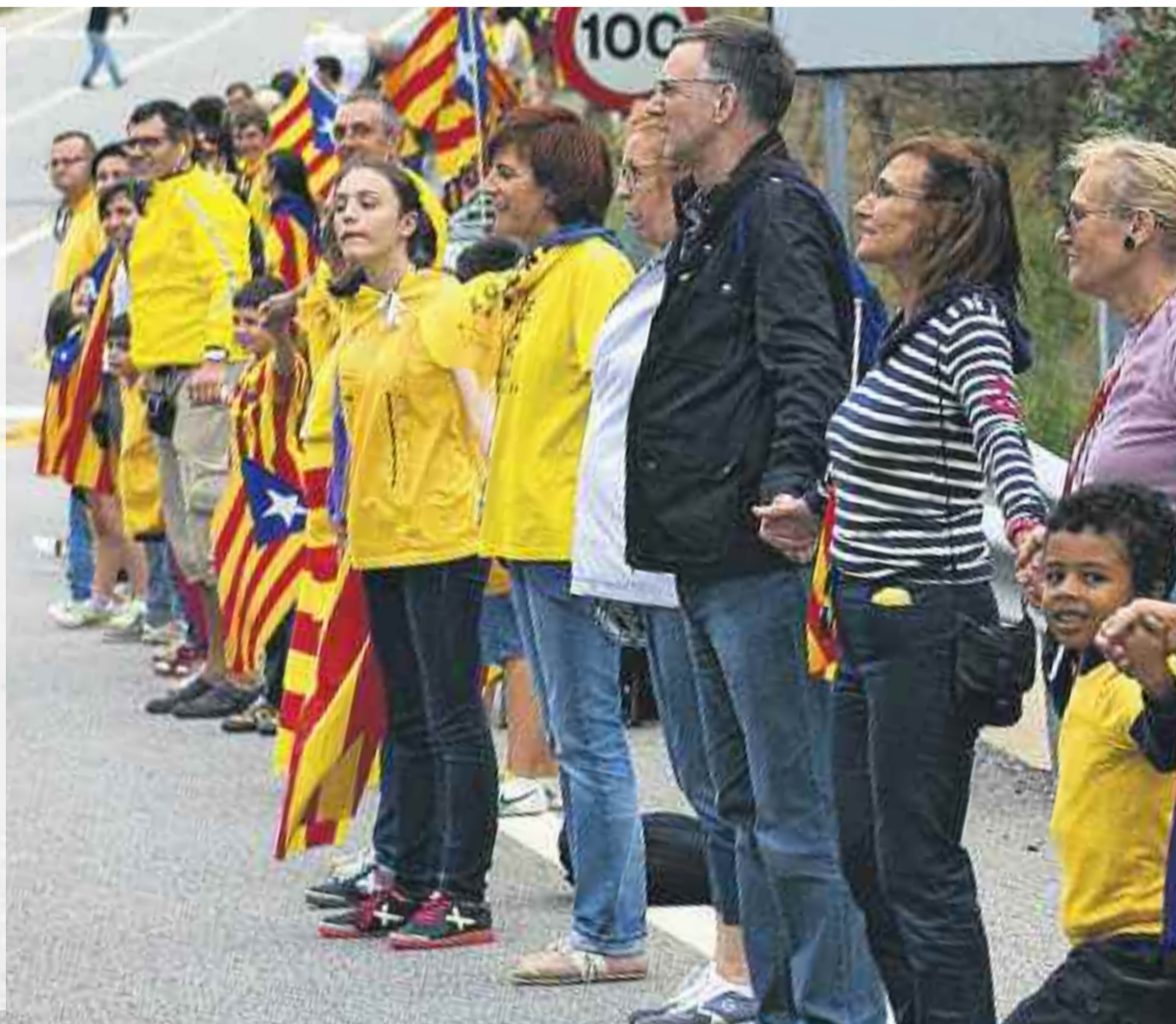
El nou preacord sobre el full de ruta pretén relançar la il·lusió que el procés sobiranista ha despertat en els darrers anys.

4. Culminació democràtica del procés per part del poble de Catalunya.