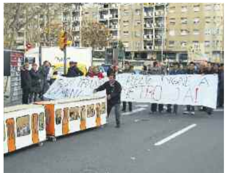
La manifestació va transcórrer per la Gran Via.

Fa dues setmanes els veïns ja van organitzar un altre acte de protesta durant la celebració del Mobile World Congress.