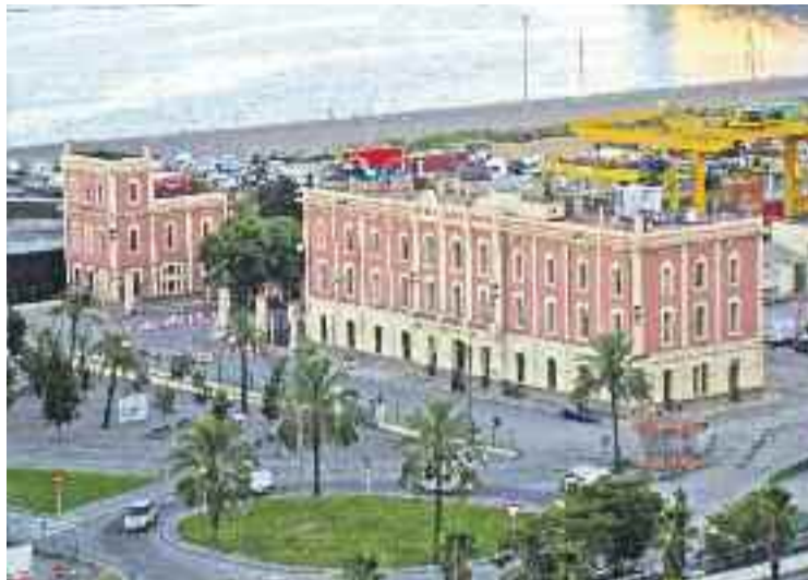
L'estació ferroviària del Morrot es traslladarà a Can Tunis.

El projecte Blau@Ictinea, que durant l'actual mandat no ha tirat endavant al no tenir el suport dels grups municipals, apostava per la creació d'un barri residencial al port que tenia com a objectiu connectar Ciutat Vella amb la Zona Franca, Montjuïc i el barri de la Marina del Prat Vermell. Ara l'Ajuntament vol redissenyar el projecte i convertir la zona en un nou pol productiu