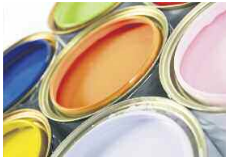
Les obres poden ser fetes amb esprai, pintura o elements naturals.