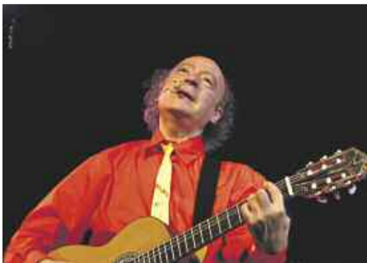
Sisa, un referent de la història de la música moderna catalana.

Un dels aspectes més interessants del llibre és el fet que permet veure com entre el Sisa artista i el Sisa més personal no hi ha pràcticament cap diferència. Un personatge autèntic les 24 hores del dia.