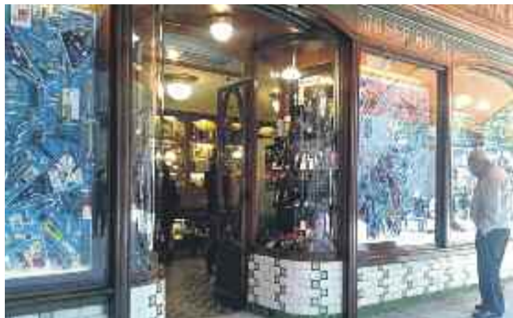
32 botigues tindran una protecció íntegra del seu patrimoni.

Entre les 32 botigues que tindran una protecció integral