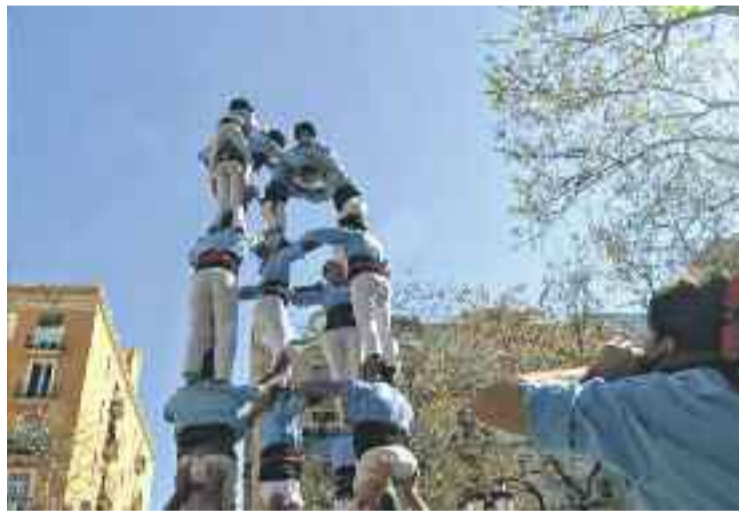
Una actuació dels Castellers del Poble-sec.