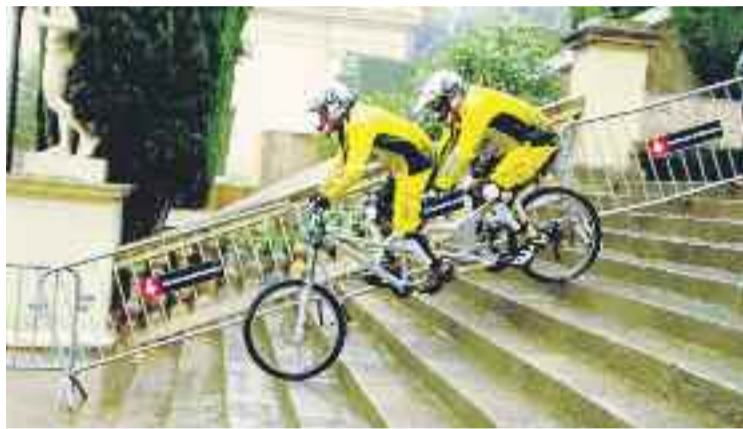
La Down Urban oferirà un gran espectacle.

Pel que fa a Volta, els ciclistes sortiran de l'avinguda Rius i Tauler a dos quarts de 12, passaran per l'Hospitalet i tornaran a Montjuïc, on faran vuit voltes a un circuit. En total, aquesta darrera etapa comptarà amb 123 quilòmetres que decidiran el guanyador de la tercera cursa ciclista més antiga del món, per darrere del Tour i el Giro.