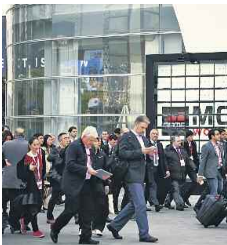
El congrés de cardiologia i el de mòbils són dos dels més importants.