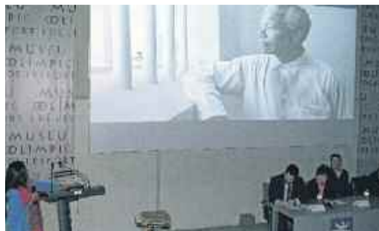
Acte de presentació de l'espai.

HOMENATGE ▶ El Museu Olímpic i de l'Esport Joan Antoni Samaranch compta des de fa pocs dies amb un nou espai dedicat a Nelson Mandela, expresident de Sud Àfrica i un dels símbols de la lluita pels drets humans i contra el racisme.