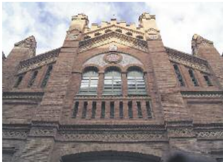
El Mercat de Sants serà un dels escenaris del congrés mundial.

La trobada se centrarà sobretot en les noves tendències en conservació i revitalització dels