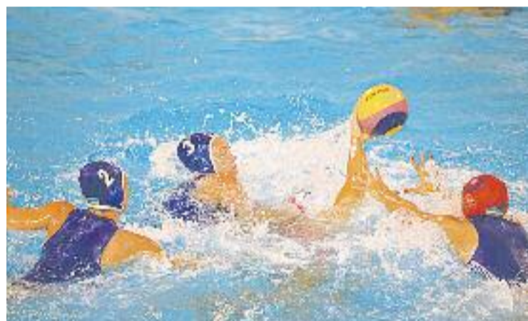
La ciutat tornarà a acollir l'europeu de waterpolo.

WATERPOLO ▶ La setmana passada la Lliga Europea de Natació (LEN), va fer oficial la designació de Barcelona com a seu de la 33a edició del Campionat d'Europa de Waterpolo de l'any 2018. D'aquesta manera, les piscines Picornell seran l'escenari d'un torneig on hi participaran prop de 30 seleccions nacionals masculines i femenines durant dues setmanes.