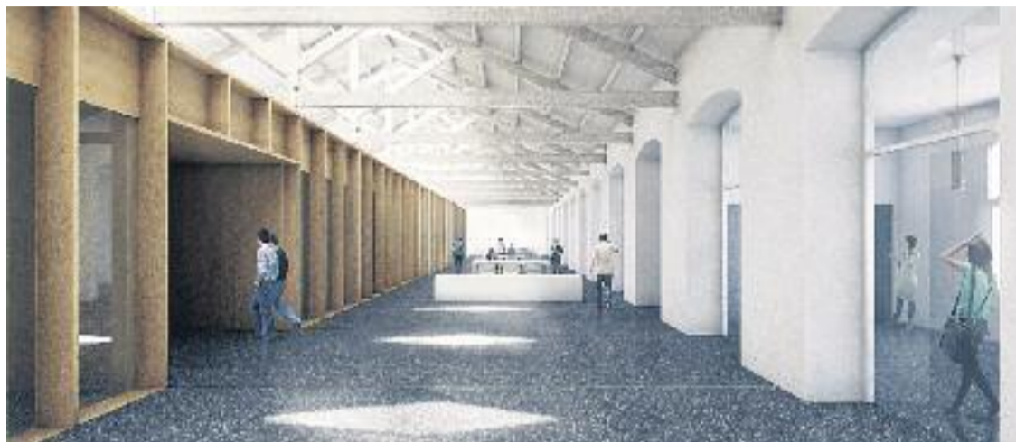
Reproducció virtual de la nova seu de l'EMAV.