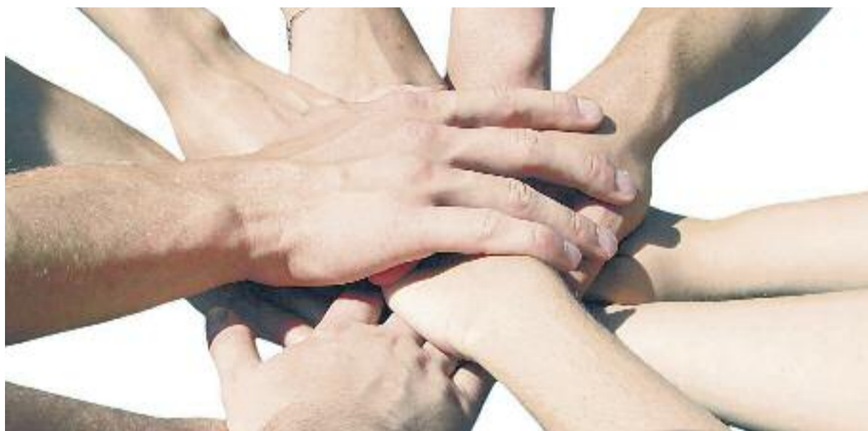
Una de les finalitats de les activitats és crear lligams i amistat entre els nens.