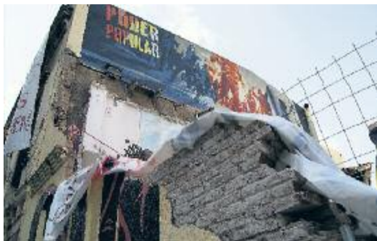
Can Vies, després del desallotjament de l'any passat.

Can Vies, que recorda que "durant la setmana posterior als aldarulls vam recollir 2.000 firmes de veïns que volen acabar amb el problema de Can Vies", explica que la plataforma s'ha reunit amb tots els partits polítics amb representació a l'Ajuntament i afegeix que, amb algun matís, "tots tenen clar que Can Vies haurà d'anar a terra per acabar un projecte que tots van aprovar". Avui la plataforma es reuneix amb la Síndica, que està recollint informació per a un futur informe.