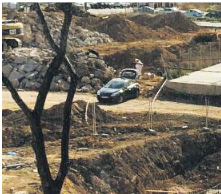
Imatge de la zona on es va trobar el cadàver.

Fonts properes a la investigació, segons va avançar TV3, van apuntar que el cos podria ser el d'una prostituta que va desaparèixer fa unes cinc setmanes, tot i que de moment aquesta hipòtesi no ha estat confirmada.