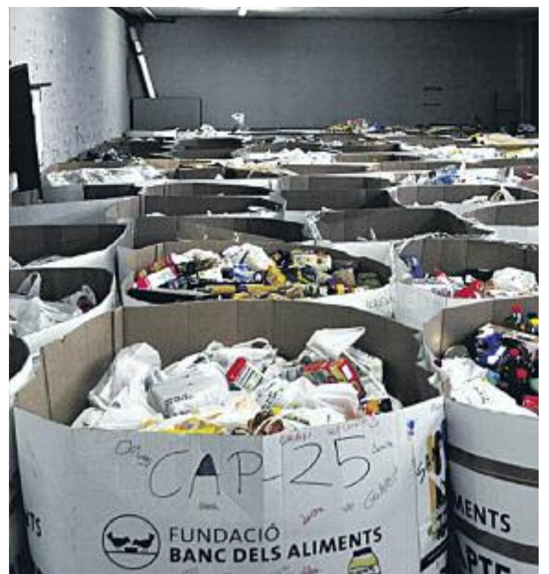
Imatges de la primera edició del Gran Dinar celebrat a Ciutat Vella el passat novembre (esquerra) i del Gran Recapte d'Aliments (dreta).