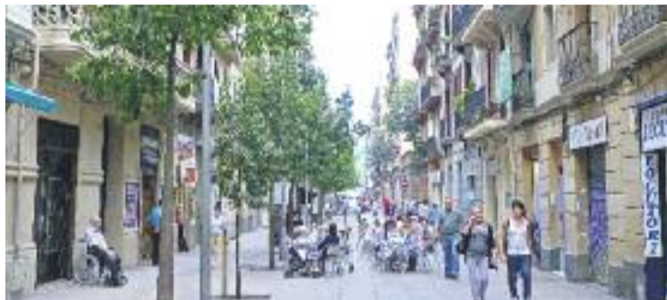
El carrer Blai, un dels punts problemàtics del nou pla.

El nou pla, consensuat amb les entitats i les associacions del barri, preveu suspendre la concessió de llicències a allotjaments turístics (hotels, apartaments i pensions) amb una moratòria fins al setembre de 2016, tot i que ara, durant tres mesos, es podran presentar al·legacions. Això, però, es farà en funció de l'amplada dels vials i de la densitat de la zona corresponent, que el pla delimita en tres àrees diferents: a l'alta (carrers de Blai, Blesa, Nou de la Rambla i Vila i Vilà) estarà prohibida la