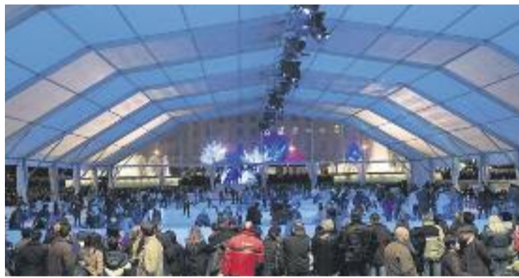
Els botiguers van repartir 600.000 vals de descompte per a la pista.

OCI ▶ Per quart any consecutiu, BarGelona, la pista que ocupa cada Nadal la plaça Catalunya a iniciativa de la Fundació Barcelona Comerç, ha augmentat en visitants i usuaris, tal com informa la fundació.