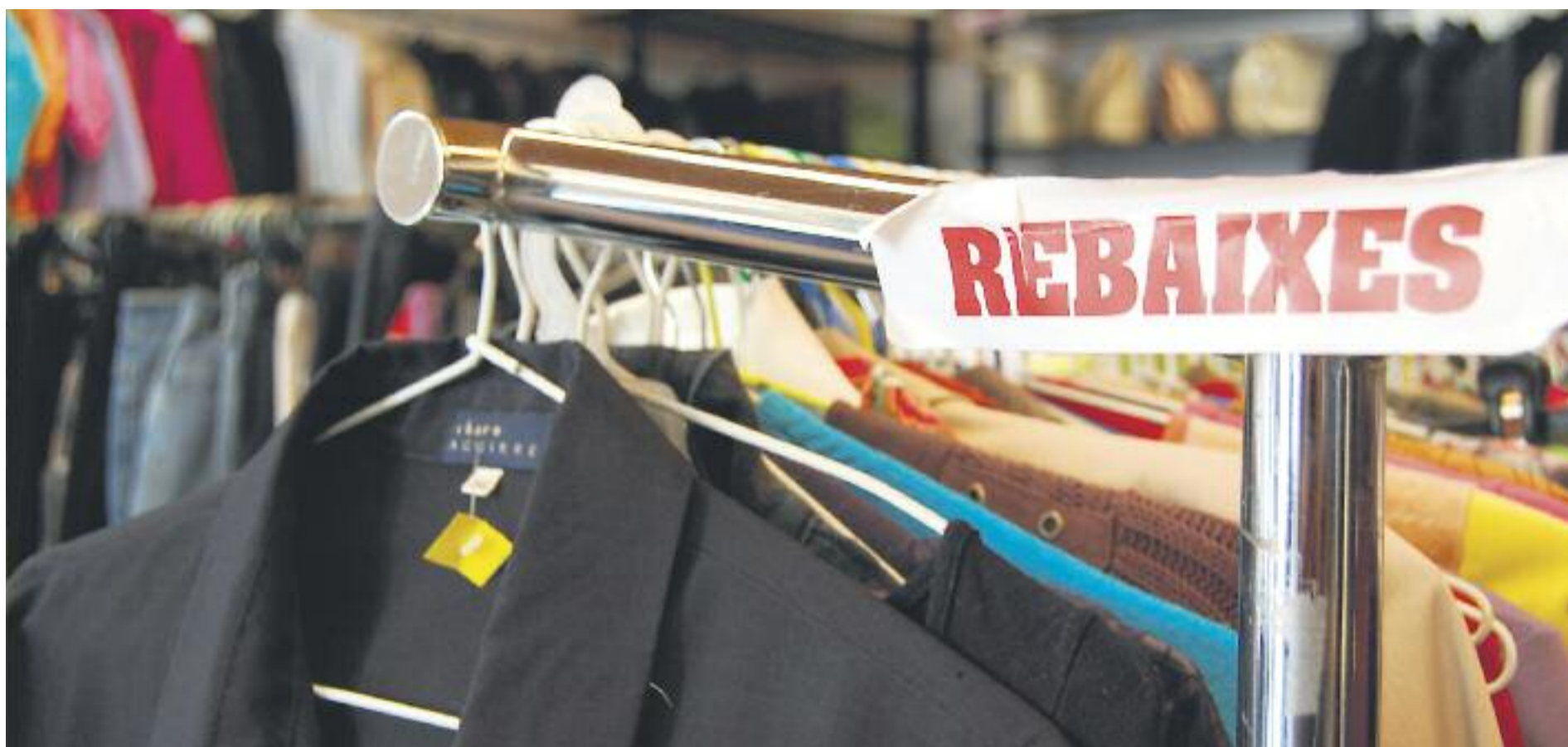
El comerç preveu una facturació de 825 milions d'euros durant les rebaixes d'hivern.