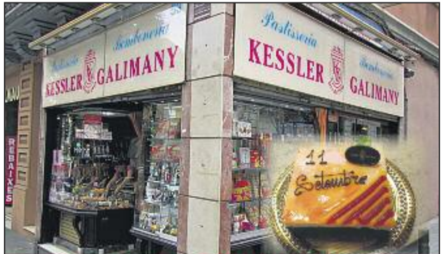
C/. Sants 53 · Telf. 934 210 920