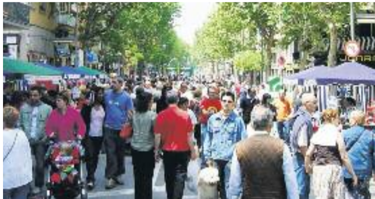
A Sants, fins ara ja s'han adherit 27 botigues a la iniciativa.

L'Ajuntament espera que de cara al 2016 prop de 4.000 comerços de la resta d'eixos de la ciutat estiguin geolocalitzats al