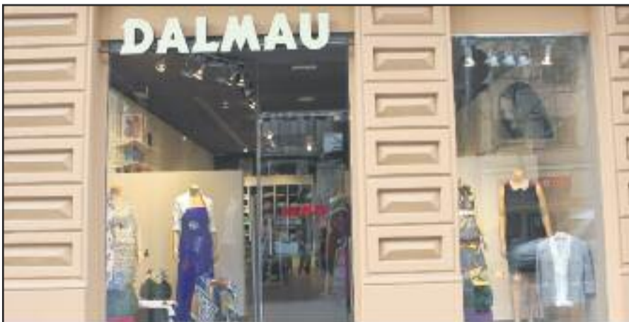
Botiga DALMAU C/ Sants, 51. Telf. 93 421 09 27 www.botigadalmau.com

Podeu veure el documental complet en vídeo: www.carrerdesants.cat