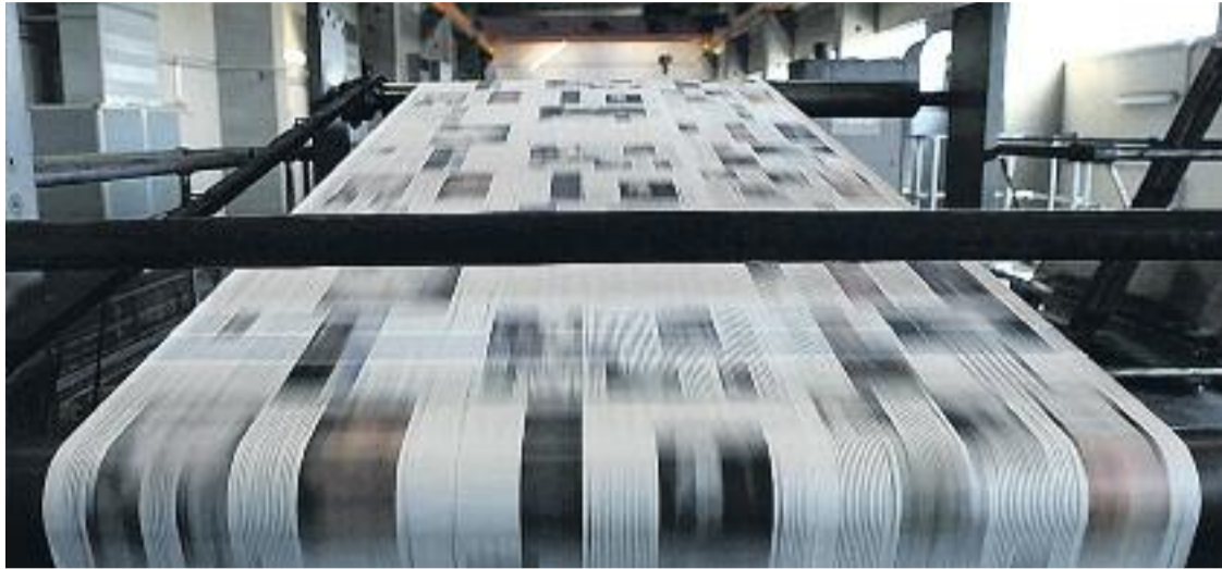
Línia és la capçalera gratuïta local no diària amb més difusió de Catalunya.