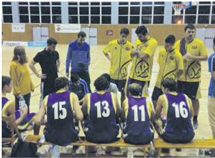
El JAC està demostrant un alt nivell en el seu primer any a EBA.

L'enfrontament contra el Cornellà va estar molt igualat, amb parcials molt ajustats que van oferir un gran espectacle per al públic que va presenciar el