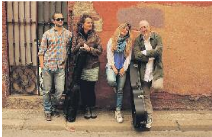
El grup Darània tocaran el 20 de març a l'Albareda.