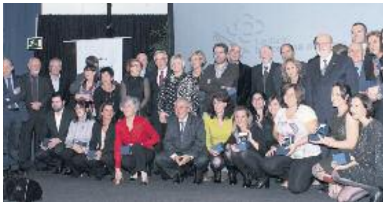
Foto de família dels dinamitzadors guardonats.

» L'organització premia la tasca dels 18 dinamitzadors dels eixos que la conformen durant un sopar commemoratiu de celebració