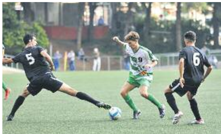
La UE Sants venia de perdre les dues anteriors jornades.

FUTBOL ▶ El Sants rebia diumenge passat el Granollers, líder indiscutible de Primera catalana, després de patir dues golejades contra el Vic –1 a 5 a casa– i contra el Lloret –4 a 1 a domicili–. El futbol, però, no és cap ciència exacta, i els santsencs van aconseguir doblegar el Granollers per 2 gols a 0, en un partit marcat pel gol matiner de Felip Sáez, que va enganyar tothom amb una bona finta després de rebre una pilota llarga d'Arbulu. A partir d'aquí, els de Tito Lossio van encarar el