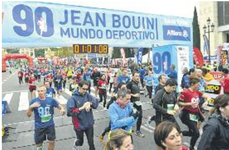
La prova pren el nom de l'atleta francès d'inicis de segle XX.

La prova també serà la 65a edició del Trofeu Internacional Ciutat de Barcelona, els 32ns