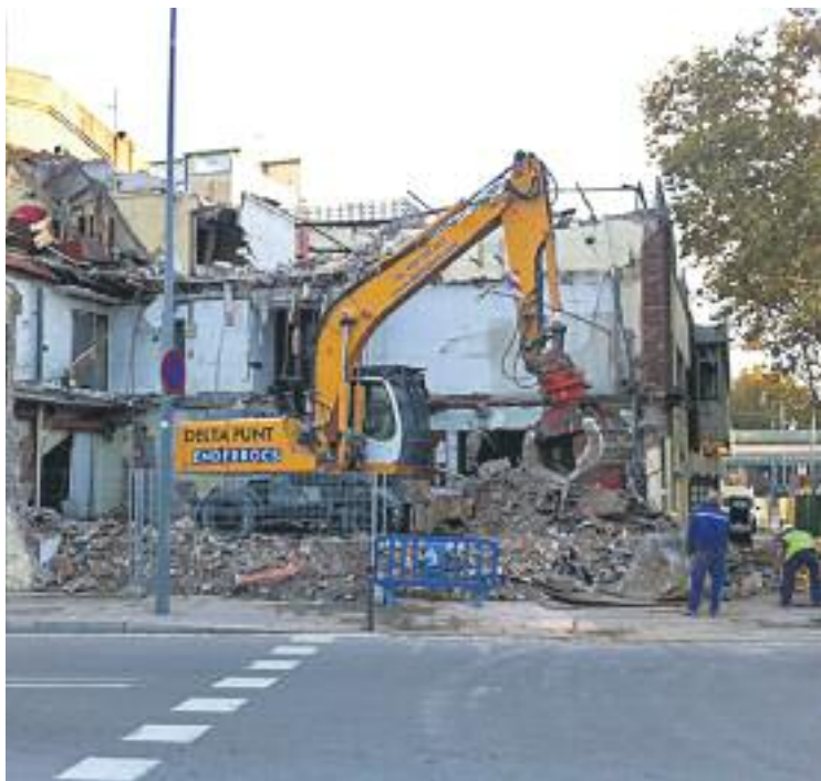
L'enderrocament va començar fa una setmana.