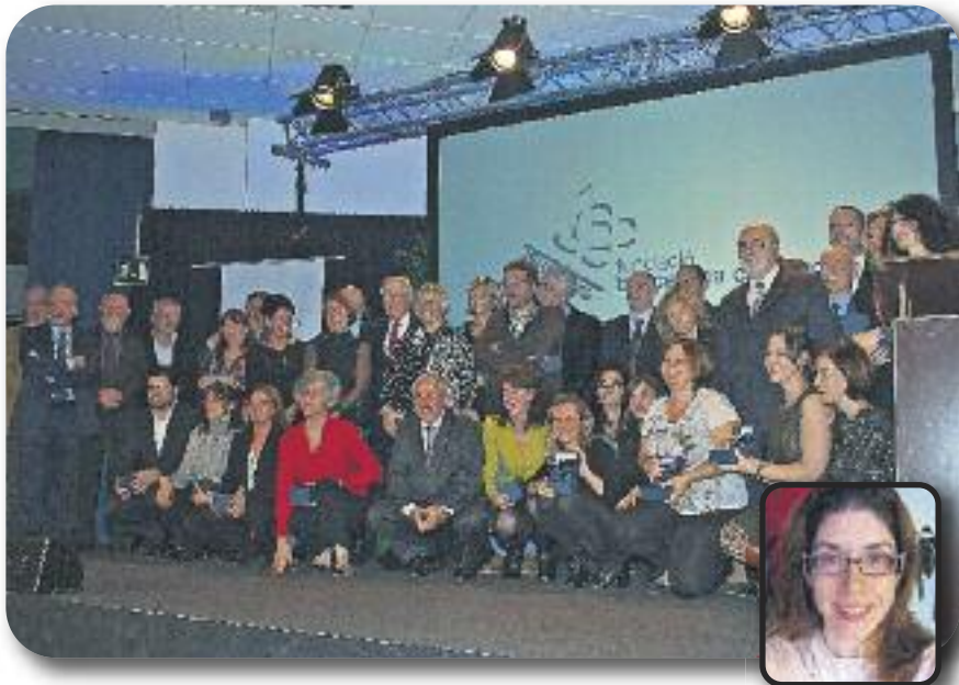
La Fundació Barcelona Comerç, en l'acte de celebració del desè aniversari, premia els dinamitzadors de tots els eixos comercials de la ciutat.