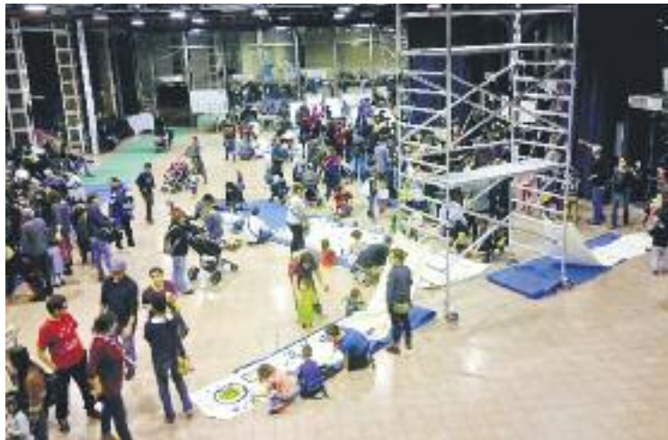
Grans i petits van poder gaudir d'aquesta trobada.

El Secretariat d'Entitats de Sants, Hostafrancs i la Bordeta, encarregat d'organitzar aquesta trobada, va dissenyar una jornada amb l'expressió plàstica com a denominador comú. El centenar d'assistents, dels quals molts eren famílies amb els seus fills petits, van poder gaudir de diferents espais on pintar, fer figures de fang, drapet i altres expressions artístiques. Segons