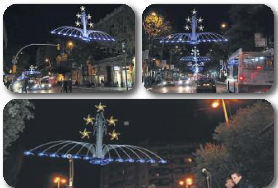
El divendres 21 de novembre s'inaugura l'encesa de l'enllumenat de Nadal al Carrer de Sants. Les fonts de Montjuïc amb moviment seran els motius d'enguany.

El Racó de Sants, tradició i cultura cervesera des de 1985