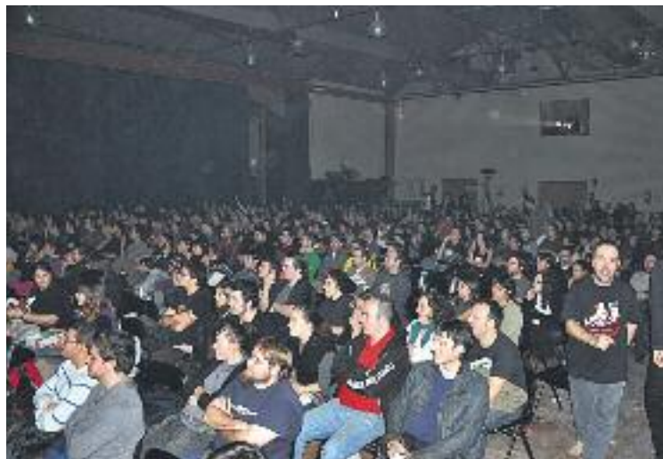
Una imatge de la mostra de l'any passat.