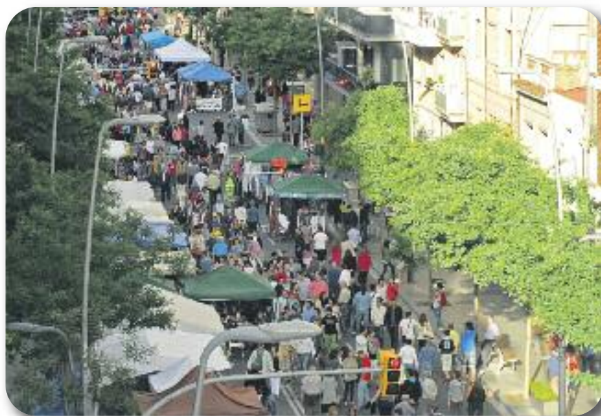
El pròxim dissabte 29 de novembre, se celebrarà la 1ª Fira de Sants-Badal "nit fosca" a la rambla Badal, amb la participació destacada de comerços de l'entorn del carrer de Sants.