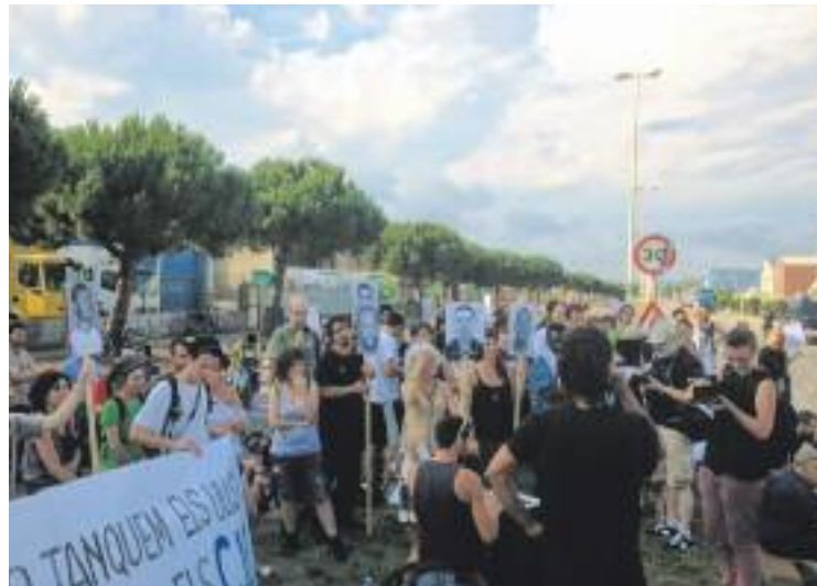
Imatge d'una protesta a favor del tancament del CIE.

A l'informe, doncs, l'organisme destaca les quatre morts que s'han produït al CIE, dues de les quals van ser per suïcidi, una per un infart i, una altra, per malaltia. Sobre aquestes dues últimes, el document s'hi refereix com a "extremadament infreqüents en homes joves". Deixant de banda les quatre morts, les conclusions de l'informe són d'una contundència palpable i denuncien que "l'existència dels Centres d'Internament d'Es-