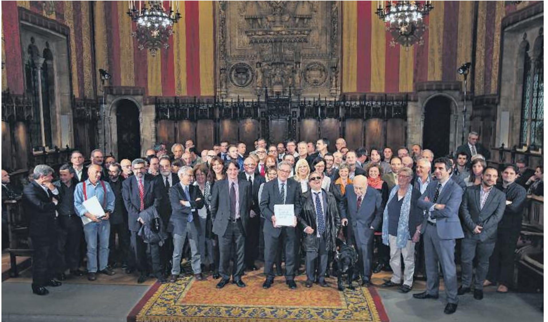
Foto de família de l'acte de presentació del Llibre Blanc al Saló de Cent, el passat dimecres 5 de novembre.

El Llibre Blanc incorpora una primera part dedicada a l'estat de la ciutat, una anàlisi elaborada pel Gabinet Tècnic de Programació de l'Ajuntament de Barcelona. En aquest apartat s'hi pot trobar tota mena de dades que permeten, segons els seus autors, fer-se una idea acurada de com va la ciutat.