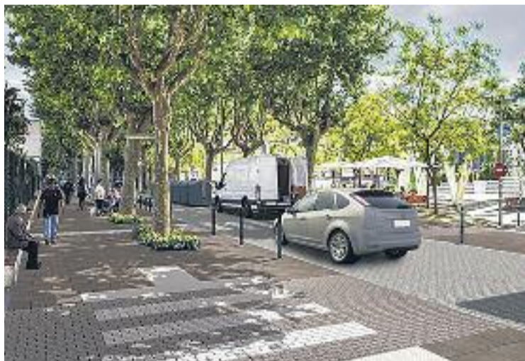
Imatge virtual de la Gran Via després de les obres.

És una mesura que intenta compensar les possibles molèsties ocasionades als clients a l'hora d'anar a comprar a la zona. Quan un carrer està en obres, fàcilment perd clients potencials, ja que el trànsit de persones i vehicles que circulen per la via disminueix. Per aquest motiu, l'Ajuntament ha decidit promoure la zona de la Gran Via i facilitar el desplaçament amb vehicle privat.