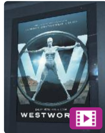
Westworld Jonathan Nolan i Lisa Joy

La segona temporada de Westworld , un dels darrers grans èxits d'HBO, ja s'ha començat a emetre.