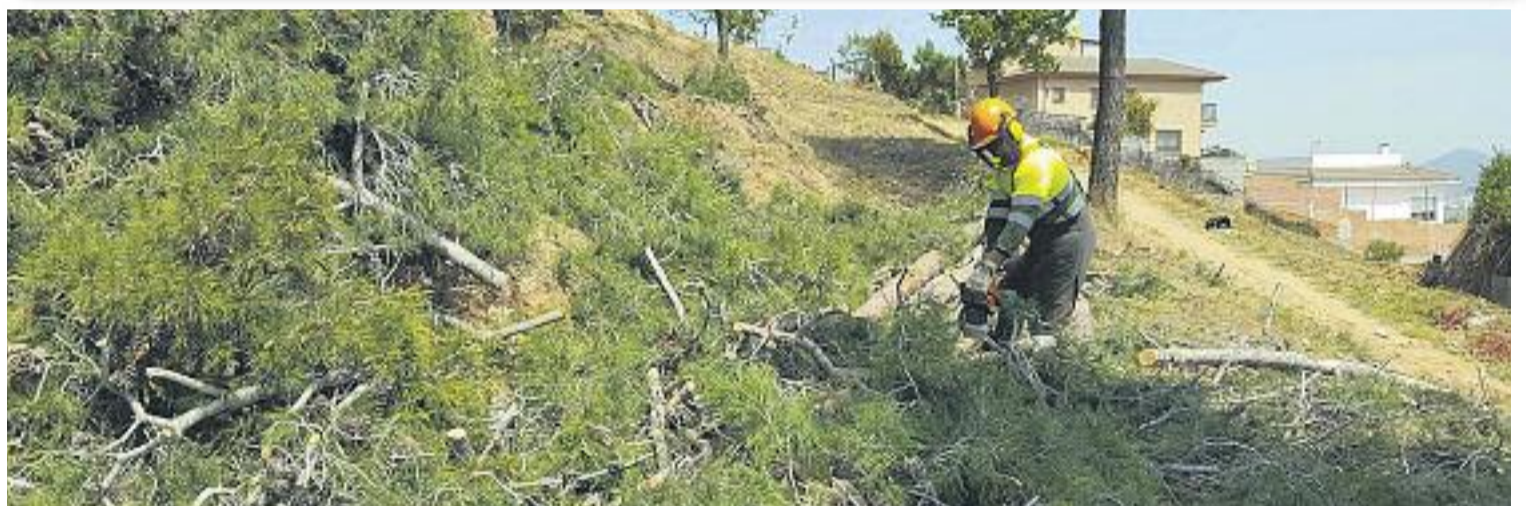
Creació d'una franja de protecció en una urbanització de Cervelló (a sota).

els vials i en la neteja vegetal de les parcel·les interiors. El conjunt d'aquestes accions suposen una millora en la seguretat de persones i béns davant d'incendis forestals i una millora de les condicions de seguretat que tindran els equips d'extinció en cas d'incendi.