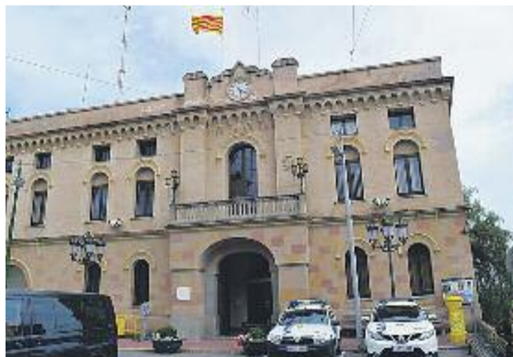
La ràtio d'endeutament actual és del 98,34%.

La contenció, en termes de gestió municipal, per reduir el deu-