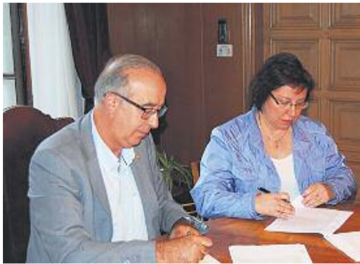
L'acord es va formalitzar el 18 de maig del 2017.

El projecte preveu que el futur teatre compti amb un aforament per a unes 250 persones. Per altra banda, també es duran a terme actuacions que contemplin l'ampliació de l'escenari i la creació de nous camerinos i un magatzem.