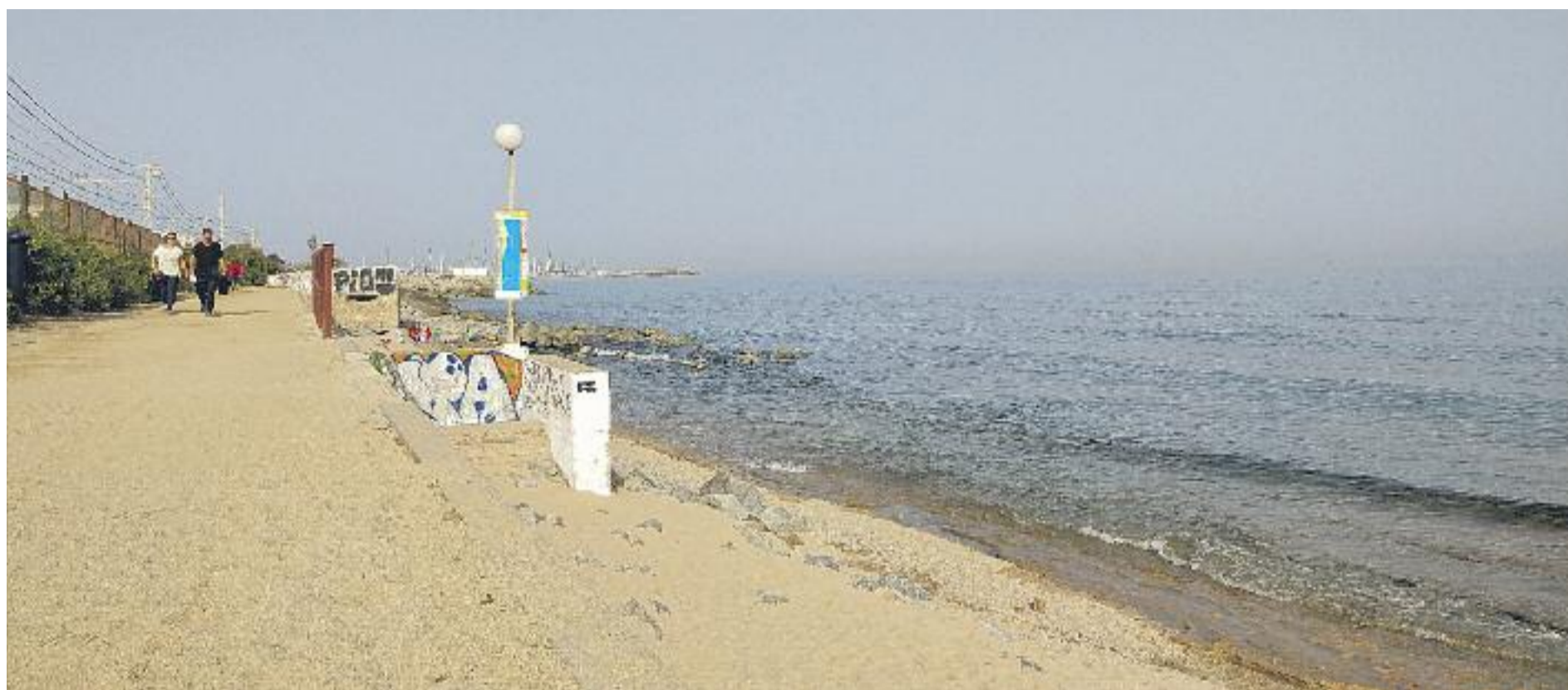
Les platges del Baix Maresme pateixen una erosió constant que les deixa sense sorra.