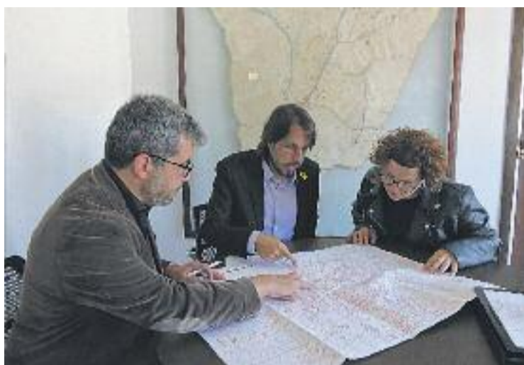
La cartografia està feta amb tècniques fotogramètriques.

En aquest sentit, tot i que es va produir abans de l'actualització de la cartografia topogràfica del municipi, l'Ajuntament va dur a terme la petició per part d'alguns