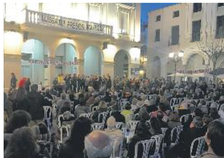
Els veïns es reuneixen el dia 2 i 16 de cada mes.

Els veïns de Vilassar es concentren el dia 2 i 16 de cada mes, davant les portes de l'Ajuntament, per mostrar el seu rebuig als empresonaments.