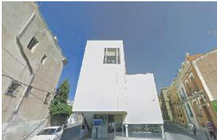
Les consultes d'habitatge es deriven a l'OLHM.

HABITATGE ▶ L'Ajuntament del Masnou ofereix un servei per assessorar tothom que tingui alguna consulta en matèria d'habitatge. Ho fa a través de l'Oficina Local d'Habitatge (OLHM) -situada al carrer Roger de Flor- i que de manera gratuïta atén els dubtes i preguntes a l'hora de sol·licitar subvencions, informar-se sobre lloguers i promocions o gestionar consultes i tràmits.