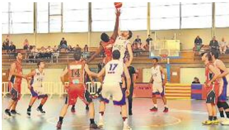
El salt inicial del partit a la pista del Mataró Boet.

El Pavelló Castell d'en Planes de Vic serà l'escenari d'aquesta Final a Quatre, que es disputarà durant el primer cap de setmana del mes de maig. El primer rival dels masnovins, depenent de la posició en la qual tanquin la temporada, serà el CB Vic o el Pardiniyes, que són els dos equips del grup C-B que ja han certificat la presència en la fase definitiva del curs. L'altre classificat del grup C-A serà el Menorca.