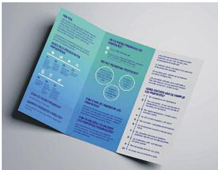
Hi haurà un taller per facilitar la generació de propostes el 3 de maig.

hauran de suposar una nova inversió, i no una despesa de manteniment, i haurà de ser una competència directa de l'Ajuntament. Si no, quedarien totalment descartades.