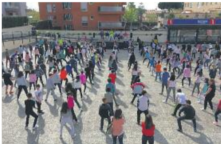
Una de les activitats va ser la classe conjunta de capoeira.

El programa de la caminada serà el mateix que el que hi havia previst: començarà a les 10 des de dos punts diferents -des