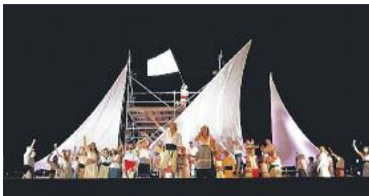
Una imatge del Desembarcament.

Les Eufòries, els Desembarcaments, l'Atracabars, la Cursa a pèl, la Nit de colles, la Remuntada i la Ruixadeta són alguns dels actes que s'organitzen de manera conjunta. Si l'Ajuntament no aconsegueix re-