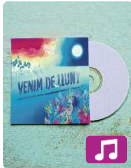
Venim de lluny Doctor Prats

Doctor Prats és una de les formacions de trajectòria més intensa del panorama musical català. El passat 11 d'abril van complir tres anys com a banda i el pròxim 4 de maig publicaran el seu tercer disc, Venim de lluny .