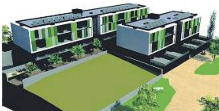
El projecte de Can Nolla requereix l'aprovació de la Generalitat.

A més, Triadó afegeix que en aquests moments a Premià "no hi ha més habitatge social". El batlle remarca que l'Ajuntament