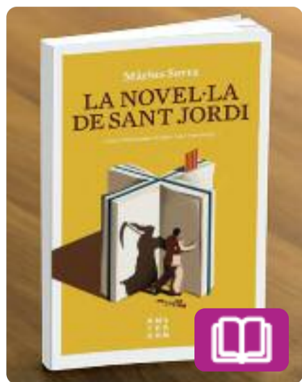
La novel·la de Sant Jordi Màrius Serra

Ambientada en el primer Sant Jordi d'una República Catalana, Serra ofereix un retrat satíric del món editorial on una sèrie de crims tenyeixen la diada en un bany de sang.