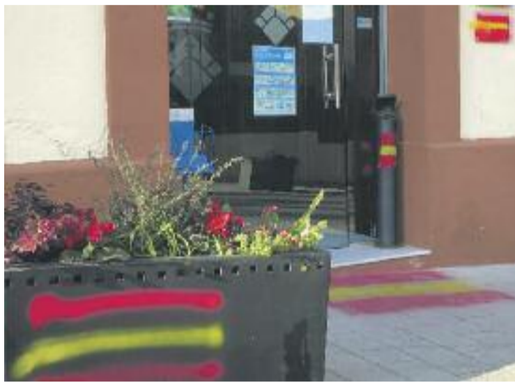
Les pintades es van fer la nit del 5 d'abril.

Més enllà de la connotació que pugui tenir el missatge en forma de grafiti, es tracta d'un acte vandàlic i, a més, en un edifici públic.