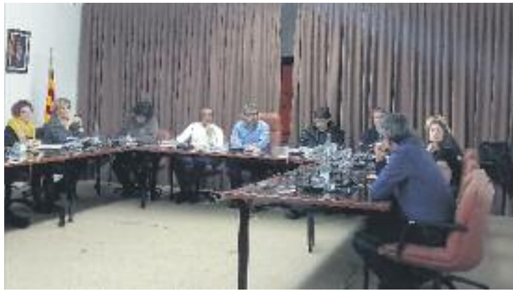
El Pla d'Equitat i Gènere va ser aprovat per unanimitat.

A més, es potenciaran les accions de sensibilització als dife-