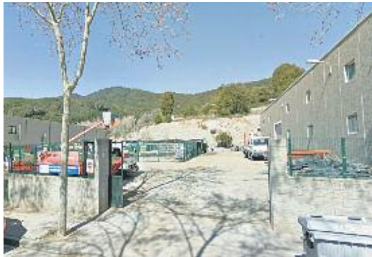
L'edició d'enguany inclou la gestió del refugi d'animals.

Així mateix, en funció de quin equipament es tracti, també hi tenen a veure les entitats del municipi o diferents particulars. En aquesta línia, el responsable de la regidoria, Miguel Doñate, assegura que per continuar gaudint dels equipaments municipals, "hem de tenir cura d'aquestes instal·lacions el conjunt de la ciutadania". Precisa-