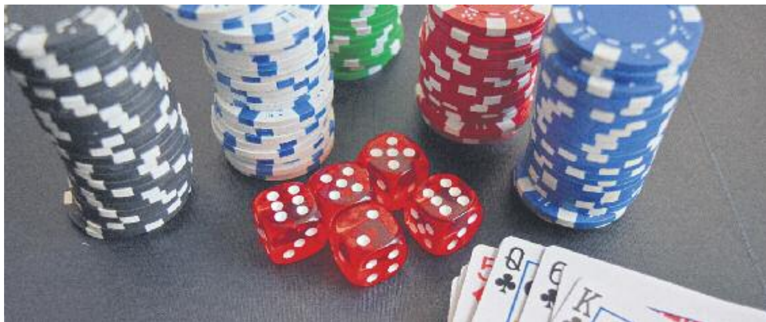
Jugadors Anònims fa trobades amb persones que pateixen ludopatia per ajudar-les a frenar la malaltia.