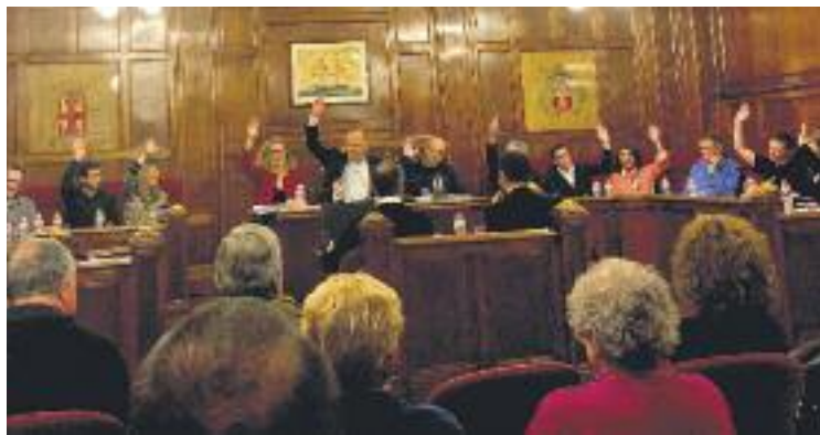
El Ple va aprovar la mesura el 15 de febrer.

Pel que fa a nou consorci amb l'AMB, es garanteix una inversió de 13 milions d'euros amb l'objectiu principal de desencallar el projecte de l'Illa Centre, al costat de la qual hi ha prevista la construcció d'habitatges de protecció oficial. A banda, l'acord amb l'ens metropolità també permet tirar endavant la promoció de pisos a l'antiga caserna de la Guàrdia Civil. Entre aquests dos projectes, el