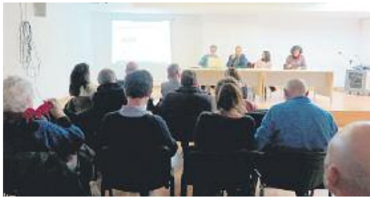
Les dues parts van presentar l'acord el 8 de febrer.

En total, el pressupost s'enfila fins als 20,8 milions d'euros.