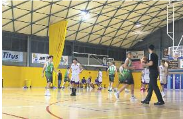
Els homes de Laita són els més regulars de la lliga EBA.

Els masnovins van tancar el febrer visitant una pista emblemàtica, la del Sant Josep de Badalona, i durant el març afrontaran quatre partits en els quals, si obtenen bons resultats, podrien encarrilar la seva presència a la post temporada. El primer d'aquests serà a casa, el dia 3, con-