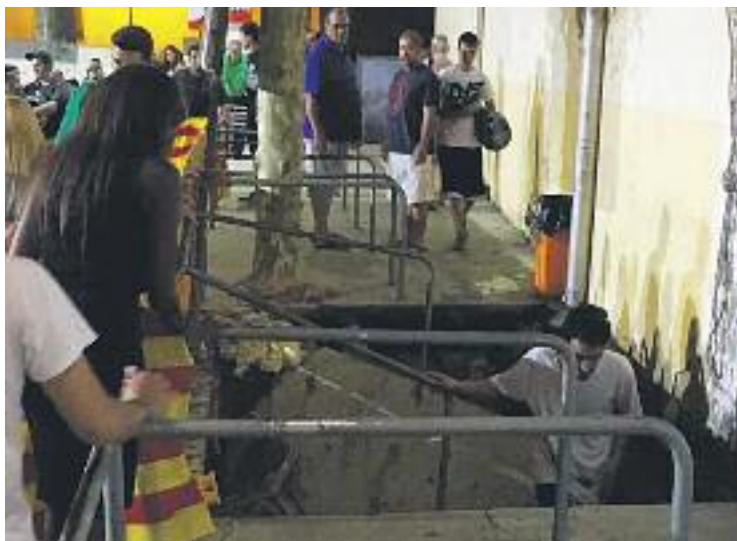
L'accident del 2016 va acabar amb 12 ferits lleus.

D'aquesta manera, s'ha donat llum a un projecte força protagonista en els darrers mesos. La pista és un equipament situat al centre del poble, just davant de La Palma, i té accés pel Passeig de la Riera.