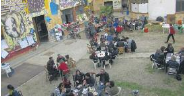
Can Sanpere continua pendent de l'expropiació.

Qui sí que ha presentat recurs és Josel, que es considera perjudicada per no haver pogut edificar als terrenys de Can San-