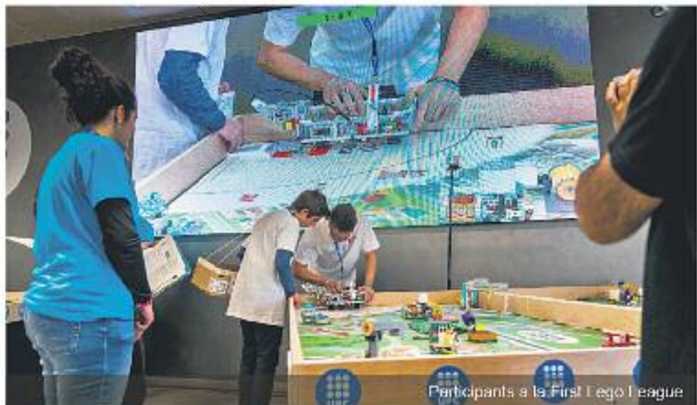
Participants a la First Lego League

Hi ha diferents premis i guardons per als concursants de les diferents fases. Aigües de Barcelona hi col·labora amb el guardó 1r premi al Projecte Científic com a agent coneixedor i impulsor de la gestió eficient del cicle integral de l'aigua. També