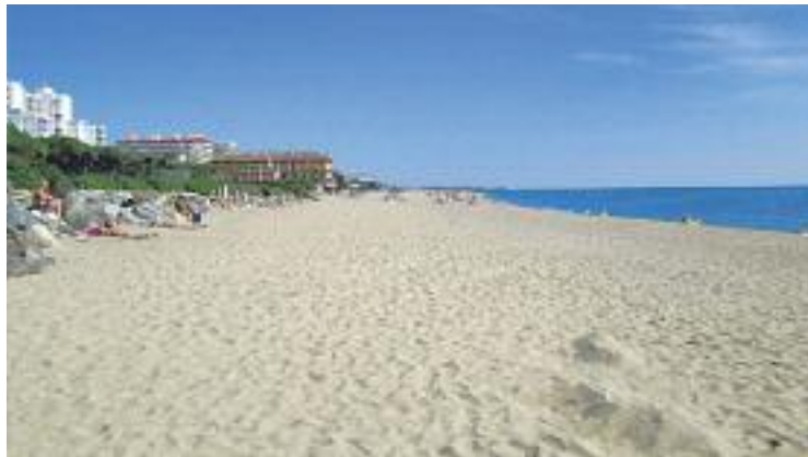
El tram recorrerà tota la costa maresmenca.

TURISME ▶ El camí de Sant Jaume passarà oficialment pel Maresme a partir del 29 d'abril. Aquesta és la data triada per obrir el tram d'aquesta ruta a la comarca. Cada any desenes de milers de persones fan un camí que acaba a la cripta de l'apòstol Jaume, ubicada a la cripta de la Catedral de Santiago de Compostel·la a Galícia. De fet, durant el 2017 el camí va batre el seu rècord absolut i més de 300.000 peregrins van arribar a Santiago a través d'alguna de les rutes establertes.