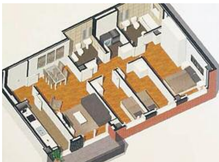
Els habitatges compten amb pàrquing i traster.

Un cop es dona per acabada la seva edificació, ara és el torn dels ciutadans.