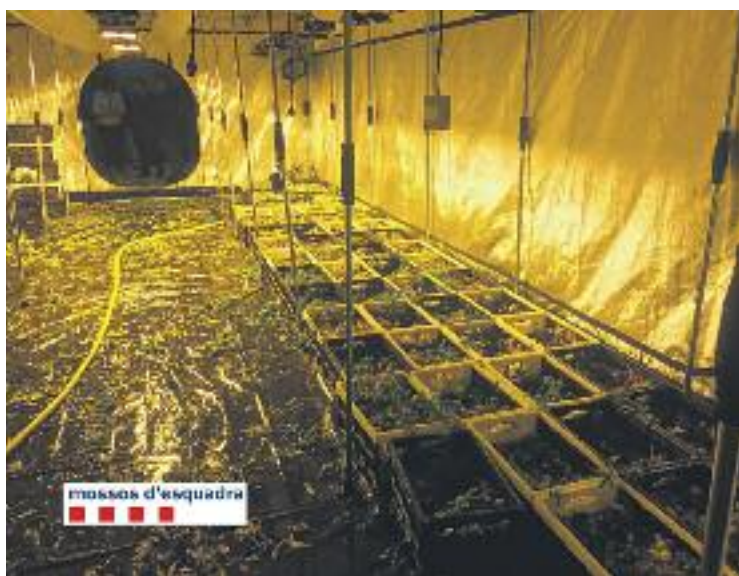
El detingut està a l'espera del seu judici.

D'aquesta manera, van poder analitzar l'entorn de la nau in-