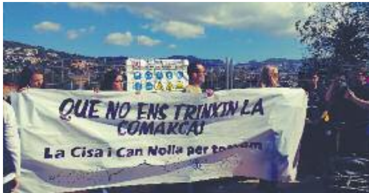
La Plataforma per la Cisa s'oposa al projecte.

A banda de la Cisa i Can Nolla, el govern municipal també manté la intenció de construir habitatges a Can Vilar.