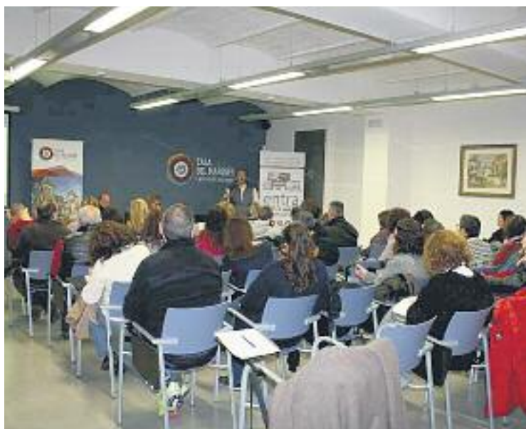
La presentació es va fer a la Casa del Marquès.

L'Ajuntament ha assumit el cost d'adhesió a Ofer.cat i tot i que Ofer.cat cobra entre un 5 i un 3% sobre cada unitat venuda en línia, a diferència de les grans plataformes no obliga a arribar a aquest últim pas, sinó que el venedor pot optar per altres fórmules com la reserva,