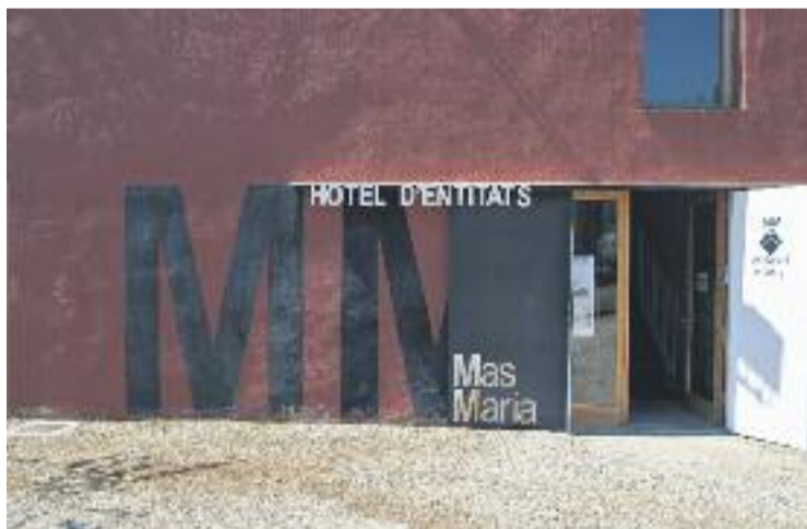
Es farà un parc a l'entorn de l'Hotel d'Entitats.

La segona categoria agrupava aquells projectes que podien requerir inversions de fins a 5.000 i la proposta guanyadora ha estat la de dignificar i embellir la Riera de Cabriils. El projecte contempla incorporar vegetació de tot tipus