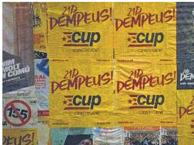
L'Ajuntament assegura que depurarà responsabilitats.

El material requisat serà retornat a aquesta formació política, que agraeix al consistori que hagi decidit depurar responsabilitats.