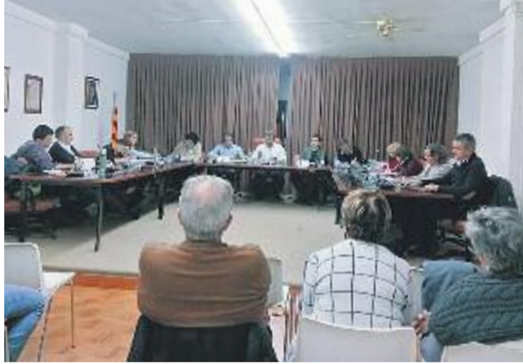
Una imatge del darrer Ple municipal.

Els comptes municipals també inclouen un fons de contingències, que ascendeix a 235.000 euros, per a possibles imprevistos que puguin sorgir al llarg de l'any. El capítol de despeses de personal s'incrementa un 2,20% per l'increment de l'1% de les retribucions i la creació d'una plaça d'informàtic.