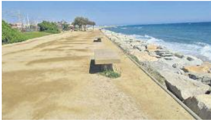
El Masnou, l'únic del Baix Maresme que ha respost.

Fonts del Consell Comarcal relativitzen la poca resposta obtinguda fins ara per part dels municipis i preveuen que tot i que el termini establert per a les adhesions finalitzava el 15 de desembre, en el pròxim Consell d'Alcaldes, més municipis ma-