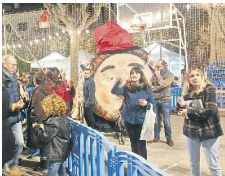
El Masnou ja es prepara per a la seva fira.

A Vilassar de Mar la fira corresponent ja s'ha celebrat. Va ser durant el primer cap de setmana de desembre i l'Ajunta-