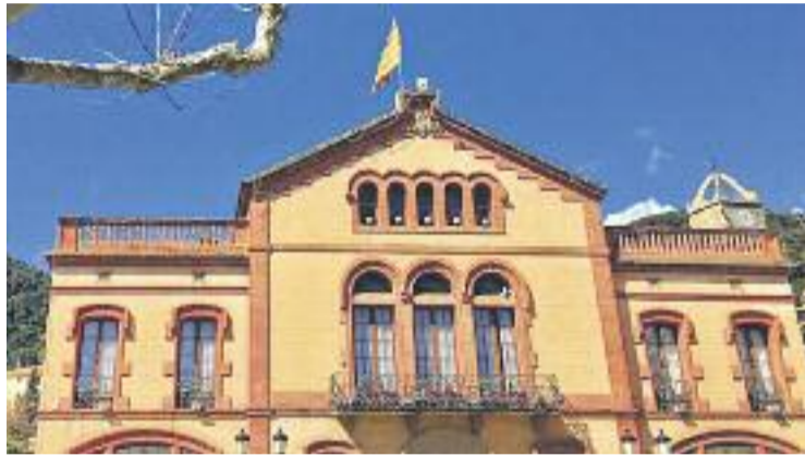
L'edifici acollirà espais de coworking i un hotel d'entitats.

Per Triadó, l'ajuntament vell haurà de funcionar com una "incubadora" que doni cabuda a