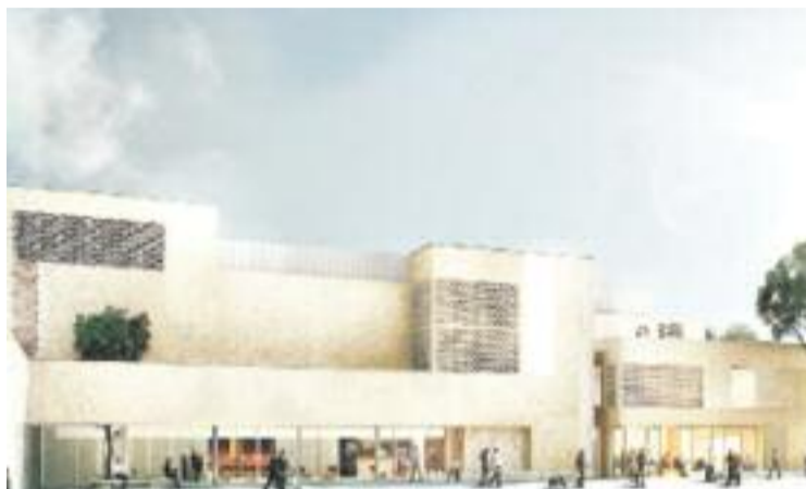
L'edifici se situa al carrer de la Santa Madrona.

A més, la votació popular es farà per primera vegada per