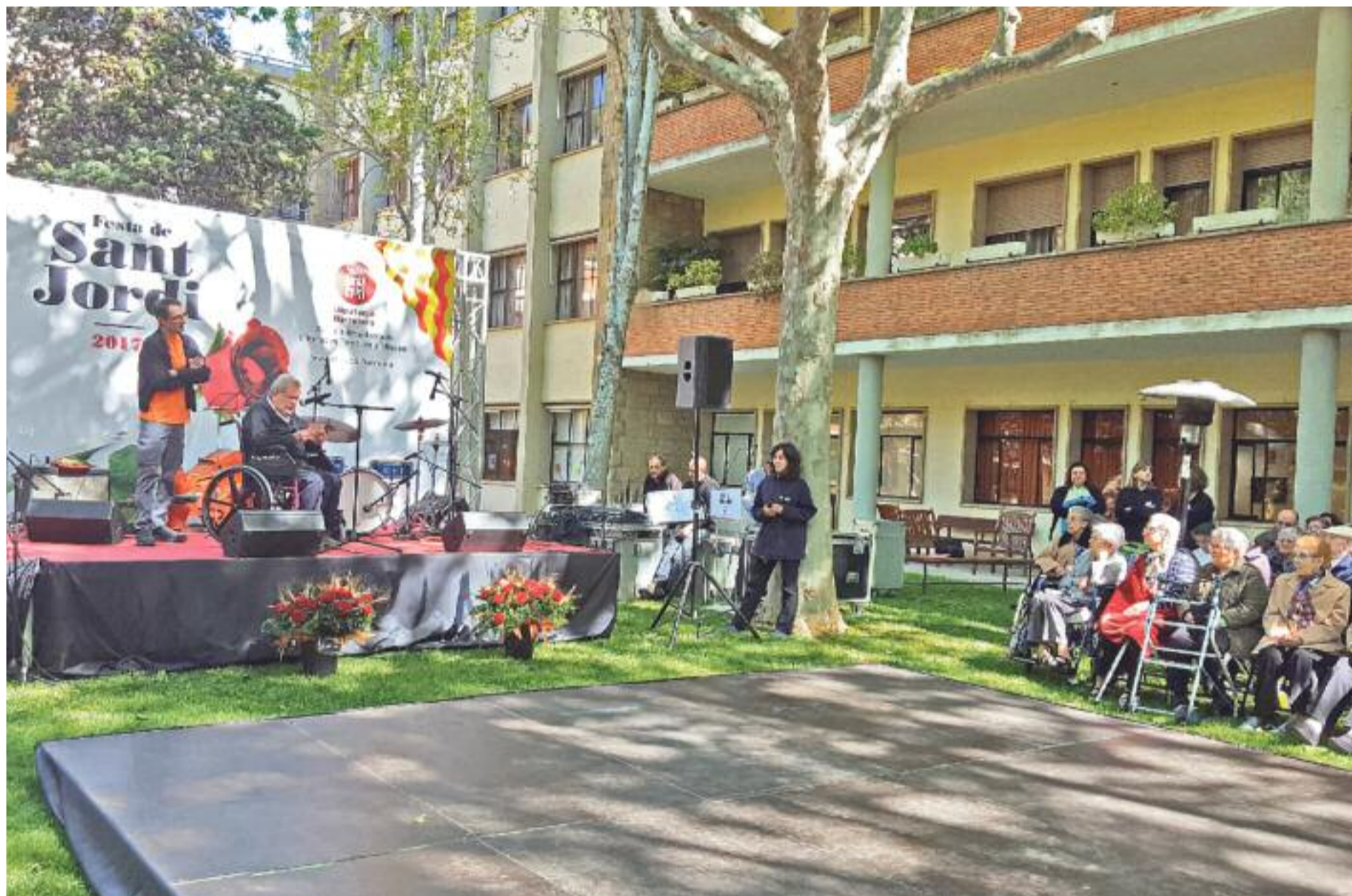
Celebració de la Diada de Sant Jordi 2017 al Respir

» La Diputació ofereix el servei d'acolliment temporal Respir per a persones dependents » Se'n poden beneficiar els més grans de 65 anys o amb discapacitat intel·lectual