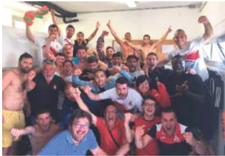
La segona meitat de lliga del Masnou està sent notable.