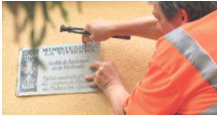
Les plaques es van retirar el 10 de maig.

Un cop retirades les plaques d'habitatge, encara queda feina per fer en altres camps. Per exemple, a l'hora de canviar els noms