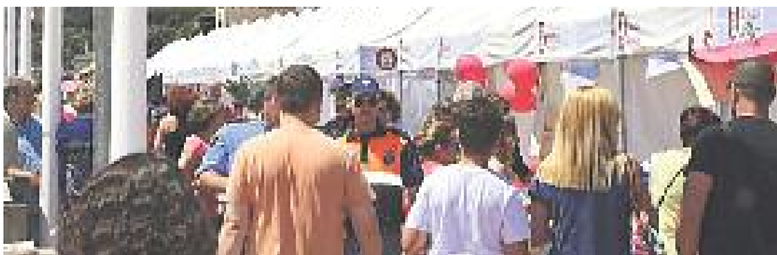
La fira és una activitat consolidada al Masnou.