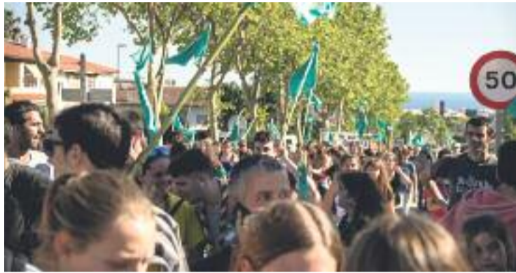
La Plataforma per la Cisa no cessa en les seves demandes.

LA JORNADA DEL 13 DE MAIG D'altra banda, pel que fa a les mobilitzacions, el regidor de la Crida a Premià de Dalt i membre de la