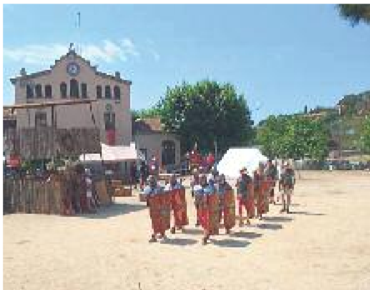
L'anterior Fira Iberoromana va batre la xifra de visitants.