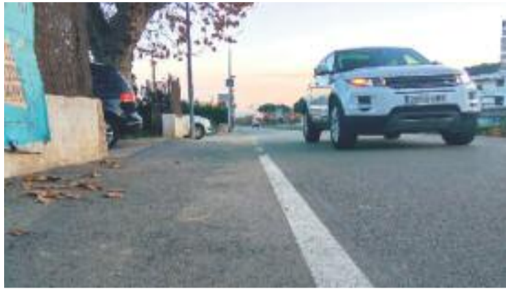
Una imatge d'arxiu de l'Avinguda Santa Helena.

Finalment hi haurà un procés de democràcia directa on els nois i noies de Cabris hauran de decidir on invertir els 5.000 euros. Per altra banda, el regidor de