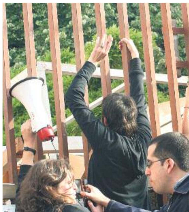
Uns 200 veïns van participar en la concentració per evitar el desallotjament el 5 de maig.