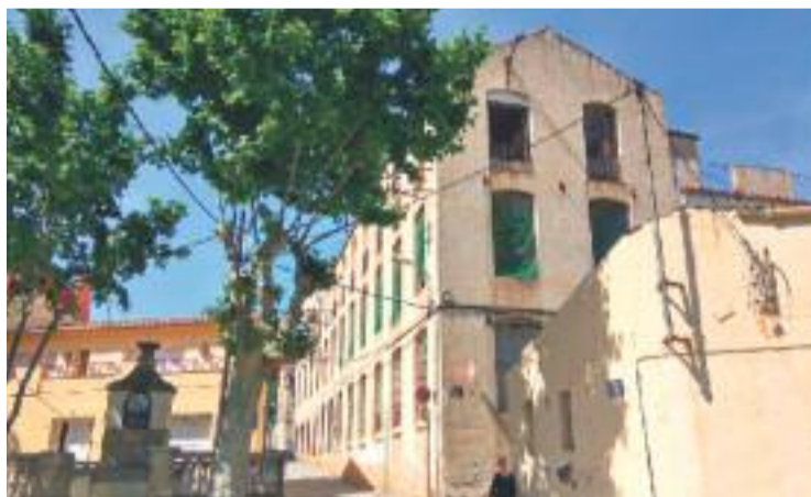
Cal Garbat acollirà la primera prova del Revela-T 2017.

PARTICIPACIÓ MOLT ELEVADA De fet, no només hi ha hagut un elevat nombre d'artistes que s'han presentat, sinó que també