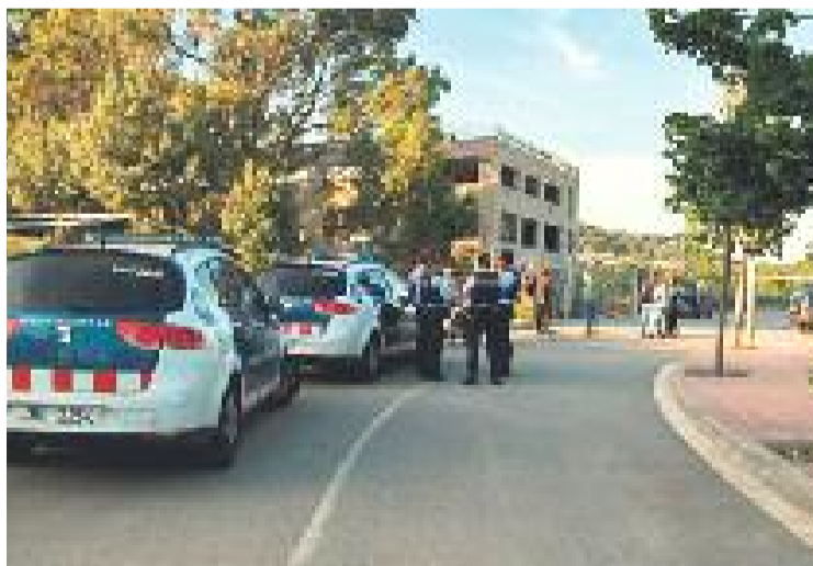
Els adolescents van entrar a una fàbrica d'alumini abandonada.

Ara, el consistori espera que la propietat acabi amb el tancament perimetral de la fàbrica. En aquest sentit, a part de tancar la finca, els propietaris hauran de tapiar totes les obertures situades a la planta baixa per evitar l'accés a la propietat. Si els propietaris no complissin amb aquest requeriment, l'Ajuntament es