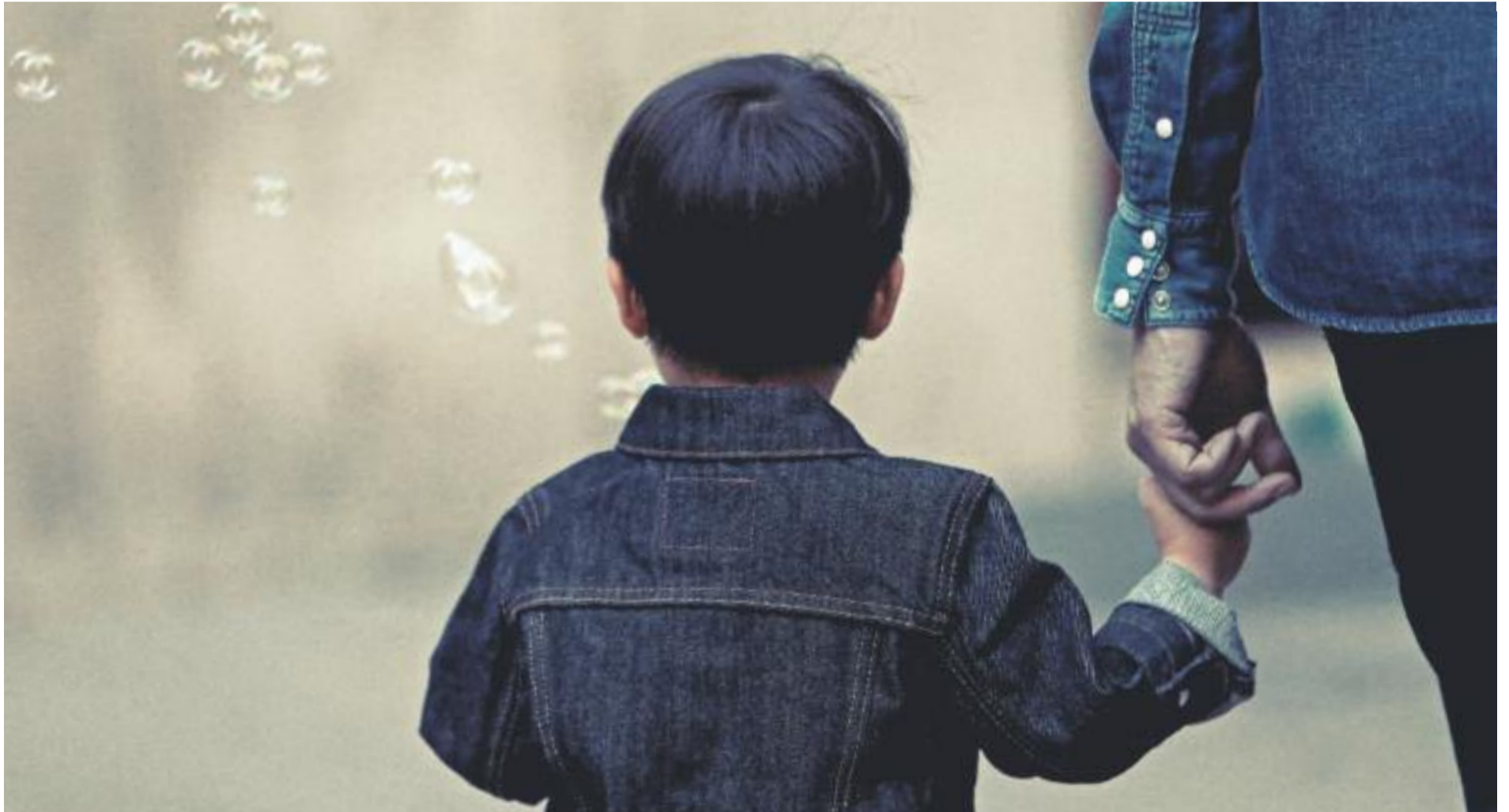
El Departament de Treball, Afers Socials i Famílies ha dissenyat un pla per aconseguir més famílies d'acollida.

» La Generalitat busca un centenar de famílies acollidores per a nens i nenes d'entre 0 i 6 anys