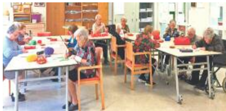
Usuaris del Respir a les instal·lacions del Recinte Mundet de Barcelona

DADES ▶ Durant l'any passat, el programa Respir va atendre un total de 3.300 usuaris.