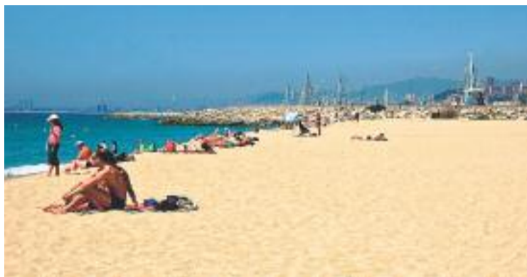
La comarca destaca en turisme internacional.

Pel que fa al turisme que arriba de la resta de l'estat espanyol, la Comunitat de Madrid és el principal lloc de pro-