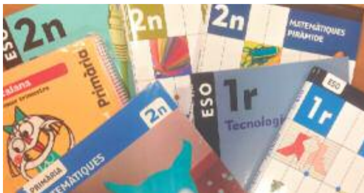
La mesura es va aprovar al Ple del 17 de maig.

EDUCACIÓ ▶ El Ple municipal del 17 de maig va aprovar una modificació pressupostària de 622.000 euros. Uns diners que, entre altres qüestions, es destinaran a subvencionar els llibres escolars el curs que ve. Concretament, l'Ajuntament habilitarà una línia d'ajudes per cobrir el 75% del cost dels llibres de text i es podran beneficiar de la iniciativa totes les famílies que portin els seus fills a l'escola pública i aquelles que ho facin a centres concertats.