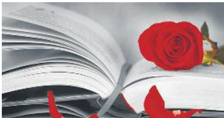
La diada es viurà amb força a la comarca.

DIADA ▶ La comarca ja ho té tot a punt per celebrar Sant Jordi aquest 23 d'abril. Enguany la diada cau en diumenge i això sempre fa tremolar els venedors de roses i llibres. Enguany, però, es mostren optimistes. El Mercat de la Flor i la Planta Ornamental de Catalunya de Vilassar de Mar, per exemple, preveu un bon nivell de venda de roses, tot i haver vaticinat inicialment una davallada respecte dels anys que Sant Jordi ha caigut entre setmana.