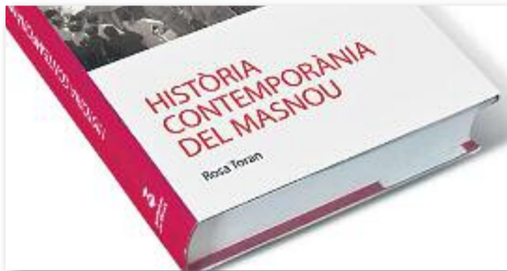
L'obra es pot comprar a les llibreries del poble.

L'assaig dut a terme per Toran ha comportat més d'una dècada de recerca i, ara que ja és una realitat, es presenta com una obra de 900 pàgines que in-