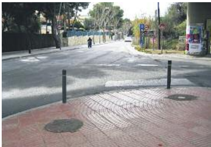
La via presenta una amplada mitjana de 6 metres.

D'aquesta manera, es posa el punt final a una reivindicació dels dos municipis afectats, i