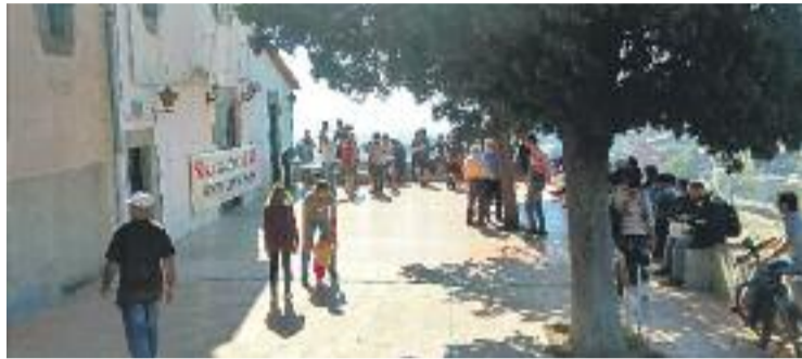
El torrent Santa Anna podria quedar inundat amb les pluges.

NOUS MOVIMENTS PREVISTOS En aquesta línia, els membres de