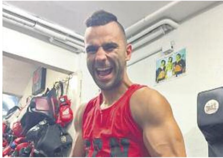
El premianenc tornarà a optar a un títol europeu.

Si finalment la data es confirma (ho hauria de fer Gallego Prada pròximament), seria la primera vegada en 35 anys que es posa en joc un campionat d'Europa a Barcelona. La vetllada, que