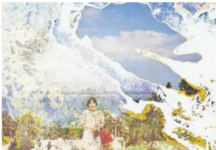
Els fotògrafs Takahasi i Yamanaka, encapçalen el cartell.

També hi haurà el Revela-T OFF BCN, on dues galeries de Barcelona exposaran fotografia analògica durant el mes del fes-