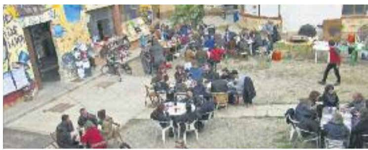
Can Sanpere, pendent del desallotjament.

Per això, la voluntat del govern és reunir els suports necessaris al Ple del maig per iniciar els tràmits de modificació del POUM. Un