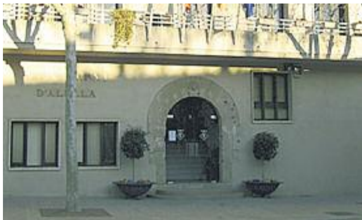
Els ciutadans podran opinar abans de cada Ple.

La moció, presentada pels partits de govern, no va rebre el suport de l'oposició. Gent d'Alella, PDeCat, Alternativa per Alella-CUP i PP coincideixen en el fet que aquesta mesura no contempla la possibilitat que la