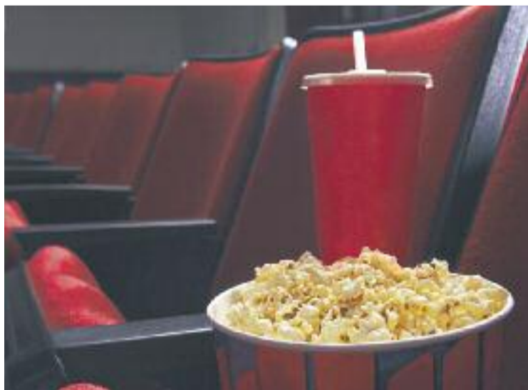
Els botiguers de Premià conviden els seus clients al cinema.

El funcionament de la campanya és fàcil. Per cada compra que efectuïn els clients, podran dipositar una butlleta amb les seves dades a les urnes habilitades a les botigues per a l'ocasió. Després, cada últim divendres de mes, al Centre cívic es farà un sorteig on es regalaran quatre vals —amb quatre entades cadascun— a les persones que hagin participat amb una butlleta. De fet, el primer sorteig de la