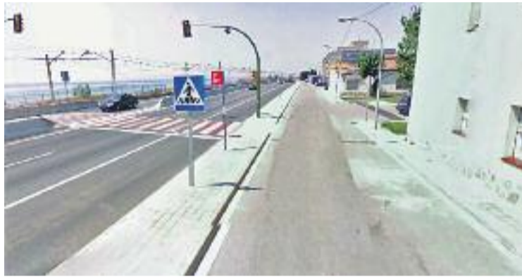
L'Ajuntament canviarà el nom del carrer Doctor Modrego.