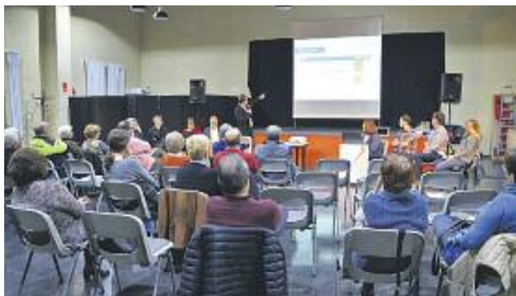
El grau de compliment del PAM supera el 80%.

A més, com més avança el temps, majors són els riscos que comporten per la seguretat ciutadana, a causa dels esvorancs