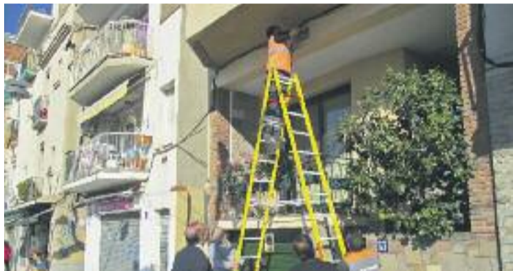
L'última placa estava al passeig Prat de la Riba.