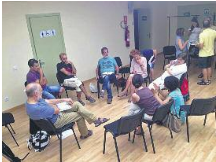
Imatge d'arxiu d'una assemblea de Babord.

Les sol·licituds per optar als diners del Retorn Solidari es poden enviar a Babord fins al pròxim 26 de març.