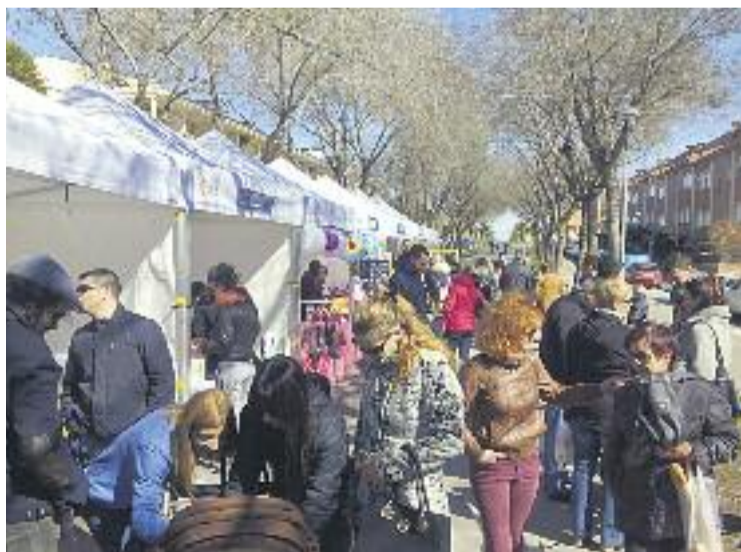
El temps va respectar la fira i finalment no va ploure.

Però a banda de l'aspecte purament comercial, la fira va presentar algunes novetats que la van fer més atractiva per als clients, destaquen des de l'associació. En concret, va ser la primera mostra d'aquestes característiques que va comptar amb un espai dedicat a la restauració, que va estar ubicat a la