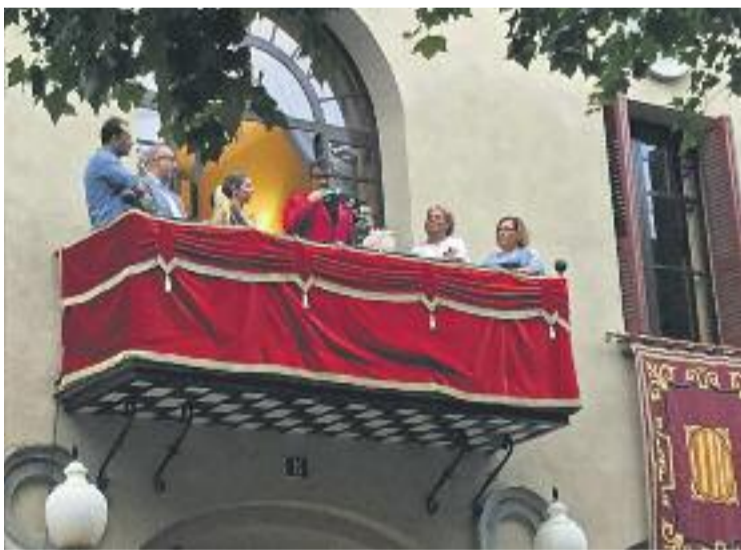
Una imatge del pregó de l'última Festa Major.