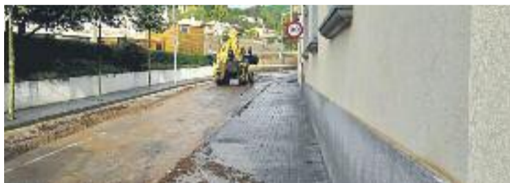
Alguns municipis han avançat diners per fer obres.

Davant d'aquesta espera, els tres municipis més afectats per les pluges han decidit actuar de diferent manera. En el cas de Vilassar de Mar i Cabriels els Ajuntaments han avançat diners que ara esperen que els hi siguin retornats. A Vilassar, la principal actuació assumida pel consistori ha estat a la riera d'en Cintet, amb un cost que oscil·la entre els 250.000 i els 300.000 euros, segons explica el