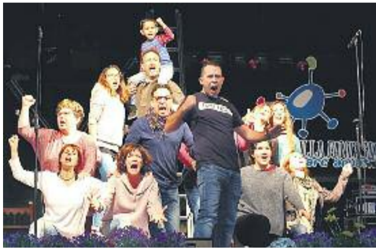
L'Illa Fantasia va acollir la gala Lupresti.

Sota el lema "Una baqueta, un maó", la intenció de l'esdeveniment era recollir fons per la millora de les condicions de vida dels infants de les comunitats més empobrides d'Anantapur, al sud de l'Índia. A més, el pilar d'aquesta iniciativa és la creació d'un grup de percussió format íntegrament per nens i nenes cecs, als quals se'ls oferirà l'oportunitat d'actuar en diferents esdeveniments regionals per afavorir un seguiment a l'activitat i millorar la seva autoestima.