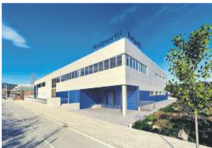
El polígon Riera de Vilassar és el motor industrial del poble.

Concretament, el polígon ja no respon només a un ús industrial, sinó que ara també contempla l'oferta en matèria docent, sanitària, de restauració o oficines, entre d'altres. En aquesta línia, Godàs valora que