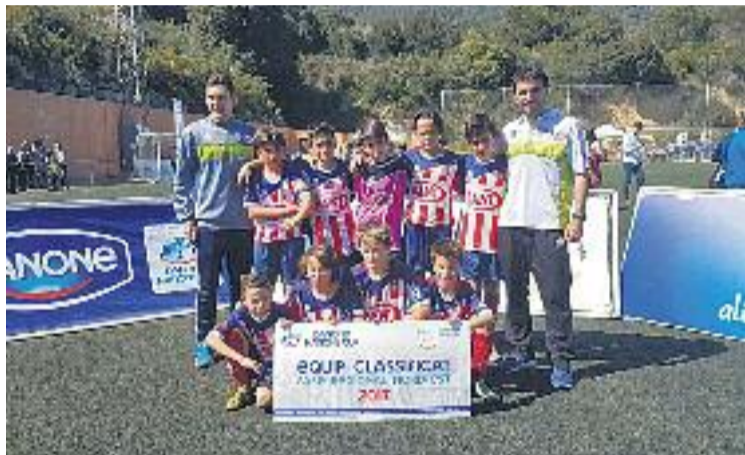
El Vilassar de Mar celebra la seva victòria.

De tots aquests, els dos que van aconseguir el bitllet per a la final van ser els dos equips de Vilassar. En el torn del matí el Vilassar de Mar va passar al partit pel títol després de guanyar un