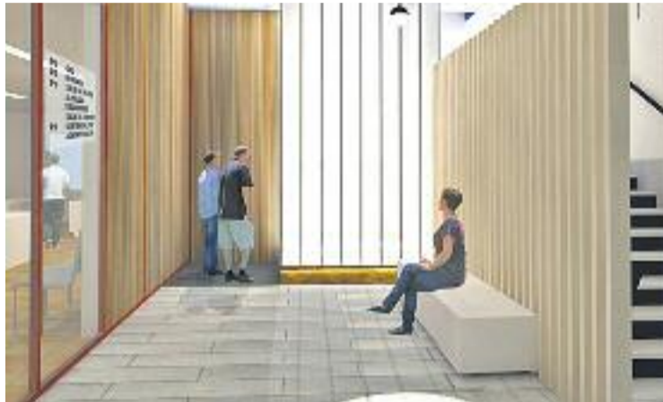
Recreació de l'aspecte que tindrà el nou Ajuntament.

L'element a destacar de la reforma de l'Ajuntament és la in-