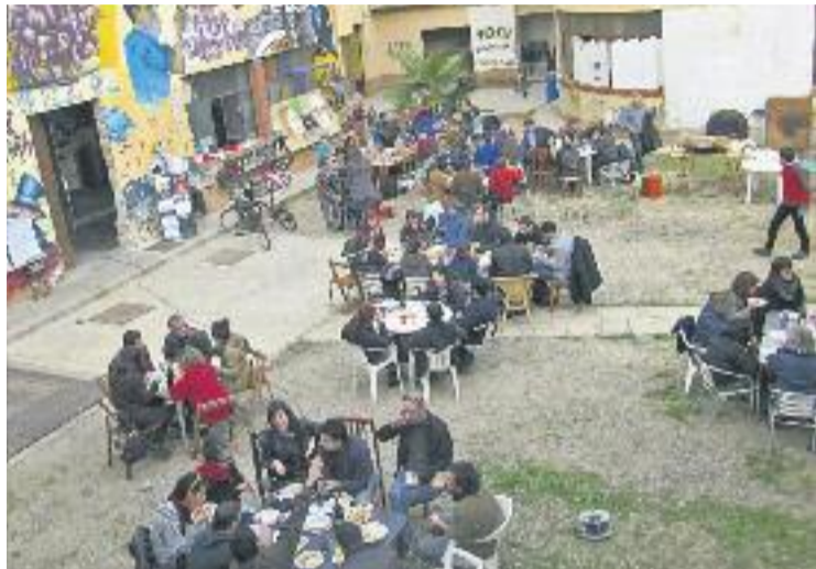
Can Sanpere tornarà a l'activitat el 28 de gener.

Un futur que depèn de múltiples escenaris. En primer lloc, de les negociacions que l'Ajuntament ha iniciat amb l'empresa Núñez i Navarro, propietària dels terrenys de Can Sanpere. Després de rebutjar una primera oferta de compra de l'Ajuntament de 4 milions d'euros i de mantenir el silenci des