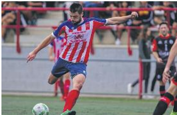
Els roig-i-blancs són tretzens.

El calendari més immediat, però, continuarà sent molt exigent per als roig-i-blancs, que tancaran el mes de gener rebent el quart classificat, l'FC Vilafranca, i continuaran a principis de febrer contra un altre dels candidats a l'ascens, l'Olot, que ara mateix lidera la taula. Els vilassarencs tindran un petit respir en l'enfrontament contra el Manlleu