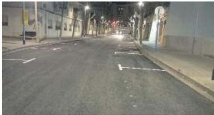
S'han asfaltat i senyalitzat de nou quatre carrers.

A finals d'aquest mes està previst que també es rehabilitin les voreres dels carrers de Joan Maragall, del Capità Mirambell, de la Mare de Déu de Núria,