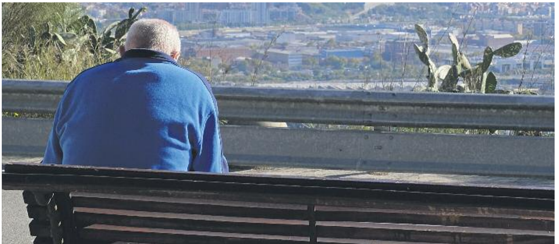
Les diferències en esperança de vida són una altra cara de la desigualtat.