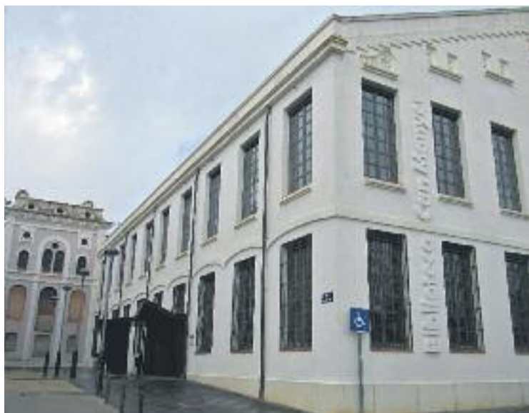
La proposta del govern preveu continuar amb els canvis a Can Manyer.

L'origen de tot plegat és la reducció del deute municipal. En aquest sentit, gràcies a l'operació de dació en pagament amb Bània, el govern municipal va rebre una quantitat econòmica a canvi de diferents propietats, que ha permès rebaixar el deute del 279% al 105%, per sota del màxim legal permès. D'altra banda, Godàs comenta que tot té els seus punts positius i els seus punts negatius. "El 2017 no podem fer cap inversió gran", una fita que haurà d'esperar al 2018, on està prevista una sèrie d'inversions per millorar la prestació de serveis.