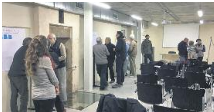
La comissió no està tancada i s'hi pot anar afegint gent.

Després d'haver acabat amb el gruix d'entitats, ara els següents passos serà comptar amb l'opinió dels representants polítics - tant del govern com de l'oposició - i la dels veïns.