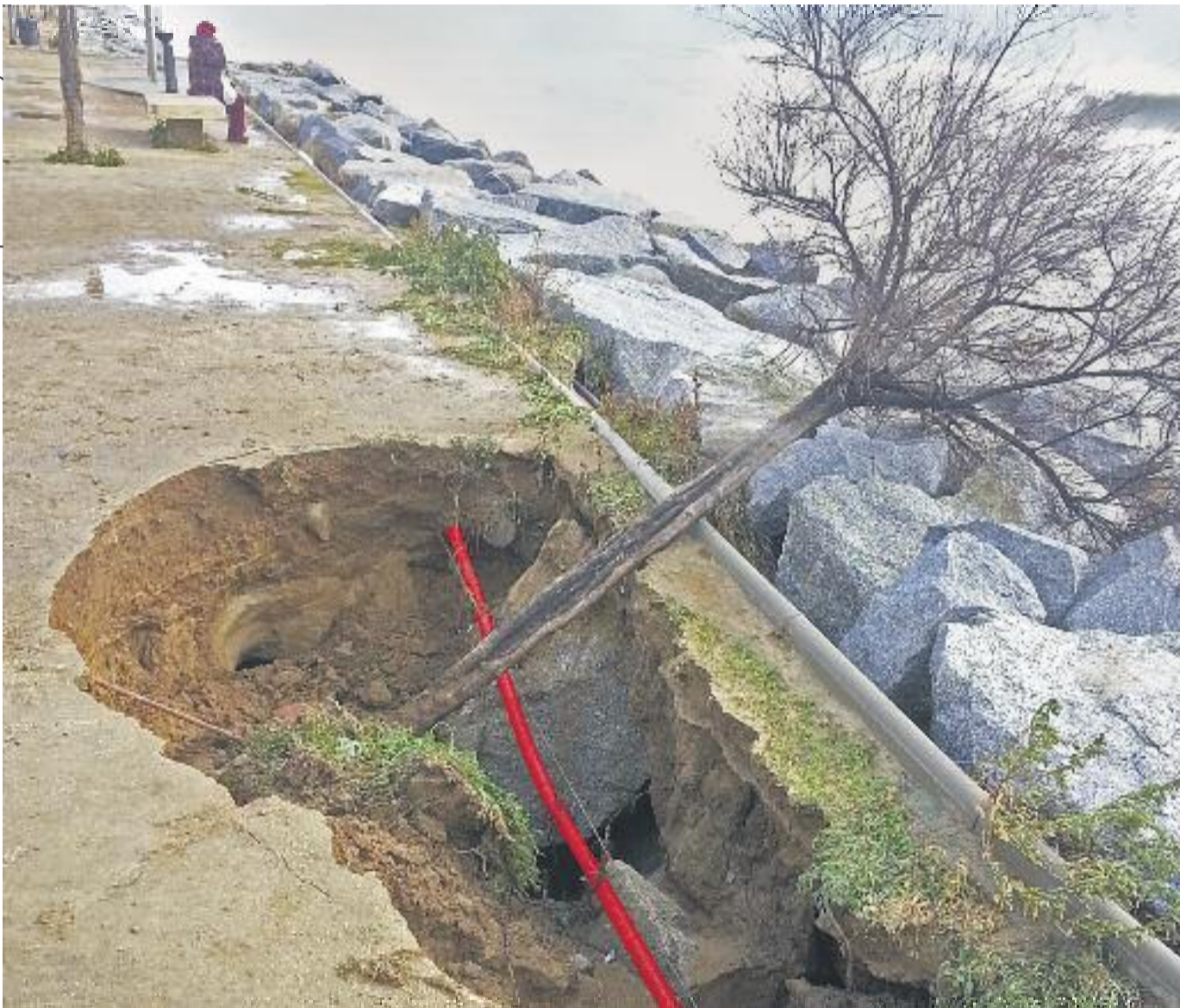
Els efectes del temporal al Masnou.

Baix Maresme liniamar.cat · OJD-PGD: 14.135 exemplars mensuals · Gener 2017 · Núm. 22