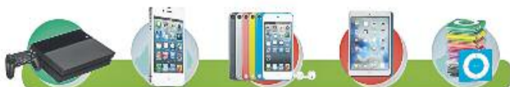
Play Stations iPhones iPods Touch Ipads iPods Shuffle