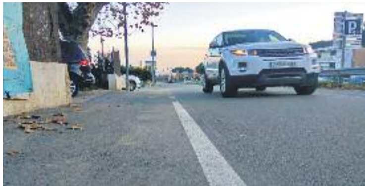
Ha estat la decisió més votada amb 252 vots.