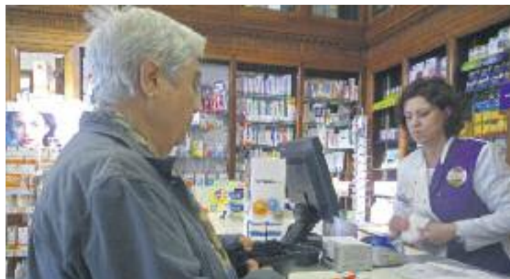
La campanya vol incentivar el català al petit comerç.

Els establiments col·laboradors de la campanya es comprometen a mantenir el català amb persones que hi vagin i a identificar-se amb un adhesiu.