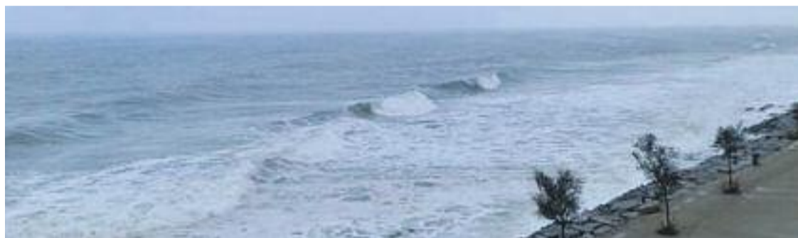
En alguns casos les onades van arribar als sis metres.