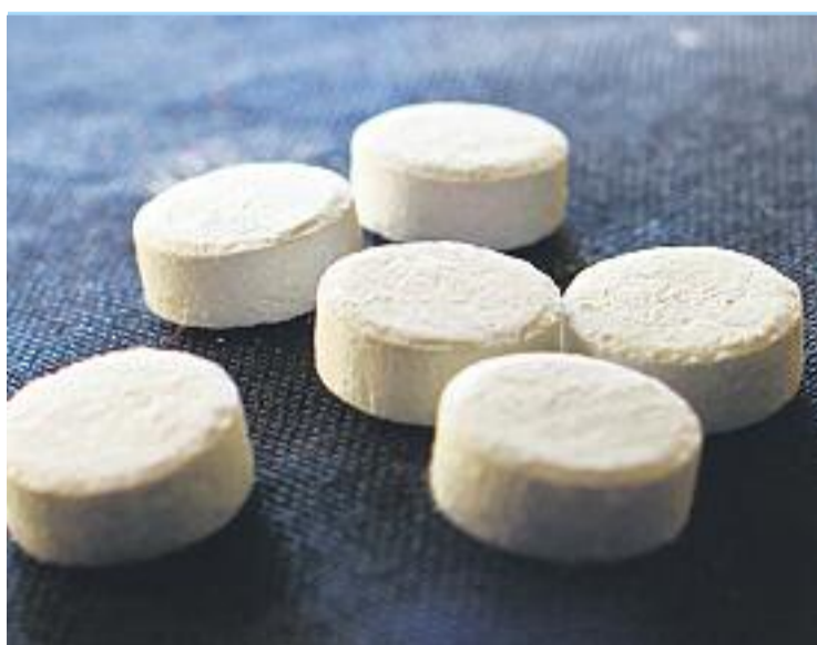
L'objectiu del pla és allunyar els joves de les drogues.

Durant els pròxims mesos serviran per decretar quines actuacions s'hauran de dur a terme per evitar l'entrada dels més joves en el món de les addiccions. Per aquest motiu, la regidora de Serveis Socials avança a Línia Mar