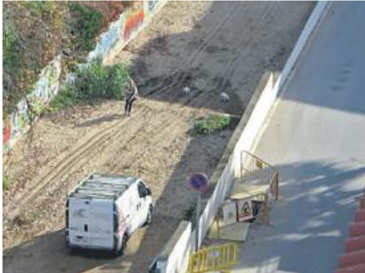
Ja han començat les obres de reforma.