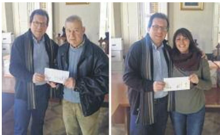
Guanyadors dels vals de compra de Teià.

Els premiats, a canvi de demostrar una compra en tres establiments del municipi, van obtenir la bossa reciclable de la campanya i van entrar a formar part del sorteig, el qual, finalment, han guanyat.