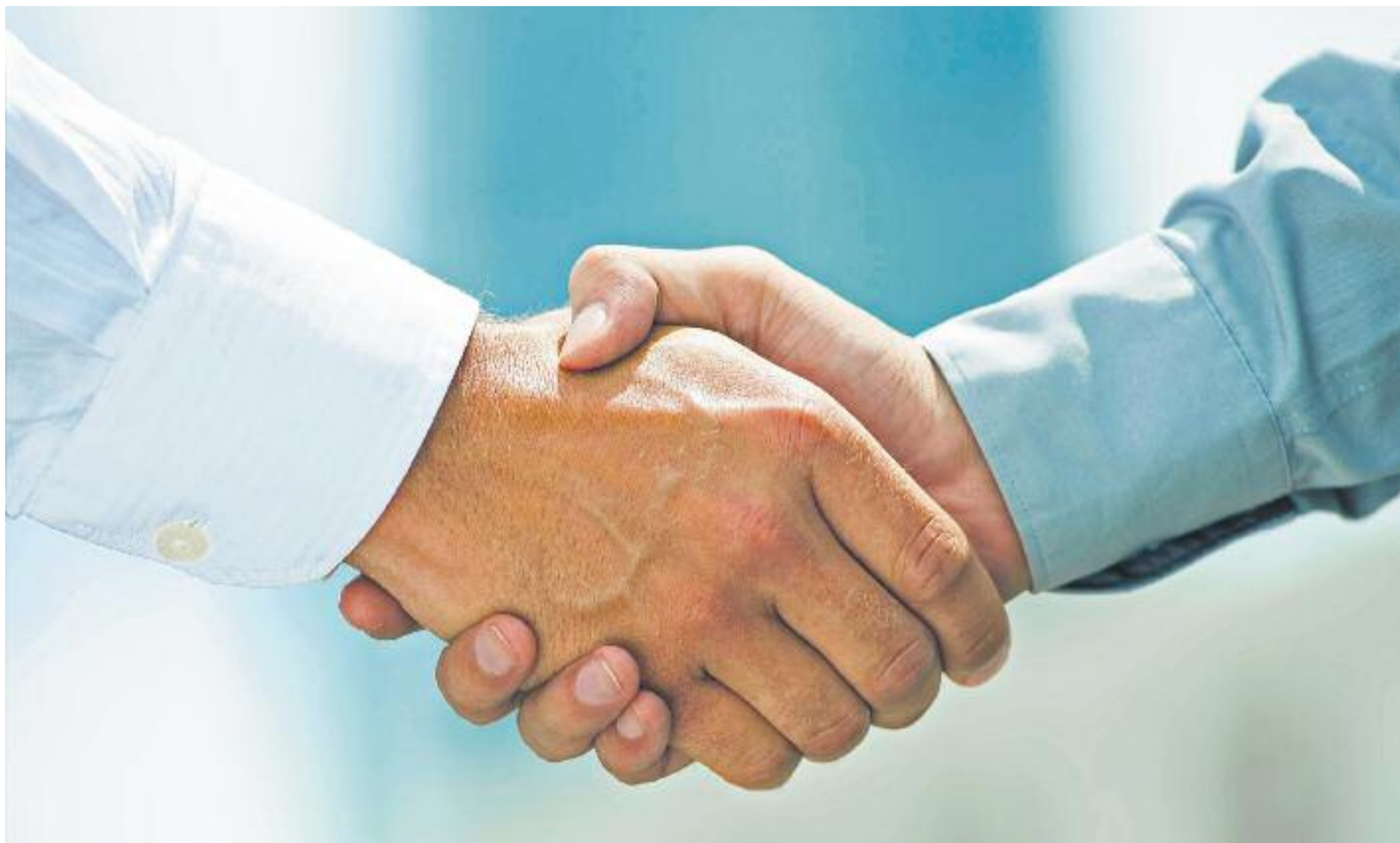
La mediació és un mètode gratuït i voluntari de resolució de conflictes.

» El Dia de la Mediació, celebrat el 21 de gener, recorda que cal impulsar-la com a alternativa eficaç » La Diputació de Barcelona ofereix un programa per promoure aquesta eina de resolució de conflictes