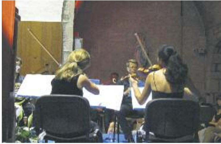
La iniciativa col·labora a apropar la música de cambra al gran públic.

Pel que fa al Festival d'Estiu, els grans noms d'enguany han estat Els Amics de les Arts, Gem-