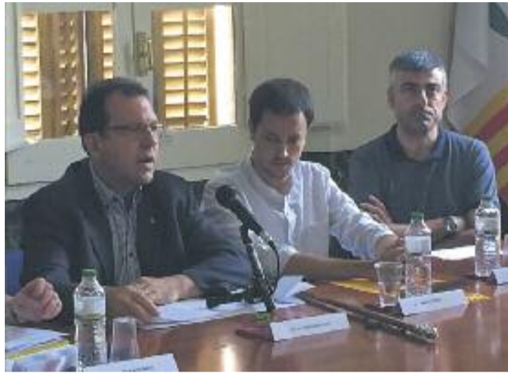
Teià seguirà formant part de l'AMI.