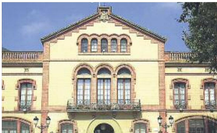
L'Ajuntament treballa per impulsar un nou alberg.

Encara no se sap quin serà l'emplaçament del nou alberg, ni tampoc de quina manera