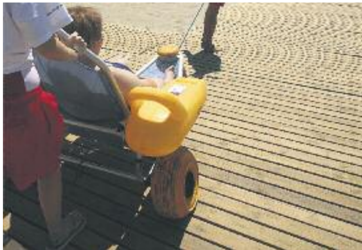
Bon balanç del funcionament del ram de platja adaptat: Arxiu

CABRERA, POBLE PIONER L'afluència de visitants ha començat amb bon peu, però des