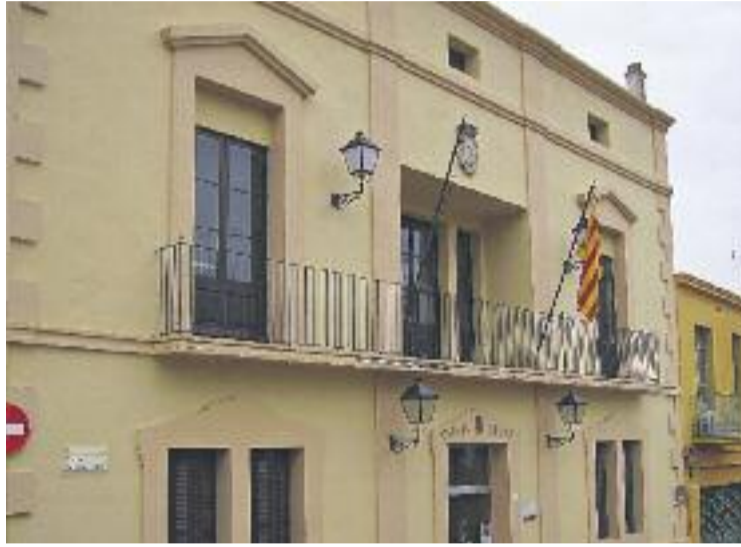
Els regidors de l'Ajuntament seguiran cobrant el mateix.

De fet, la proposta que el govern va presentar al Ple no era la dissenyada inicialment per l'executiu, sinó l'alternativa plantejada pels republicans, que es basava en la congelació dels sous. CiU va defensar la seva pro-