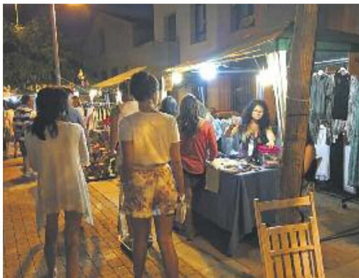
La Plaça de la Tela acollirà la tercera edició de la nit del comerç.

Cros considera que seria un error valorar el resultat de la fira