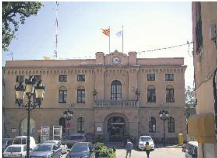
L'Ajuntament firmarà una pòlissa de crèdit cinc anys després.