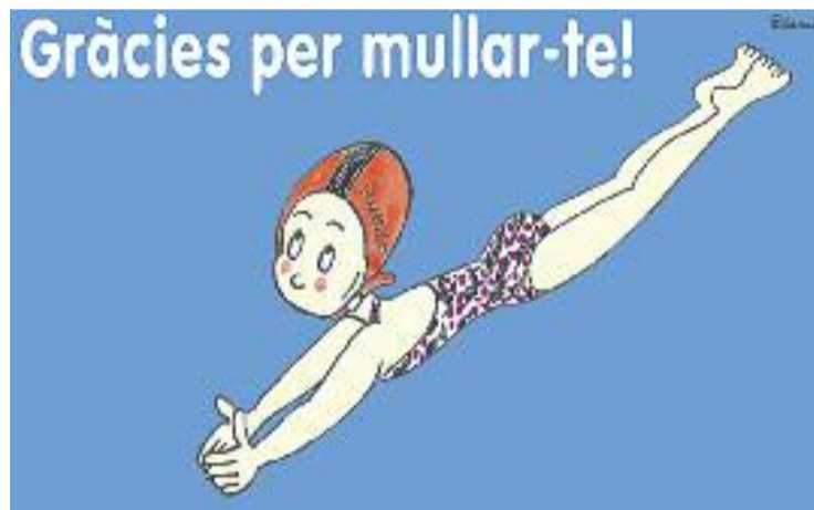
La imatge de la campanya, obra de Pilarín Bayés.

BAIX MARESME ▶ Com ja és habitual des de fa anys, a principis de juliol la Fundació Esclerosi Múltiple (FEM) organitza a principis de juliol la jornada Mulla't per l'esclerosi múltiple , que cada any busca conscienciar la ciutadania i recollir fons per lluitar contra aquesta malaltia.