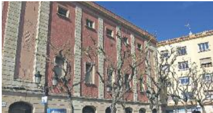
La planta baixa del Casinet canvia de mans.

Des del març de 2013 el consistori estava pagant un lloguer a l'ONCE per la planta bai-