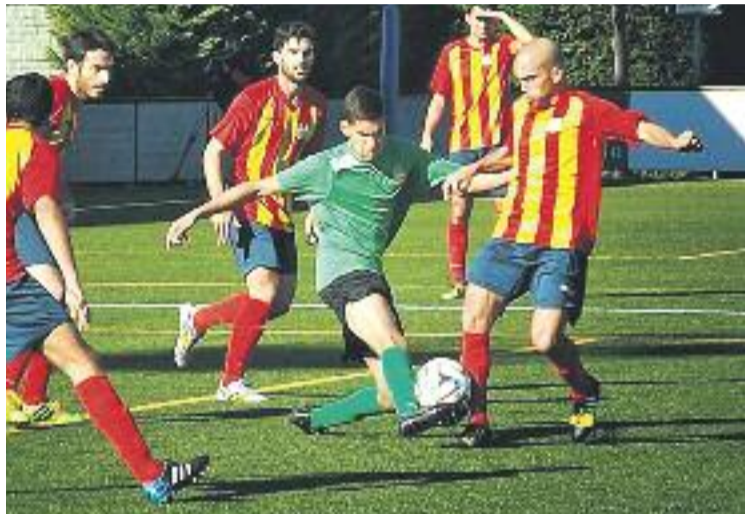
El CD Masnou debutarà contra el Sant Andreu a la lliga.

Amb l'objectiu d'arribar a l'inici de temporada en un estat òptim, el club ha treballar per dissenyar una pretemporada que constarà de cinc partits. Vilanova, Damm, Sant Ildefons, Sant Cugat i Mataró seran els rivals dels ho-