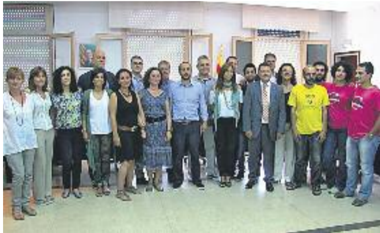
Regidors integrants del Ple Municipal de Vilassar de Mar.

Babord ha confirmat a Línia Mar que el mes de setembre serà el moment de valorar l'a-