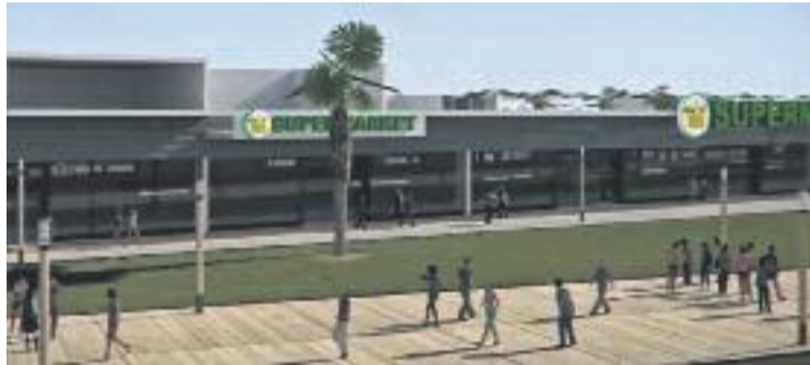
Recreació de la zona comercial del projecte.