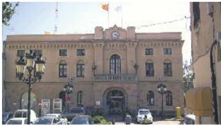
El consistori vol impulsar una marca turística pròpia.

PLA ESTRATÈGIC 2015-2019 De fet, aquest era un objectiu establert abans dels comicis del 24 de maig, les línies del qual estan definides en el Pla