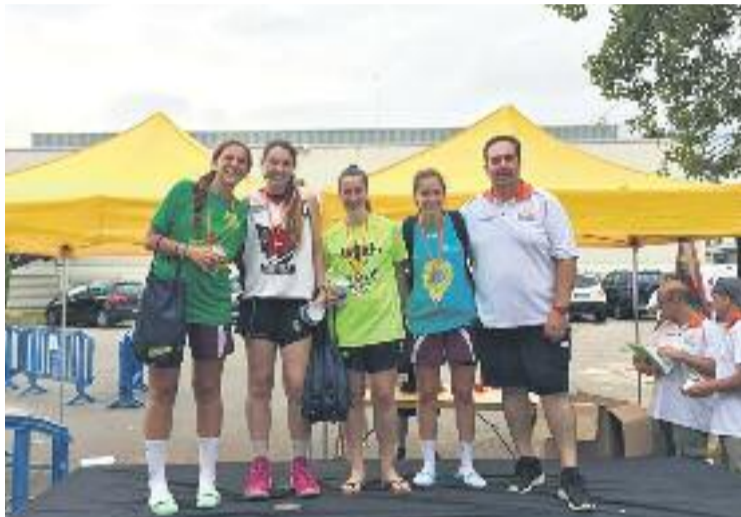
Les guanyadores de la categoria júnior.

Un cop acabada la temporada, el club ja pensa en el curs vinent.