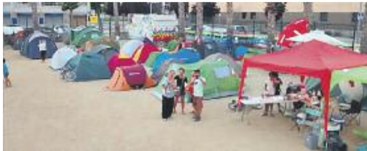
Mares i pares continuen acampats des de divendres passat.

La polèmica va començar amb la dimissió de l'actual directora. La cap d'estudis i la secretària del centre van optar per presentar un projecte de relleu però, després d'inspeccionar el centre, els Serveis Territorials d'Ensenyament han decidit triar un nou director, extern al projecte educatiu de la Mar Nova i fins ara responsable d'un centre d'Òrrius. Una decisió final que va en contra del posicionament del claustre de professors, l'AMPA i sindicats com CCOO i US-TEC. El Consell Escolar del centre també va entregar als Serveis