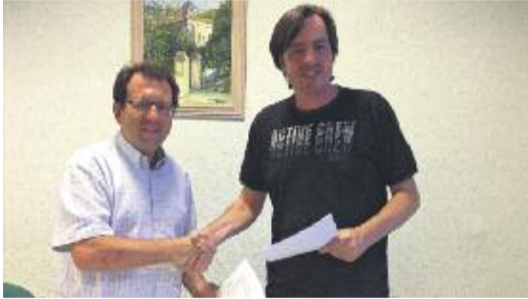
Moment de la signatur de l'acord de govern.

Del comunicat que anuncia l'acord entre les dues formacions se'n desprenen les principals línies de treball per a aquest mandat, entre les quals destaquen la reorganització del personal municipal per tal d'optimitzar els recursos de l'Ajuntament, la voluntat de mancomunar serveis amb altres municipis, fer una di-