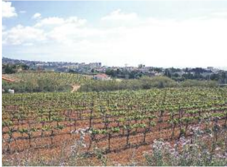
El curs treballa per generar projectes a la DO Alella.

"Un dels nostres objectius és fer conèixer el vi com a pro-