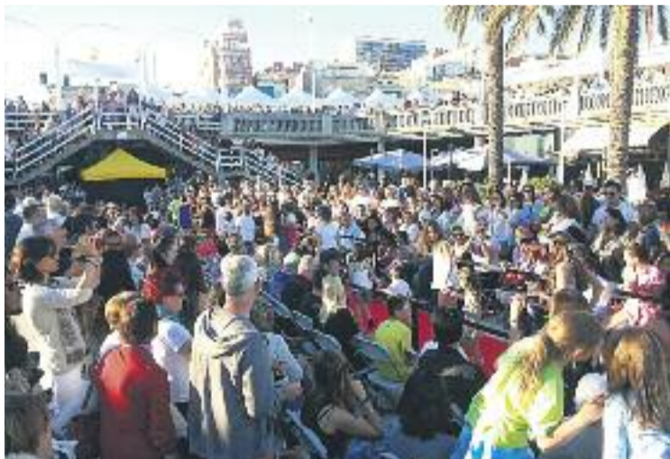
Entre 4.000 i 5.000 persones van visitar la fira.

dústria i Turisme encara no ha celebrat la reunió d'avaluació de la fira, però el seu president considera que la immensa majoria de comerços participants n'estan molt satisfets. "Els bars i restaurants també estaven molt contents amb el volum de visites que van rebre durant el cap de setmana", afegeix Tri-