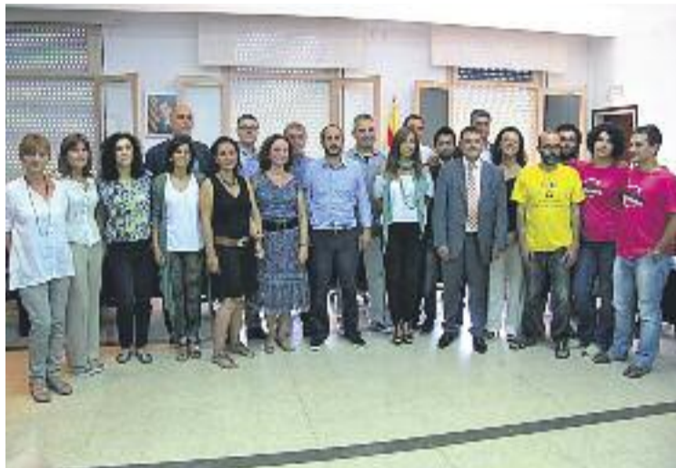
Foto de família dels nous regidors del consistori.

D'altra banda, GxVDM va rebutjar votar una proposta