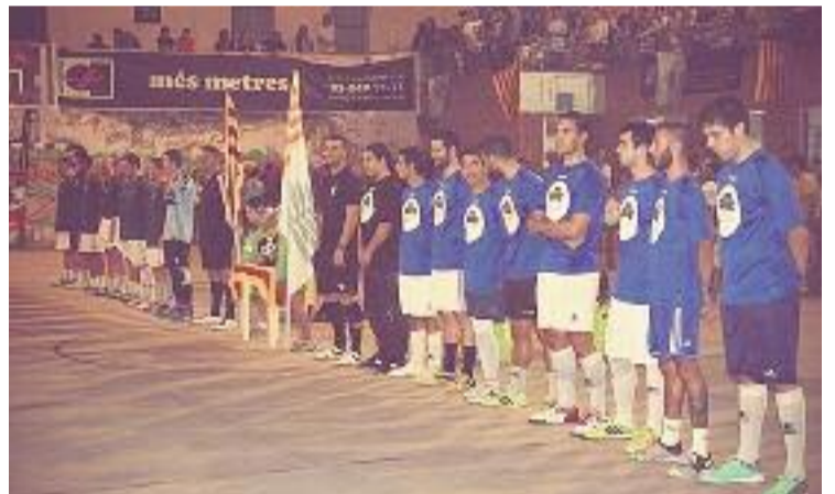
Una imatge de la final masculina de l'edició de 2014.

TEIÀ ▶ El futbol sala és un dels esports que compta amb més aficionats al país. Cinc jugadors per equip, una pilota i dues porteries són els ingredients necessaris per poder jugar un partit d'aquesta dinàmica modalitat, i per això, la ciutat es prepara per organitzar la setena edició del torneig "A Teià el futbol enganxa".