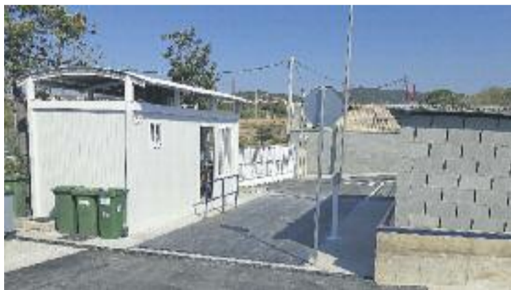
La deixalleria ha estat tancada per obres de millora.

"Les obres realitzades són de poca magnitud, però milloren