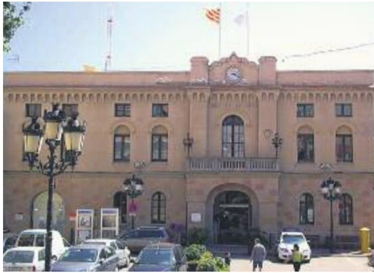
L'Ajuntament vol un cementiri de titularitat pública.

Actualment el cementiri ja és gestionat pel consistori, però la