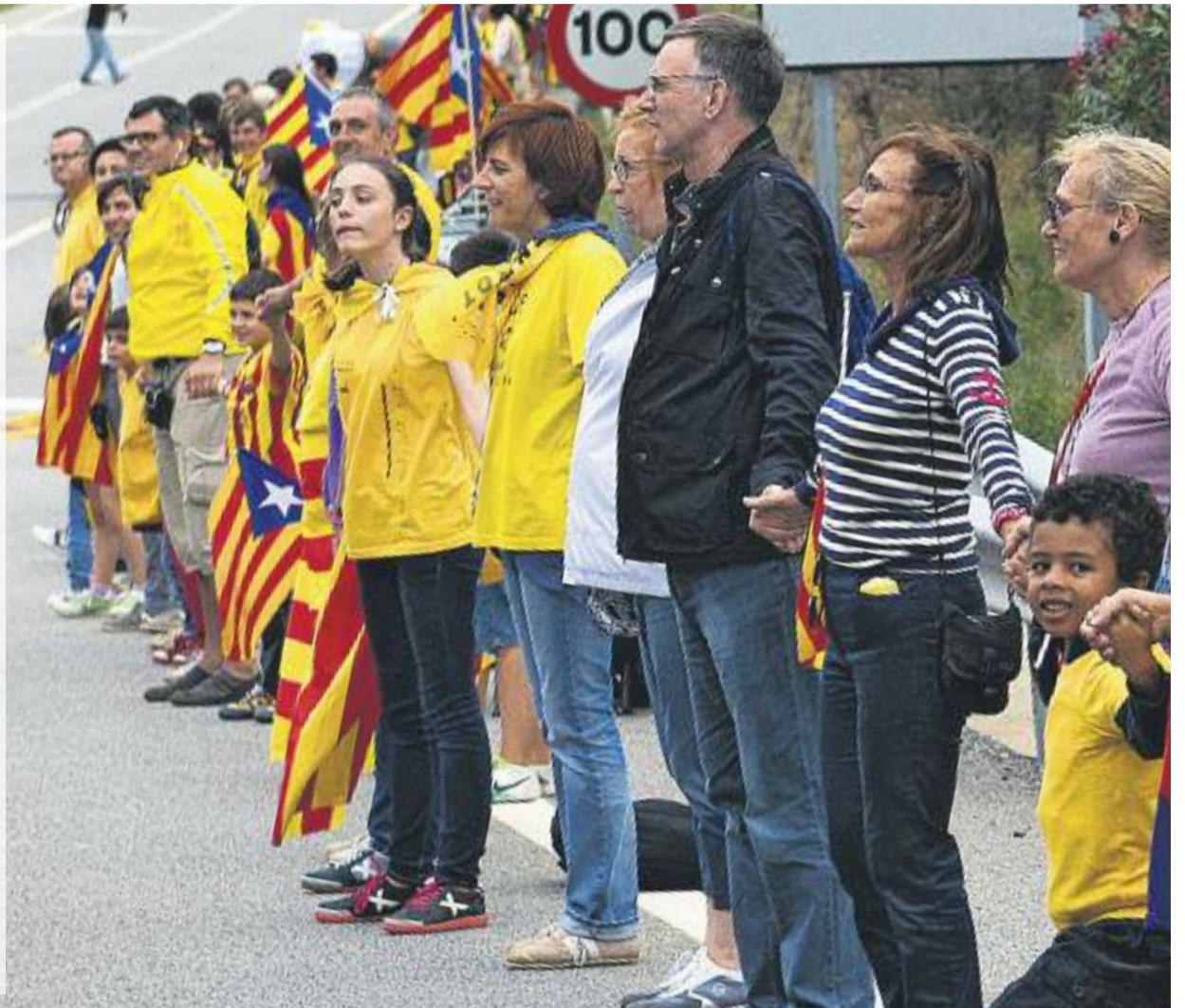
El nou preacord sobre el full de ruta pretén relançar la il·lusió que el procés sobiranista ha despertat en els darrers anys.

4. Culminació democràtica del procés per part del poble de Catalunya.