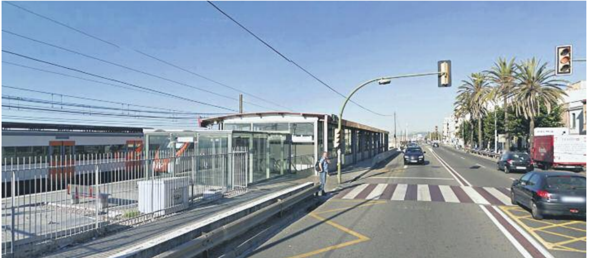
Una imatge de l'estació de tren de Premià de Mar.

» La plataforma que vol reformes a l'estació de Renfe de Premià de Mar anuncia noves mobilitzacions » L'Ajuntament del municipi reconeix que cal millorar l'accessibilitat i reclama "treballar conjuntament"