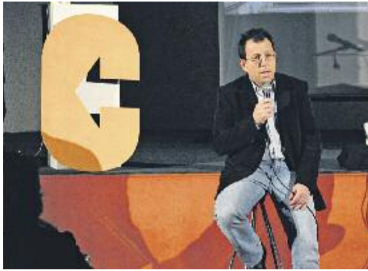
Bosch a l'acte de presentació de la candidatura.

Pel que fa al món municipal, Bosch diu que un dels seus principals objectius és retornar l'estabilitat que l'Ajuntament de