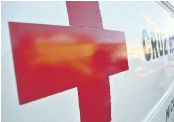
La Creu Roja treballa per a una correcta alimentació infantil.

Un dels motius pels quals l'Ajuntament ha decidit atorgar els diners a la Creu Roja en comptes de gestionar-los directament des de l'administració