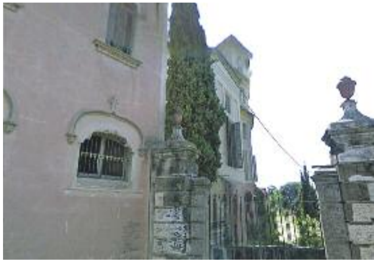
Parcel·la de la Torre del Governador.

Paral·lelament, l'Ajuntament també va signar el 6 de març un acord de dret de compra amb Torrebarnades SL.