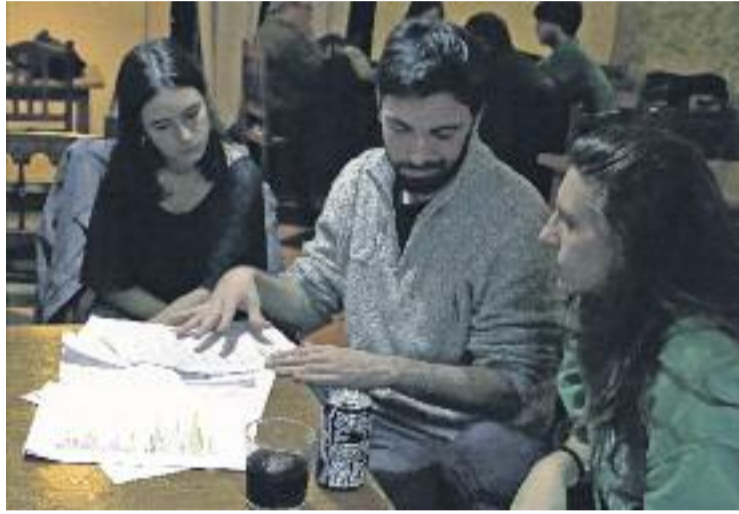
Assemblea de Crida Premianenca.

Malgrat tractar-se de dos municipis diferents, el projecte de la Crida preveu un treball conjunt entre els representants de la formació a Premià de Dalt i els de Premià de Mar. "El