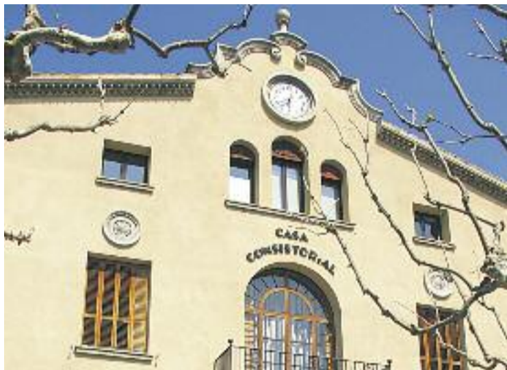
L'Ajuntament impulsarà la primera platja adaptada de la província.

A més de les millores que es podran trobar a la sorra de la platja, s'establirà una zona reservada per a estacionament