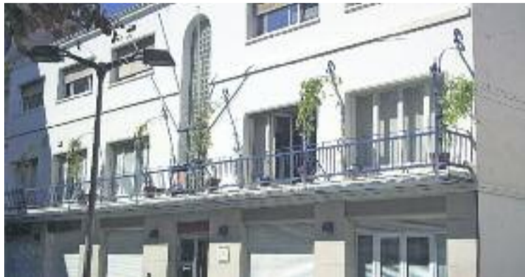
La façana de l'Ajuntament.

La Generalitat va desmentir que hi hagués cap impediment legal ni cap conflicte competencial amb les donacions a les entitats de cooperació. Després