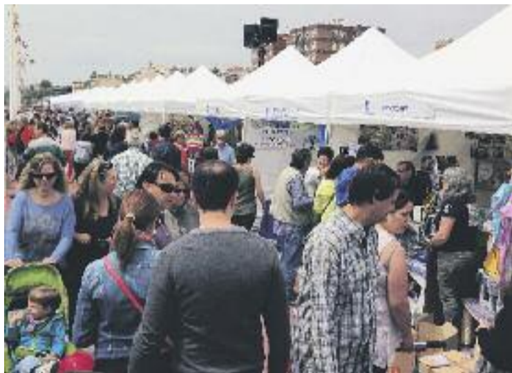
L'any passat la Fira va reunir 90 expositors.

Precisament, el principal objectiu de la fira és potenciar el comerç de proximitat del Masnou. "Constantment es tan-