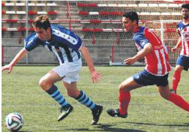
El Vilassar va caure a casa contra els empordanesos.

Per altra banda, un esglaió per sota, Premià i Mataró van em-