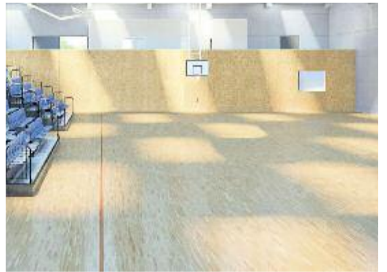
Tres imatges virtuals de l'aspecte que tindrà el Complex Esportiu Municipal.