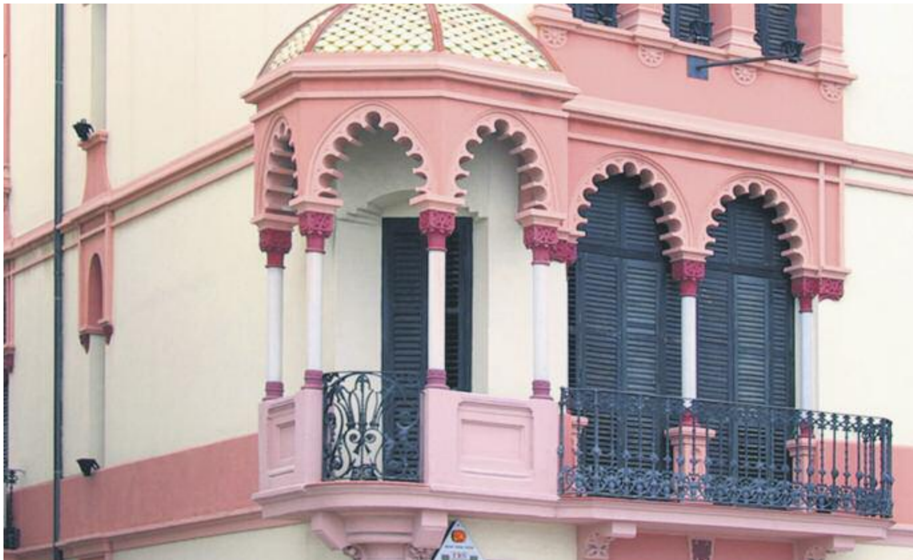
Un detall de la façana de la Casa de la Cultura.