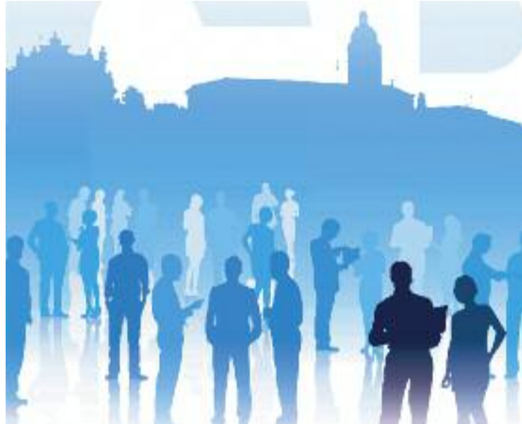
La fira tindrà lloc els dies 18 i 19 d'abril.

La presència dels diferents professionals al certamen persegueix la construcció d'una sinergia entre ells, així com la possibilitat que es donin a conèixer entre els veïns i veïnes