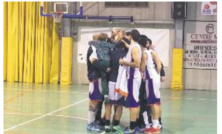
Els jugadors del Masnou fan pinya després de l'últim partit.

EL MASNOU ▶ L'equip sènior A del Netsport Masnou segueix ferm al capdavant de la classificació del seu grup de Copa Catalunya masculina.