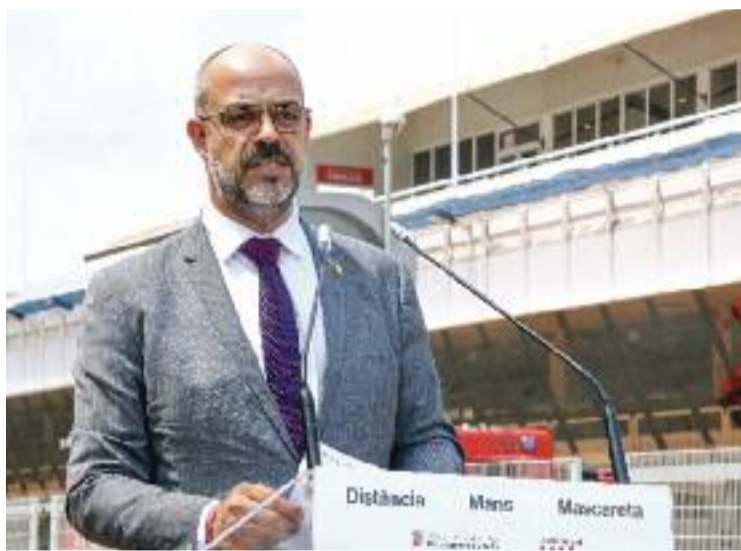
Miquel Buch en una imatge d'arxiu.

"Em demanen sis anys de presó i dotze d'inhabilitació per nomenar a Interior un assessor expert en seguretat. Una peça més de la causa general contra l'independentisme. Ells no s'aturen, però nosaltres tampoc", assenyalava a través d'un missatge a les xarxes socials l'exconseller en conèixer la petició del Ministeri Públic, que també li reclama una fiança de més de 70.000 euros.