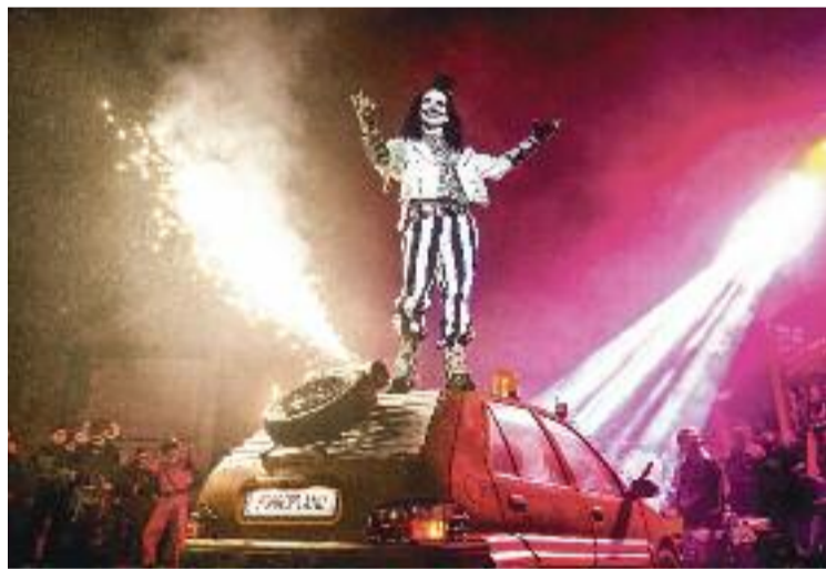
El parc de terror Horrorland tenia la seva seu fins ara a Cercs.

COMERÇ ▶ L'Ajuntament de Cabrils ha decidit suspendre fins al setembre el recentment estrenat mercat de venda no sedentària. Aquesta mesura s'ha pres després de comprovar que molts dels paradistes estan de vacances i no podran incorporar-se fins passat l'estiu. Cal recordar que la iniciativa va néixer amb la voluntat d'impulsar el comerç i la producció de proximitat.