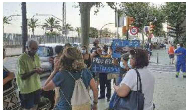
Protesta veïnal pels problemes de la depuradora.

Els problemes amb la depuradora van arrencar el gener del 2020 quan l'avaría es va produir pel pas del temporal Glòria pel litoral del municipi. Les primeres tasques de reparació del conducte es van dur a terme l'estiu passat en plena temporada de bany.