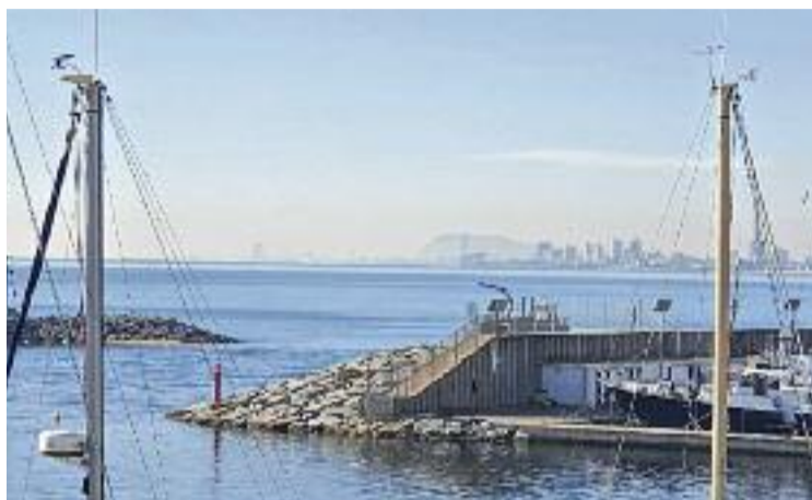
El Port del Masnou en una imatge d'arxiu.

Segons l'estudi de l'AMB, els diferents temporals que han assolat el litoral des del 2017 han impedit la recuperació natural de les platges, que requereixen molts mesos de "tranquil·litat" meteorològica per poder regenerar-se. En aquest sentit, l'acumulació de sediments que permet consolidar l'amplada de les platges amb sorra s'ha vist en certa manera boicotejada pel disseny dels ports del Masnou i de Badalona, que limiten l'entrada d'aquests materials i acaben provocant la regressió de les platges del Baix Maresme i del Barcelonès Nord.