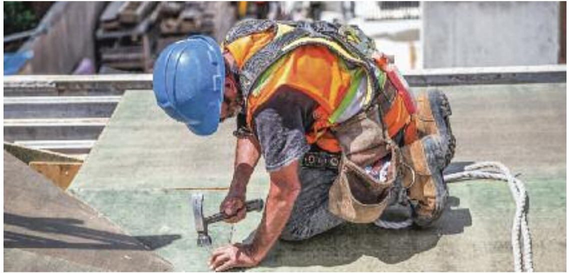
El sistema Delta el poden fer servir empresaris, autònoms, treballadors i autoritats laborals.

Si l'entitat gestora o col·laboradora detecta que el document té errors, s'hauran de corregir en un