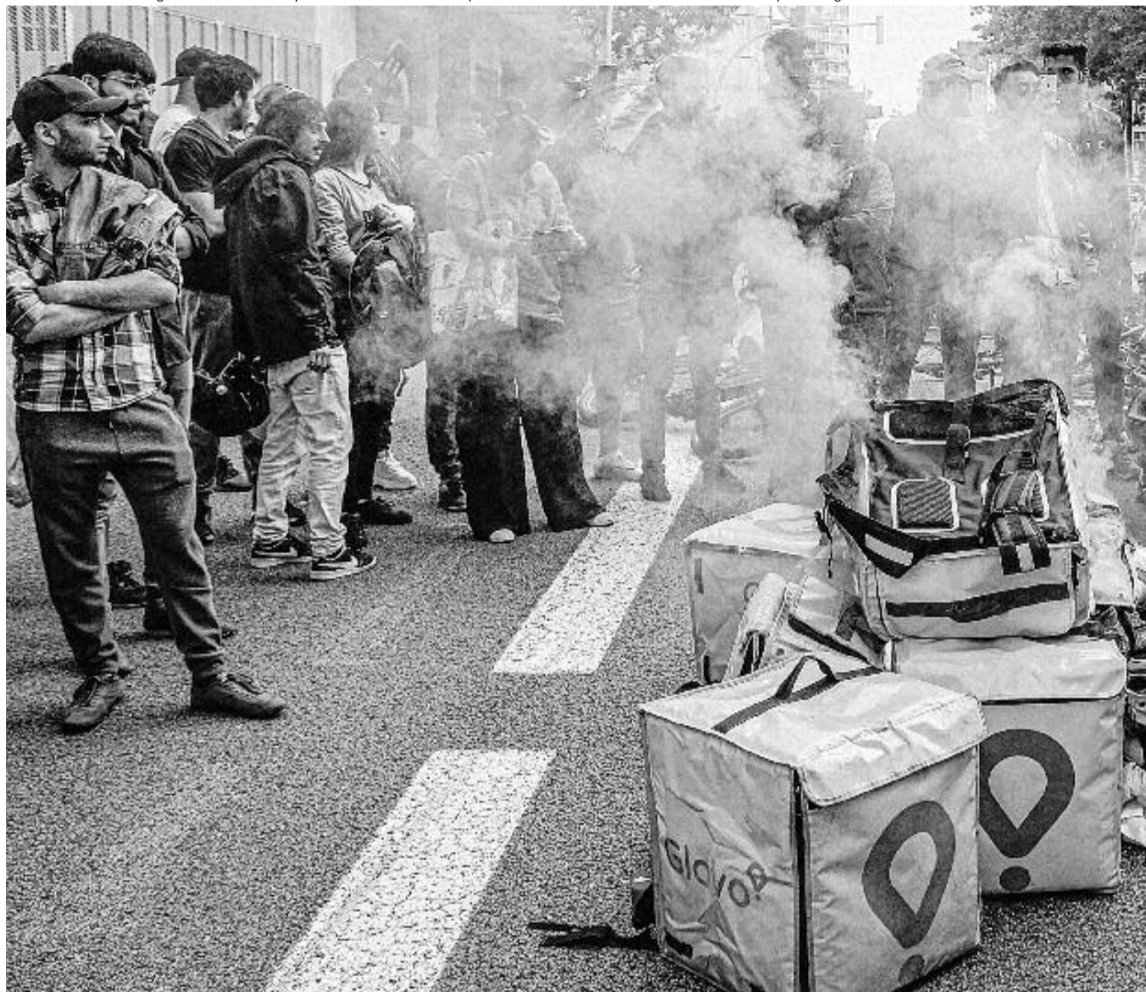
Alguns càlculs afirmen que més de la meitat dels repartidors de Glovo i Deliveroo treballen amb comptes rellogats.