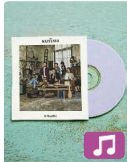
Enlaire Les Montses