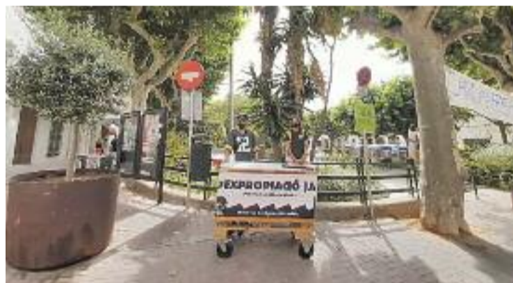
Una de les parades de recollida de firmes.