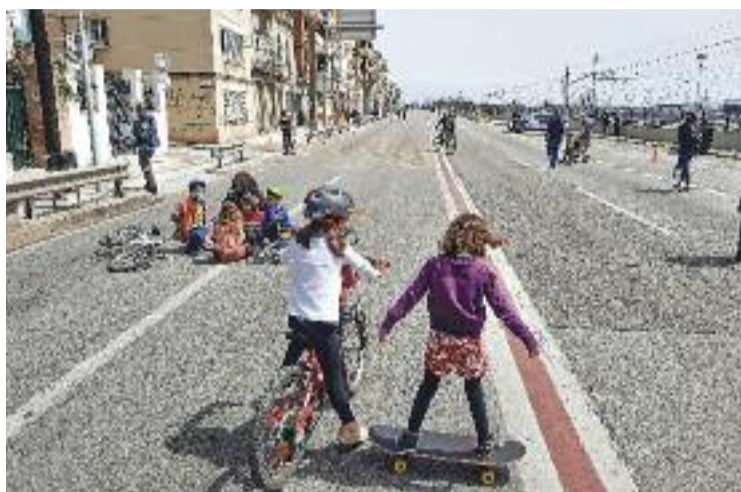
La ciutadania reclama un poble amb menys cotxes.

En aquest sentit, el consistori ha acordat prioritzar enguany fer totes aquelles vies que han de servir per "trencar barreres" entre els diferents barris del municipi. Entre els