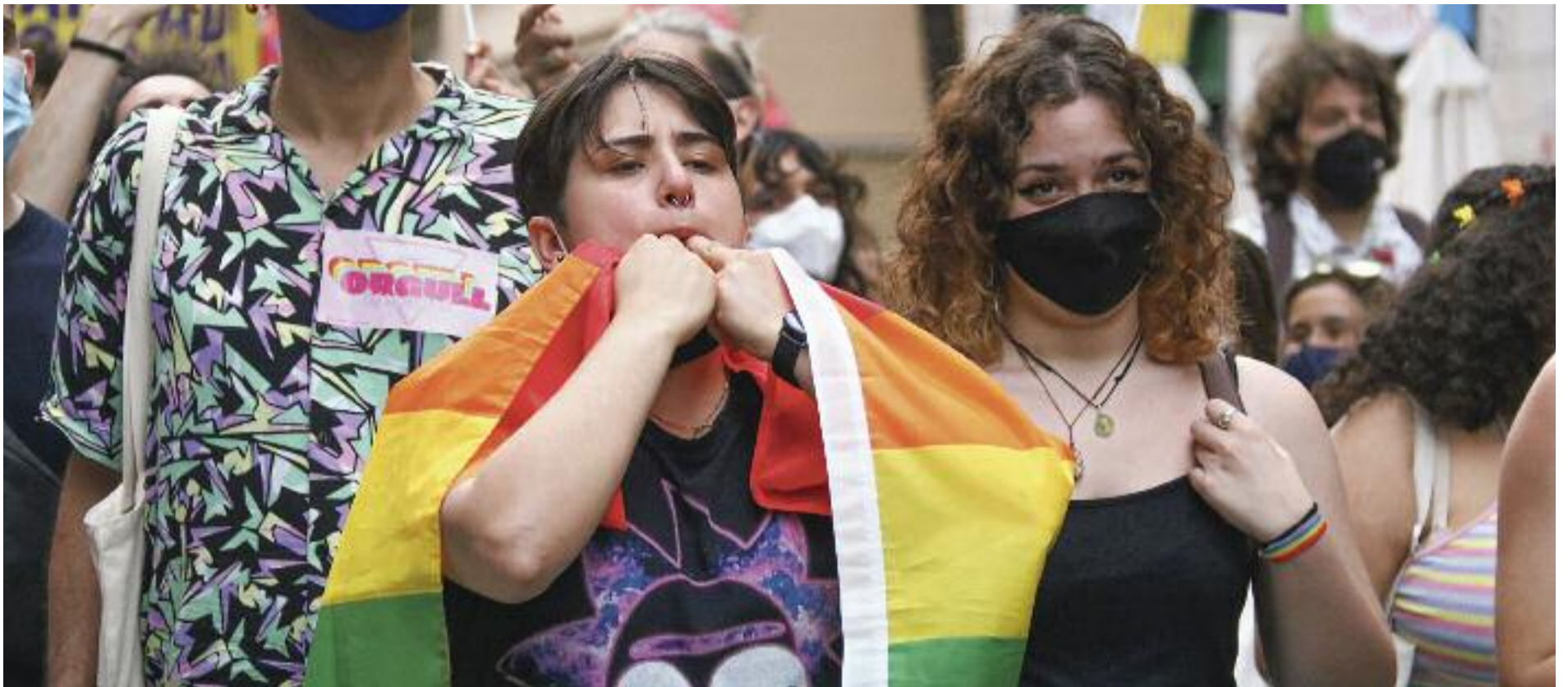
La comunitat LGBTBI ha expressat amb contundència el seu rebuig a les darreres agressions patides.