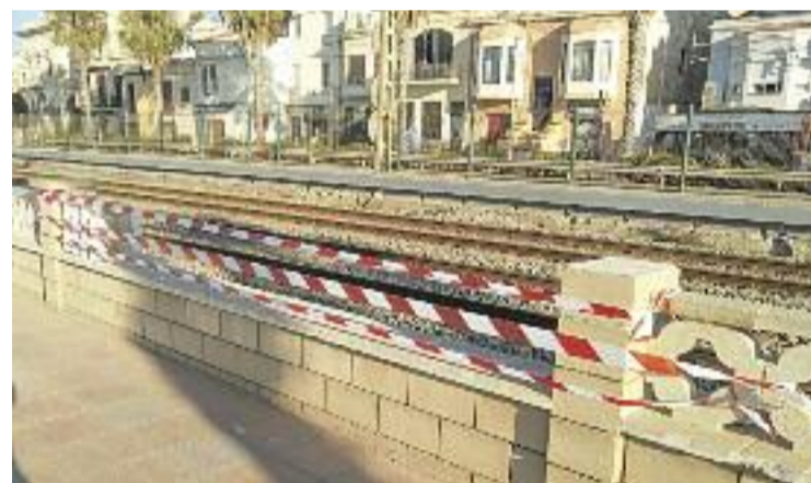
Un dels trams de gelosies malmesos per actes vandàlics.

Des d'Adif també s'ha informat de diversos trencaments en el tancat que separa les vies del tren al seu pas pel municipi. En aquest sentit, l'Ajuntament ha denunciat els fets, reiterant la seva condemna a conductes "incíviques" que malmeten el mobiliari públic, els serveis i la imatge de Vilassar de Mar i ha apel·lat a la responsabilitat de tots per evitar-les.