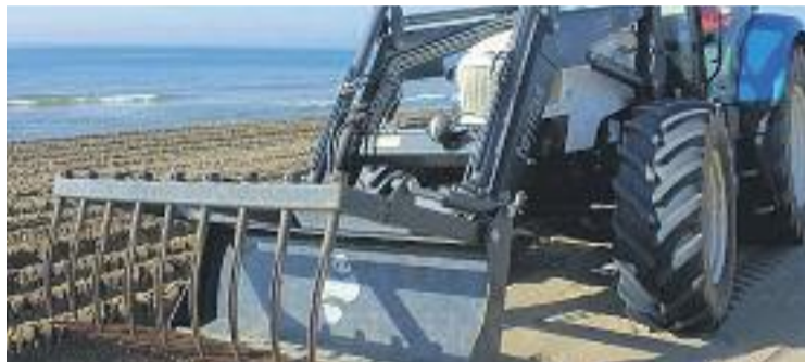
La neteja de les platges va arrencar a principis de mes a la ciutat.

Que apareguin molts d'aquests elements i restes enterrades a la sorra és resultat no només de la mà de l'home –almenys de manera directa–, sinó també dels temporals d'hivern. I és que, tal com expliquen des de l'AMB, des de fa uns anys han augmentat en número i intensitat a causa del canvi climàtic. Un mal temps que redueix la su-