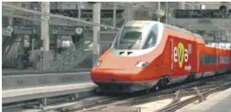
Reproducció virtual de com serà el futur EVA.

Poc després Adif va sortir al pas del comunicat dels enginyers assegurant que les inver-