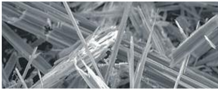
Les fibres de l'amiant o asbest perjudicials per a la salut.

A poc a poc, la conscienciació respecte dels perills del contacte amb l'amiant o fibrociment –barreja d'amiant i ciment– que s'ha fet servir durant dècades per fabricar 3.000 productes diferents i que és present a molts edificis de les ciutats, va creixent. En aquest sentit, el Ple de febrer va aprovar una declaració institucional a favor de detectar i retirar l'amiant dels