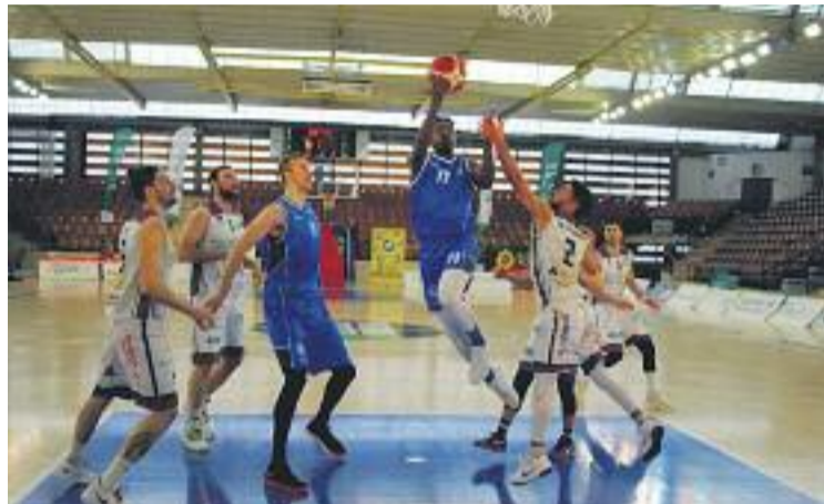
Els potablava continuen fermes a la zona alta de la taula.

Després de les victòries a casa contra el Valladolid i a la pista de l'Araberri (el partit contra l'Actel Força Lleida es va disputar quan ja s'havia tancat aquesta edició de Línia Mar ), els homes d'Arturo Álvarez segueixen depenent d'ells mateixos per lligar la primera posició del play-off i tenir l'avantatge de camp i jugar al Joan Busquets en les tres