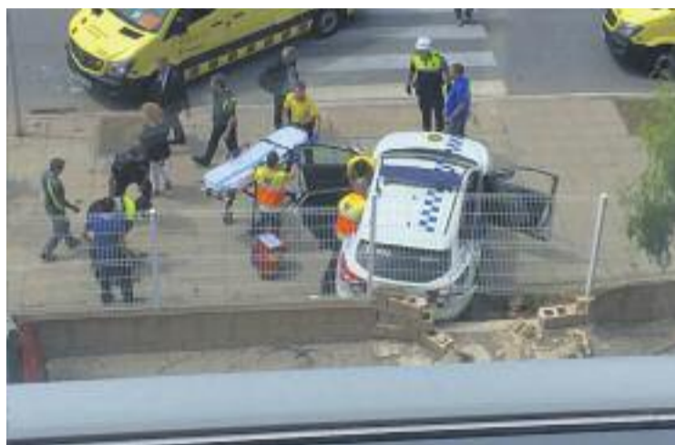
Instants posteriors al tiroteig del juliol passat.

L'Ajuntament, personat en la causa, respecta plenament la