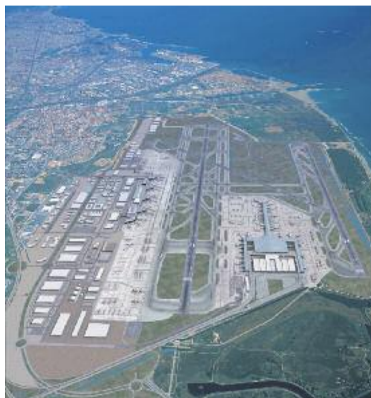
El ministeri de Foment ha anunciat un Pla Director per ampliar la capacitat de l'aeroport (dreta), mentre que els veïns segueixen amatents pel soroll dels avions.