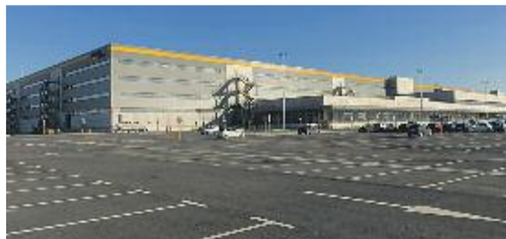
El centre logístic del Prat.

PRESENTACIÓ ▶ Amazon vol esvair dubtes pel que fa a la seva manera de funcionar i, per aquesta raó, vol ensenyar als seus veïns com funciona. En aquest sentit, ha organitzat visites guiades al seu centre logístic del Prat.