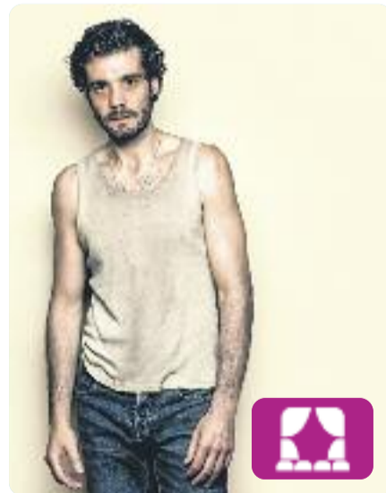
Sol solet Àngel Guimerà

No us deixeu enganyar per la ingenuïtat del títol que ressona a una coneguda cançó infantil. Aquest drama fa referència a la dolorosa soledat que ha emmotllat la sensibilitat de Jon, el qual es veurà immersit en un triangle de passions mal resoltes que farà aflorar les contradiccions de l'ànima humana.