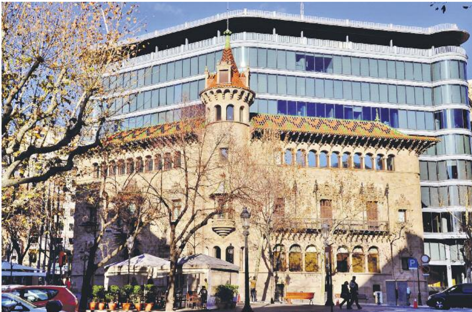
La dotació econòmica del Catàleg de Serveis del 2018 de la Diputació (a la foto) ha augmentat un 10% respecte de l'any passat.

» El Catàleg de Serveis ofereix als ajuntaments més de 67 milions en recursos tècnics i econòmics » L'any passat es van tramitar més de 16.000 sol·licituds de més de 350 governs locals