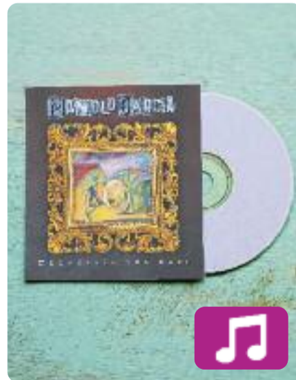
Geometría del rayo Manolo García

El 16 de març va ser la data escollida per Manolo García per al llançament del seu setè disc en solitari, Geometría del rayo (Sony Music, 2018).