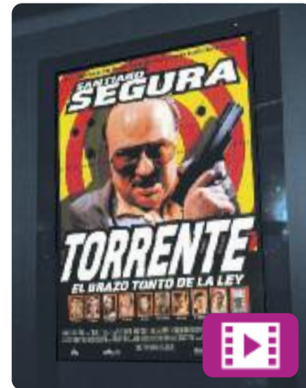
Torrente, el brazo tonto de la ley Santiago Segura

La setmana passada es van complir 20 anys de l'estrena d'una de les grans pel·lícules del cinema espanyol de finals del segle passat.