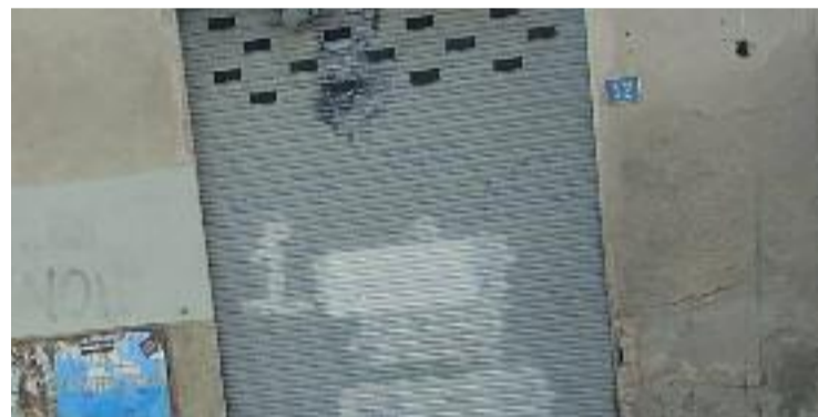
La persiana després de l'atac que denuncia l'ateneu.

De totes maneres, ERC ha registrat una proposta al Ple del dia 22 que insta al govern local a "evitar nous atacs terroristes" com el que va patir la Màquia.