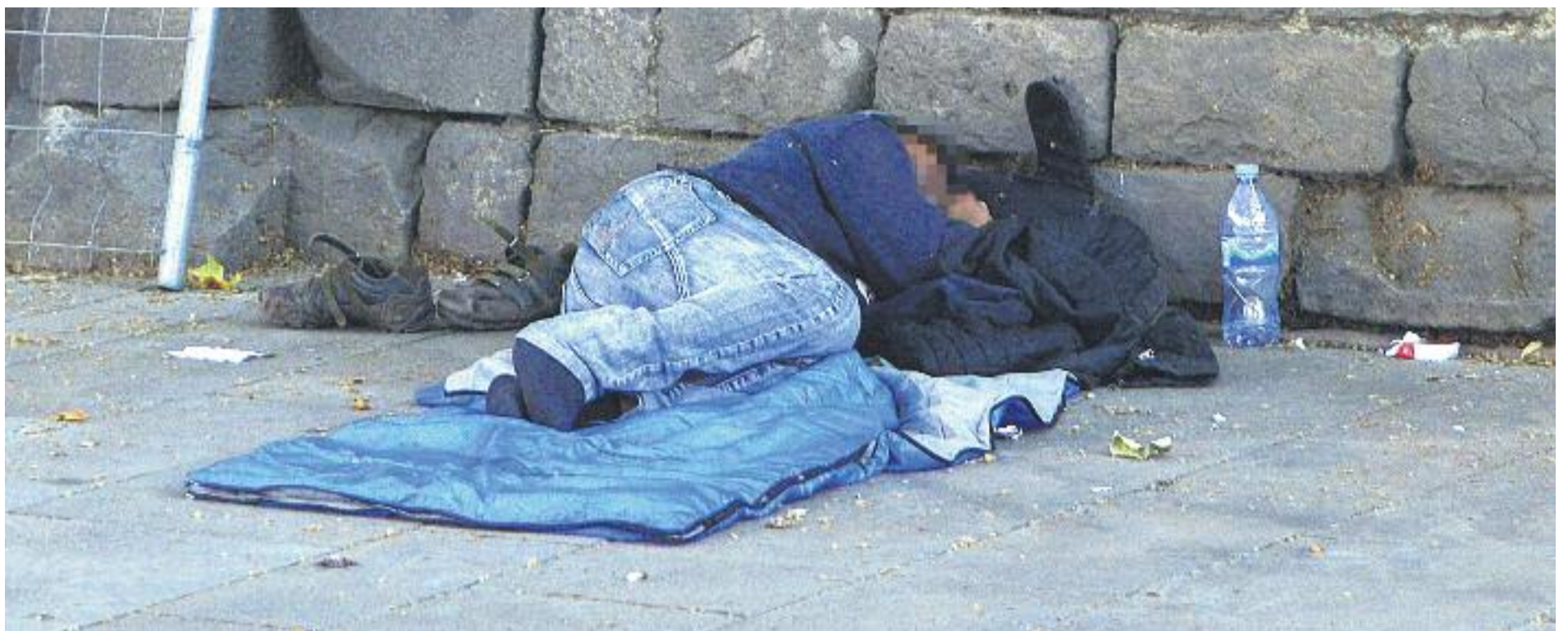
Càritas alerta de la cronificació de la pobresa a Catalunya.