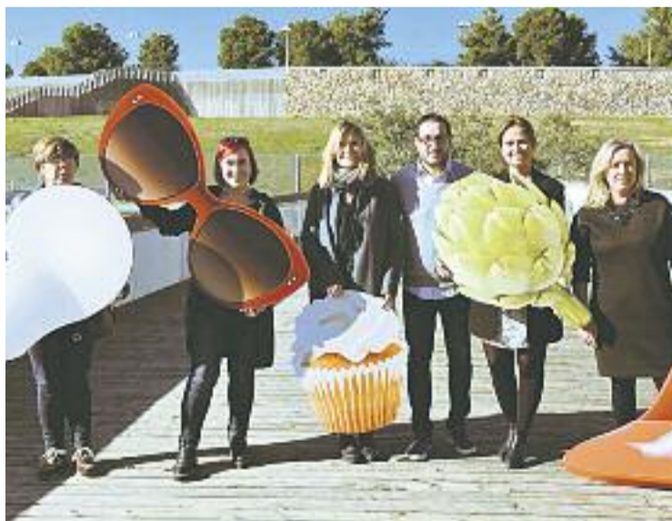
Els regidors presentant la campanya.

La campanya té imatges específiques per als diferents segments comercials com ara l'equipament de la llar, la roba i els complements, l'alimentació o les joguines. Les diferents imatges s'adapten a cadascun dels cinc municipis a través de múl-