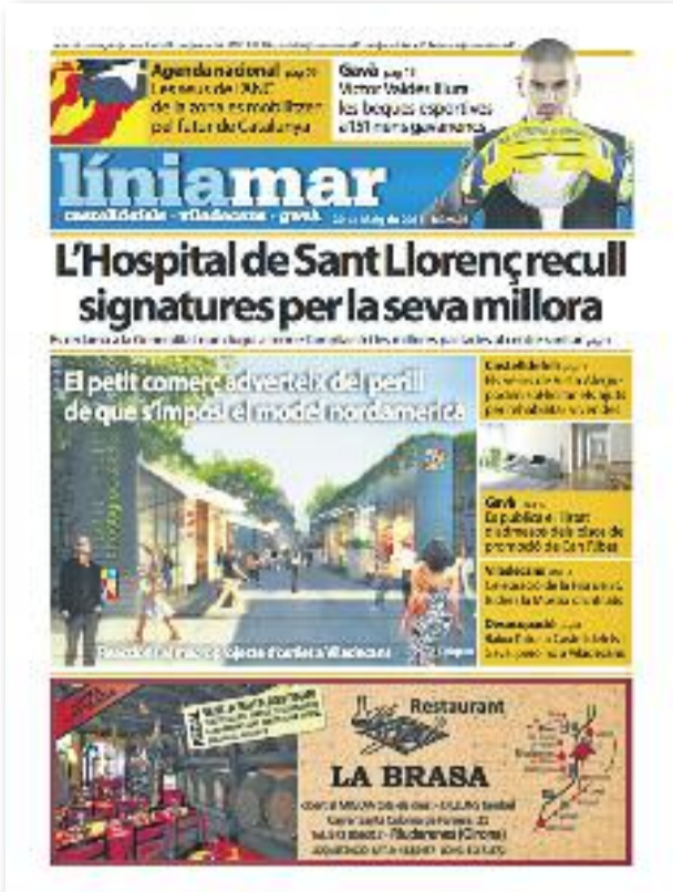
Número 1 · Maig del 2013