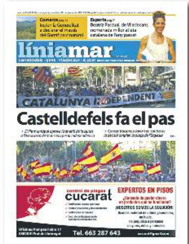
Número 25 · Juliol del 2015