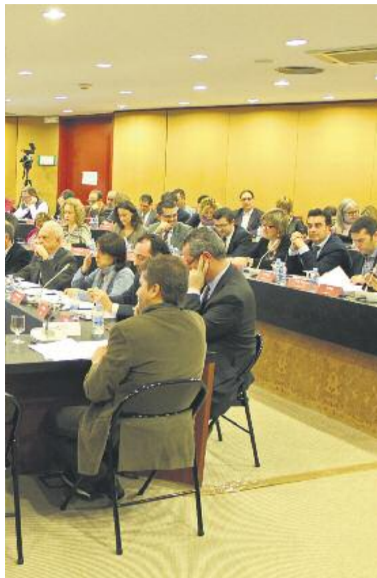
A l'esquerra, una imatge del parc fluvial del Llobregat i, a la dreta, un Ple del Consell de l'AMB.

URBANISME ▶ La planificació i gestió urbanística de les infraestructures del segle XXI té com un dels seus objectius que aquestes s'adaptin al seu entorn i que es redueixi el seu impacte mediambiental.