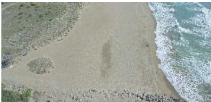
Les prestigioses dunes de la platja estan en perill.

Per altra banda, Viladecans també demana al ministeri que controli les mesures correctores establertes l'any 1999 en el marc de l'ampliació de l'aeroport, amb l'objectiu de garantir un fun-