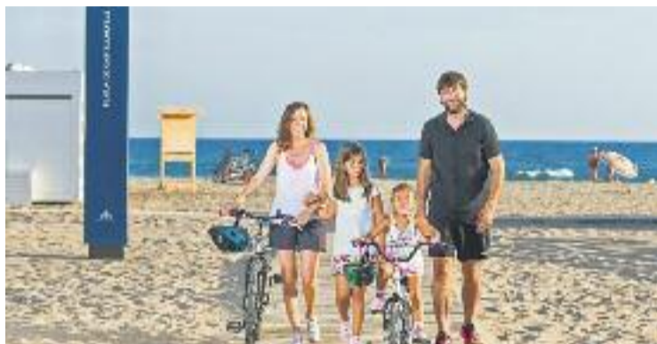
El turisme de sol i platja del Delta, clau a la comarca.

Una dinàmica que es veu traduïda en més places d'allotjament a la comarca. En aquest sentit, l'any passat hi va haver 30 noves places d'hotel, mentre