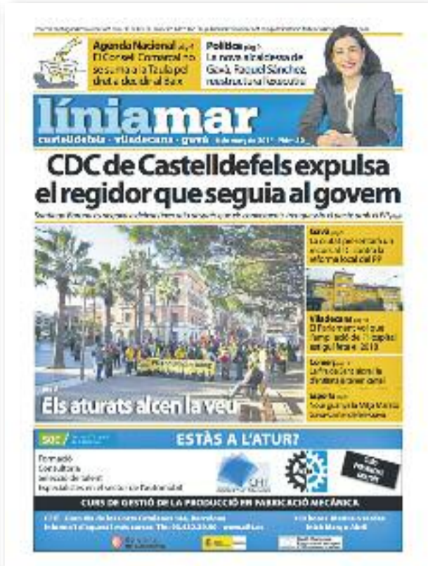
Número 10 · Març del 2014