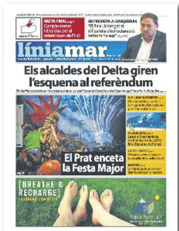
Número 48 · Setembre del 2017