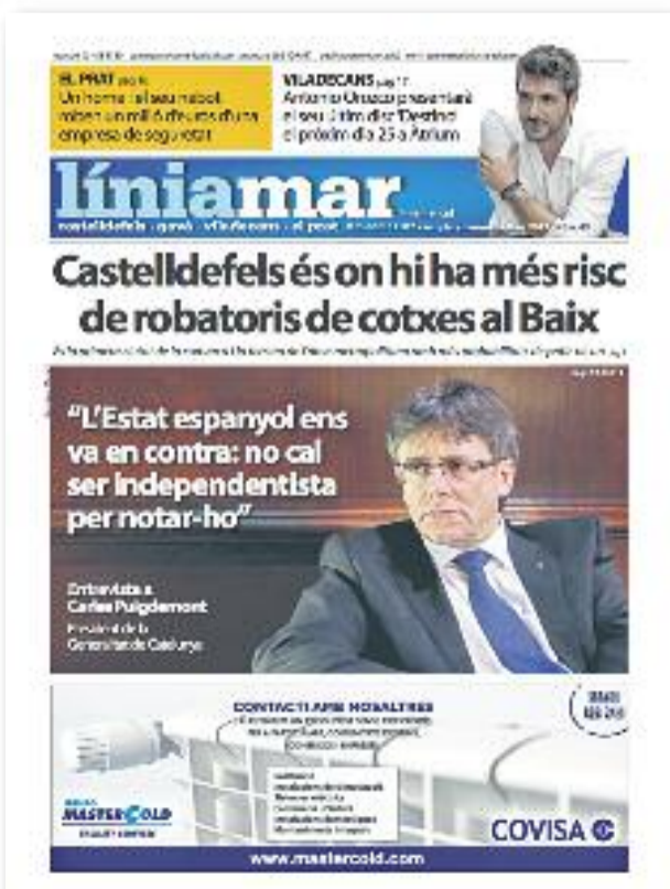
Número 43 · Març del 2017