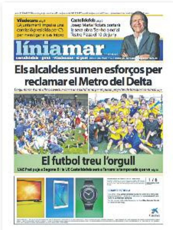
Número 34 · Maig del 2016