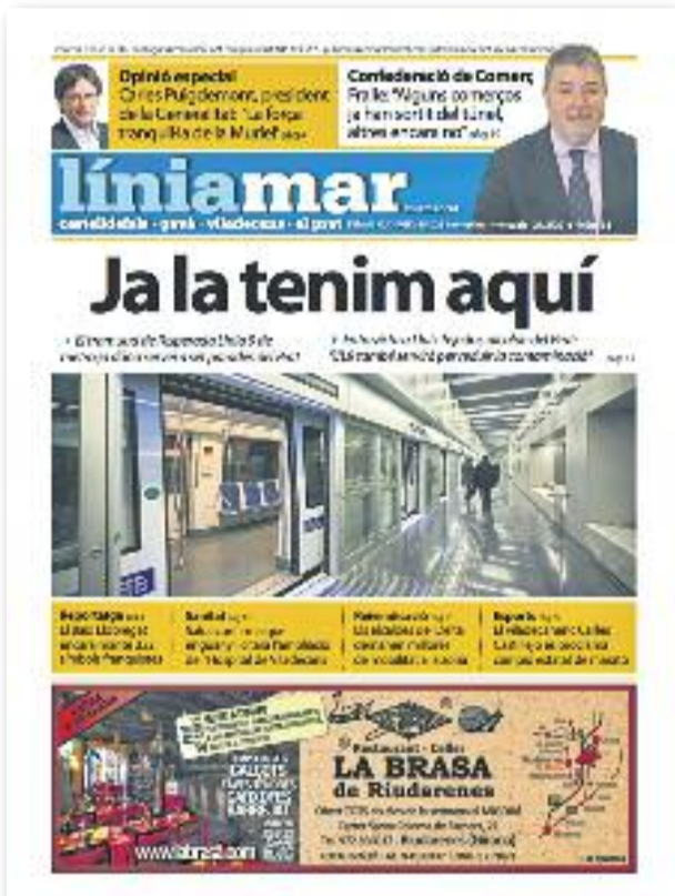
Número 31 · Febrer del 2016