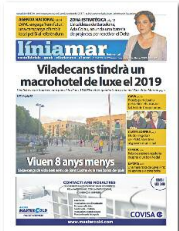
Número 41 · Gener del 2017