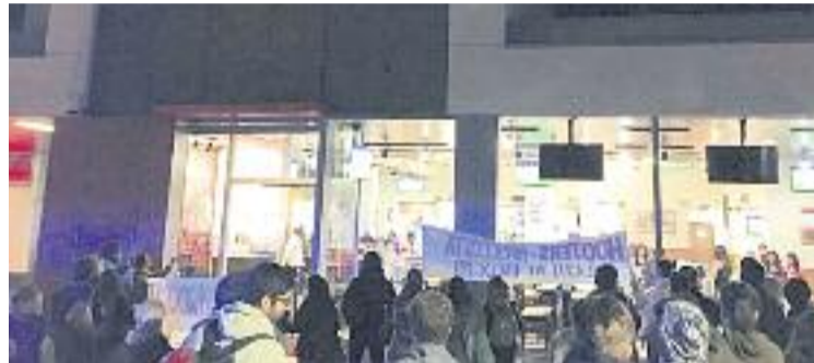
Manifestació davant de Hooters del dia 19.

Les mobilitzacions han estat convocades per l'Espai Feminista de Castelldefels, que critica que Hooters fa servir "el cos femení com a reclam i com a objecte sexual". I és que les cambres d'aquesta cadena serveixen el menjar amb un uniforme molt cenyit. Des de l'Espai Feminista deixen clar que no es tracta d'una protesta contra les cambres, sinó més aviat mobilitzacions que serveixen per "visibilitzar i informar la ciutadania" sobre una