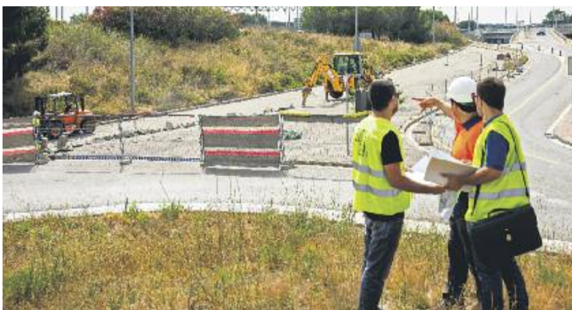
La mobilitat sostenible és un dels grans reptes de l'àrea metropolitana.