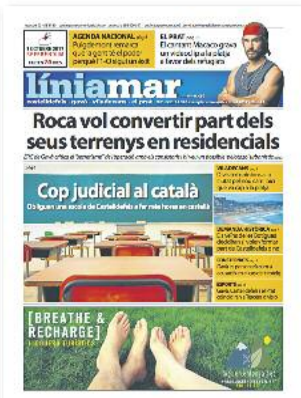
Número 47 · Juliol del 2017