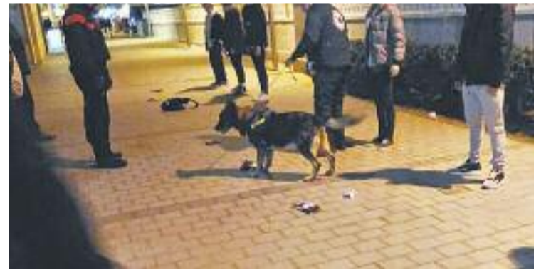
Un dispositiu policial amb gossos a la ciutat.

SALUT PÚBLICA ▶ El consum de drogues al carrer ha disminuït, asseguren des de la policia local. La raó té a veure amb els dispositius amb gossos especialistes que s'han posat en marxa darrerament a diverses zones de la ciutat. "Dels resultats obtinguts en l'últim dispositiu policial, podem constatar que s'està reduint el consum d'estupefaents i per tant que les accions amb gossos especialistes en detecció de drogues són una bona dinàmica de treball", expliquen.