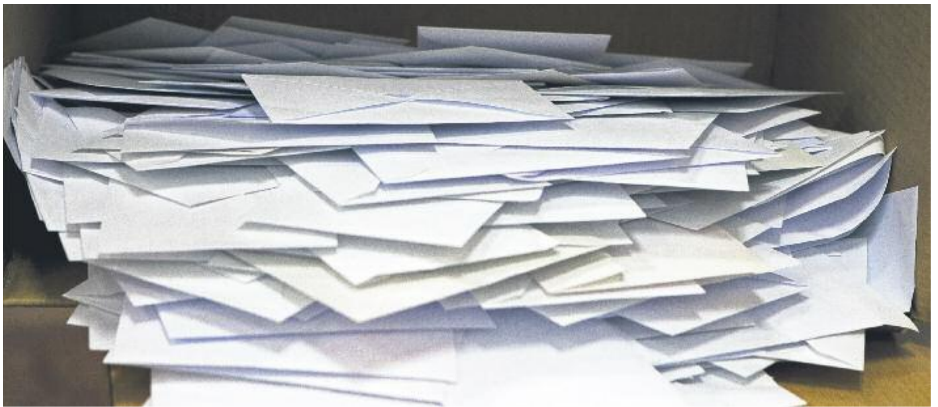
Junqueras va avançar que la data del referèndum es podria fixar al mes de juny.