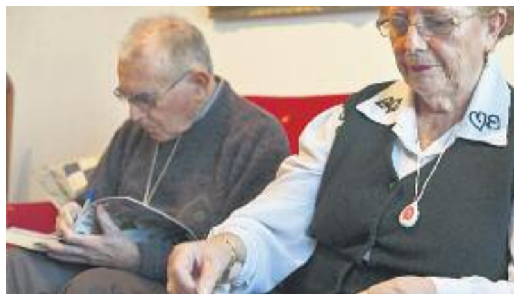
Actualment el servei té 73.000 usuaris.

DADES ▶ El Servei Local de Teleassistència (SLT) de la Diputació de Barcelona és un servei d'atenció domiciliària que garanteix la seguretat i dona tranquil·litat i acompanyament a les persones en situació de risc per factors d'edat, fragilitat, solitud o dependència, entre altres.