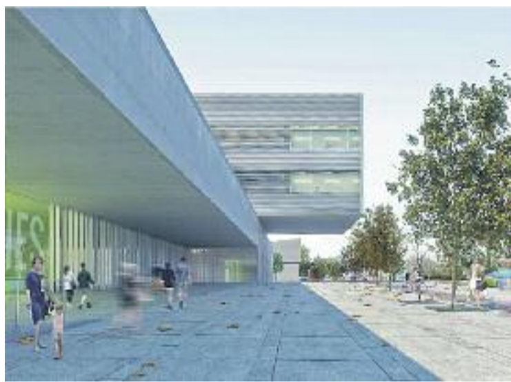
Recreació del nou edifici que, de facto, serà el nou hospital.

SALUT ▶ L'ampliació de l'Hospital de Viladecans, llargament demandat pel territori, veurà la llum aquest mateix any. Segons un comunicat d'ERC-Gavà fet públic citant fonts de la conselleria de Salut, una primera inversió de més de vuit milions d'euros permetrà iniciar la primera fase del projecte aquest mes de setembre. Les partides aprovades sumen 8.382.127.90 d'euros destinats a adquirir la finca on es farà l'edifici de l'ampliació i els primers tràmits per començar l'execució de les obres, mitjançant l'empresa pública Arquitectura i Infraestructures de la Generalitat.