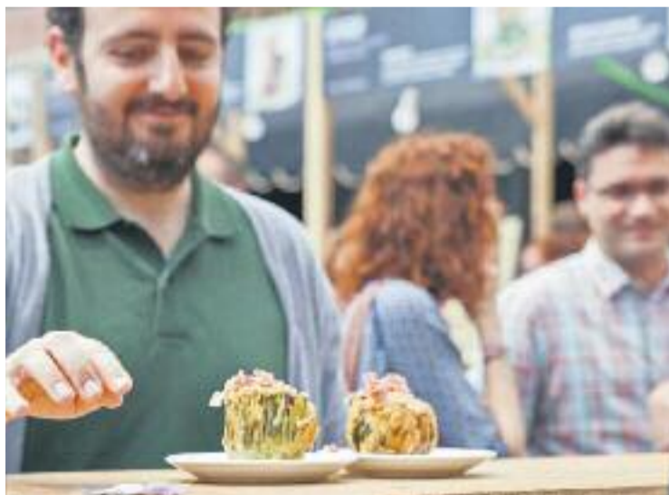
Hi haurà 37 tapes disponibles a la ruta.

En aquest sentit, els restauradors participants han acceptat, un any més, el repte de crear "propostes desconegudes, originals, artesanes i de qualitat". Per altra banda, la ruta també serà "una excusa" per desco-