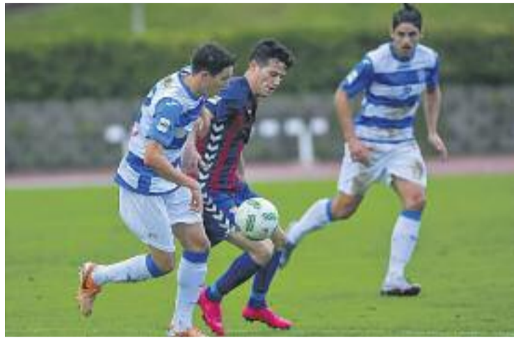
Un moment del partit de la primera volta a la Bòbila.