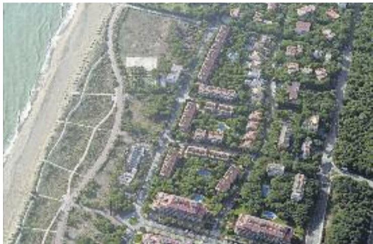
La Declaració censura models de creixement urbanístic.

Aquesta declaració es va aprovar durant la 17a Assemblea de la Xarxa de Ciutats i Pobles cap a la Sostenibilitat, a la qual Gavà està adherida. Es tracta d'una plataforma creada fa 20 anys i que permet sumar recursos als municipis per aconseguir objectius mediambientals de sostenibilitat. L'assemblea va acordar sumar-se als objectius d'aquest any i impulsar un model de turisme responsable, econòmicament pròsper, sostenible i socialment inclusiu.