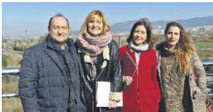
Les ciutats del Delta, menys El Prat, reclamen inversions.

El nou projecte –consistent en la construcció d'un tram de doble via d'una longitud aproximada de 22,4 km i amb 11 estacions, quatre de les quals de nova construcció– es va aprovar inicialment l'any 2010, però des