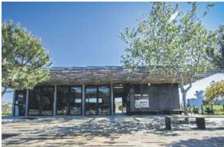
El centre oferirà visites guiades als espais naturals adjacents.

Amb l'objectiu de mantenir els espais naturals del municipi, en aquesta oficina també es ges-