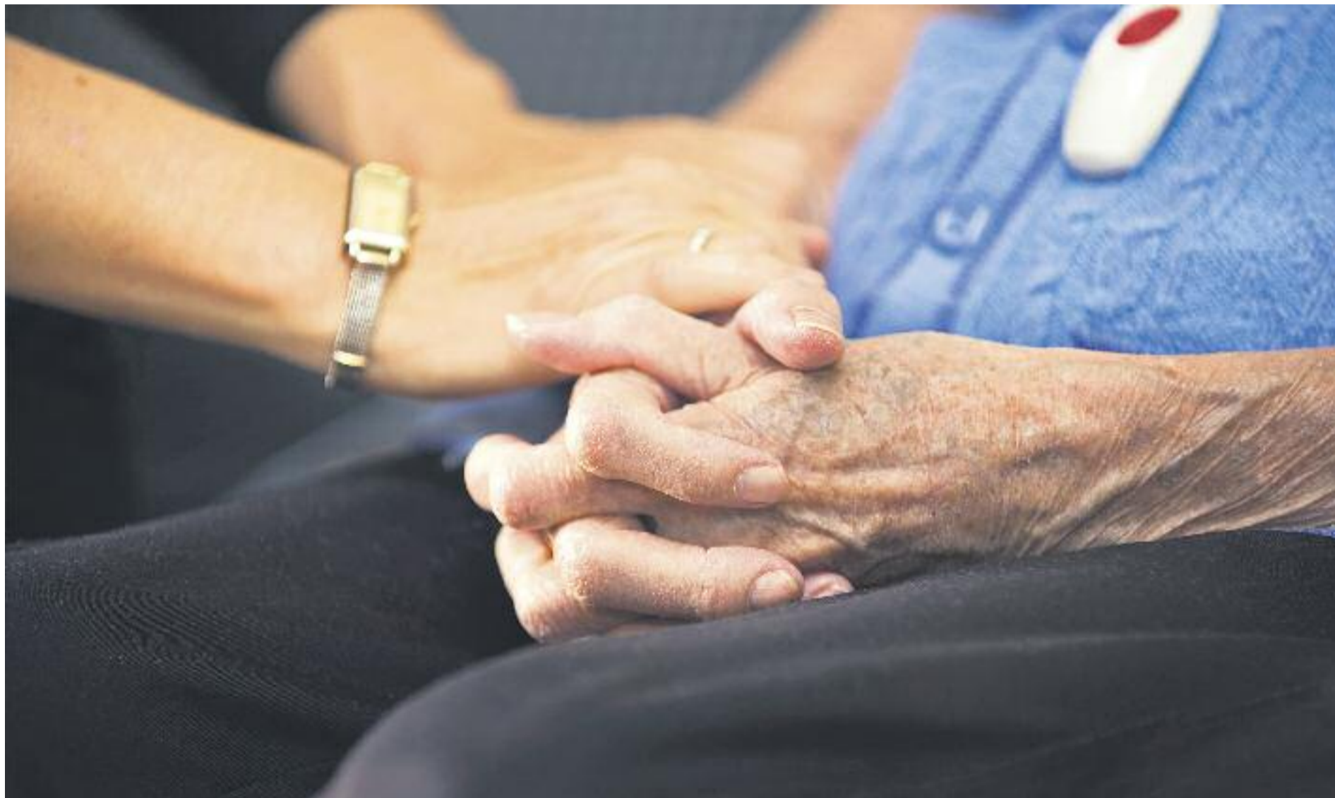
El Servei de Teleassistència és un servei proactiu que va més enllà de la resposta davant d'una emergència.

TELEASSISTÈNCIA ▶ Passar dels 73.000 usuaris actuals del Servei Local de Teleassistència (SLT) de la Diputació de Barcelona als 100.000 l'any 2020. Aquest és l'objectiu que es marca l'organisme amb l'ampliació de la cobertura d'aquest servei, amb més dispositius i més unitats mòbils d'atenció a les emergències. D'aquesta manera, s'atén la creixent demanda dels municipis de la demarcació.