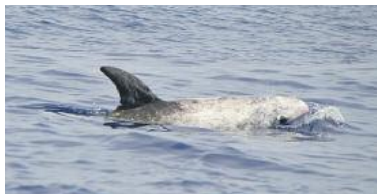
El cetaci Akasha en una imatge del 2014.

MEDI AMBIENT ▶ El dofí cap d'olla que va aparèixer sense vida a la platja de Gavà estava identificat per l'Associació Cetàcea, una entitat que es dedica a l'observació i estudi d'aquests animals quan s'acosten al litoral català. L'exemplar es deia Akasha, feia més de tres metres de llarg i va ser identificat fa dos anys davant la costa del Garraf.