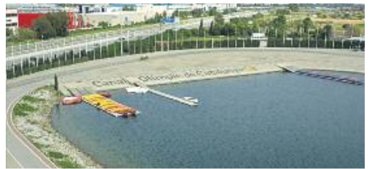
El canal va ser construït amb motiu dels Jocs Olímpics del 92.

Actualment s'està treballant en la segona i tercera fase, durant les quals es rehabilitaran els espais d'ús públic i s'adquirirà material esportiu. Aquestes accions estan subvencionades per la Diputació.