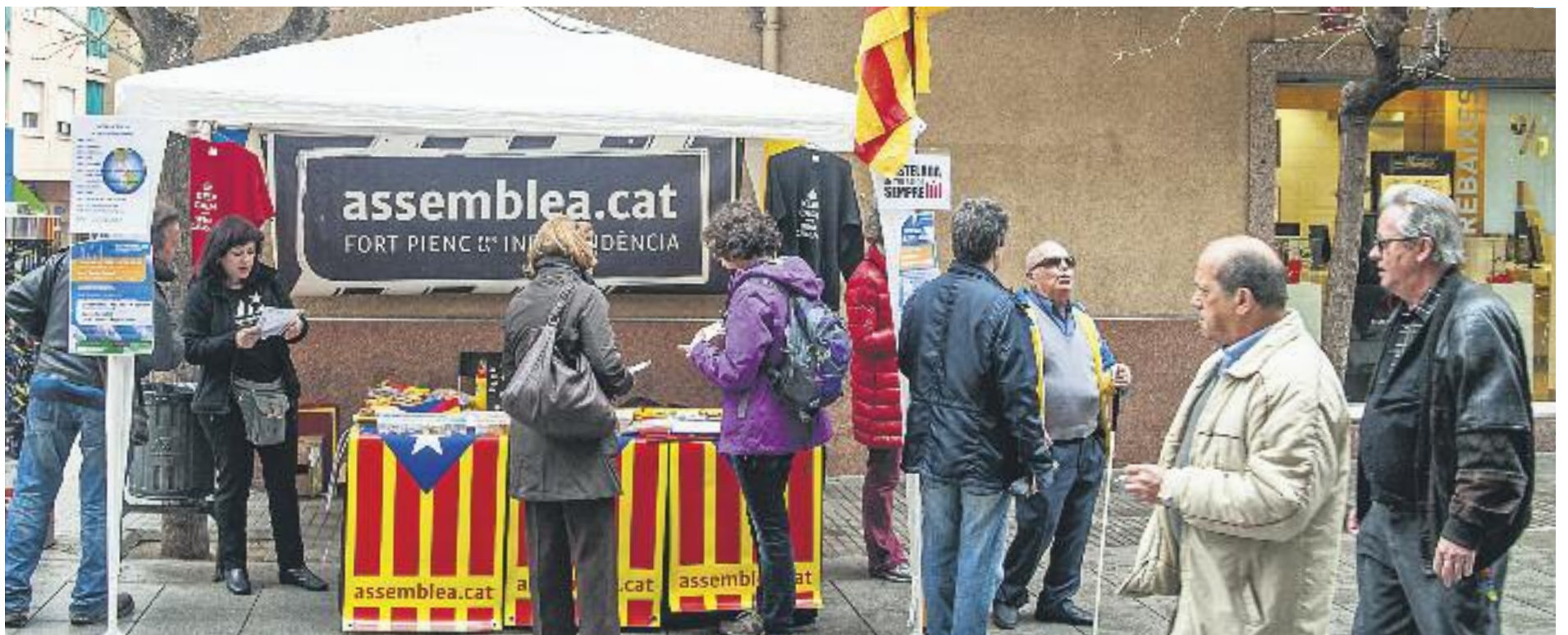
La feina de carrer, principal eina de les entitats independentistes.