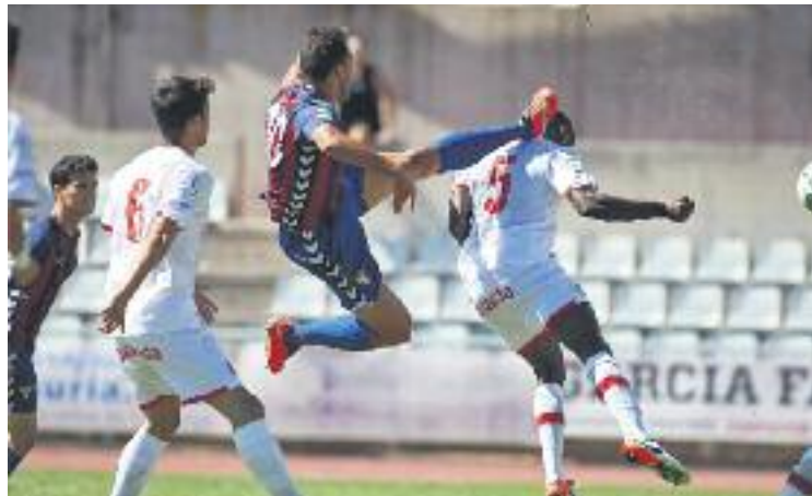
Gavà i Mallorca B van empatar sense gols.

El Prat va apel·lar al seu orgull i va sobreposar-se a la seva inferioritat numèrica amb un esforç extra de tots els jugadors, una actuació que va fer que el tècnic elogiés els seus homes després del partit i també a les xarxes socials. Porcar i Salinas van tenir les ocasions més clares per als riberecs, però Ignacio i