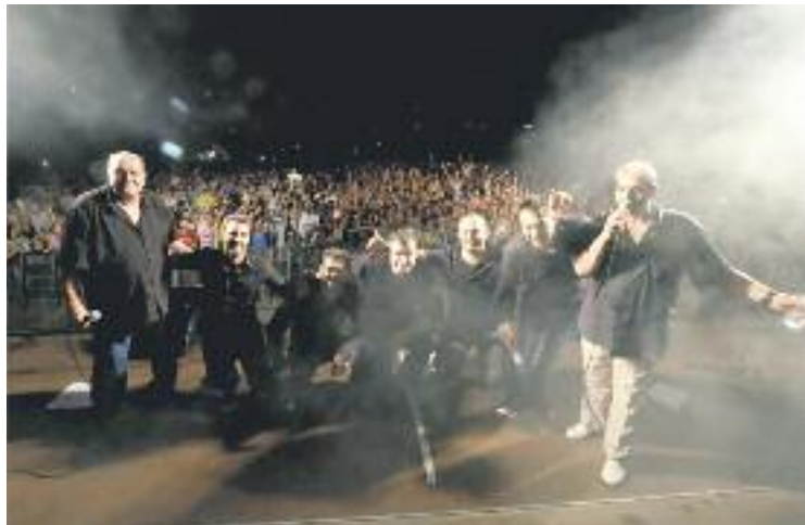
Milers de persones van cantar èxits com Ni más ni menos.