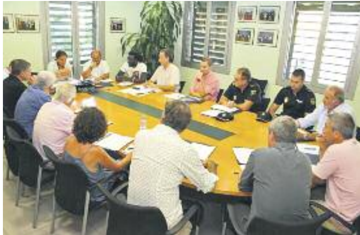
Imatge de la primera reunió de la taula.

Una altra voluntat de la nova taula és conscienciar la població perquè no compri articles al top