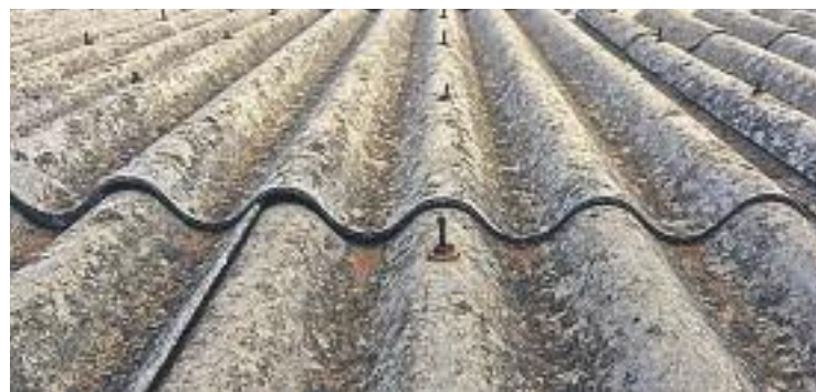
L'amiant és conegut popularment com a 'uralita'.

SALUT PÚBLICA ▶ Pas important del serial per l'amiant al Prat. El Ple de va aprovar fa uns dies per unanimitat una moció presentada per l'Associació de Victimes Afectades per l'Amiant a Catalunya, que insta el govern municipal a fer un inventari de l'amiant present en els equips i a deslliurar-se'n. Es tracta d'una moció pionera i que obre la porta a que es pugui crear un fons de compensació per a les persones que tinguin problemes de salut derivades de la presència d'aquest material.