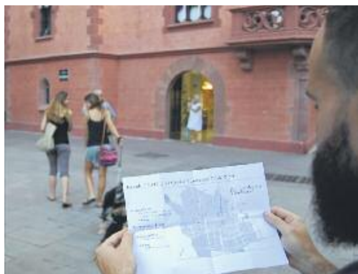
La ruta va recordar l'impacte del franquisme.