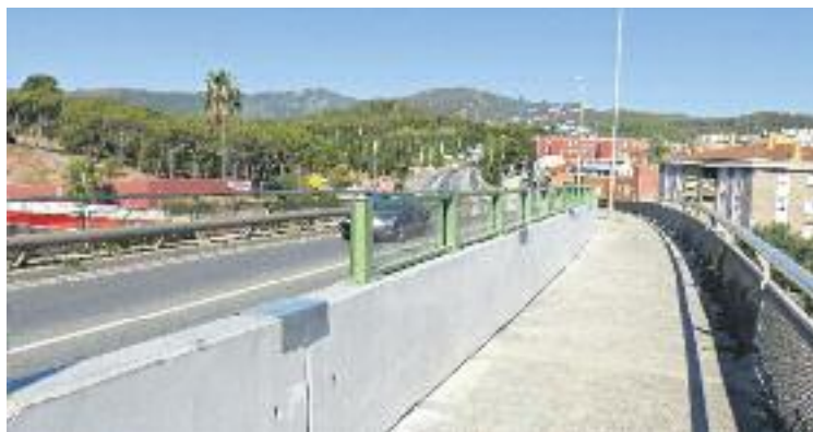
Les pantalles mesuren metre i mig i separen calçada i vorera.

Es tracta d'una construcció llargament reivindicada tant pels veïns i veïnes de la zona com