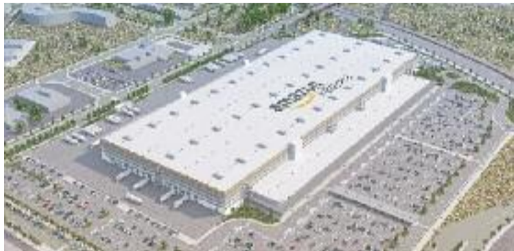
Amazon ha confirmat definitivament que s'instal·larà al Prat.

L'estudi de l'FDI ha dividit les ciutats d'Espanya i Portugal en tres categories: grans –amb una població de més de 400.000 habitants–, mitges –entre 400.000 i 150.000– i petites –de 150.000 a 50.000–, situant-se el Prat en aquesta darrera categoria.