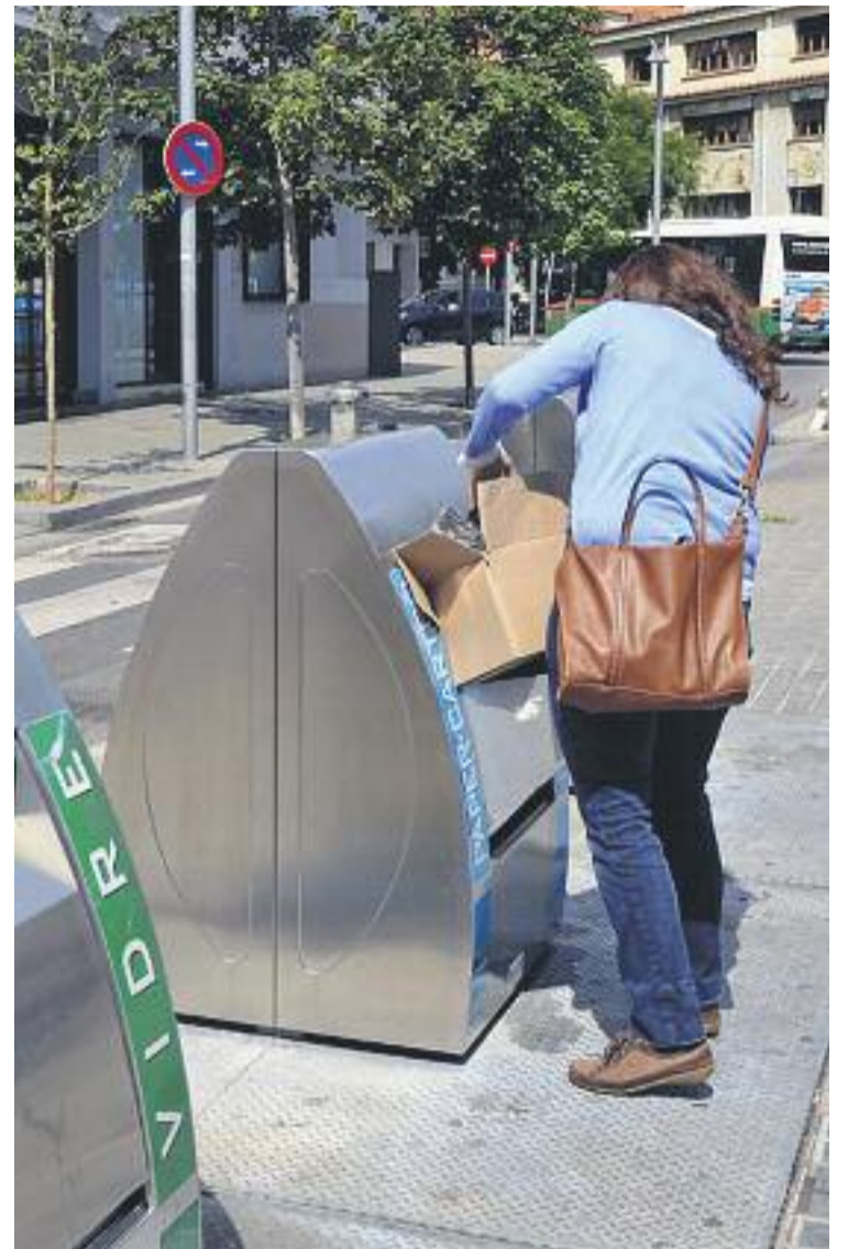
Tot i que moltes persones ja reciclen, gran part d'elles encara no fan una bona recollida selectiva de residus.