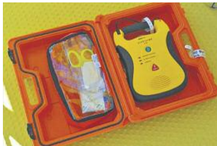
Els nous desfibril·ladors són semiautomàtics.

La idea del consistori, ara, és seguir-ne instal·lant en tot el municipi en diverses fases. La següent seria als cotxes patrulla de la policia local i després, a les farmàcies.