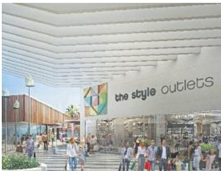
Imatge digital del futur outlet de Viladecans.

A Viladecans, el consistori ha dut a terme durant més d'un any una