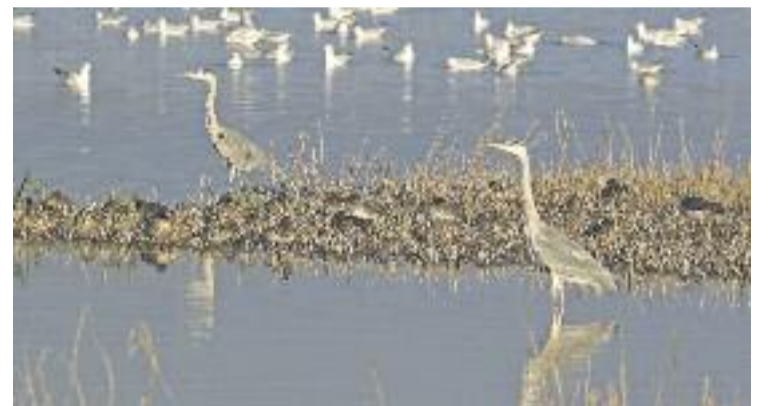
Depana denuncia afectacions negatives a les espècies.

Els ecologistes, a més, han denunciat a la Comissió Europea suposades vulneracions de les directives comunitàries. Creuen que al Delta no s'estan tenint en compte els criteris científics i d'avaluació ambiental requerits en els espais naturals protegits. Depana denuncia que aquesta manca de control està afectant negativament les espècies.