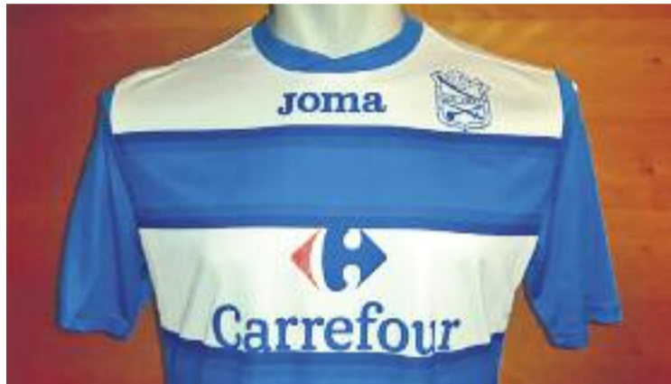
Els potablava vestiran aquesta samarreta el curs 2016-17.

Pel que fa al vessant institucional, divendres passat el club va