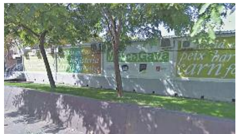
ERC volia reubicar les parades a la plaça de Batista i Roca.

L'equip de govern de l'Ajuntament no va fer tirar endavant la demanda, ja que, segons el consistori, "hi ha paradistes que no hi estan d'acord". Davant d'això, ERC de Gavà lamenta que "aquesta petició veïnal quedi desatesa".