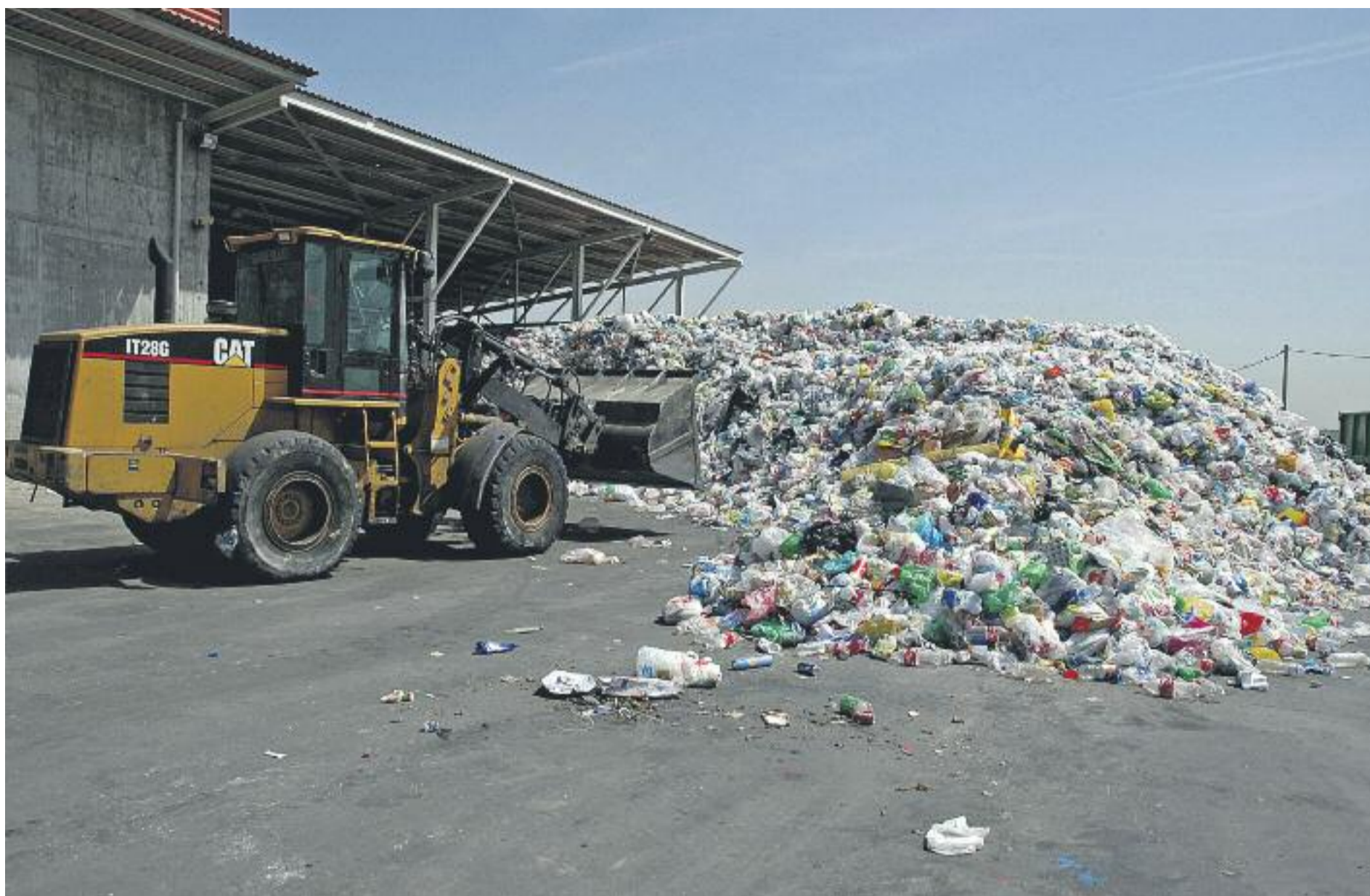
Les taxes baixes de reciclatge provoquen que a les plantes de gestió s'hagi de fer un doble circuit de selecció de residus.