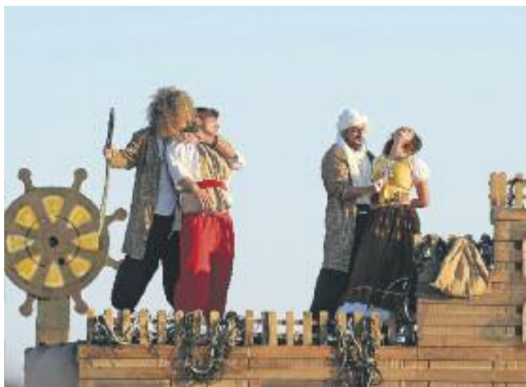
Un moment del Desembarcament de Pirates.

No va faltar tampoc la missa solemne en honor a la Mare de Déu del Carme, patrona de les festes, a l'església de Can Bou. Seguidament, es va celebrar la tradicional Processó que va recórrer els carrers dels barris amb tradició marinera i el cen-