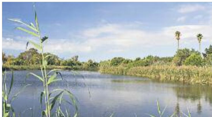
Riera de Sant Climent.

DEMANDA ▶ El consistori ha anunciat que reclamarà a Aena assumir la gestió de la franja litoral de Viladecans, amb l'objectiu de retornar a la ciutadania aquest espai. Es tracta dels terrenys expropiats per Aena fa una dècada dels càmpings la Ballena Alegre, Toro Bravo i Filipines, per construir-hi la tercera pista.