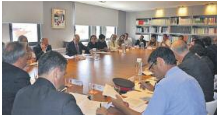
Una imatge de la reunió per evitar la venda ambulants il·legal.

Els alcaldes van coincidir a opinar que "la solució a la problemàtica no pot venir donada en cap cas per l'actuació d'un sol municipi", una afirmació que Colau va verbalitzar amb la fra-