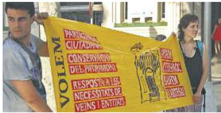
Concentració de la plataforma davant de l'Artesà.

POLÈMICA ▶ El 6 de juliol la Plataforma Salvem l'Artesà va presentar una moció al Ple en defensa de la rehabilitació de l'emblemàtic teatre i a favor d'un procés participatiu ciutadà. Actualment, el Teatre Artesà està pendent d'enderroc i d'un projecte de construcció d'un nou edifici a càrrec dels arquitectes Bosch-Forgas.