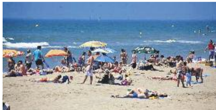
El consistori reclama mesures per evitar el retrocés de la platja.

MEDI AMBIENT ▶ Després de la reclamació del Ple el mes passat per trobar solucions a la regressió de la platja, fa poc es va conèixer que la ciutat rebrà una aportació de 40.000 metres cúbics de sorra per evitar aquest fenomen.