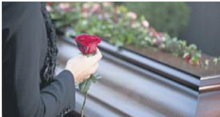
El serial pels serveis funeraris segueix endavant.

L'entitat també denuncia el "monopoli" funerari de l'empresa Àltima, el qual "impossibilita l'entrada de nous operadors que ofereixin preus més econòmics a la ciutat". Esfune, a més, lamenta que al web mu-