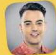
La tribu de Catalunya Ràdio Amb Xavi Rosifol De dilluns a divendres, de 16 a 19 h