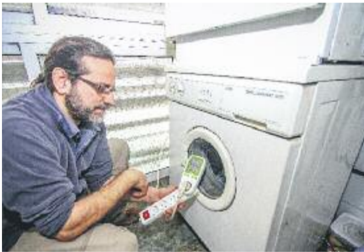
Un dels tècnics durant una sessió d'assessorament.