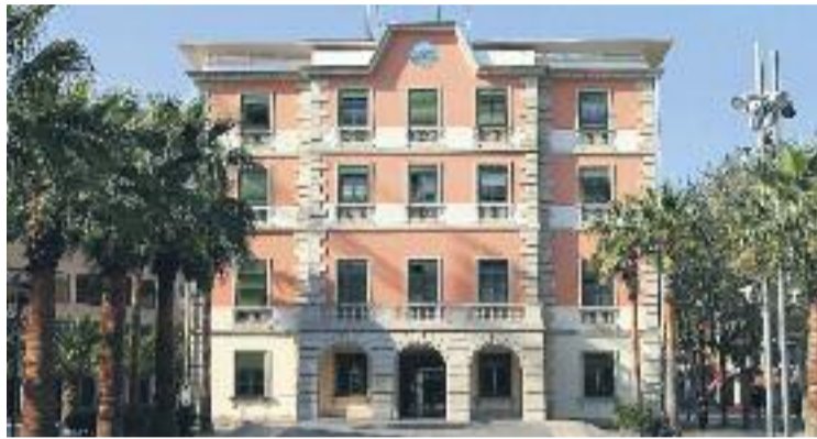
El consistori demana un "esforç més gran" al Govern.

En concret, les partides que exigeix el consistori són el deute amb el municipi (3,2 milions d'euros); el deute reconegut per l'Agència Catalana de l'Aigua (ACA), de 743.479 euros i un altre de 4,3 milions que l'ACA no reconeix i que estan pendents d'un contenciós administratiu entre el consistori i l'agència; 1,5 milions d'euros del cost de les obres del quart institut, que de moment ha assumit el consistori, "tot i no tenir-ne la competència", recorda l'Ajuntament; i 423.500 euros que també ha avançat l'Ajuntament en les obres