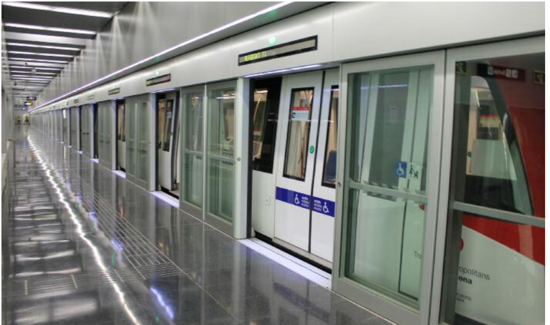
El tram sud de l'L9 està en funcionament des del passat dia 12 de febrer.

» El tram sud de la Línia 9 de metro entra en funcionament amb 20 quilòmetres i 15 estacions » La nova línia uneix Zona Universitària amb l'aeroport del Prat en poc més de mitja hora