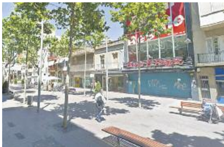
La rambla de Maria Casas acollirà la jornada.

Amb aquesta iniciativa també es volen "promoure nous hàbits a l'hora de fer les compres", expliquen els organitzadors, que mostren la voluntat de "posar