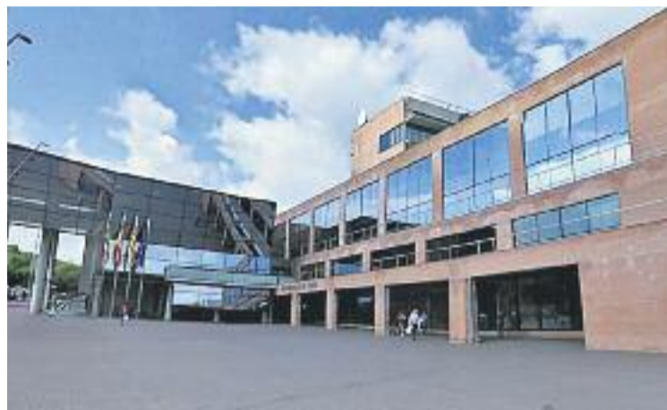
El consistori va presentar el PAM el 16 de febrer.

Les prioritats del nou PAM, segons recull el consistori en el document, estan classificades en diversos àmbits: Persones i Famílies, Economia i Treball, Ciutadania i Territori i Govern Obert .