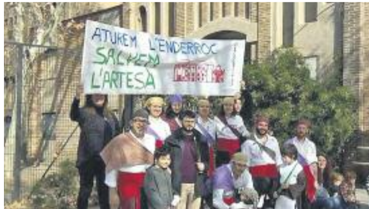
Una de les mostres de suport a l'antic edifici.

Tanmateix, des de la Plataforma Salvem l'Artesà denuncien "l'opacitat" del procés i demanen aturar el projecte del nou teatre per evitar que s'enderroqui l'actual. Això ho diuen d'acord amb un estudi tècnic que plantejava com a "viable" la rehabilitació de l'estructura de l'edifici. Sobre aquesta qüestió, l'alcalde, Lluís Tejedor, argumenta que amb aquest estudi "es podria garantir que l'estructura de l'edifici no s'enfondrés, sí",