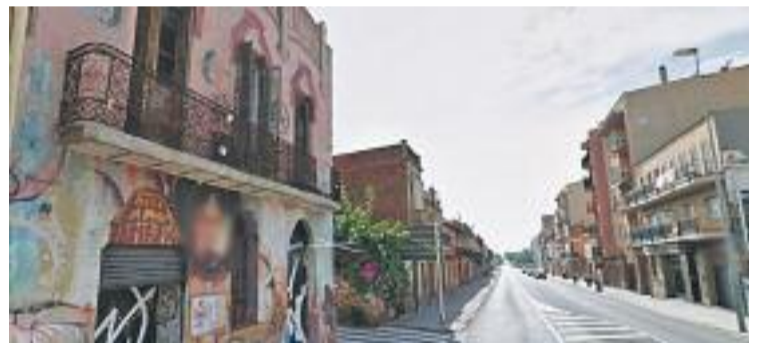
Aspecte actual de les cases de l'avinguda de la Generalitat.

Els membres de la plataforma també van crear una entrada al portal web Change.org amb l'objectiu de rebre suport per preservar els seus domicilis. Van rebre 500 adhesions.