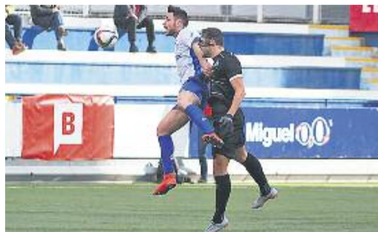
El Prat gaudeix de 10 punts d'avantatge sobre el segon.

BAIX LLOBREGAT ▶ L'AE Prat continua imparable i el CF Gavà ja s'ha refet de la seva mala ratxa.