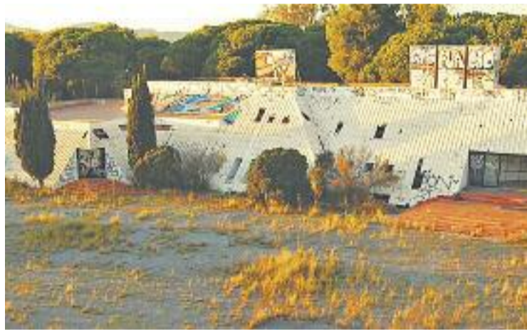
La barraca era a l'antiga discoteca Silvi's.

La barraca tenia una superfície de vint-i-cinc metres quadrats i s'hi van trobar matalassos, bombones de butà i diversos estris. Els Mossos d'Esquadra es van fer càrrec de la investigació.