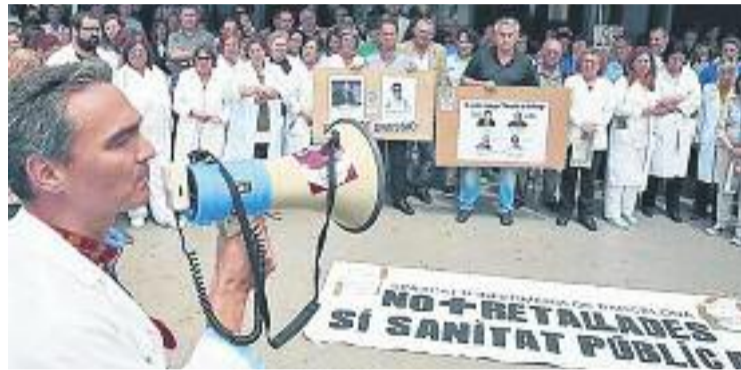
Una de les protestes davant de l'Hospital.

El conseller Toni Comín ha confirmat que es presentarà un Pla funcional mentre es facin els treballs, aspecte que demanen els alcaldes de la zona i la Plataforma en Defensa de l'Hospital de Viladecans (PDHV) des de fa anys. També presentarà una proposta econòmica per dotar de més recursos el centre.