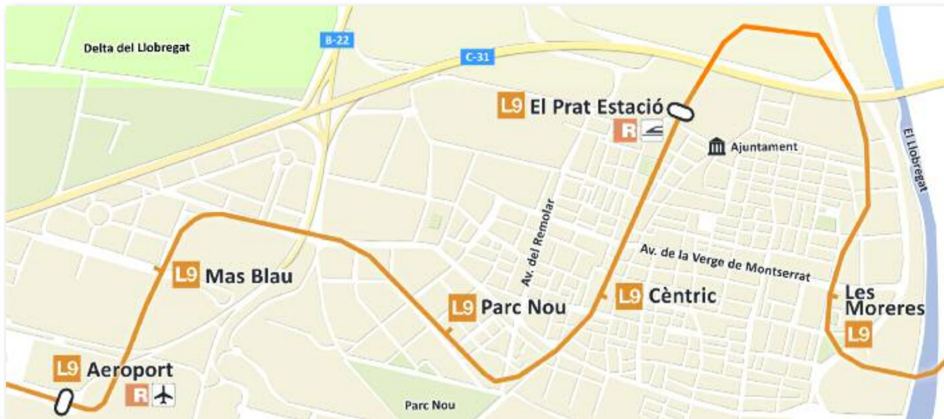
El Prat té quatre parades de la Línia 9 al seu nucli urbà. Infografia: Línia Mar

» Els veïns celebren l'arribada de l'L9 i destaquen els beneficis en la mobilitat local i comarcal que suposa » El nou tram té set parades al municipi, quatre de les quals estan ubicades al seu nucli urbà