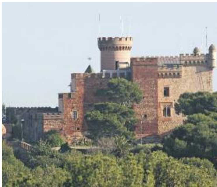
Les jornades tindran lloc mensualment.

Pel que fa a les propostes gastronòmiques, se'n van encarregar els alumnes de l'Escola local d'Hostaleria de Castelldefels i de