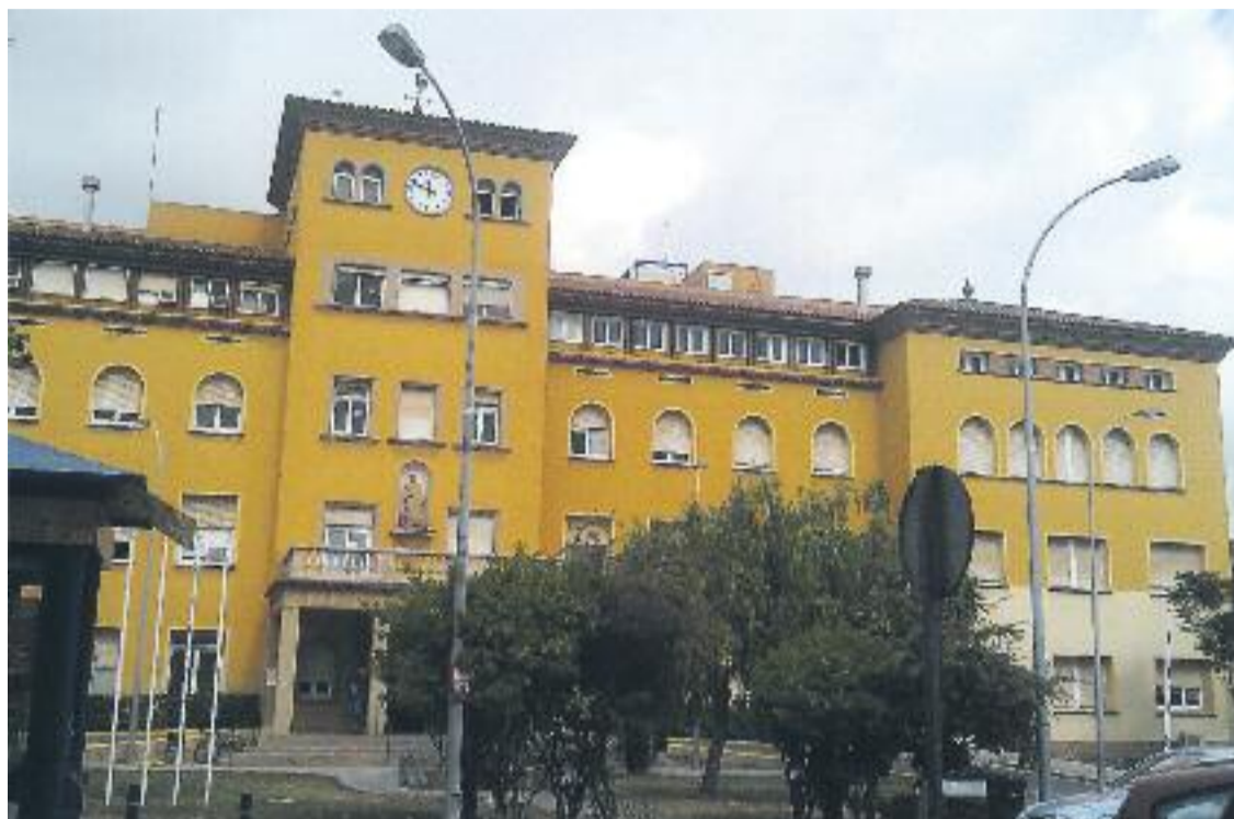
Façana de l'edifici de l'actual Hospital de Viladecans.

» La Comissió de Salut del Parlament insta el Govern a fer les obres en quatre anys i garantir el centre com a hospital de referència