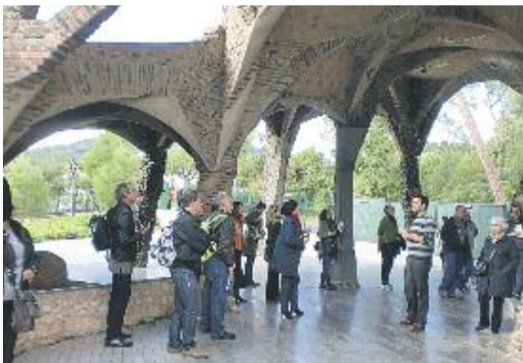
La Colònia Güell és un dels destins més turístics de la comarca.

TURISME ▶ El Consorci de Turisme del Baix Llobregat ha estrenat recentment una pàgina a Facebook.