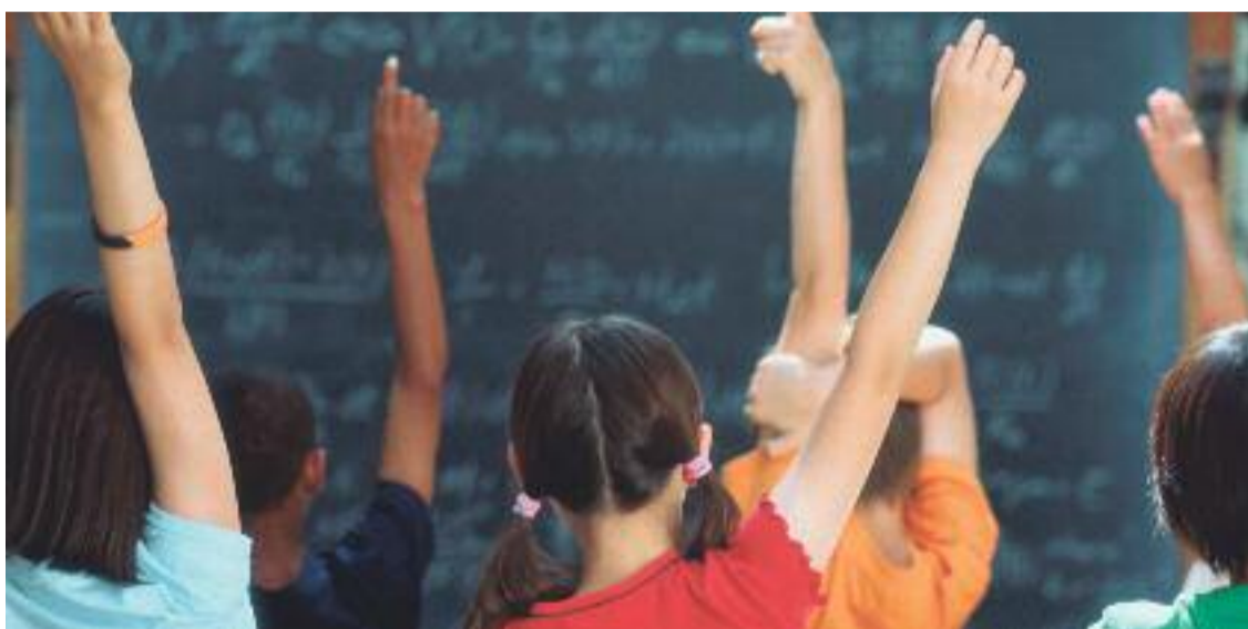
Tota la informació sobre la preinscripció escolar es pot consultar a gencat.cat/preinscripcio .

La documentació que cal presentar és l'original i la fotocòpia del llibre de família o altres documents relatius a la filiació, i l'original i la fotocòpia del DNI de la persona sol·licitant (alumne major de divuit anys, mare, pare o tutor) o de la targeta de residència on consta el NIE, si es tracta de persones estrangeres. Les dades d'identificació o filiació per a infants estrangers poden acreditar-