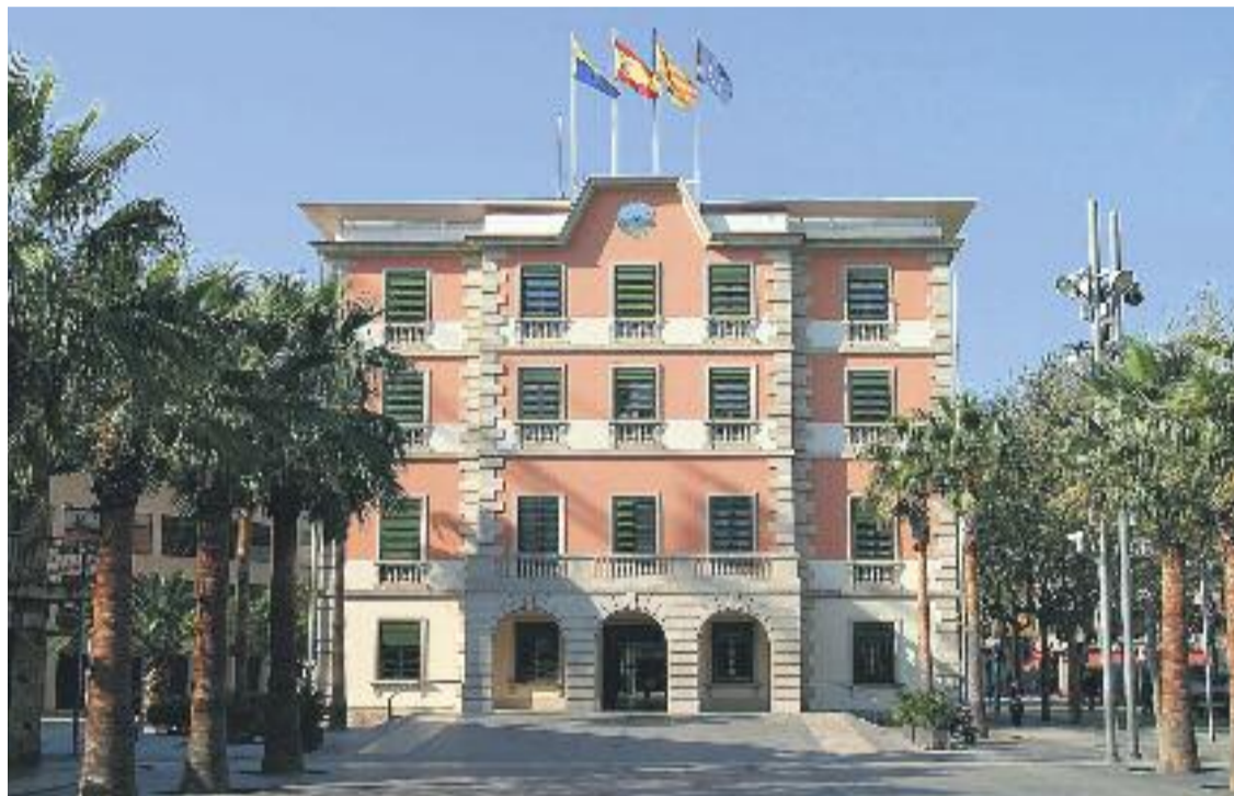
Edifici de l'Ajuntament de Castelldefels.