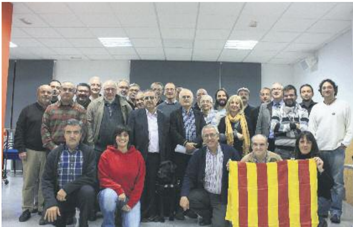
Participants en la constitució de la TPDD del Baix Llobregat, el desembre.

» L'ens supramunicipal ha rebutjat adherir-se al projecte sobiranista del Baix Llobregat amb els vots en contra del PSC, PP i PxC