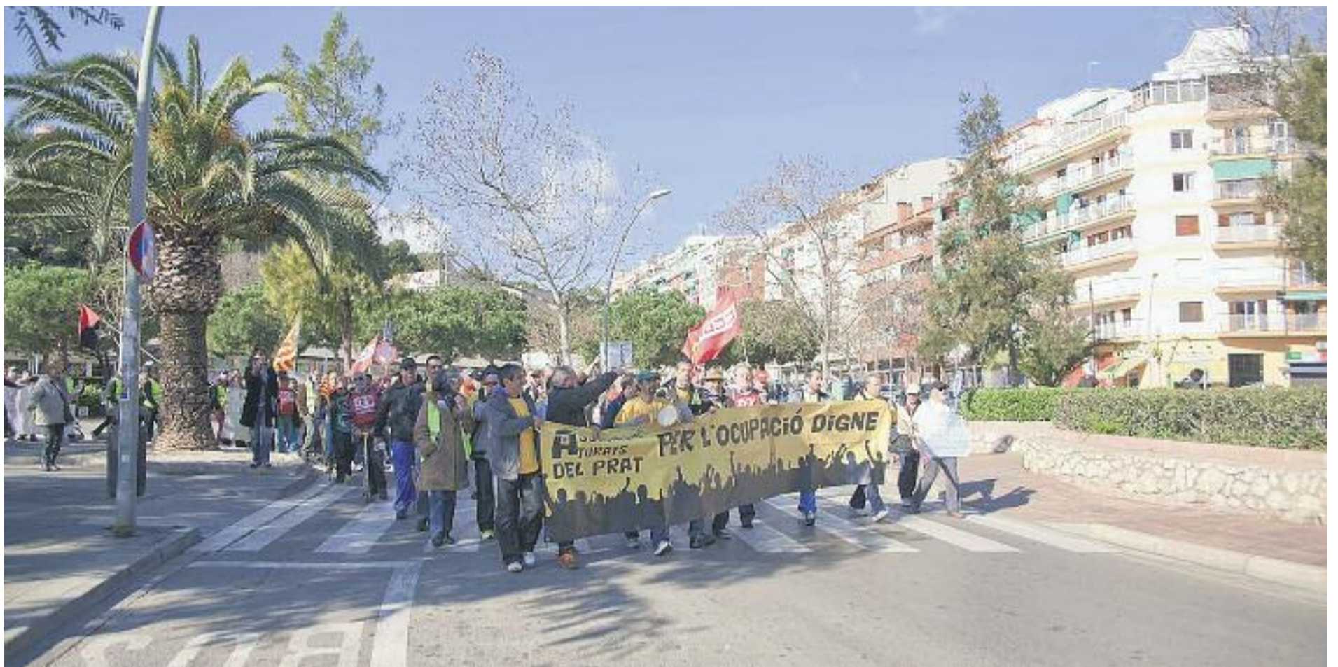
La marxa, al seu pas per Castelldefels, dirigint-se a Sant Boi de Llobregat durant el primer dia de protestes.