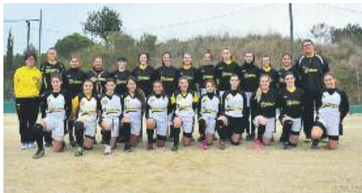
L'equip campió de Catalunya.

VILADECANS ▶ El Club Beisbol Viladecans femení va aconseguir el primer títol de la seva història. Dos anys després de la seva fundació, el conjunt viladecanenc va aconseguir endur-se el campionat de Catalunya de softball de Divisió d'Honor, després d'aconseguir dues victòries davant el Projecte Softball Gavanenc i contra el CBS Sant Boi aquest cap de setmana.