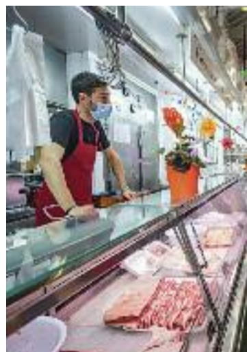
Un paradista.

continua actiu. A més, també recorda el cas que van denunciar el mes passat a la Fiscalia Anticorrupció per altres contractacions que consideren irregulars. Per això, el partit prefereix que la justícia "determini i avalui les presumptes irregularitats" que diu que han detectat.