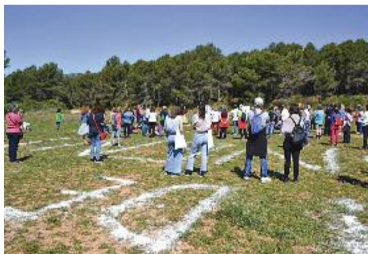
La defensa de l'entorn natural creix.