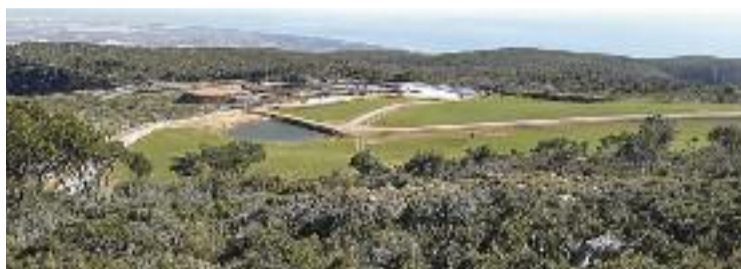
Els gasos de l'abocador podrien ser l'origen dels terratrèmols.

Per això totes les mirades apunten a l'abocador. Les entitats creuen que els terratrèmols els han provocat els gasos que generen les escombraries acumulades en descomposició. De fet, el mateix dia 11 van fer un acte per denunciar l'increment de gasos que havien detectat als avencs del massís del Garraf. Denuncien que la contamina-