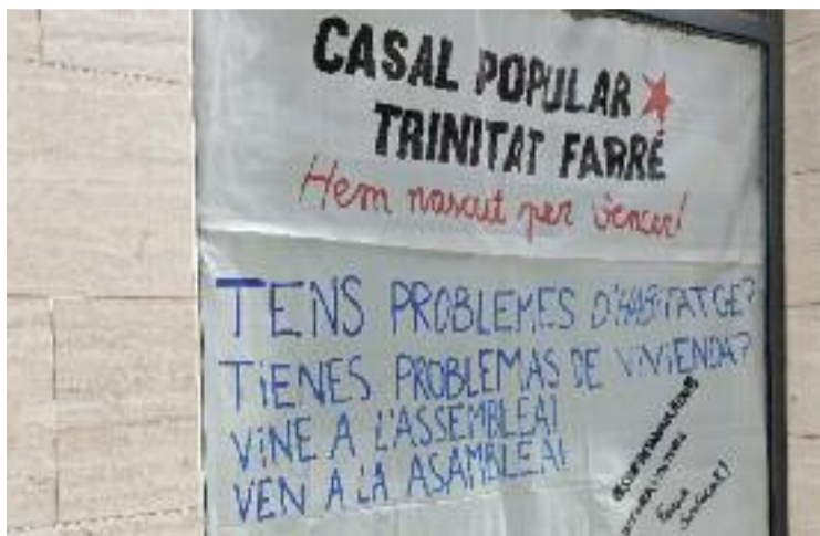
L'espai acollirà activitats per a tots els veïns.

Feia temps que el Grup d'Habitatge necessitava un local on fer les reunions i altres actes. Amb aquest nou espai, volen denunciar la manca de locals municipals per a les entitats. Per això, un dels primers objectius és obrir el nou casal popular a entitats i col·lectius. La idea és oferir cursos de llengua de franc, espais per a assem-