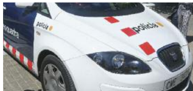
Els Mossos van rebre l'avís de la Policia Local de Màlaga.

SUCCESSOS ▶ Una gimcana a través de Tik Tok per trobar droga. Els Mossos d'Esquadra van detenir a principis de maig dos homes al barri de Sant Cosme que es dedicaven a amagar marihuana als parcs i a penjar-ho a les seves xarxes socials perquè els seguidors trobessin les dosis. L'objectiu dels homes, que després de passar a disposició judicial van quedar en llibertat amb càrrecs, era trobar nous clients que, després de la dosi de franc, els comencessin a comprar a ells la droga.