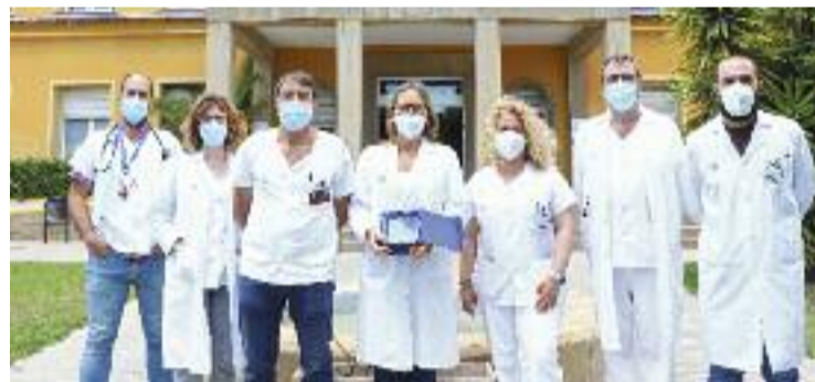
L'equip que ha rebut el reconeixement.

SALUT ▶ La gestió de la sang i el programa de transfusió de l'Hospital de Viladecans ha estat premiat com el millor de l'Estat. Ho van certificar els VII Premis MAPBM, que van destacar que el centre, juntament amb l'Hospital Parc de Salut Mar, ha estat el que ha tingut un major increment anual de l'índex MAPBM (Maturity Assessment in Patient Blood Management).