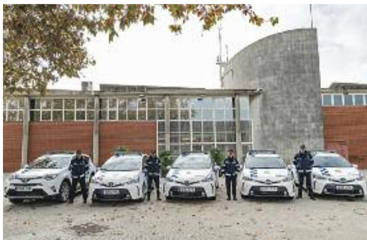
El cas ha analitzat la contractació de quatre agents interins.

Tot va començar l'octubre passat, quan l'agrupació local de Ciutadans va presentar una denúncia als jutjats de la ciutat perquè considerava que no s'havia seguit correctament el procediment a l'hora de contractar quatre agents de la Policia Local. Els taronges van denunciar que quatre persones havien estat contractades com a interines per formar part del cos de segu-