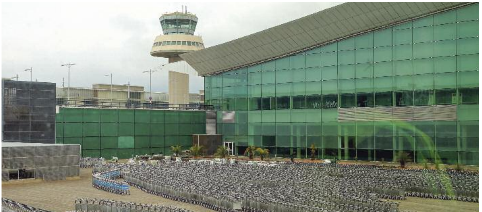
La pandèmia ha deixat el trànsit aeri sota mínims, però AENA i les patronals mantenen la pressió per ampliar l'Aeroport del Prat.