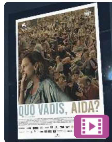
Quo Vadis, Aida? Jasmila Zbanic

Bòsnia, juliol de 1995. L'Aida treballa com a traductora per a l'ONU a una petita ciutat, Srebrenica. Quan l'exèrcit serbi l'ocupa, la seva família es troba entre els milers de persones que busquen refugi als camps de l'ONU. I, en aquest sentit, l'Aida té accés a informació important. Aquest film va estar nominat a millor pel·lícula internacional als Oscars del 2020.