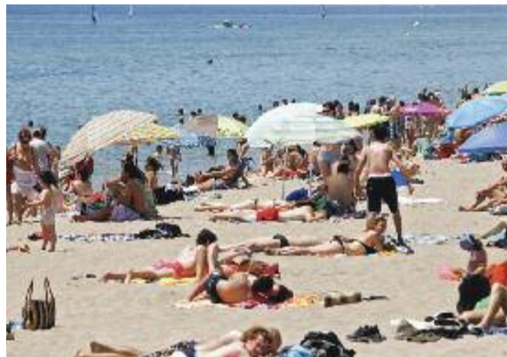
La bandera blava onejarà a Gavà Mar per quart estiu consecutiu.

El guardó l'entrega la Fundació d'Educació Ambiental en col·laboració amb l'Associació d'Educació Ambiental i del Consumidor i, entre altres aspectes, també valoren la qualitat de l'aigua. Per això, aquest estiu hi ha una platja menys amb la bandera blava a la comarca, perquè Castelldefels només ha presentat la del Baixador i Lluinetes.