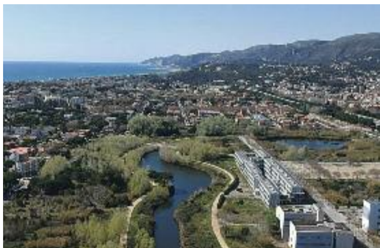
Els terrenys estan a l'altre costat de l'autopista.

Els defensors d'aquest espai natural consideren que la voluntat de l'Ajuntament de protegir l'Olla del Rei no és "tan genuïna" si s'acaba subordinant al desenvolupament dels terrenys de l'altre costat de l'autopista. A més, asseguren que així s'endarrerix la protecció definitiva d'a-