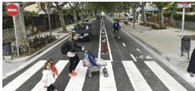
Només dos trams de la ciutat tindran un límit de 40 km/h.

MOBILITAT ▶ La ciutat s'ha convertit en zona 30. Després del canvi impulsat per la Direcció General de Trànsit, el límit de velocitat a tots els carrers de la ciutat passa a ser de 30 quilòmetres per hora. Només hi ha dues excepcions. Una és el tram de l'avinguda del Canal Olímpic que va de la plaça Barona al carrer d'Aragó. Allà la limitació de 30 km/h s'alternarà amb la limitació a 40 km/h. També es podrà anar a aquesta velocitat per l'avinguda Constitució, entre les Botigues de Sitges i Ca n'Aime-