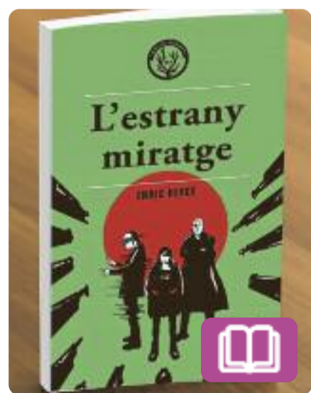
L'estrany miratge Enric Herce

Una recompensa anònima ofereix una quantitat obscena de diners a canvi dels assassins de l'hereu de la megacorp Holloway-Ikeda. La Duna i la Lorelei, autores del crim, podrien sospitar que qui ha posat preu als seus caps són els pares del difunt, si no fos perquè ells mateixos les van contractar per eliminar-lo. Una història d'intriga en un món ara real i virtual.