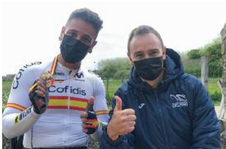
El de Viladecans, amb una de les seves medalles.

Per segona vegada en els darrers tres anys (Garrote ja va ser un dels grans protagonistes en la cita del 2019, a Baie-Comeau, al Canadà), el viladecanenc va tornar a demostrar que és un dels especialistes del moment i amb