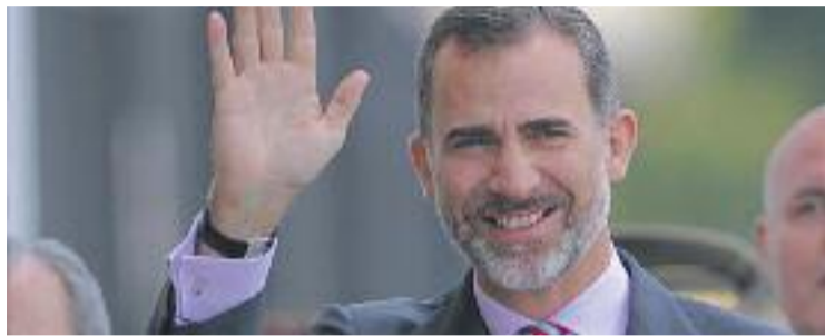
El retrat de Felip VI seguirà absent al Saló de Plens santjustenc.