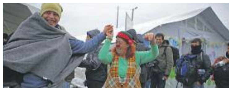
Instantània sobre la feina de Pallassos sense Fronteres.

SOLIDARITAT ▶ Durant aquest març i a l'abril el municipi acollirà les Jornades Utopies concertes per un món millor, que organitza el departament de Cooperació de l'Ajuntament. Aquestes jornades serviran per reflexionar sobre la capacitat de la cultura i de l'esport per ser eines de cooperació i solidaritat.