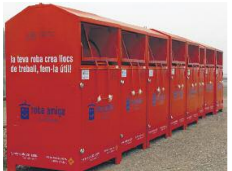
Els contenidors on els ciutadans poden dipositar la roba.

Solidança és una entitat sense ànim de lucre que treballa per la sostenibilitat i la inserció laboral de persones en risc d'exclusió social al municipi. L'Ajuntament recorda que es coordina amb l'entitat i que justament això "ha permès que una persona del municipi estigui treballant gràcies a la gestió del residu tèxtil recollit".