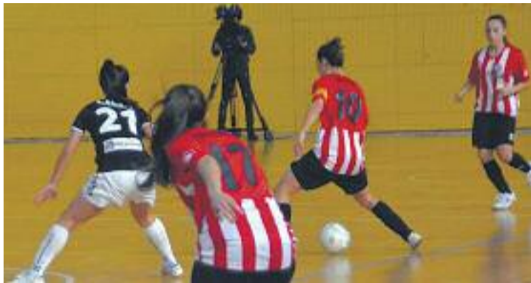
La temporada de l'equip està sent notable.

Aquest resultat, però, no fa que les blanc-i-vermelles perdin cap posició a la taula i segueixen còmodament instal·lades en la vuitena plaça. Aquesta és la segona derrota que les espluguines pateixen a casa en tota la temporada (l'altra també va ser contra un equip gallec, l'Ourense) que afronten ara els últims 10 partits de la lliga. El viatge a Guadalcín i el matx a casa contra l'Alcorcón