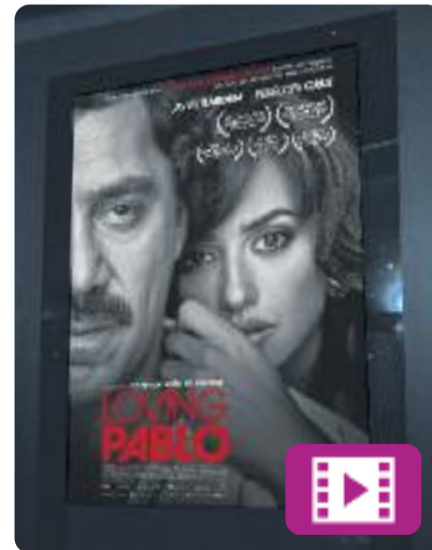
Loving Pablo Fernando León de Aranoa

Penélope Cruz i Javier Bardem són Virginia Vallejo i Pablo Escobar en la darrera representació a les pantalles de la vida del narcotraficant colombià.