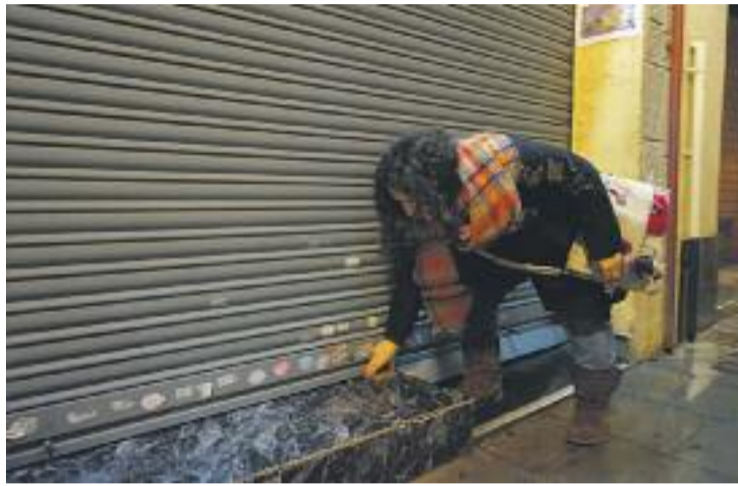
El comerç espluguès es va bolcar amb la reforma horària.

Per barris, el seguiment de la prova pilot va ser desigual. Destaca per sobre de tot el de Can Vidalet, on 46 comerços van tancar a les set de la tarda; el segueix el Centre, amb 36, la Plana amb 15, el Gall amb 6, Can Clota amb 4 i Montesa, la Ma-