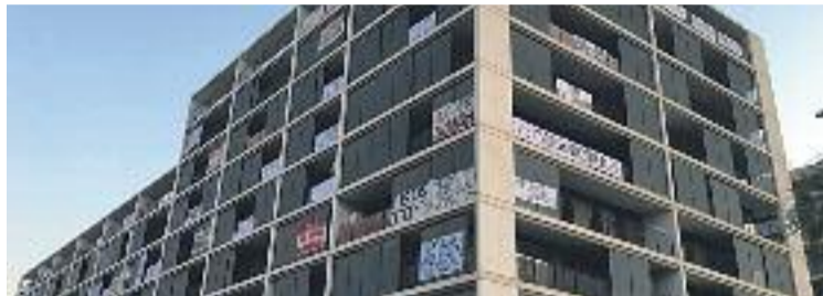
L'edifici dels afectats s'ha omplert de pancartes.