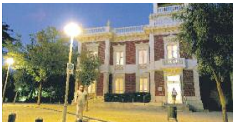
Equipaments municipals i comerços podran tancar abans.

Una iniciativa que ha estat ben rebuda per les administracions i que s'intentarà fer efectiva a Esplugues durant una setmana, en concret del 26 de febrer al 2 de març. Es tracta de la Setmana dels Horaris, una prova pilot per veure com seria la vida quotidiana si féssim aquesta transformació de l'organització del temps. La voluntat és que durant aquests cinc dies la jornada