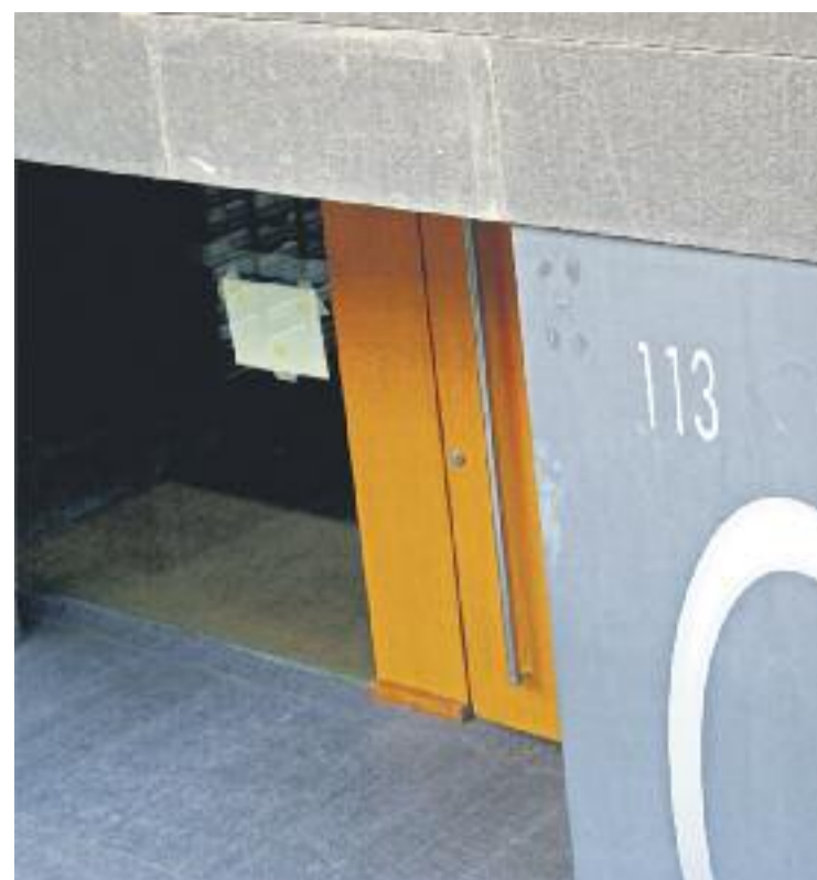
Els veïns es van reunir en assemblea el passat 31 de gener.