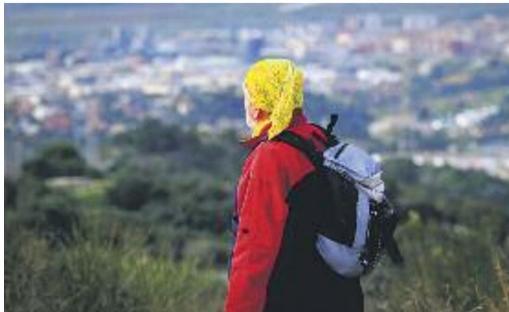
Un dels participants de l'edició de l'any passat.

El repte fa que els participants (en grups que van des de les 5 fins a les 20 persones) es posin el repte de caminar una distància que oscil·la entre els 10 i els 40 quilòmetres per recaptar diners que es destinen als projectes solidaris que han triat anteriorment. Els més atrevits començaran la prova des de Can Cuiàs, a Barcelona, a les set del matí,