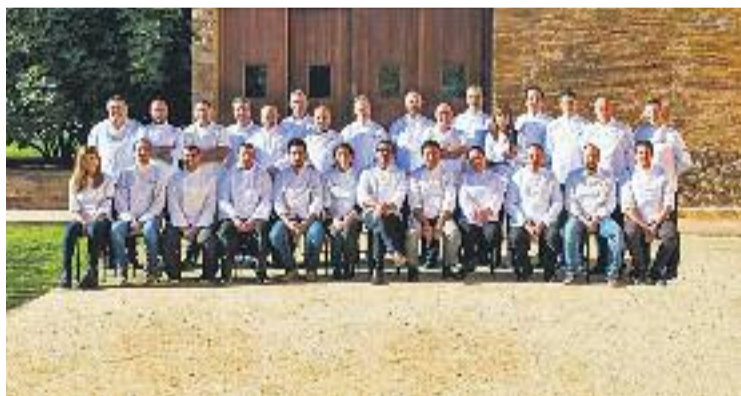
Cinc restaurants s'han unit enguany a la iniciativa.

Als restaurants de la temporada anterior s'incorporen cinc restaurants més de Sant Feliu de Llobregat, Sant Vicenç dels Horts, Molins de Rei, Pallejà, Martorell i Viladecans, comptant ja un total de 51 establiments que ofereixen durant tot l'any a les seves cartes diverses propostes culinàries amb els productes que es cultiven a l'horta del Baix Llobregat, uns productes que gaudeixen del distintiu "Producte FRESC del Parc Agrari" que certifica la frescor, la proximitat, la temporalitat i el saber fer de la pagesia del Baix Llobregat. Com a