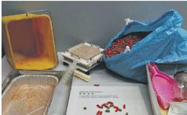
Una imatge del material intervingut per la policia.

Els tres detinguts, que també han estat denunciats per frau al consumidor, van passar a disposició judicial el 27 de gener i el