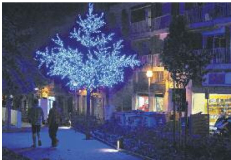
Els llums de Nadal ja il·luminen la comarca.

Per tal d'assolir aquests objectius, els ajuntaments i associacions de botiguers han posat en marxa un programa farcit d'activitats per animar les compres i dinamitzar el carrer. En el cas d'Esplugues, la campanya va arrencar de manera oficial divendres dia 1 amb l'acte públic d'encesa de llums a la plaça Santa Magdalena, on s'hi van cantar nadales i hi va haver una xocolatada infantil. Aquest any, l'ajuntament espluguès ha assumit el cost íntegre de l'enllumenat, tant l'adquisició dels ornaments com el muntatge i el desmuntatge –amb un cost del voltant dels 83.000 euros–. S'han garantit un total de 56 carrers.