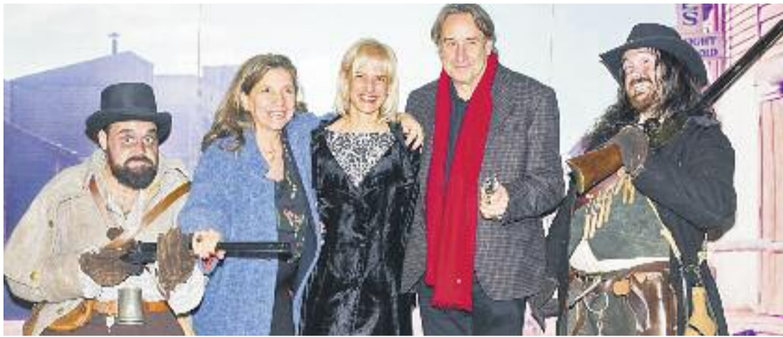
A l'acte es va recordar el passat 'western' de la ciutat.

MEMÒRIA ▶ Fins el 1972, l'àmbit del parc de les Esplugues va ser territori western . Bandits, vaquers, dames i cerca recompenses van passejar per aquesta zona implantant la seva llei. Es tractava de pel·lícules i el que ara és un parc fa 40 anys eren uns estudis de cinema.