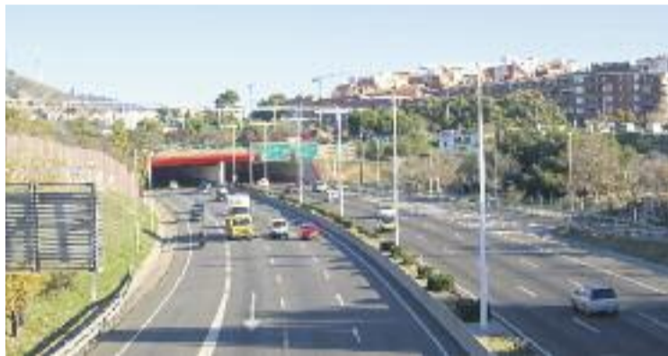
Esplugues és un dels municipis afectats per la mesura.

La sanció per ser enxampat circulant amb un turisme sense