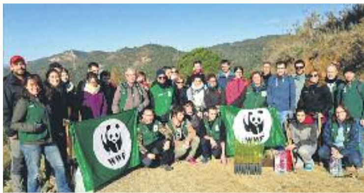
Els voluntaris abans de portar a terme la replantació a Collserola.

Des del WWF, organitzador d'un esdeveniment que enguany ha arribat a la seva setena edició, destaquen la tasca