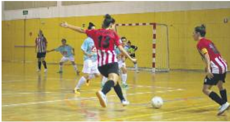
L'equip encara la recta final d'un bon any.

En aquest primer tram de competició, l'equip presenta un balanç de tres victòries, tres empats i cinc derrotes (aquestes, amb un denominador comú, que han estat fora de casa). D'aquesta manera, el repte principal de