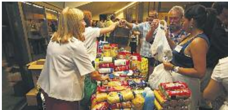
La Taula coordina les accions solidàries a la ciutat.

Des del 2011, la Taula ha coordinat un centenar d'accions com ara campanyes de solidari-