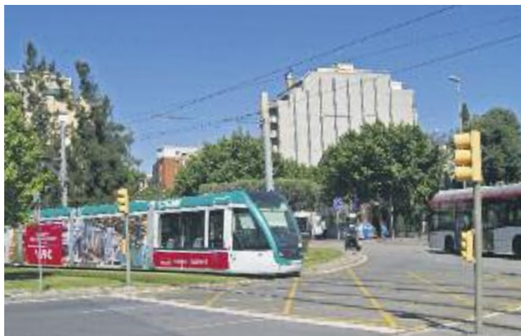
El Trambaix unirà Esplugues i Sant Just més directament.

L'Autoritat del Transport Metropolità ha licitat l'estudi informatiu per tal de realitzar el projecte. Això vol dir que aviat es començarà a redactar tot el procediment, així com a realitzar estudis de mobilitat i d'impacte de les obres. Cal recordar que la idea és que el tramvia, quan ve de L'Hospitalet, en comptes de desviar-se un cop passa pel Pont d'Esplugues, continuï recte pel carrer Laureà Miró, s'incorpori a la carretera Reial i s'uneixi a la parada del T3 de la Rambla de Sant Just. D'aquesta manera, els veïns d'Esplugues tindran