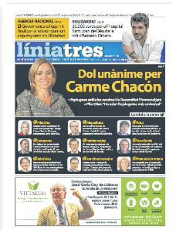
Número 45 · Abril del 2017