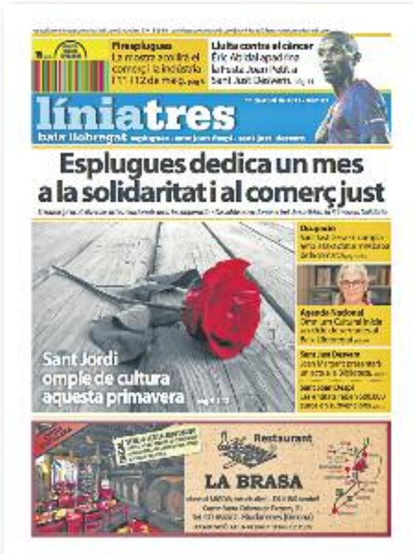
Número 1 · Abril del 2013