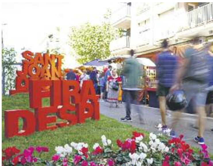
Centenars de veïns van gaudir del Firadespí.

Pel que fa a les parades, hi van participar prop d'una vuitantena entre estands comercials de botigues de la ciutat i artesans, a més dels participants de la Fira de Vins, Caves i Cerveses Artesanes. En aquest espai, el Mercat de les Planes va oferir les millors tapes santjoanques i una beguda per un preu final de 2,50 euros.