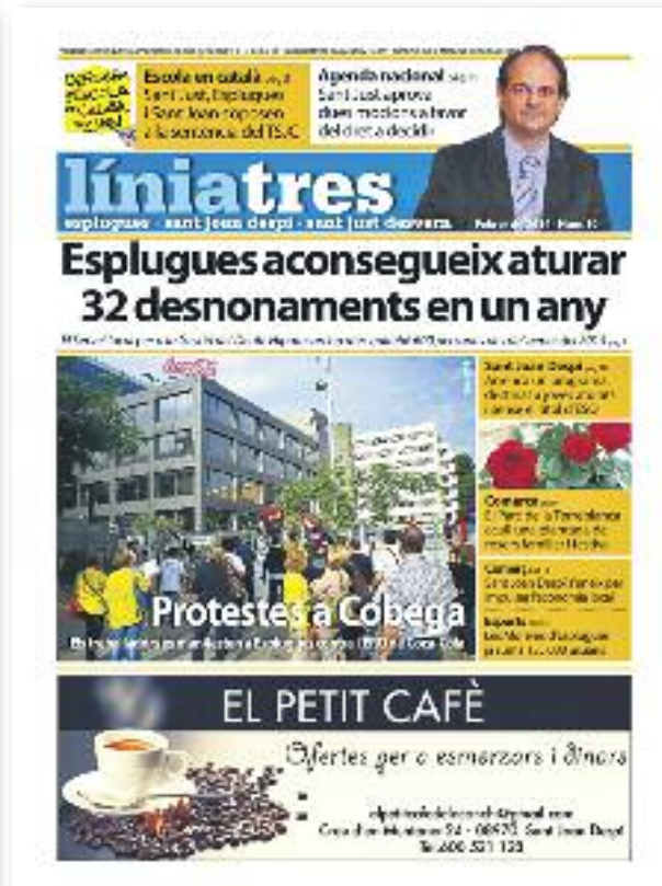
Número 10 · Febrer del 2014