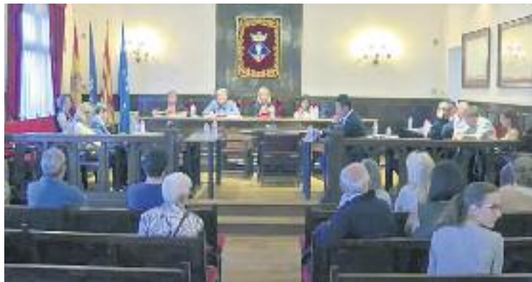
La ruptura de la sociovergència és ja una realitat.

Ara mateix, l'arc plenari el formen nou regidors socialistes, dos del PDeCAT, dos d'ERC,