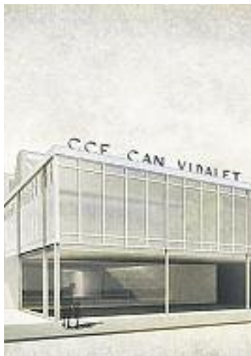
Futur complex.

EQUIPAMENTS ▶ Les obres del futur complex sociocultural i esportiu del barri de Can Vidalet es van posar en marxa a principis de mes. Les màquines van fer caure dues edificacions situades entre el Centre de Formació d'Adults Eugeni d'Ors, el parc de Can Vidalet i el carrer Cedres, per tal de possibilitar la construcció de l'equipament.