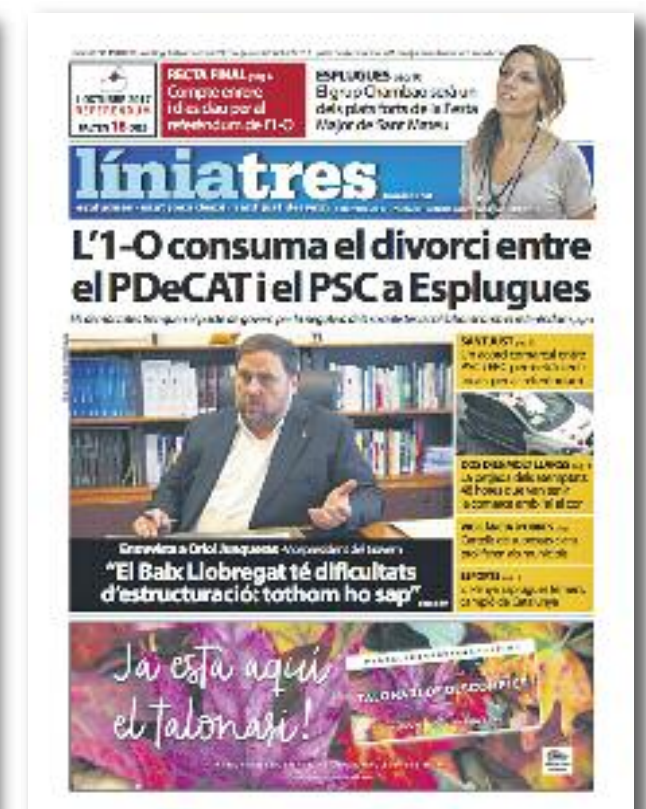
Número 49 · Setembre del 2017