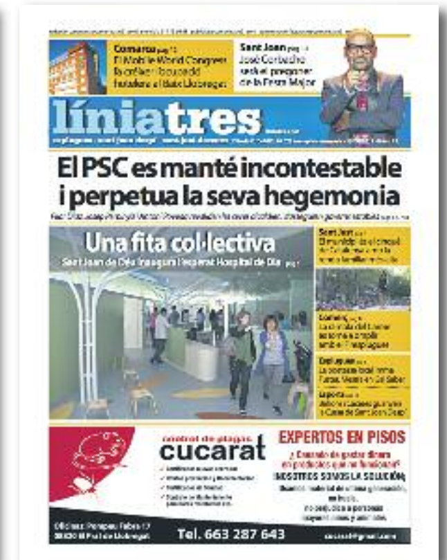
Número 25 · Juny del 2015