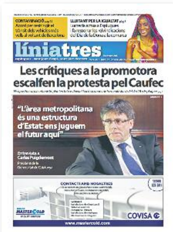
Número 44 · Març del 2017