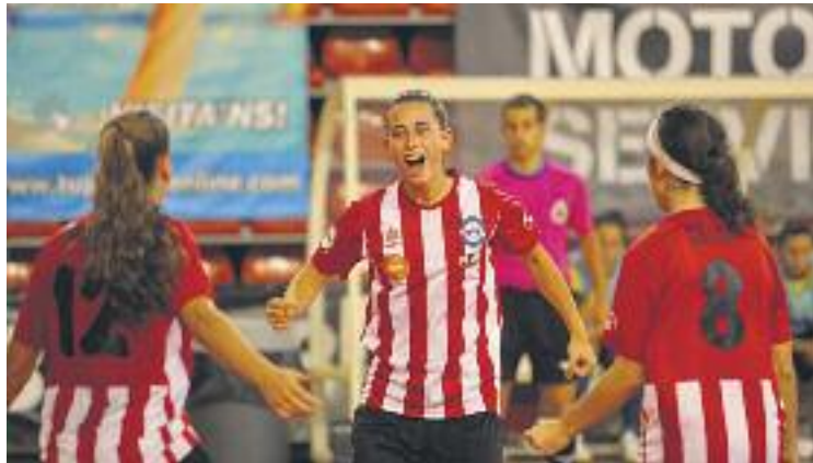
L'equip ha superat aquest tram de lliga amb bona nota.

El calendari més immediat per al conjunt d'Esplugues im-