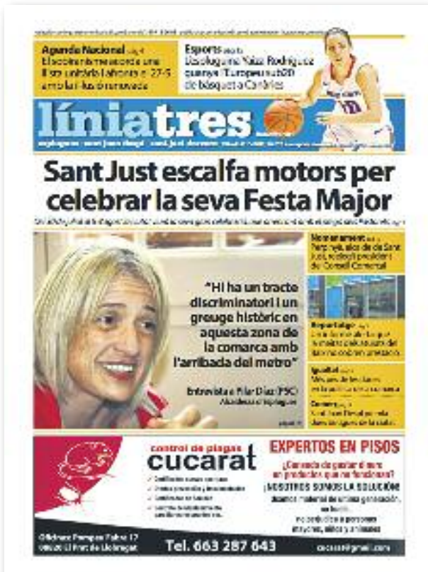
Número 26 · Juliol del 2015