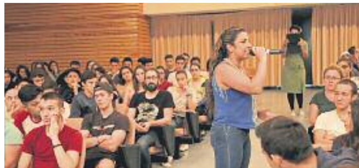
Avella parlant amb els joves.

DRETS ▶ En el marc del projecte Ciutats Defensores dels Drets Humans, en el qual han participat Esplugues i Sant Joan Despí, diverses activistes pels drets de les persones han fet xerrades sobre la seva experiència a diversos centres municipals.