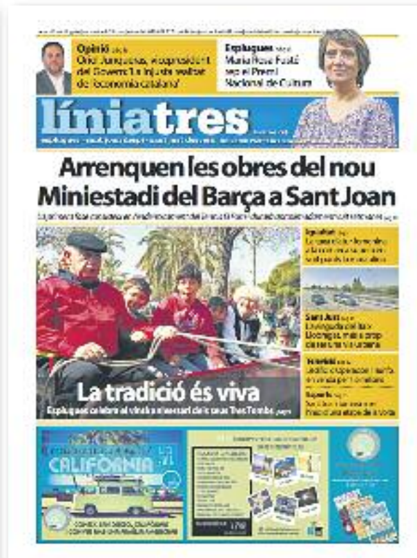
Número 33 · Març del 2016