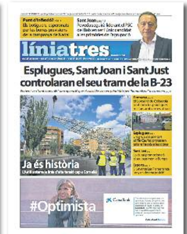
Número 41 · Desembre del 2016