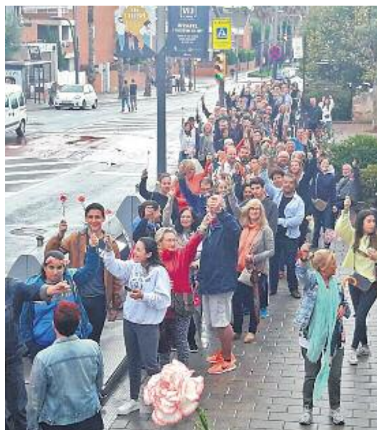
L'INS Severo Ochoa d'Esplugues (esquerra) va ser un dels punts més concorreguts de votació. A la dreta, un moment de l'1-O a Sant Joan.