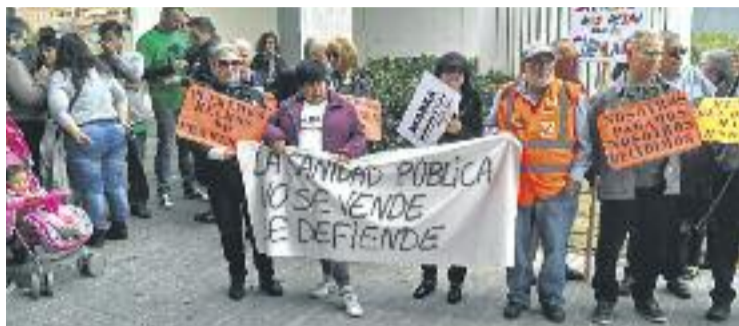
El Broggi és el centre de les reivindicacions al Baix.

Segons el Consell Comarcal, aquesta situació ha impactat negativament en els centres d'atenció primària, el centres d'urgència d'atenció primària i especialment en els centres hospitalaris i de les seves urgències, "afectant directament la qualitat d'atenció que reben els i les ciutadanes de la comarca, malgrat el treball i l'esforç de les treballadores i treballadors sanitaris". Així, l'ens comarcal de-