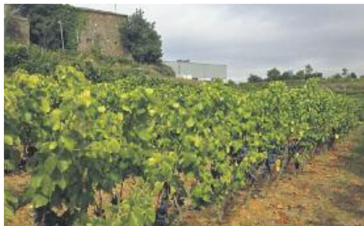
Vinya de Can Palopa, una finca de Collserola.

Per exemple, els passats dies 7, 9 i 11 de juny, Can Ginestar, a Sant Just, va acollir algunes activitats del programa, les quals van servir per rememorar el passat local de vinyes, premses i vi. Durant aquells dies, els veïns i veïnes del municipi van poder explicar els seus records i experiències.