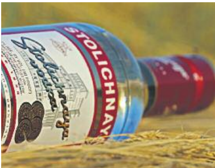
Alguns dels efectes del 'botellón': brutícia als carrers l'endemà.

La mesura, que va estar oberta a aportacions ciutadanes fins al 6 de juny, "vol evitar els problemes de convivència ciutadana i d'ordre públic relacionats amb el consum d'alcohol a les nits", explica l'Ajuntament en un comunicat. D'aquesta manera, la