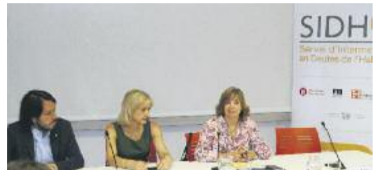
L'alcaldesa presentant les dades amb la consellera Borràs.

HABITATGE ▶ El Servei d'Intermediació sobre Deutes en Habitatge (SIDH) d'Esplugues ha tramitat 32 expedients des de la seva obertura l'any passat. Aquestes són les dades que van presentar el passat 7 de juny l'alcaldesa, Pilar Díaz, i la consellera de Governació, Administracions Públiques i Habitatge, Meritxell Borràs.