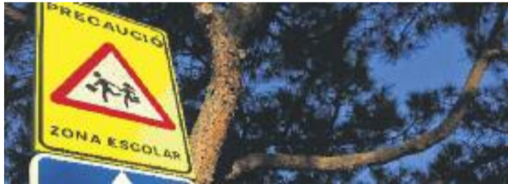
Els senyals, de moment, seguiran en català.

D'aquesta manera, la decisió queda en stand by a l'espera d'un informe jurídic de la secretaria municipal que inclogui "l'abast i els límits legals de l'acord segon de la moció" aprovada fa tres mesos, el qual establia que "el text explicatiu d'alguns senyals de trànsit haurà de figurar bilingüe", destaquen des del consistori en un comunicat.