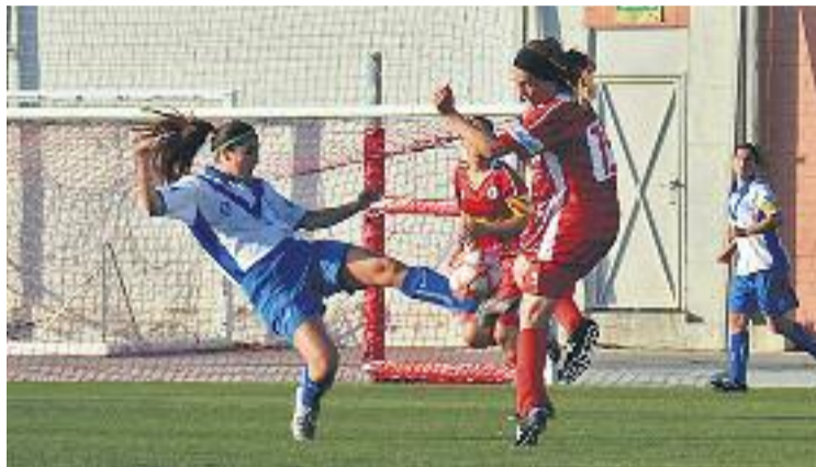
Un moment del partit contra les barcelonines.

calment a la segona meitat, quan el Levante va tancar les escapulades a la seva àrea. L'equip va aconseguir enganxar l'afició al partit, però cap de les rematades de les davanteres planques es va convertir en gol i les d'Álvaro del Blanco encara van tenir l'oportunitat d'ampliar el seu avantatge en la darrera jugada del partit, però el pal del municipal de