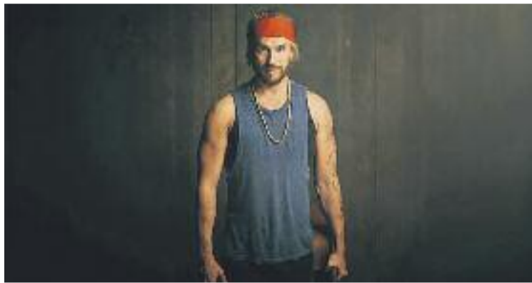
El músic finalitza la gira del seu darrer disc.

El músic colomenc està acabant la gira on interpreta el seu darrer treball, Historias Tattodadas , i portarà el seu so barrejat de reggae, rumba i altres sons llatins carregats de magnetisme a Sant Joan. Per altra banda, l'inici de les festes també tindrà protagonisme musical. La cantant Gisela, famosa per la seva participació a Operación Triunfo i muscar cançons Disney, farà el pregó de les festes. Darrerament Gisela també ha participat en el reality de TV3 Oh Happy Day.