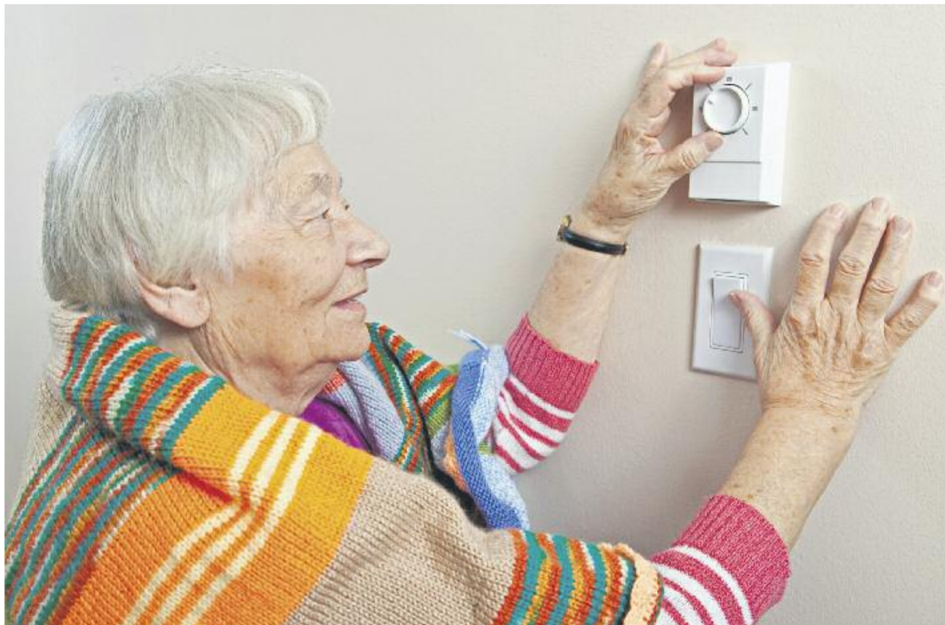
Les persones beneficiàries del pla reben, entre altres, consells pràctics sobre consum eficient al domicili.

» La Diputació de Barcelona allarga fins al 2018 el seu pla per fer front a la vulnerabilitat » Un total de 4.000 llars es beneficiaran del programa, que es va estrenar a finals del 2016