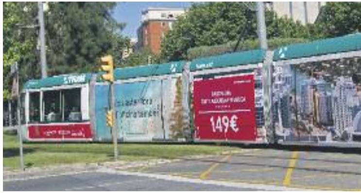
La connexió amb el Pont d'Esplugues serà el doble de ràpida.

Des de l'arribada del Trambaix a la ciutat, ara fa més de 10 anys, ja de seguida es va reivindicar una connexió més directa i amb un estalvi de temps considerable per als santjustencs. I és que des de la plaça Santa Magdalena d'Esplugues el tramvia baixa en direcció Cornellà i no arriba a Sant Just d'una manera directa i ràpida. D'aquesta manera, es millora calarament la