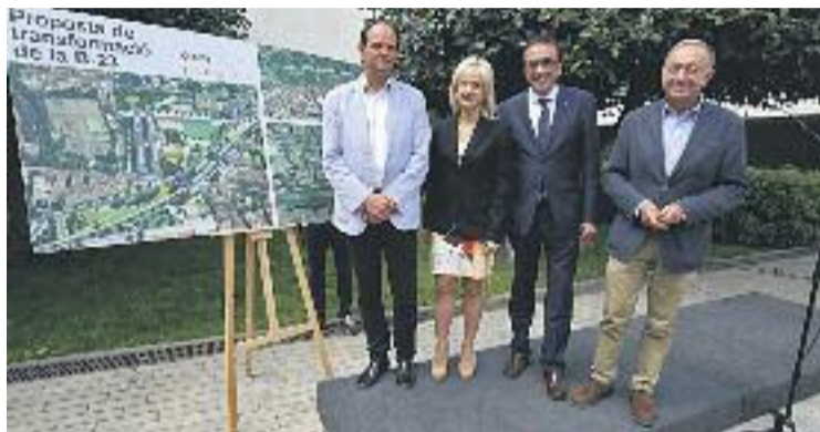
Fotografia d'unitat entre alcaldes i Generalitat.

URBANISME ▶ Els ajuntaments de Sant Joan Despí, Esplugues i Sant Just Desvern, conjuntament amb l'Àrea Metropolitana de Barcelona (AMB) i la Generalitat, han acordat crear una taula de treball per començar a impulsar la transformació de l'autovia B-23 en una via urbana. Paral·lelament, les administracions han acordat demanar a l'Estat el traspàs de la titularitat d'aquesta via, amb els recursos necessaris per al seu manteniment i per començar a executar projectes pendents, com la creació del carril BUS VAO, per al transport públic i vehicles d'alta ocupació –valorat en 15 milions d'euros–, que aniria acompanyat d'altres iniciatives per promoure els desplaçaments sostenibles a l'entrada de Barcelona –aparcaments connectats amb el transport públic, park and ride , o carrils per a bicicletes–. Els ajuntaments han ex-