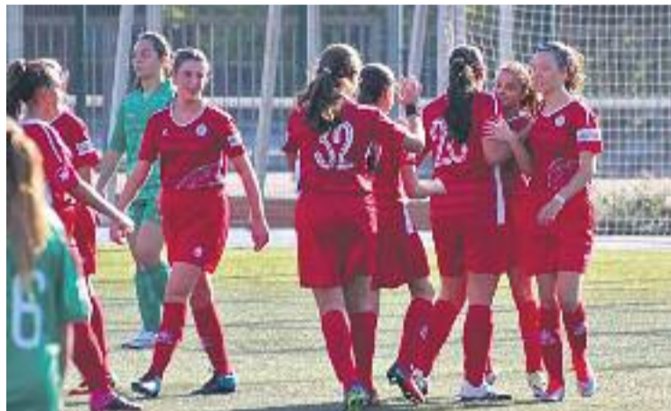
L'equip seguirà a la categoria de plata del futbol estatal.

En una temporada complicada, amb canvis a la plantilla i a la directiva, l'equip ha pogut