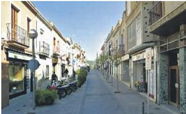
L'accés al carrer Bonavista estarà controlat per càmeres.

Així, el consistori s'ha reunit amb els veïns per tal d'explicar-los el nou projecte de peatonalització dels carrers del centre: es reformarà el paviment i es restringirà l'accés dels vehicles que no siguin ni veïns ni comerciants de la zona. I el mètode escollit per a fer-ho és el de càmeres de control de matrícules, un sistema que s'usa a altres muni-