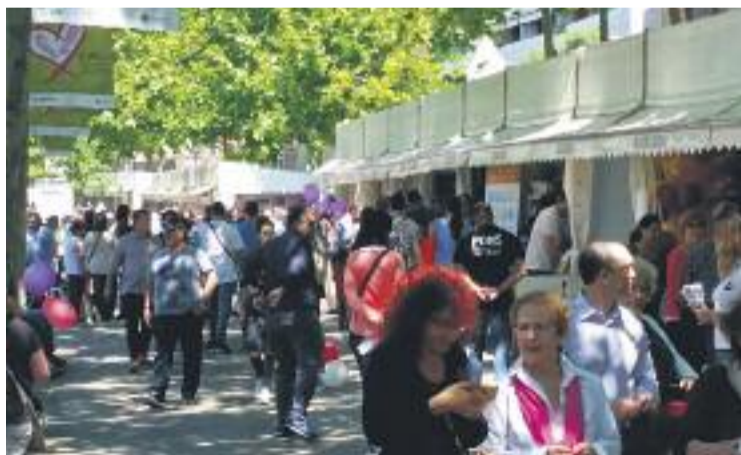
El Firesplugues va tornar a aplegar un bon nombre de visitants.

A més, també va ser present al Firesplugues el Puput Punxetes, la mascota turística del