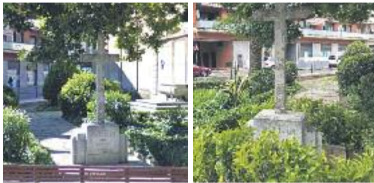
La creu fa un any (esquerra) i avui dia (dreta).