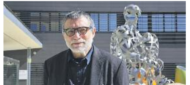
L'artista amb la seva obra al fons.

ART ▶ Amb motiu del 150è aniversari de l'Hospital de Sant Joan de Déu, l'artista plàstic, escultor i gravador barceloní Jaume Plensa ha cedit una obra al centre, que ha quedat exposada a la seva entrada.