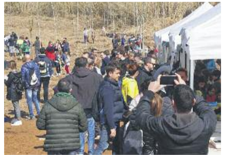
Infants i adults han participat en aquesta replantada.

tamarius, entre d'altres. El Bosc dels Infants és un projecte que va néixer l'any 2007 de la mà del Consell dels Infants de Sant Joan Despí, que va organitzar una primera plantada popular en la qual es van plantar més de 300 arbres i arbustos, amb l'objectiu de recuperar la biodiversitat d'aquesta zona del riu Llobregat. Des de llavors, cada dos anys es convoquen els infants de la ciutat i les seves famílies per, entre tots, ampliar el bosc.