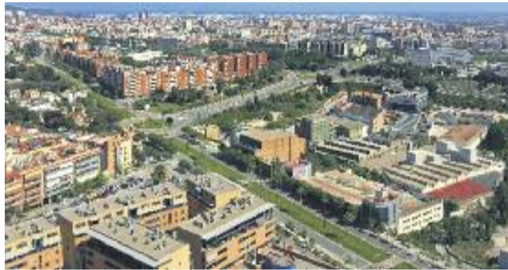
La cobertura mòbil millora a costa de la de televisió.

L'empresa Llega800 és l'entitat gestora d'aquests serveis, i l'Ajuntament ha explicat que enviarà al veïnat que resideixi en zones de major afectació una comunicació en el seu domicili informant que a partir d'aquest moment podran sol·licitar gratuïtament l'adaptació de l'ante-