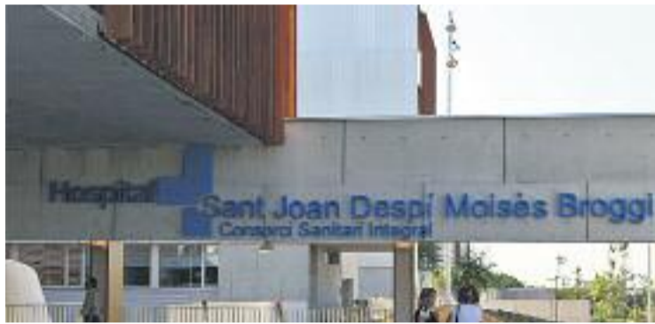
L'estat de les urgències torna a tensar el Broggi.

L'Ajuntament també ha explicat que l'alcalde ha tornat a sol·licitar a la conselleria de Salut de la Generalitat que "aporti els recursos adequats per afrontar les necessitats de funcionament de l'hospital, ja que en aquests anys han patit retallades", així com altres actuacions de caràcter estructural, com una redistribució dels habitants de la zona d'influència de l'hospital cap a altres centres "vist que la sobresaturació d'urgències és un