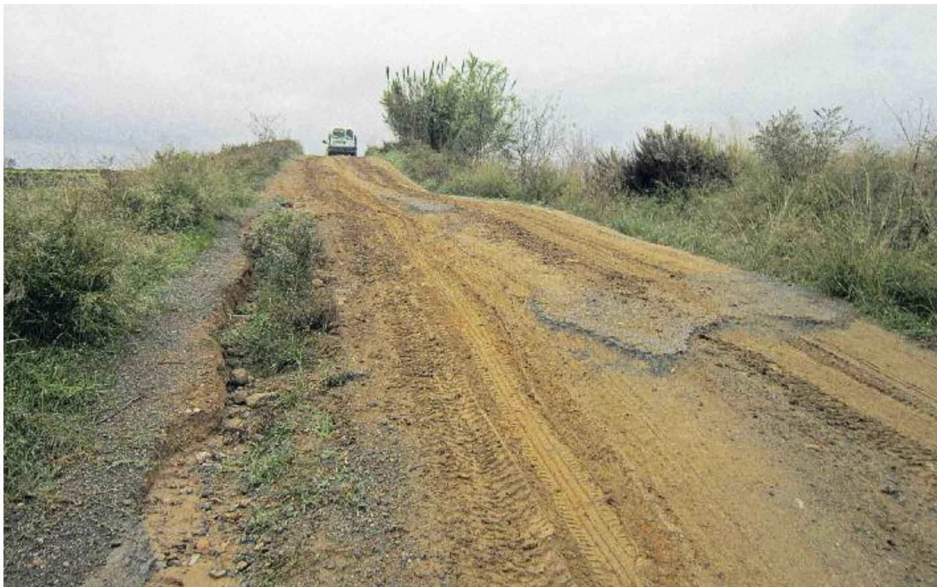
La Diputació treballa perquè tots els camins de la demarcació estiguin en òptim estat.

MOBILITAT ▶ La Diputació de Barcelona ha endegat un programa complementari de millora i manteniment de camins que estarà en marxa durant els pròxims tres anys. El principal objectiu d'aquesta iniciativa és donar suport a les necessitats dels diferents municipis de la demarcació en el manteniment d'aquestes vies veïnals. Des de la Diputació informen que les primeres actuacions d'aquest programa s'iniciaran els pròxims mesos, les quals aniran a càrrec dels mateixos municipis.