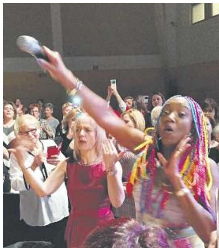
Sopar de Dones a Sant Joan Despí (esquerra) i un moment de l'actuació de Lucrecia a Esplugues (dreta).