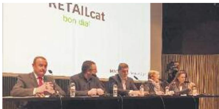
Presentació de la nova entitat de comerciants.