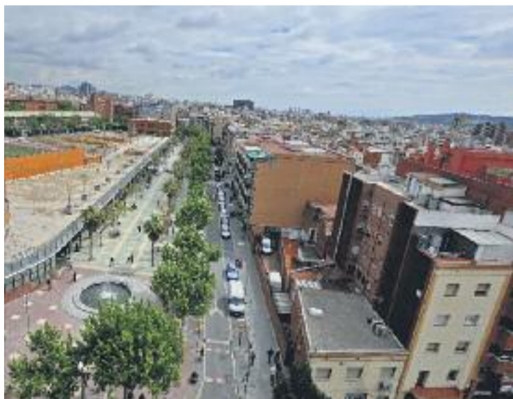
Can Vidalet tindrà nou mercat.

Per altra banda, també es va iniciar el procediment de contractació corresponent. Les condicions van ser aprovades amb els vots de totes les formacions