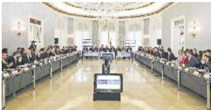
La cimera d'administracions va pactar mesures mediambientals.

Per això, s'ha acordat la restricció de circulació en els voltants de la capital catalana per als vehicles més contaminants. Concretament, a partir del pròxim 1 de desembre, en situacions d'episodi ambiental declarat per la Generalitat, no podran circular en aquest àmbit les furgonetes matriculades abans de l'1 d'octubre del 1994 i els turismes matriculats abans de l'1 de gener