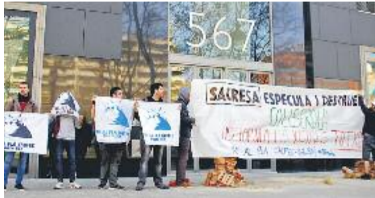
Els manifestants també van informar els vianants.

Aquesta actuació es produeix una setmana abans de la manifestació convocada per la plataforma, que tindrà lloc el pròxim dissabte 18 de març davant de l'Ajuntament a partir de les cinc