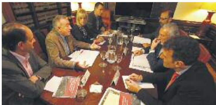
Imatge de la reunió on Foment va prendre el compromís històric.