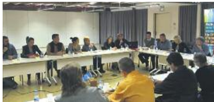
Reunió de constitució del consell.

ECONOMIA ▶ El Consell Econòmic Social d'Esplugues va quedar constituït el passat 30 de novembre, tal com preveia el 'Pacte per a la reactivació econòmica i la creació d'ocupació de qualitat a Esplugues 2016-2019', aprovat fa uns mesos.