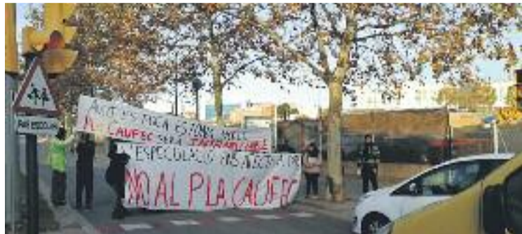
El grup de veïns durant la seva protesta.

Però el que realment va voler posar de manifest la protesta van ser les possibles dificultats viàries que podria causar el nou centre i barri projectats. "Col·lap-