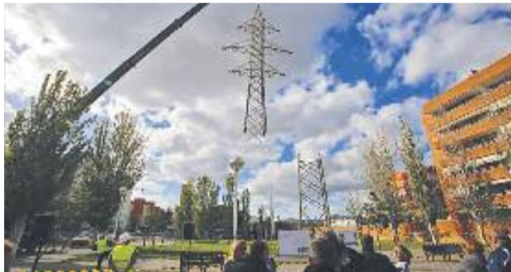
Desmuntatge d'una de les torres d'alta tensió al barri.

Aquesta línia uneix les subestacions elèctriques de Cornellà i Sant Joan Despí i data dels anys 50, és propietat d'Endesa i està constituïda per dos circuits d'alta tensió de 110kV.