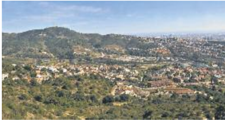
Sant Just tindrà l'oportunitat de promocionar-se.

Segons explica la Fundació Kreanta, les accions desenvolupades a cada ciutat tindran com a objectiu reforçar el seu atractiu turístic gràcies a la revalorització del patrimoni cultural i a l'oferta de nous productes turístics relacionats amb la creació contemporània. Es tracta, per tant, de recolzar-se en els recursos patrimonials i en el dinamisme creatiu dels territoris per reforçar la seva identitat i atraure visitants.