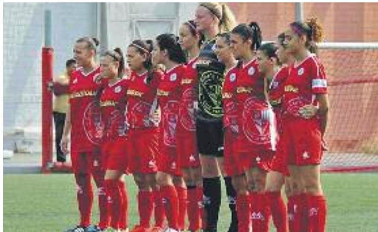
L'equip ha viscut molts canvis durant la recta final de l'any.

domicili, el diumenge 7, amb una visita a un dels seus rivals directes de la zona tranquil·la de la classificació, el CF Igualada.