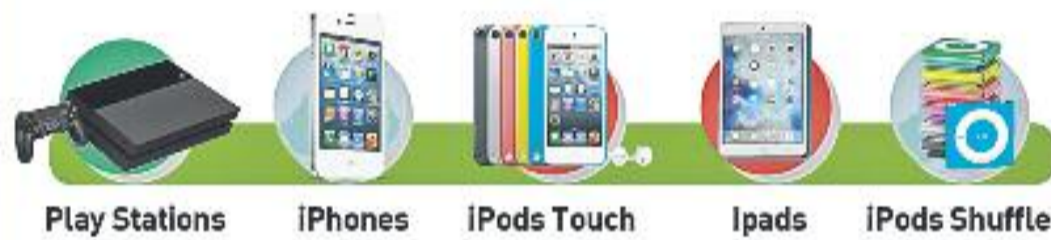
Play Stations iPhones iPods Touch Ipads iPods Shuffle