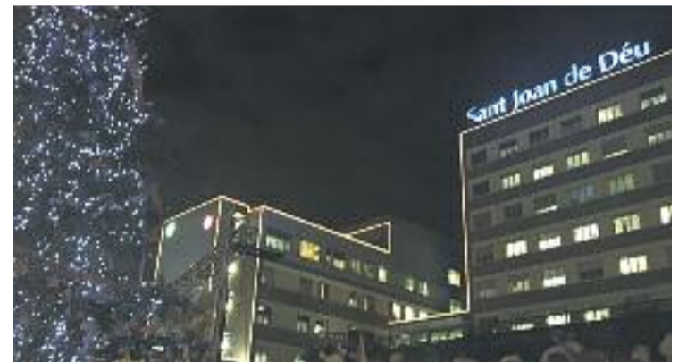
L'hospital celebra Nadal amb Pares Noel fent ràpel.

Per altra banda, l'hospital va donar la benvinguda a Nadal amb una festa a l'exterior de l'edifici del centre de salut el passat dia 14 de desembre. Es va dur a terme l'encesa oficial dels llums, hi va haver actuacions musicals i fins i tot el Pare Noel es va despenjar per la façana de l'hospital per felicitar les festes als infants ingressats.