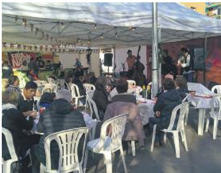
Nadales a la Fira de Nadal d'Esplugues.

La fira va comptar amb un escenari on es van celebrar el Sona Nadal, un petit festival amb actuacions musicals i un espai per poder cantar nadales. Al mateix escenari van actuar l'Associació Cultural Andalus d'Esplugues, els Bastoners, La Cuca