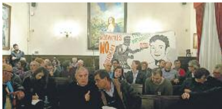
Mostres de suport a la família durant el Ple.

Dies més tard va ser detingut un policia nacional com a presumpte autor de l'assassinat. Finalment, i tot i que la parella del jove assassinat va identificar el detingut com l'autor dels trets, el cas no va arribar a judici i va ser arxivat per falta de proves. Des d'aleshores, la família lluita perquè es reobri.