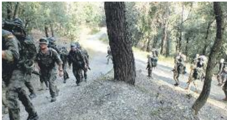
Els militars entrenant-se per camins del parc.

Com a resposta a aquestes resolucions de rebuig, Defensa va voler legitimar la seva activitat afirmant que és necessària per a la seguretat dels ciutadans.