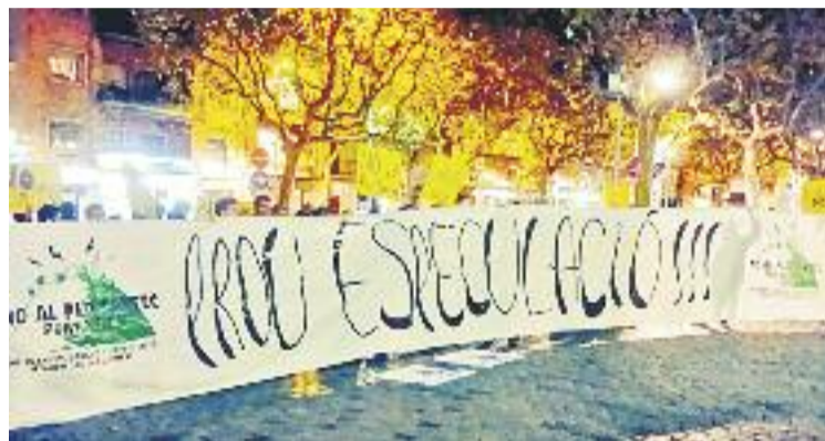
Manifestants a l'exterior de l'edifici consistorial.

La plataforma havia convocat una protesta davant del consistori durant la sessió plenària per demostrar que són "200 i més". Aquesta afirmació fa referència a les firmes necessàries per poder entrar una proposta ciutadana al Ple, segons estableix el Reglament Orgànic Municipal (ROM). De moment, la plataforma no ho ha aconseguit, tot i que denuncia la "desaparició" de "fulls sencers de signatures entrades a registre", un extrem que neguen des de l'Ajuntament.