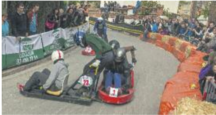
Les topades i virolles són un clàssic de la cursa.