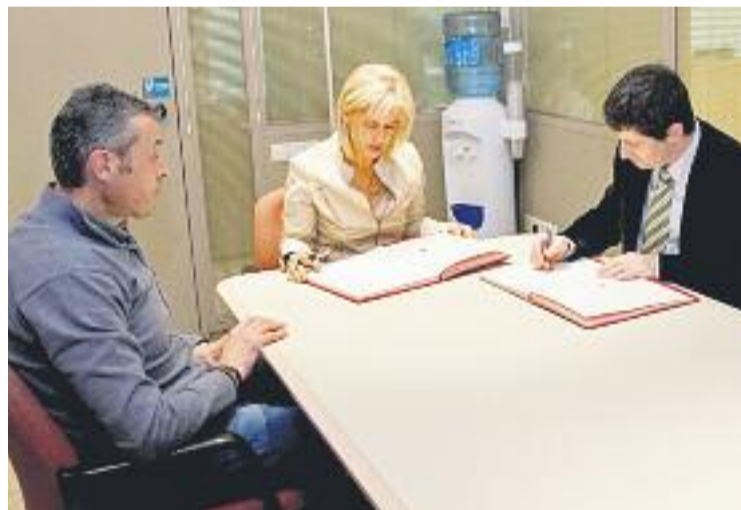
Moment de la signatura del conveni.

La quantitat econòmica que han rebut els comerciants servirà per cofinançar aspectes com ara activitats i campanyes organit-