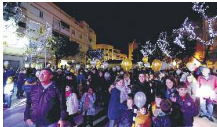
Sant Joan ja llueix els llums de Nadal.

Esplugues, per la seva banda, esperarà fins aquest divendres dia 2 de desembre per donar el tret de sortida a les activitats nadalenques al municipi. Al llarg del mes acollirà pessebres vivents, fires de Nadal i el Tió, sovint de la mà dels comerciants.