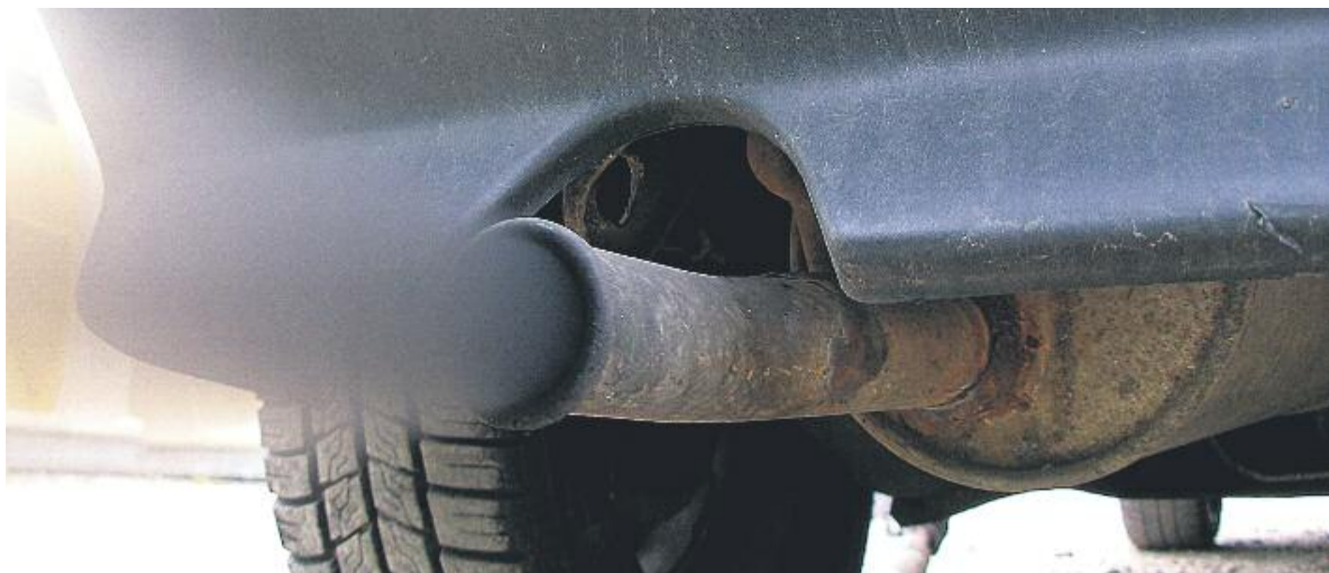
Els gasos que emeten els cotxes són el principal origen de l'ozó troposfèric, que té greus conseqüències per a la salut.