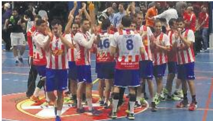
Els santjoanencs agraeixen el suport de l'afició.

El pròxim repte per als blancs-vermells serà a domicili, una vi-