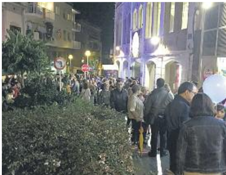
Els ciutadans van participar activament en la Nit de Sant Just.

La jornada va estar molt animada, malgrat una breu pluja que no va atemorir els santjustencs, que van seguir gaudint de