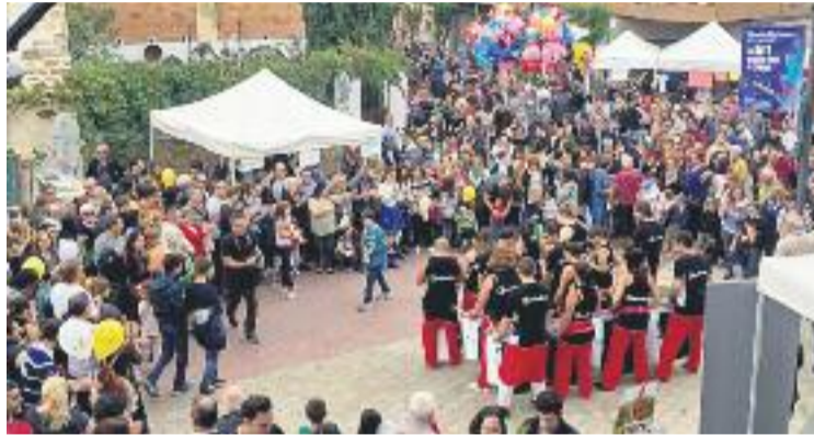
Les parades al carrer van dinamitzar les Festes de Tardor.

Diverses activitats van omplir Can Ginestar, com una xerrada-col·loqui amb el grup de joves de Sant Just Solidari que aquest estiu ha estat a Camoapa (Nicaragua), una conferència organitzada pel Centre d'Estudis Santjustencs, l'exposició del 30è aniversari de l'Agrupació Sardanista, o la diada castellera.