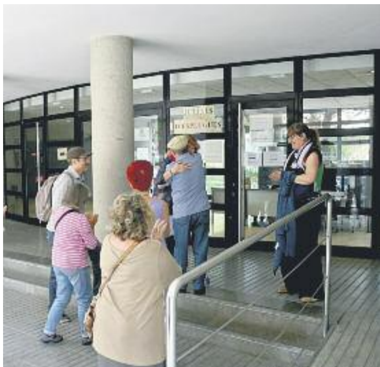
La María, emocionada després de sortir de declarar.