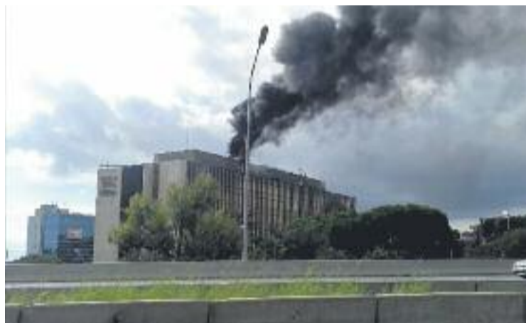
La densa columna de fum es podia veure des de lluny.

SUCCESSOS ▶ Set dotacions dels bombers van mobilitzar-se per extingir un aparatós incendi que va tenir lloc la setmana passada a la fàbrica Nestlé. Tot i que no es van haver de lamentar ferits, els bombers van decidir evacuar prop d'un miler de treballadors de les oficines per precaució.