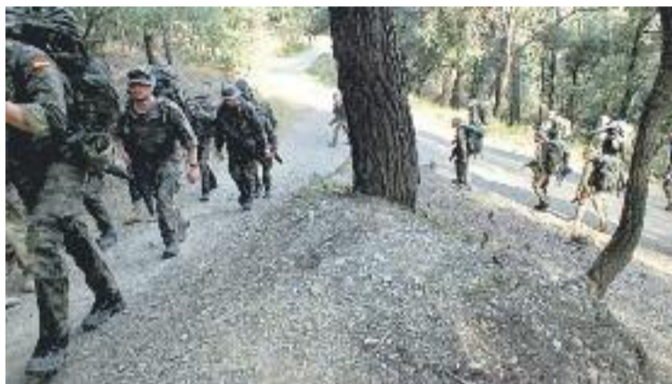
Militars marxant per camins del parc de Collserola.

La polèmica va sorgir arran de la moció presentada per la CUP i que va aprovar l'Àrea Metropolitana, que demana al Consorci del Parc Natural de la Serra de Collserola i al Govern que impulsin mesures per "fer