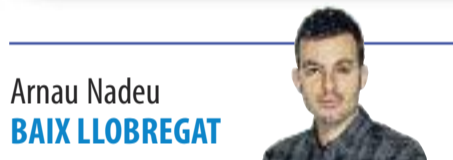
BAIX LLOBREGAT

“Convocarem els ciutadans a les urnes perquè permetin, amb el seu vot, la proclamació de la independència”. Aquestes paraules del president de la Generalitat, Carles Puigdemont, resumeixen el nou full de ruta pactat entre Junts pel Sí (JxSí) i la CUP per poder culminar, diuen, el procés independentista amb èxit. I això passa, segons la resolució que ha aprovat el Parlament –i que el PP ja ha portat al TC–, per un referèndum a la tardor de l'any que ve i unes eleccions constituents al 2018.