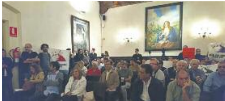
La sala de Plens, a vessar.

Una de les principals demandes dels opositors, aplegats al voltant de la plataforma No al Pla Caufec, és celebrar una consulta ciutadana sobre aquesta qüestió. De fet,