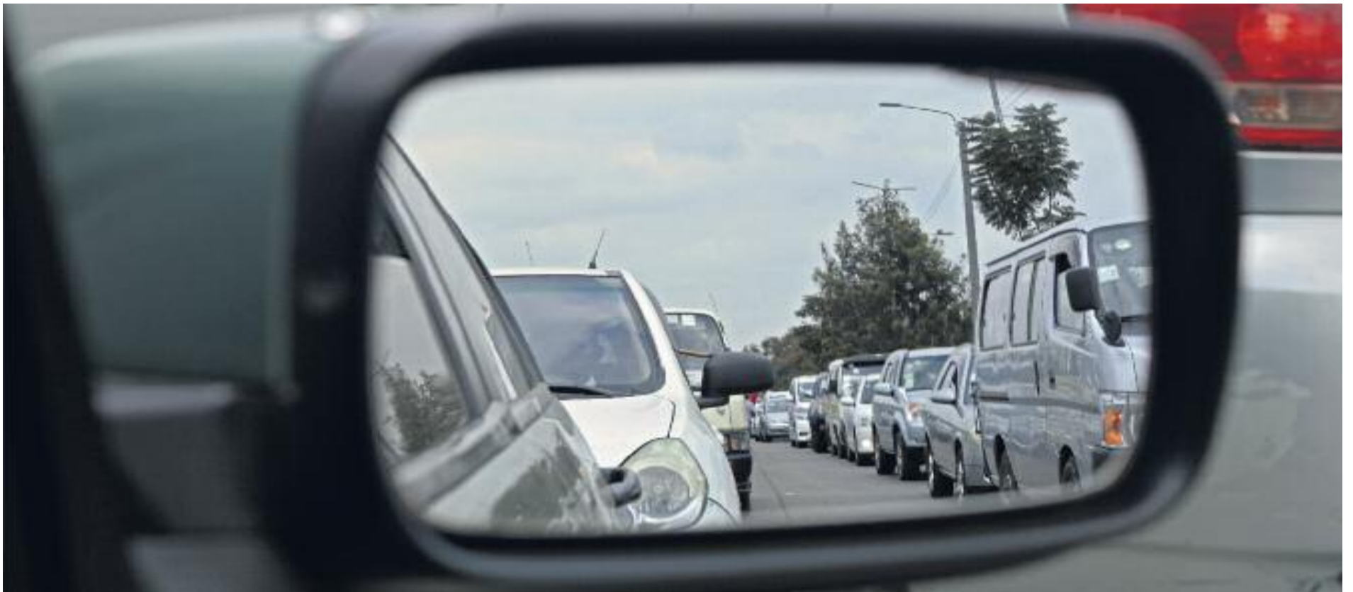
La congestió del trànsit per entrar a Barcelona agreuja el problema de la pol·lució.