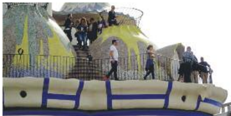
L'Open House va rebre 3.700 visites a la ciutat.

Durant els dos dies, els 3.700 visitants van poder signar el Manifest Jujol per recuperar la figura de l'arquitecte [més informació a la pàgina 10].